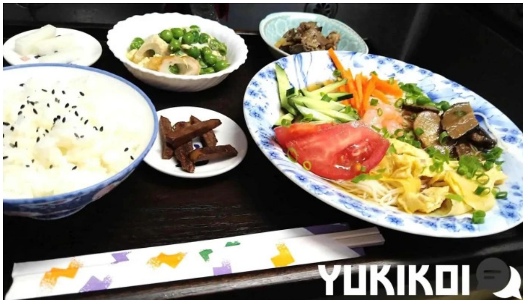
いにしえ茶屋 料理飲み物