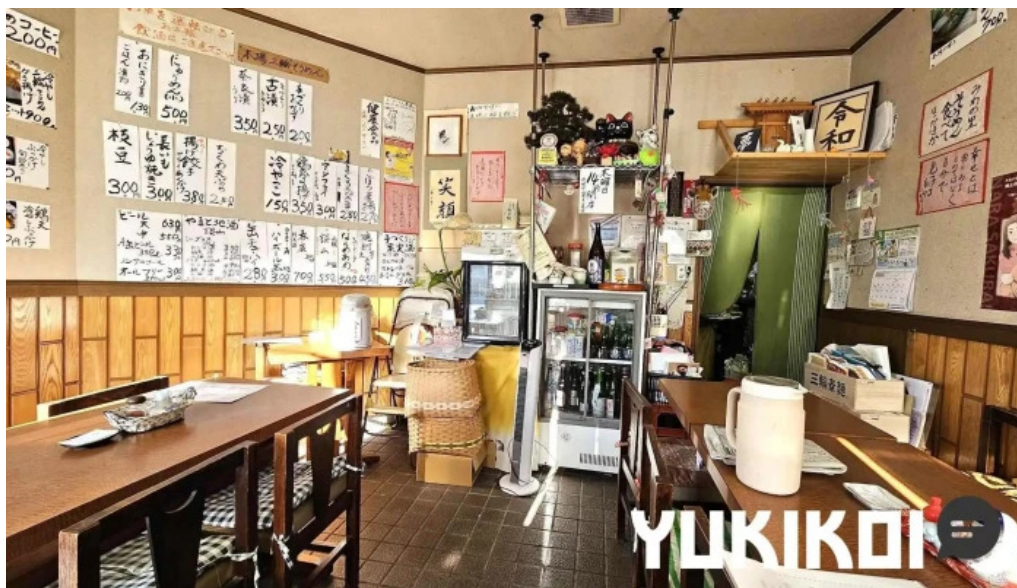
いにしえ茶屋 霧団気