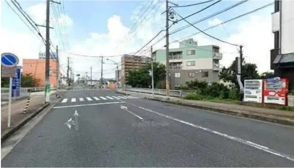
いにしえ茶屋 桜井市