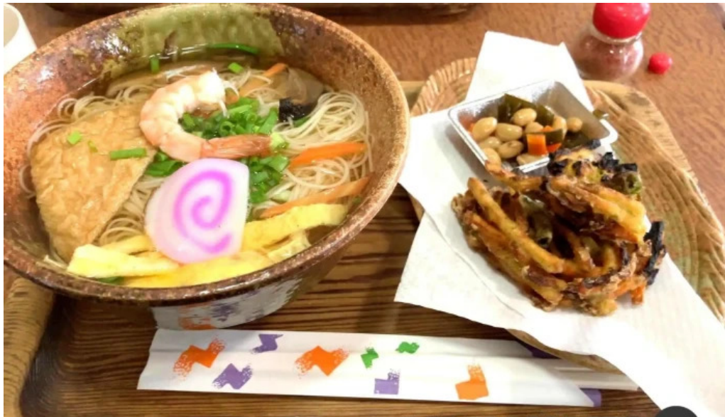
いにしえ茶屋 スープ