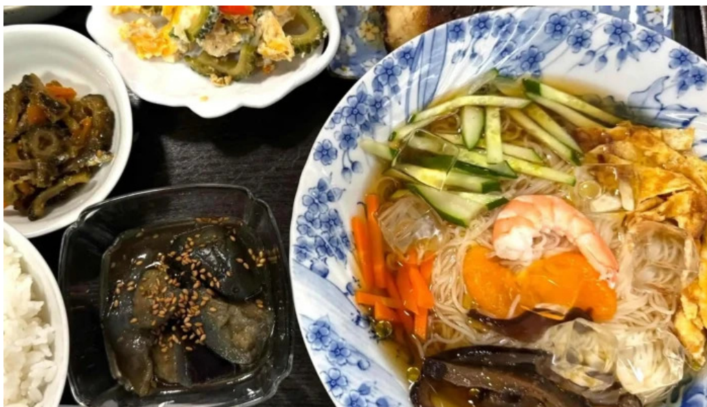
いにしえ茶屋 エリア