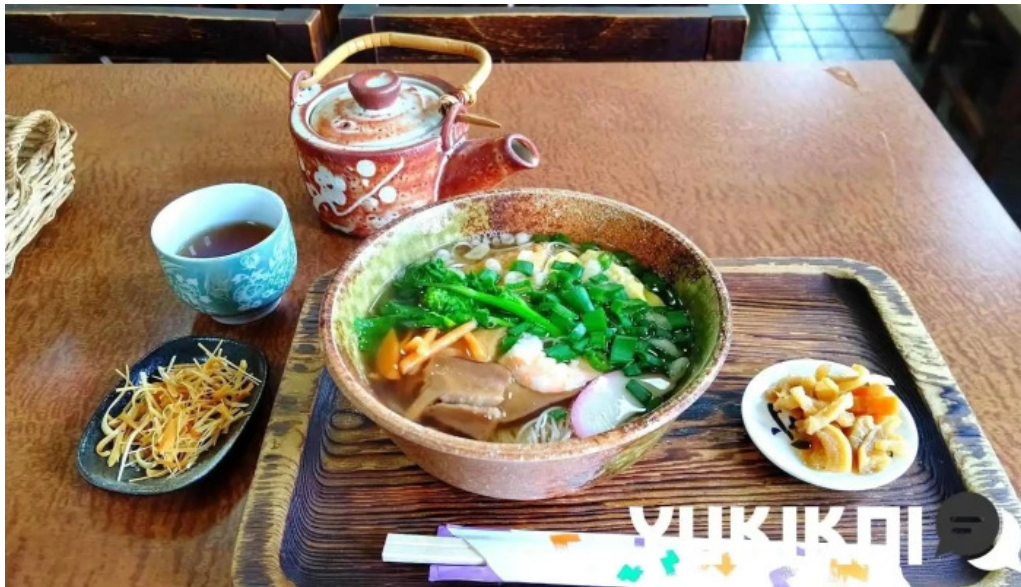
いにしえ茶屋 ラーメン