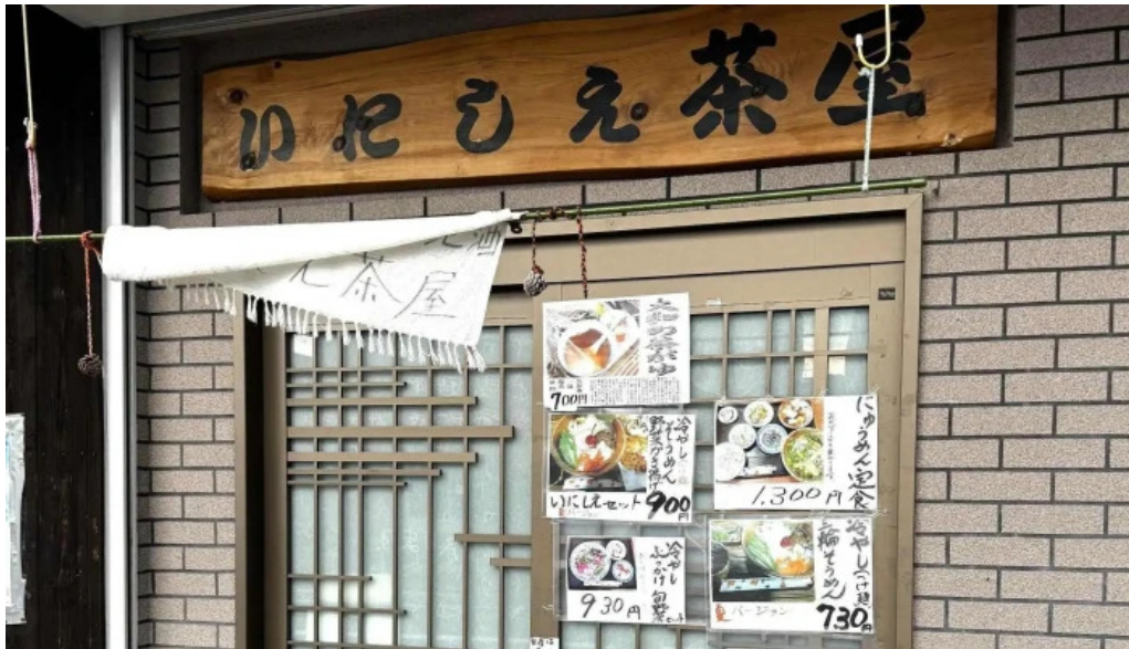
いにしえ茶屋 プロモーション