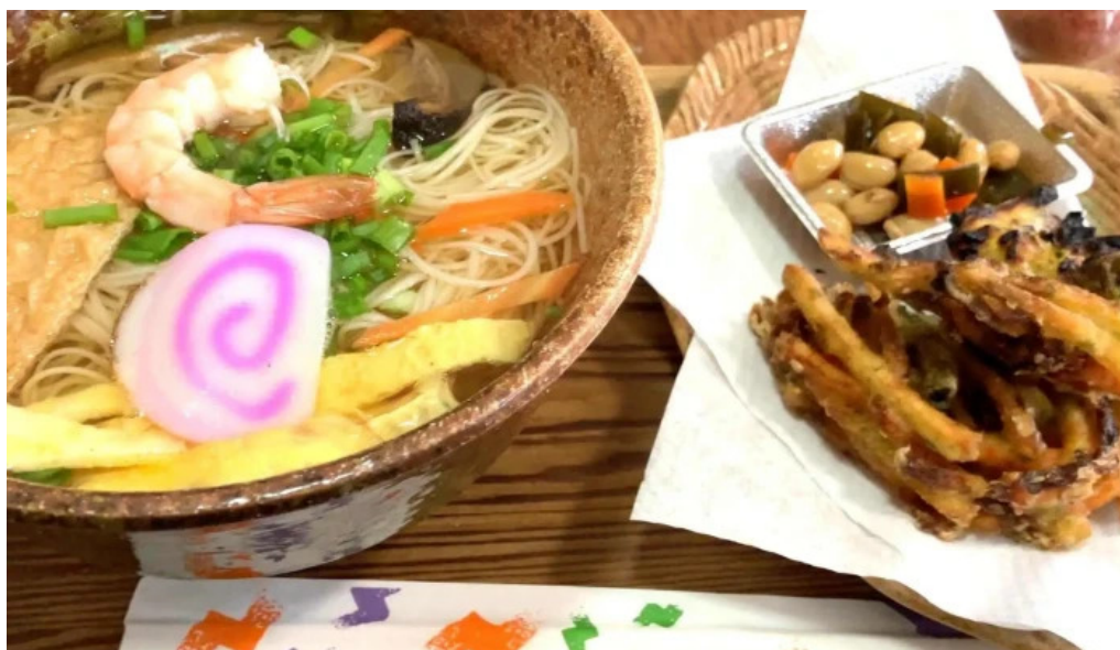
いにしえ茶屋 番号