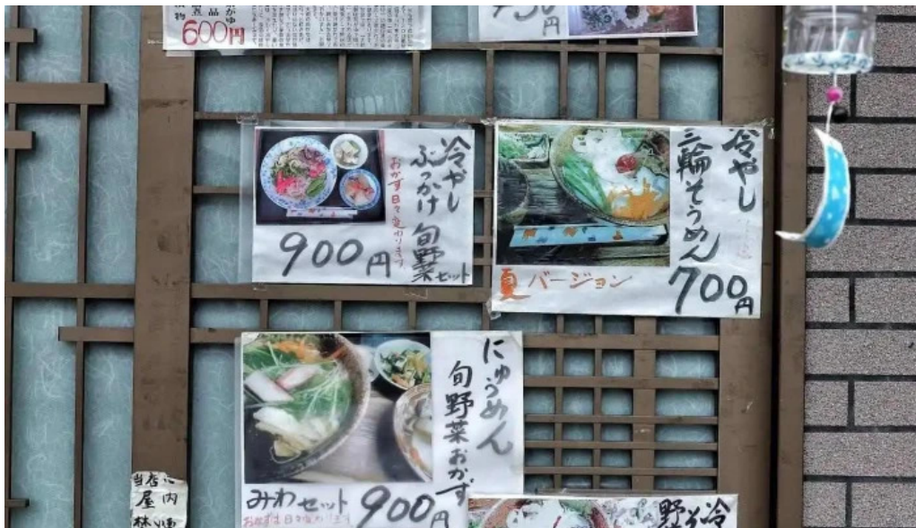
いにしえ茶屋 メニュー