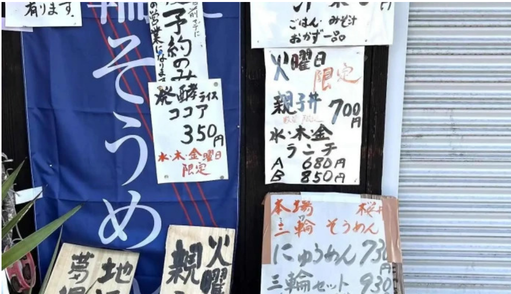
いにしえ茶屋 最新