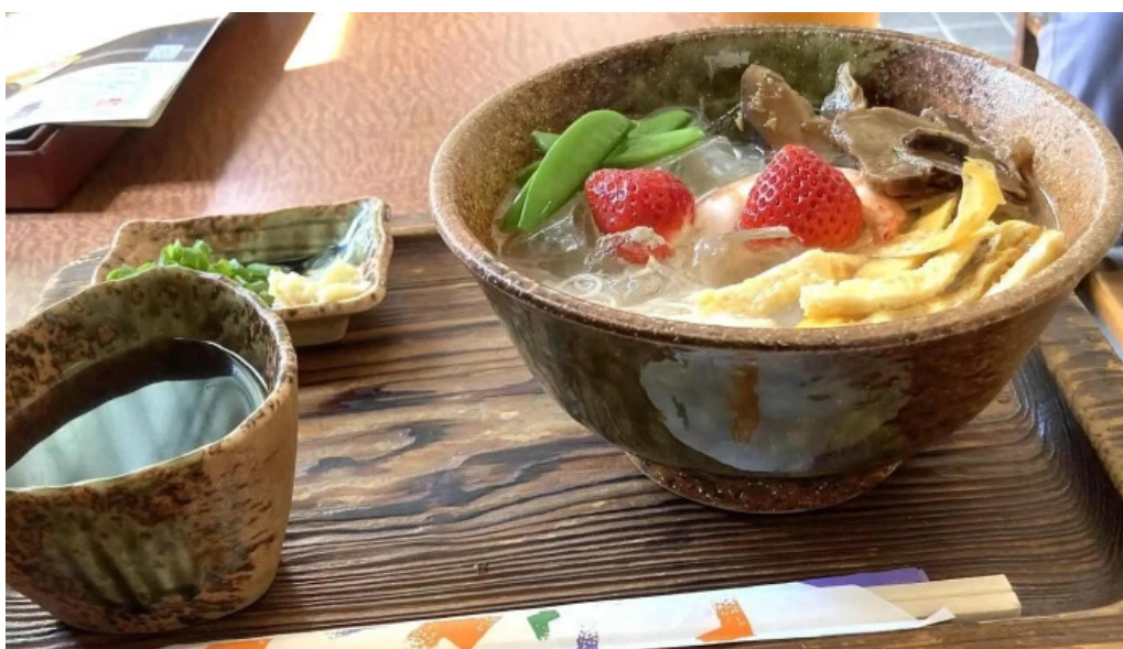
いにしえ茶屋 ウェブサイト