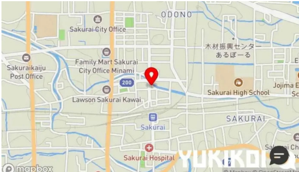
いにしえ茶屋 地図