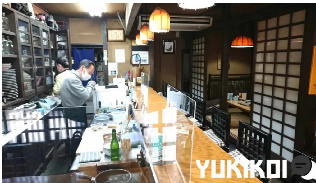
地どり割烹 とり善 霧田気