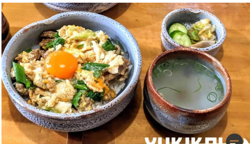
地どり割烹 とり善 料理飲み物