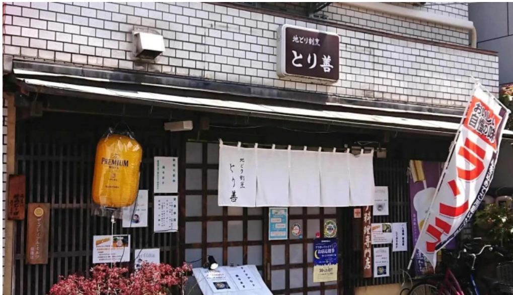
地どり割烹 とり善 動画