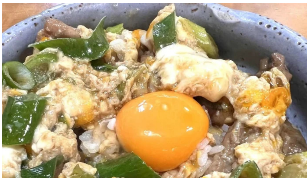
地どり割烹 とり善 近く