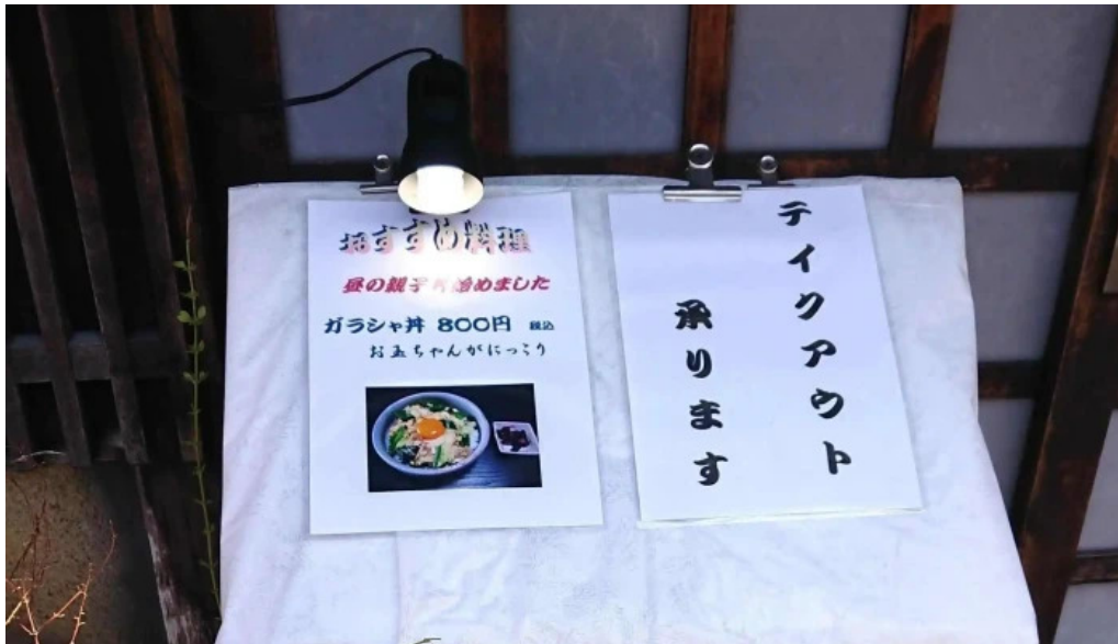
地どり割烹 とり善 写真