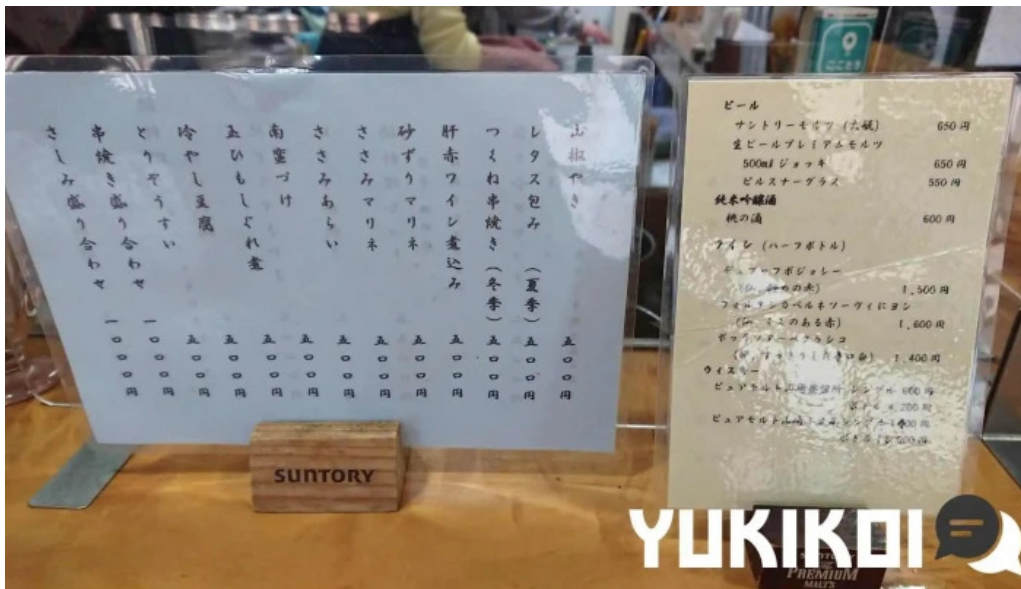
地どり割烹 とり善 メニュー