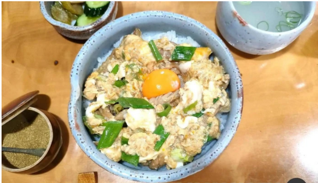
地どり割烹 とり善 丼物