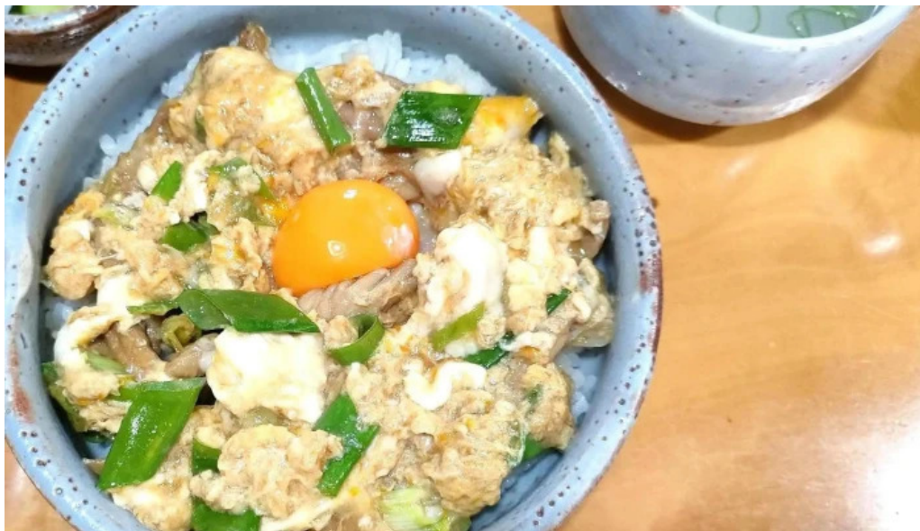
地どり割烹 とり善 instagram