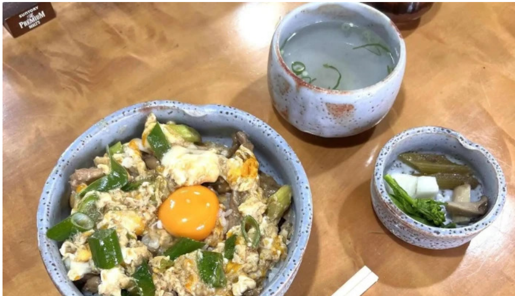
地どり割烹 とり善 エリア