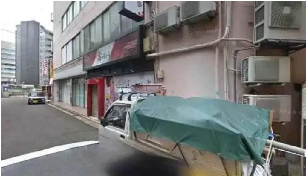
宮崎地鶏専門店 鳥将軍 枚方駅前店 枚方市