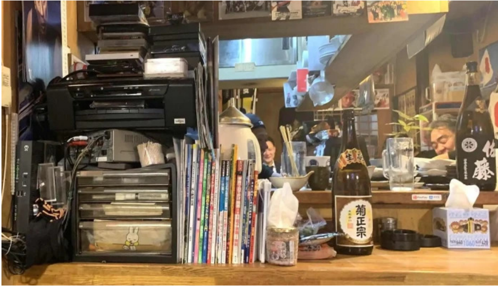
宮崎地鶏専門店 鳥将軍 枚方駅前店 割引