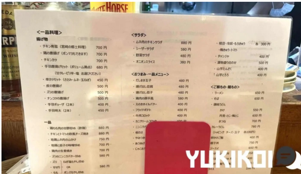
宮崎地鶏専門店 鳥將軍 枚方駅前店 メニュー