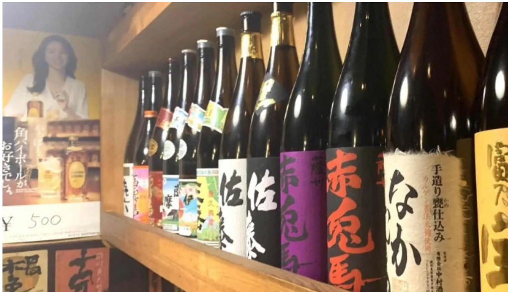
宮崎地鶏専門店 鳥將軍 枚方駅前店 コメント