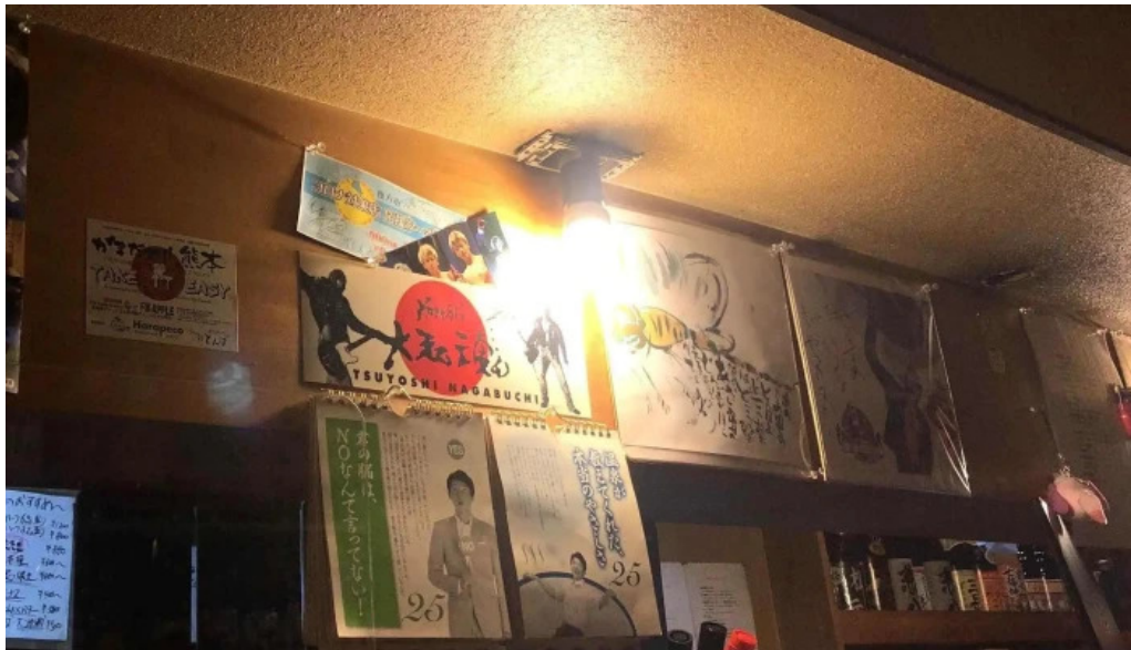
宮崎地鶏専門店 鳥将軍 枚方駅前店 近く