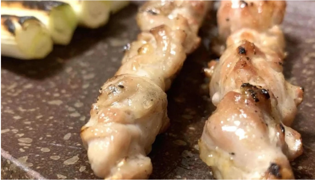
宮崎地鶏専門店 鳥将軍 枚方駅前店 口コミ