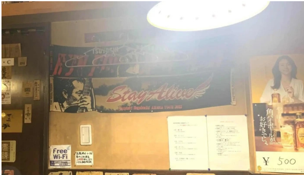
宮崎地鶏専門店 鳥將軍 枚方駅前店 写真