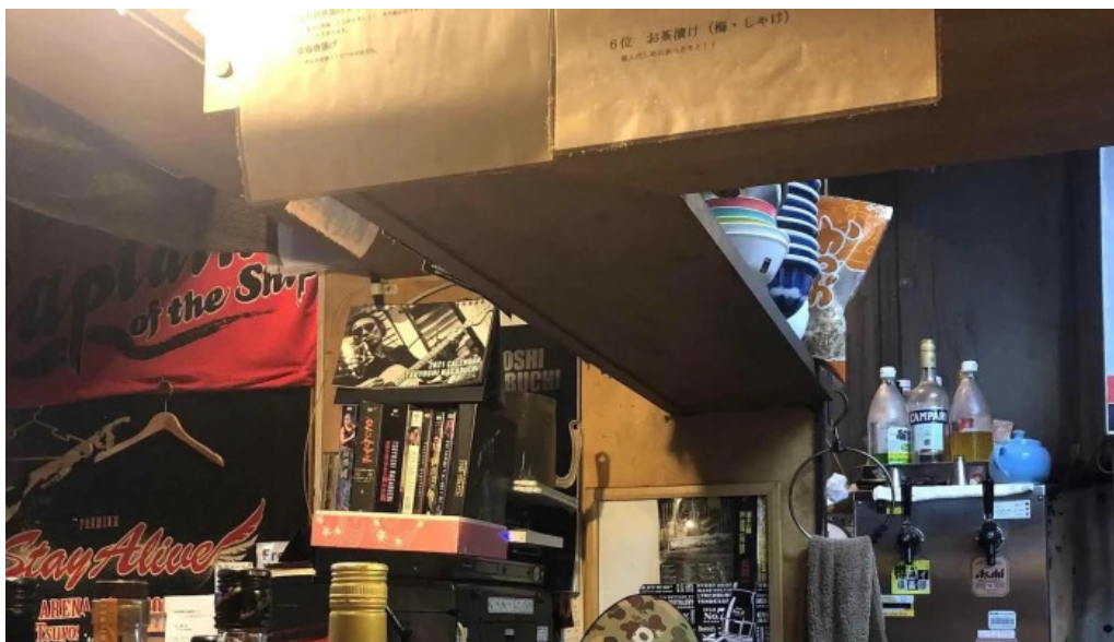
宮崎地鶏専門店 鳥將軍 枚方駅前店 電話