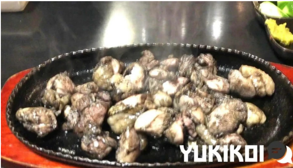
宮崎地鶏専門店 鳥将軍 枚方駅前店 動画