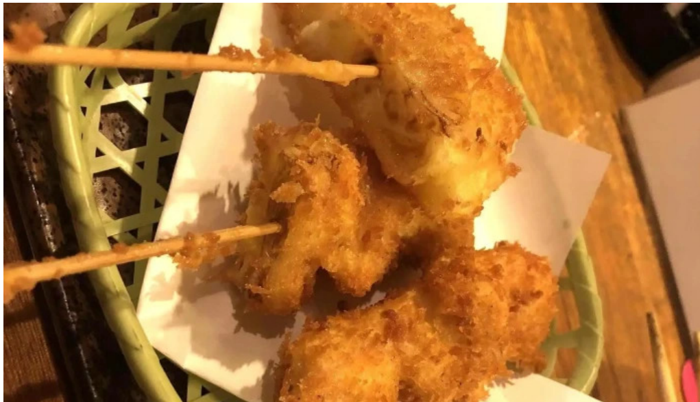
宮崎地鶏専門店 鳥將軍 枚方駅前店 カタログ