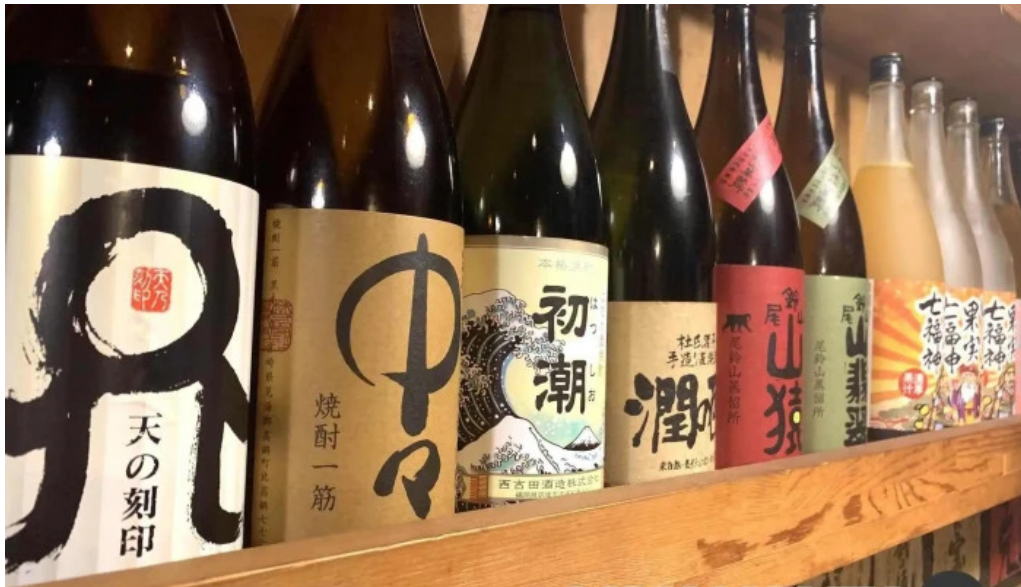
宮崎地鶏専門店 鳥将軍 枚方駅前店 料理飲み物