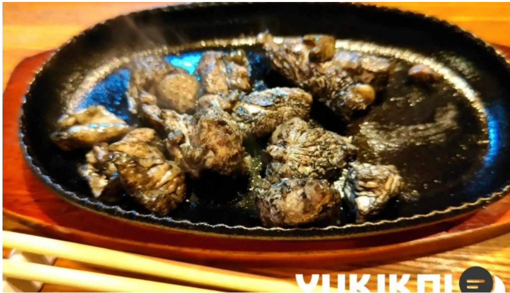
宮崎地鶏専門店 鳥将軍 枚方駅前店 焼き鳥