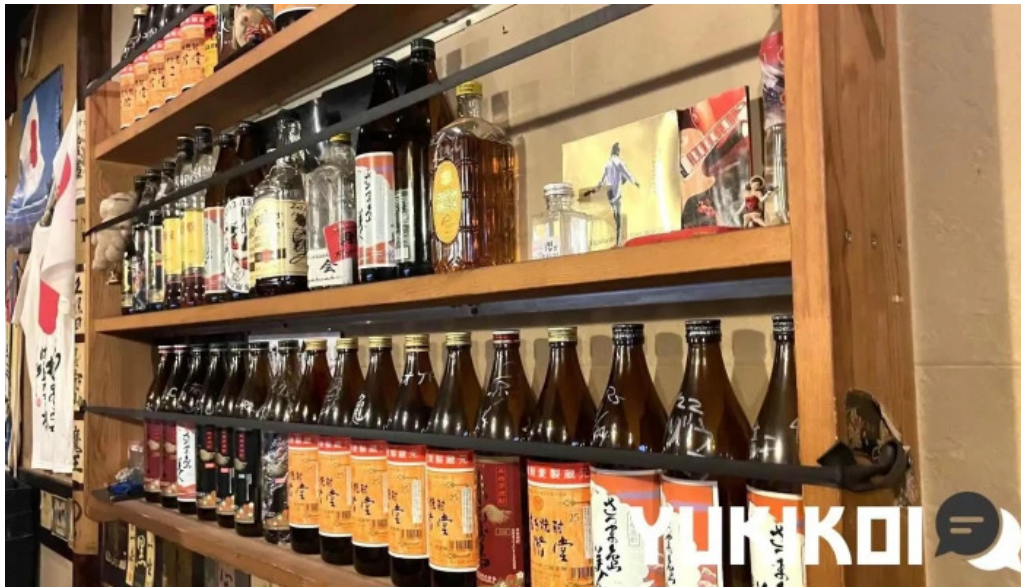
宮崎地鶏専門店 鳥将軍 枚方駅前店 雰囲気