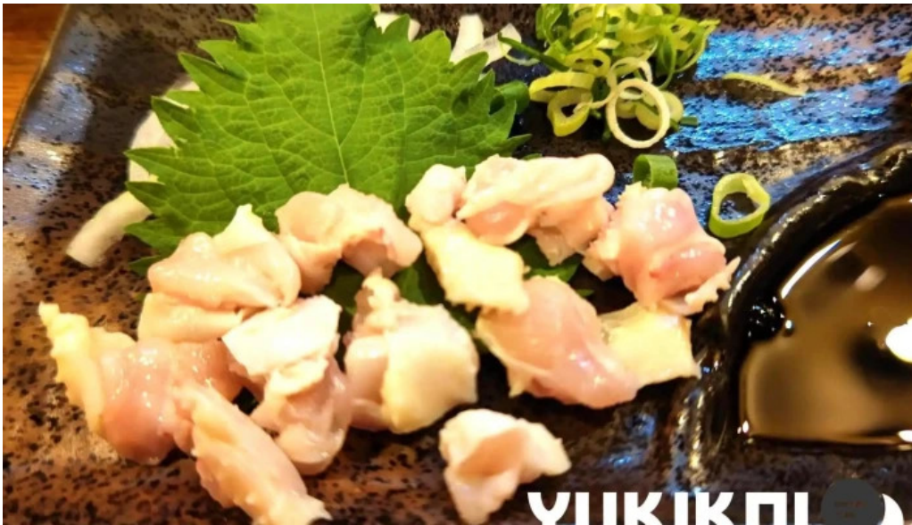
宮崎地鶏専門店 鳥将軍 枚方駅前店 刺身