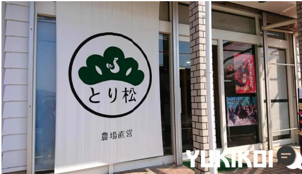
とり松 オーナー提供