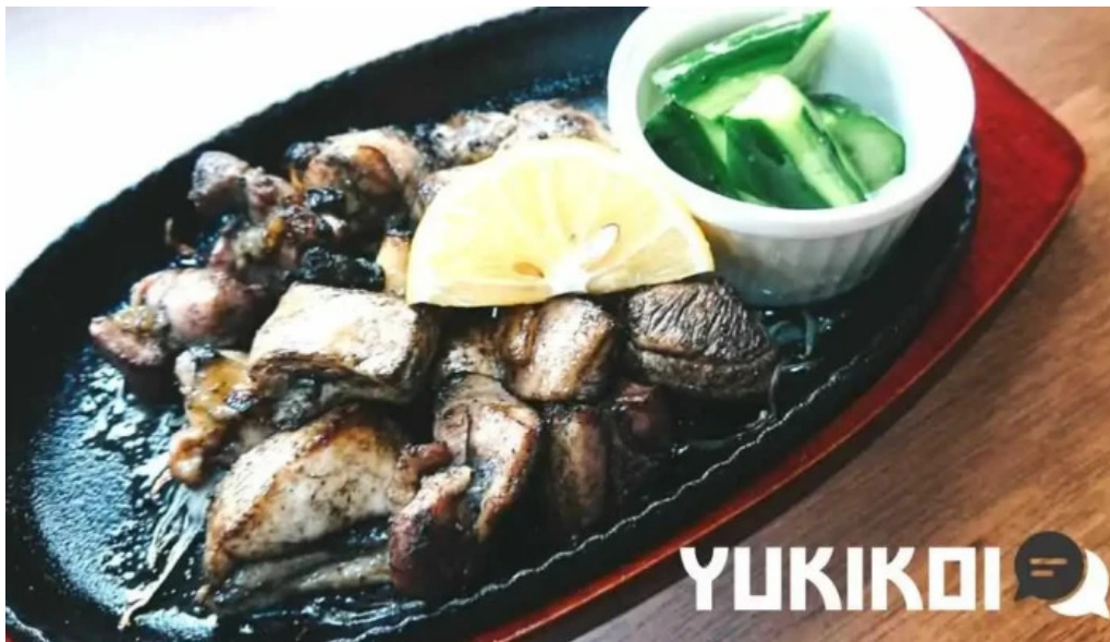
とり松 料理飲み物