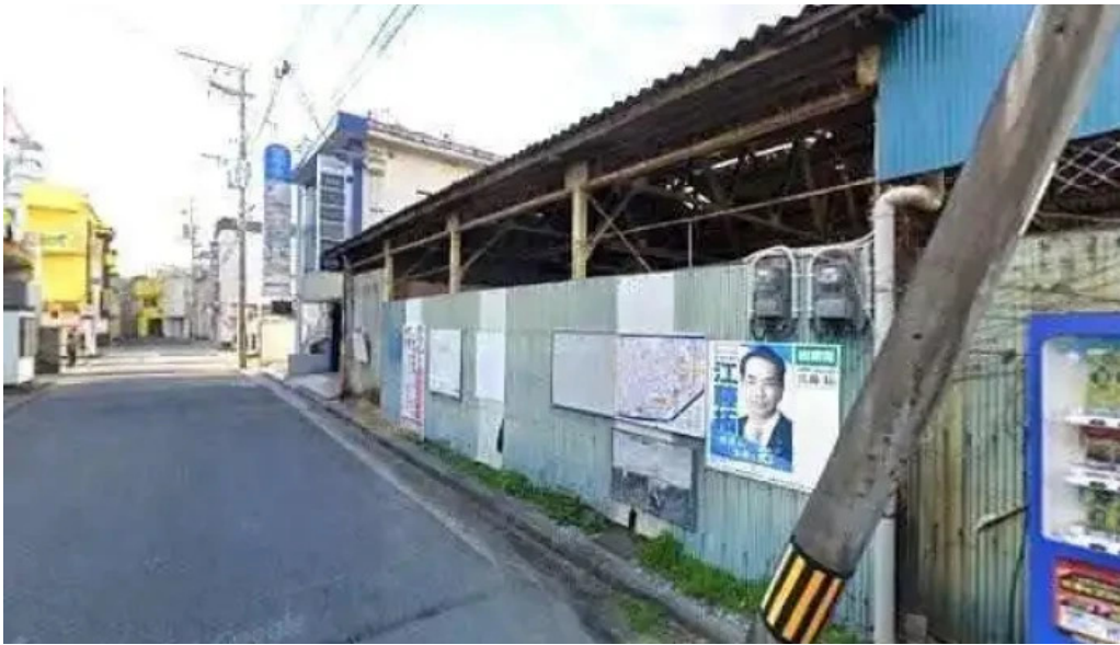
炭火烧 司 延岡市