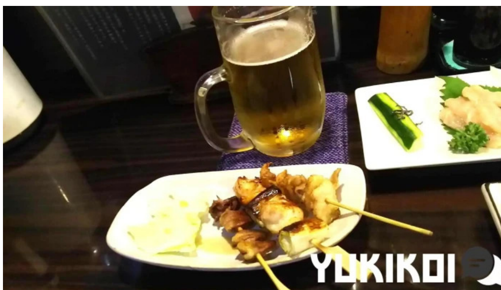
炭火烧 司 料理飲み物