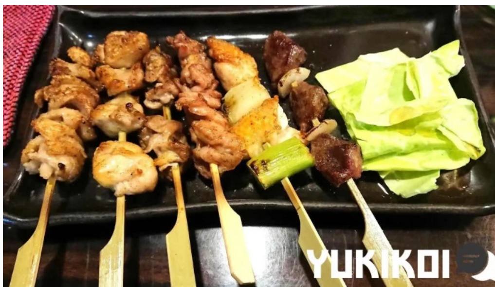
炭火烧 司 焼き鳥