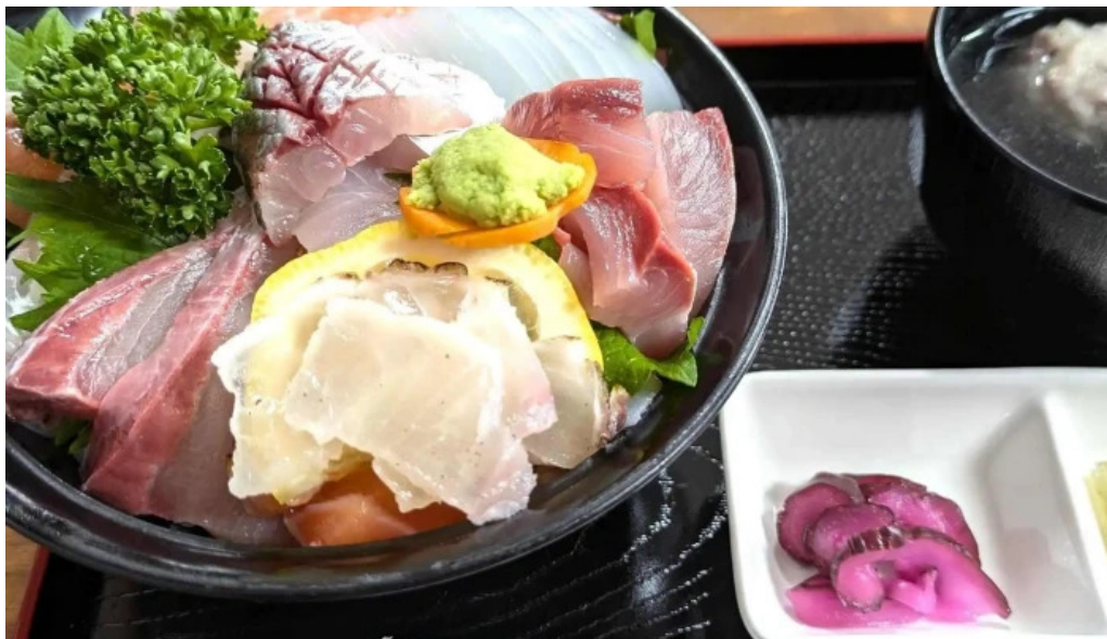
お魚のなかだ comentario 9