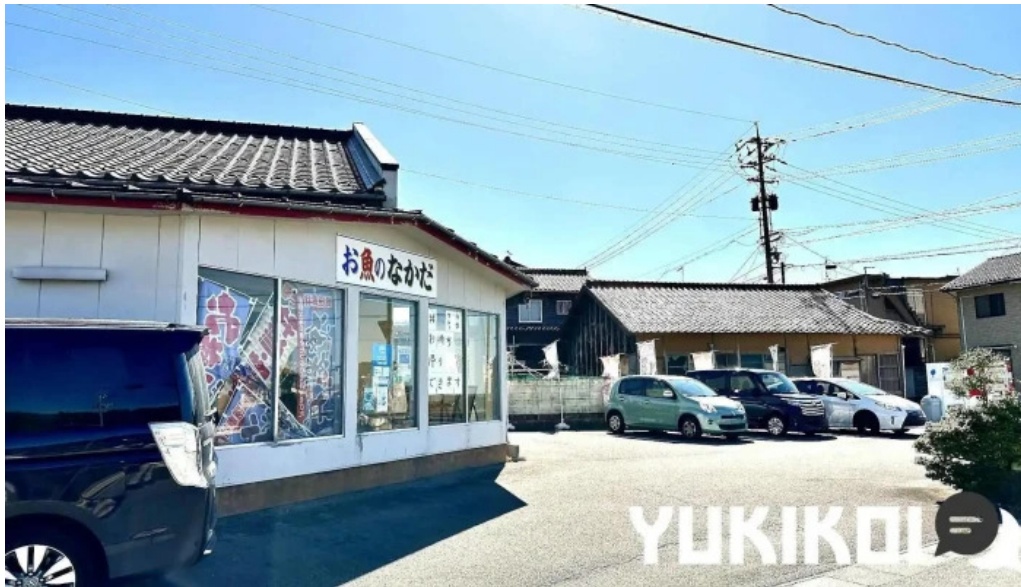
お魚のなかだ 浜田市