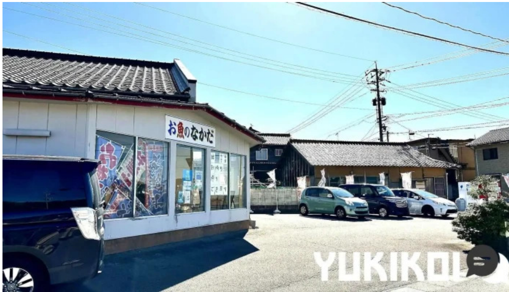
お魚のなかだ すべて