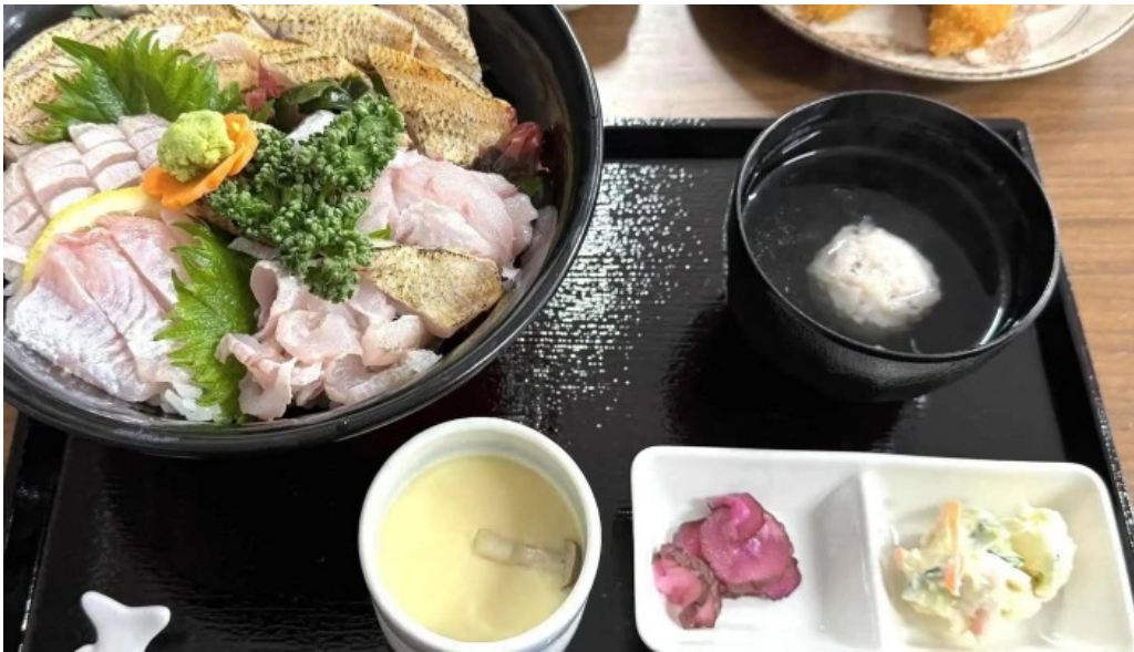
お魚のなかだ comentario 5