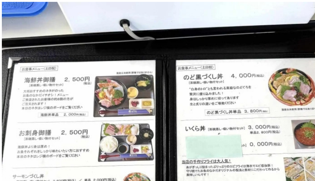
お魚のなかだ comentario 4