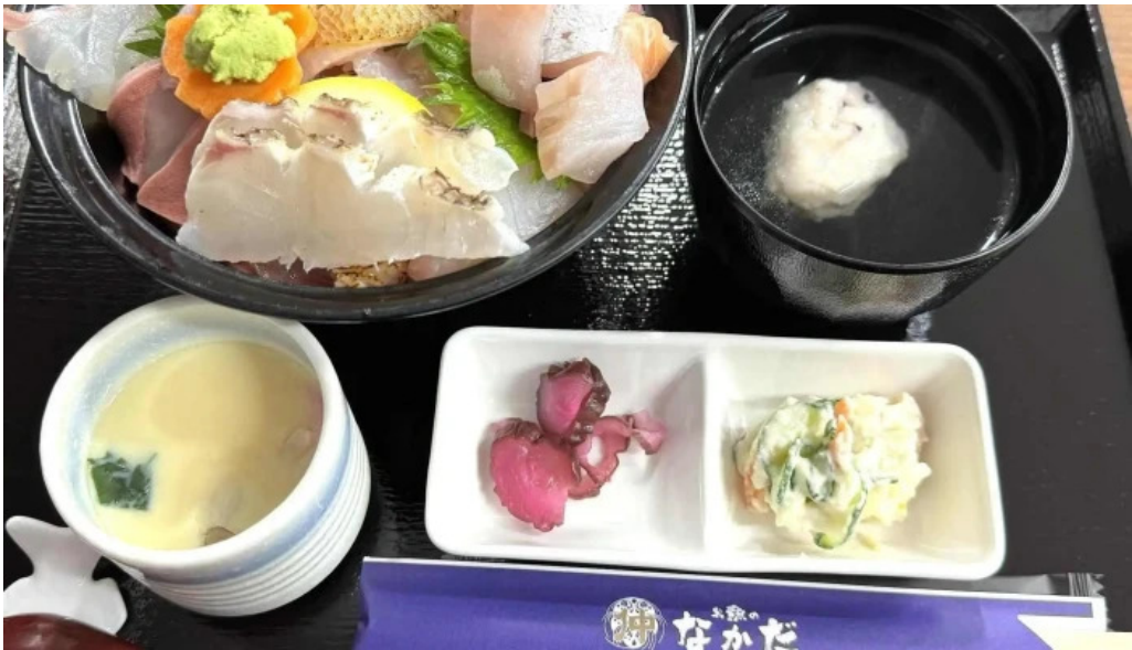
お魚のなかだ comentario 7