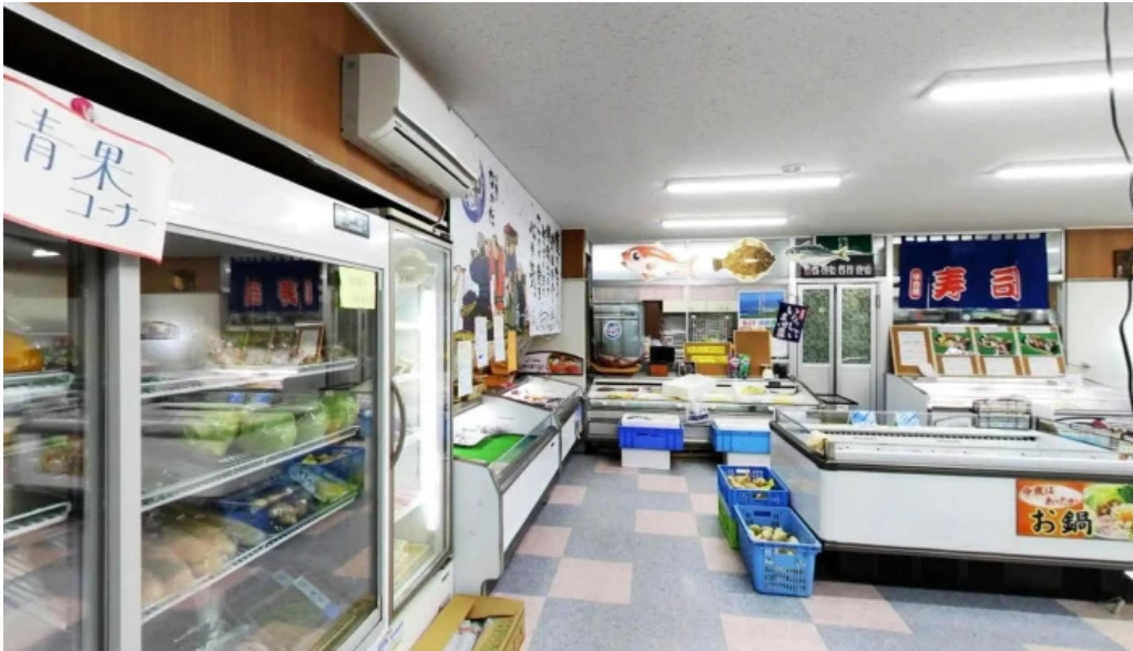
お魚のなかだ ストリートビューと 360 ビュー