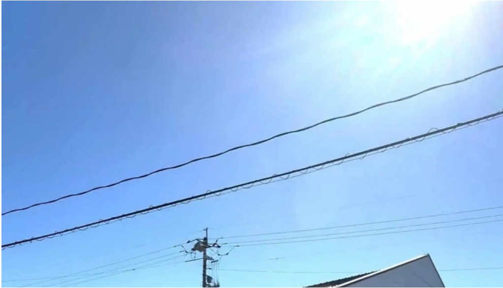
お魚のなかだ comentario 2