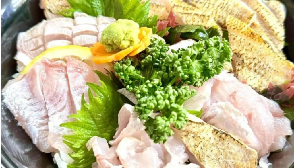
お魚のなかだ comentario 6