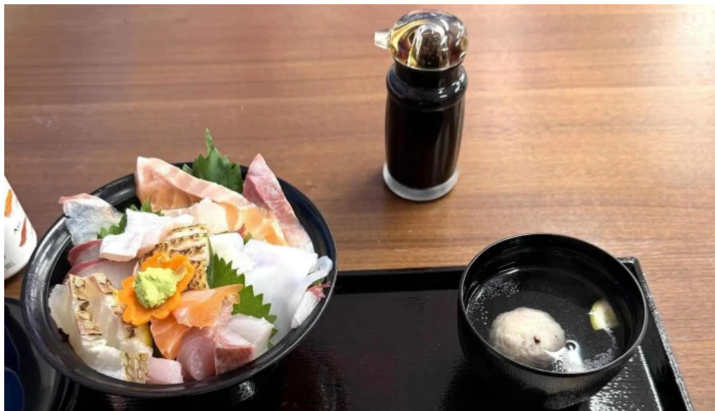
お魚のなかだ comentario 3