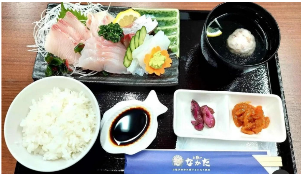
お魚のなかだ 最新