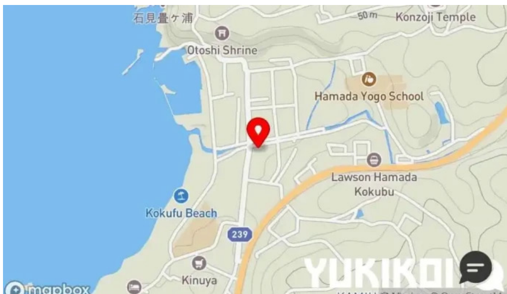
お魚のなかだ地図