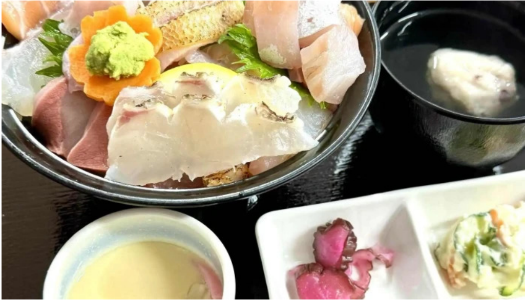
お魚のなかだ comentario 8