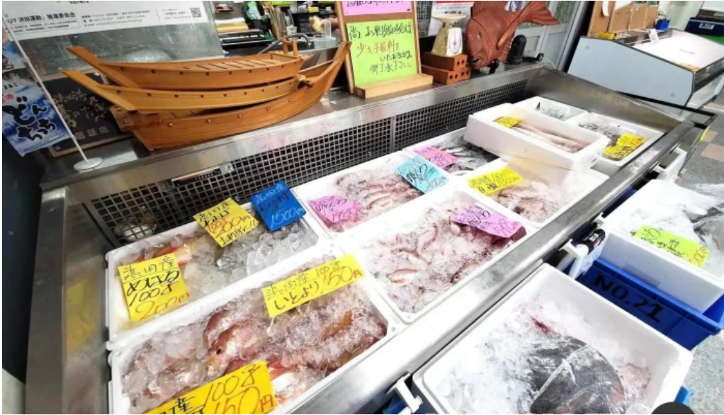
お魚のなかだ 屋内