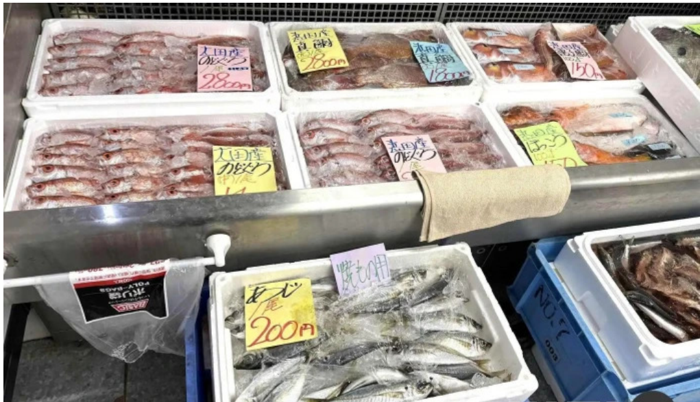
お魚のなかだ シーフード