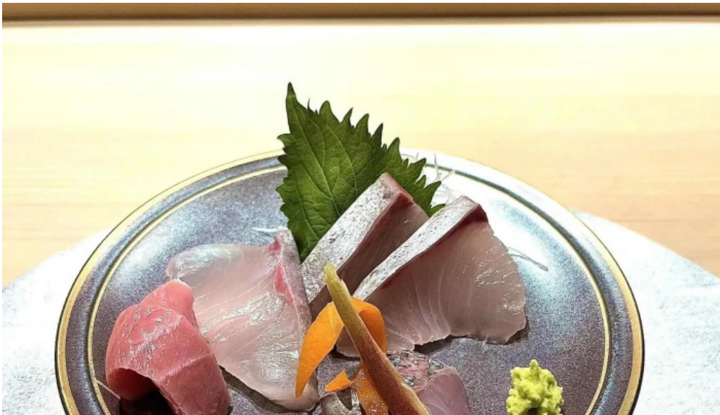
日本料理濡つくし 営業中