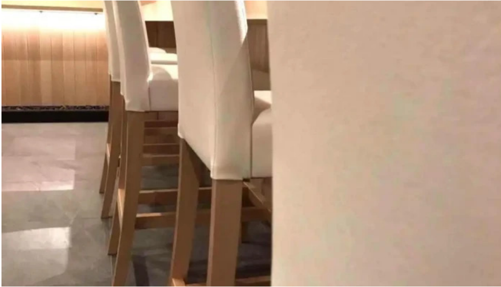
日本料理 濡つくし 雰囲気