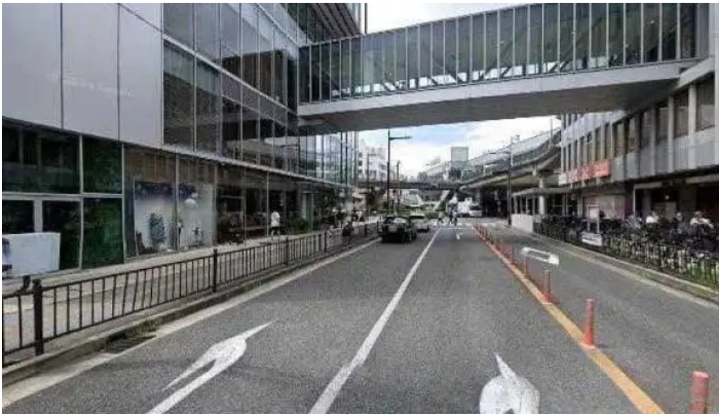
日本料理 濡つくし 枚方市