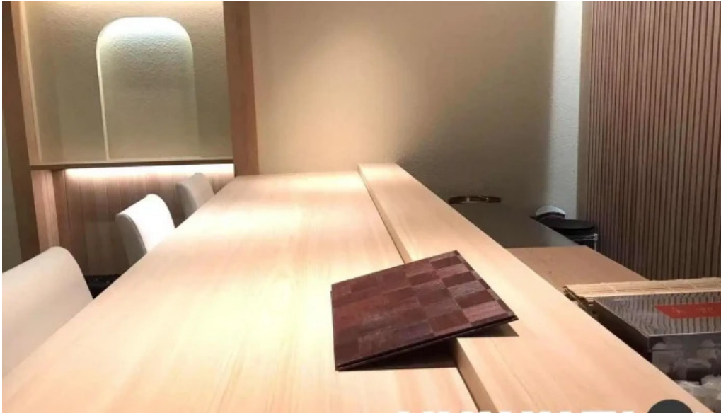
日本料理瀧つくし