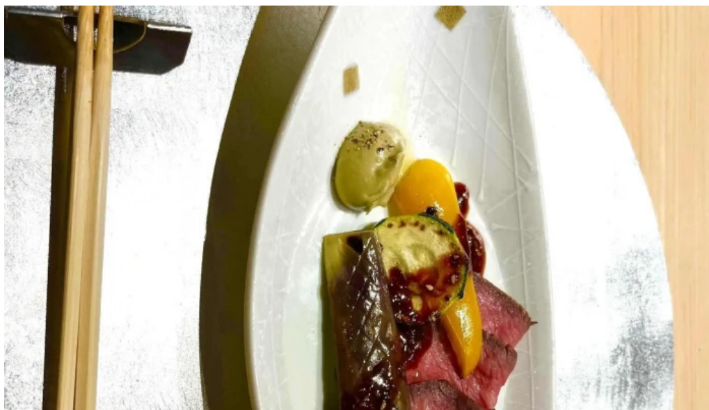
日本料理漣つくし 電話