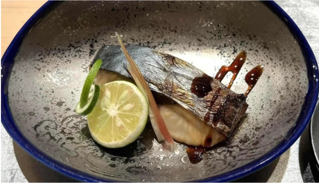
日本料理濡つくし 営業時間