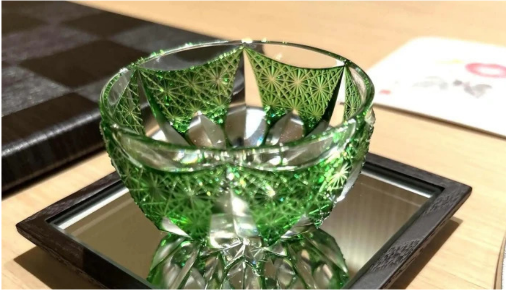
日本料理瀧つくし 写真