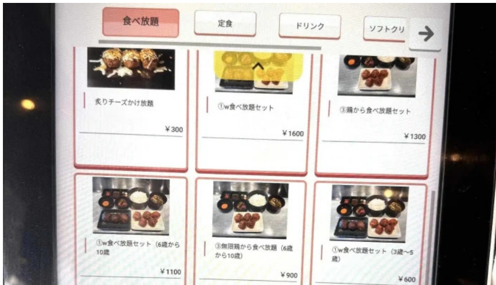
鉄板本舗 無限ハンバーグ専門店in糸島 スコア