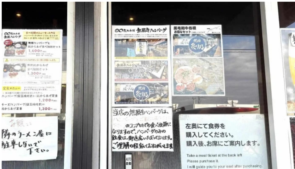
鉄板本舗 無限ハンバーグ専門店in糸島 instagram