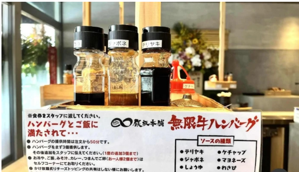
鉄板本舗 無限ハンバーグ専門店in糸島 メニュー