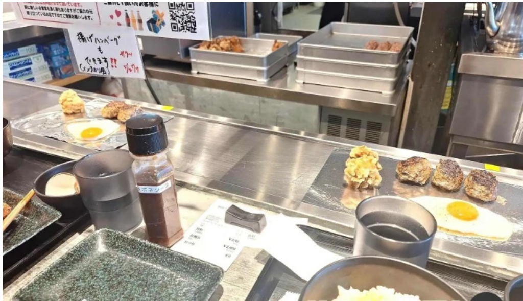
鉄板本舗 無限ハンバーグ専門店in糸島 料理飲み物