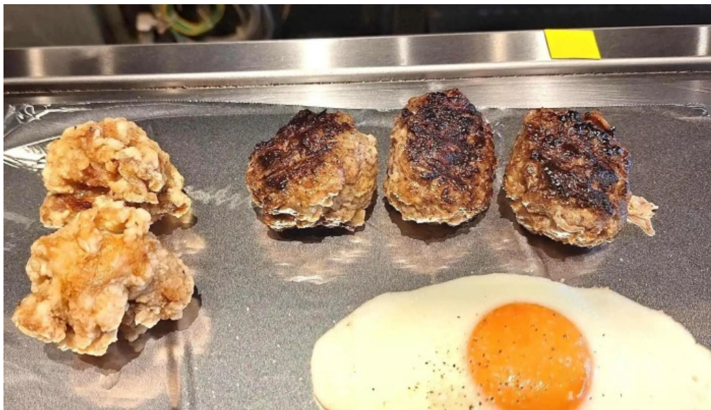
鉄板本舗 無限ハンバーグ専門店in糸島 動画