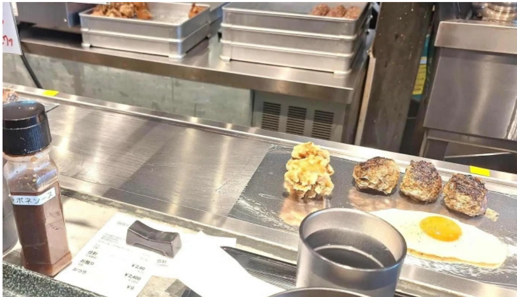
鉄板本舗 無限ハンバーグ専門店in糸島 行き方