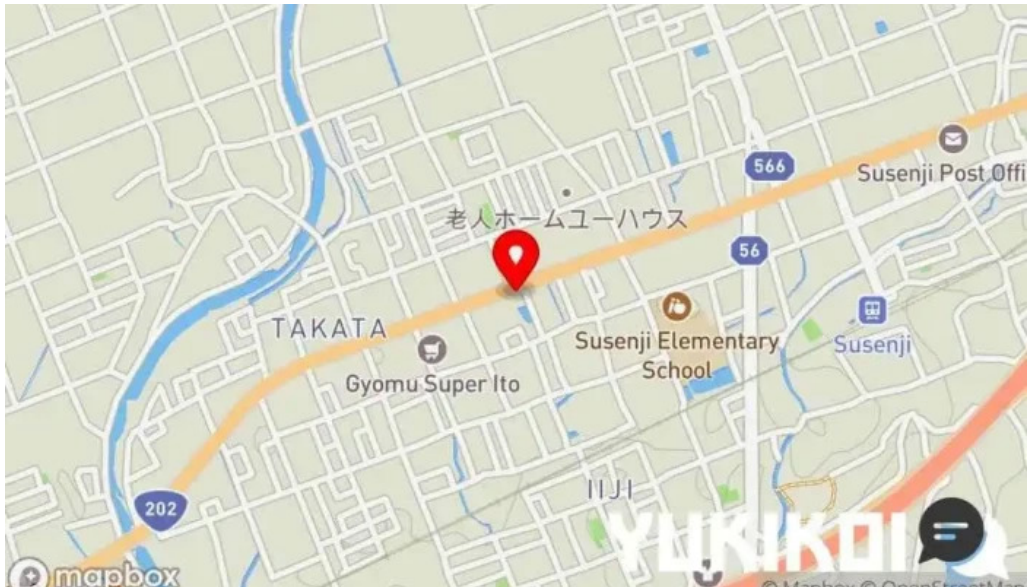
鉄板本舗 無限ハンバーグ専門店in糸島 地図