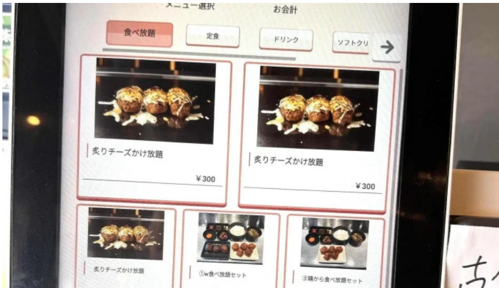
鉄板本舗 無限ハンバーグ専門店in糸島 エリア