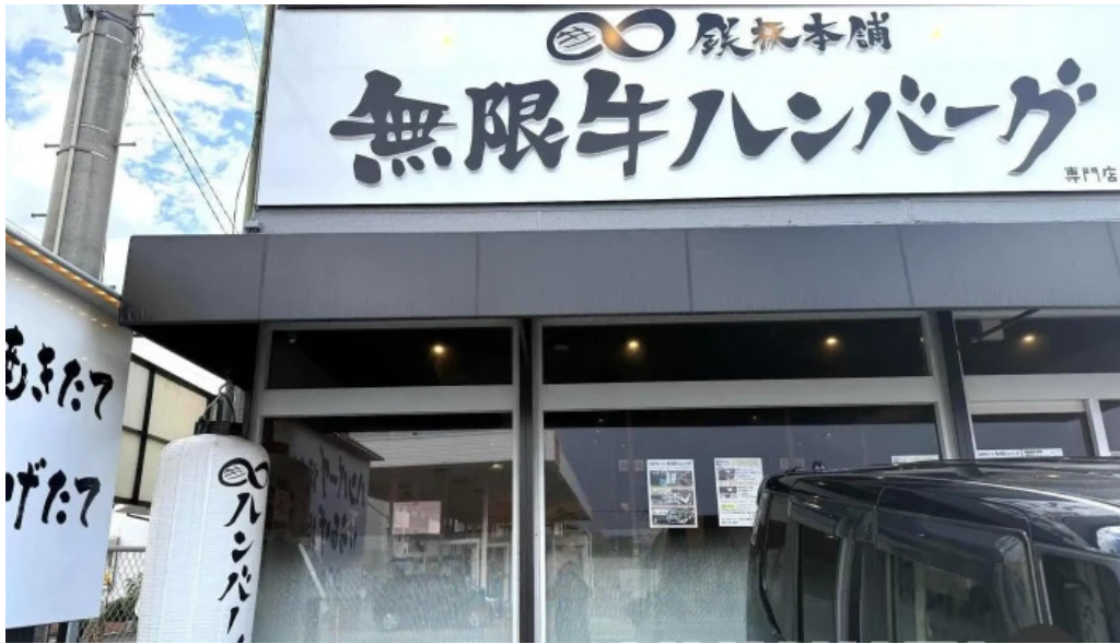
鉄板本舗 無限ハンバーグ専門店in糸島 最新