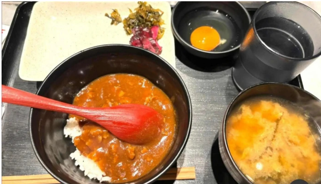
鉄板本舗 無限ハンバーグ専門店in糸島 カレー