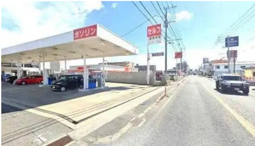
鉄板本舗 無限ハンバーグ専門店in糸島 糸島市