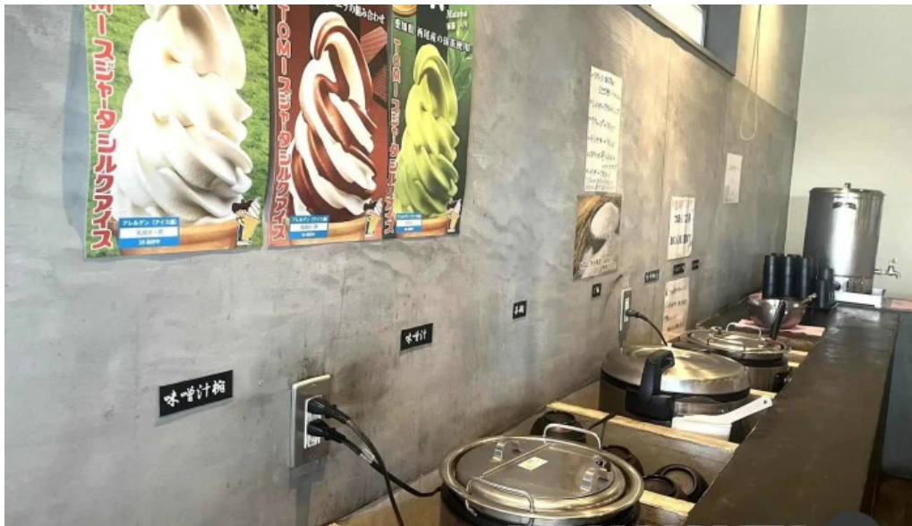
鉄板本舗 無限ハンバーグ専門店in糸島 雰囲気