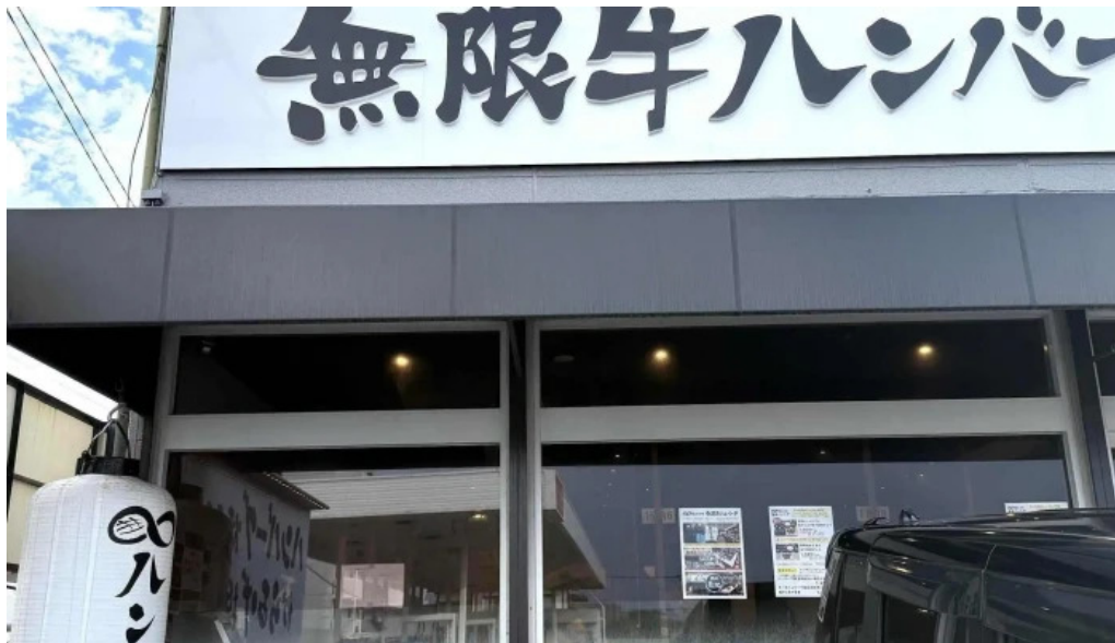
鉄板本舗 無限ハンバーグ専門店in糸島 コメント