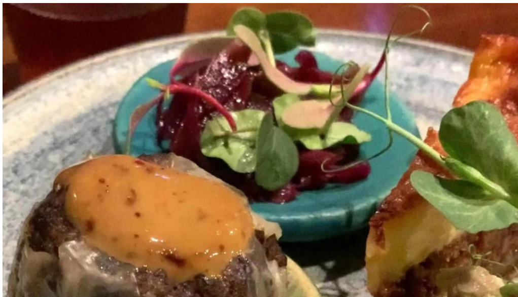
鉄板焼き hisui201 どこ