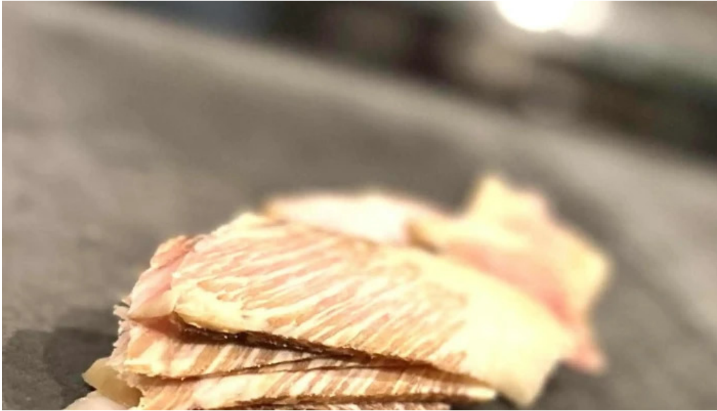
鉄板焼き hisui201 営業中