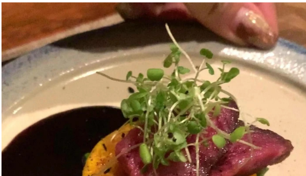
鉄板焼き hisui201 電話