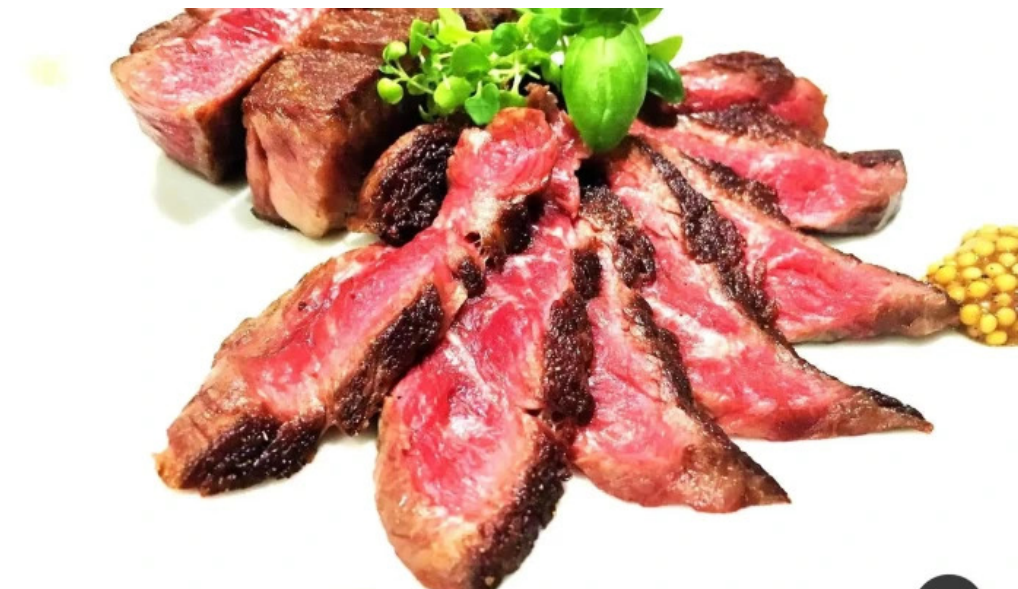
鉄板焼き hisui201 オーナー提供