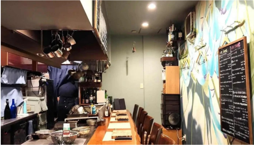
鉄板焼き hisui201 雰囲気