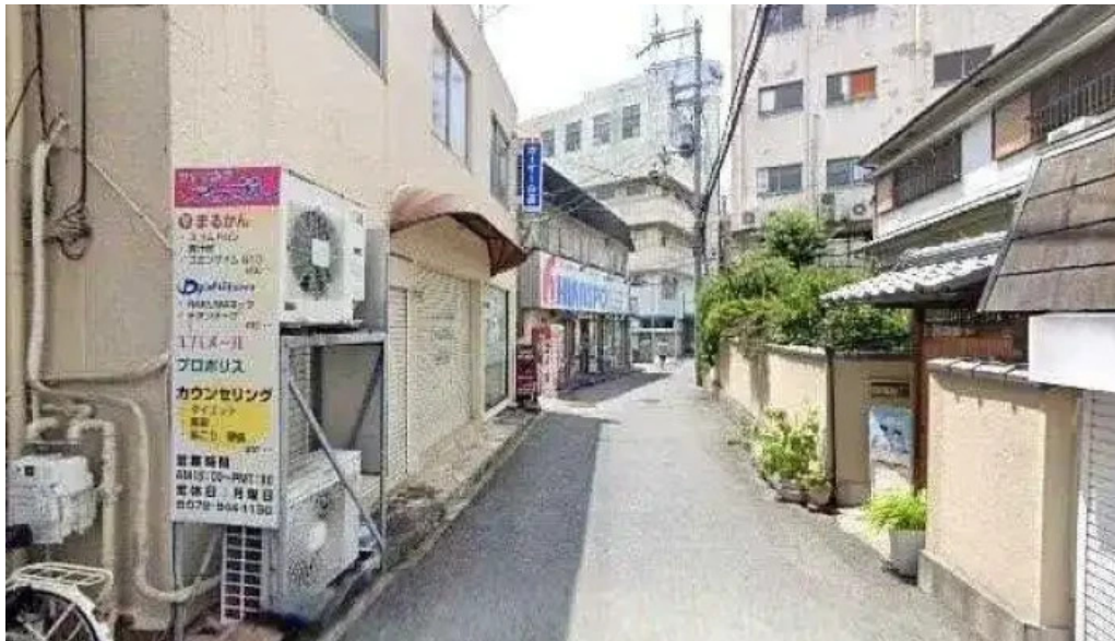
鉄板焼き hisui201 枚方市