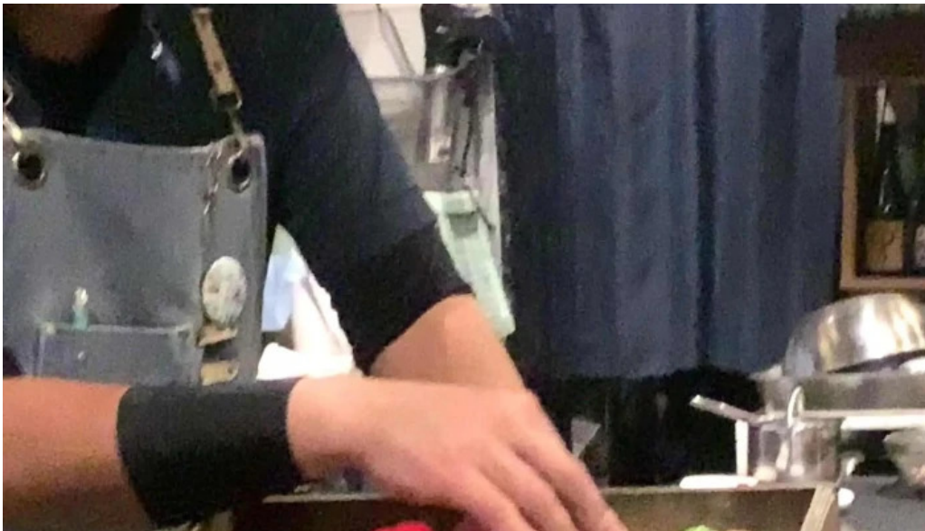
鉄板焼き hisui201 口コミ