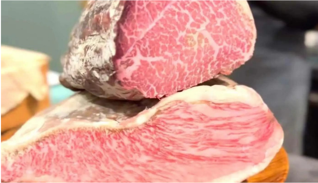
鉄板焼き hisui201 動画