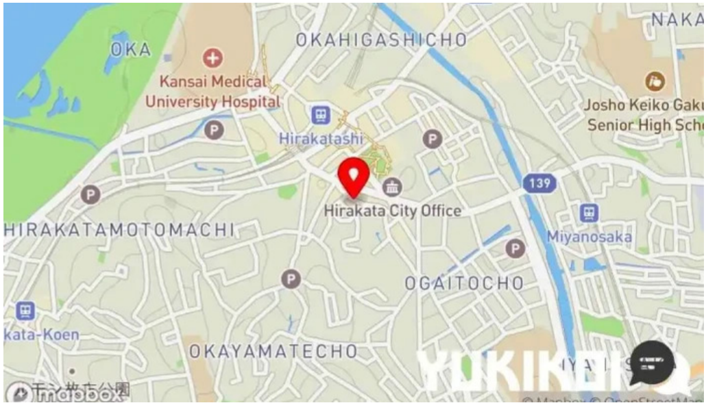
鉄板焼き hisui201 地図