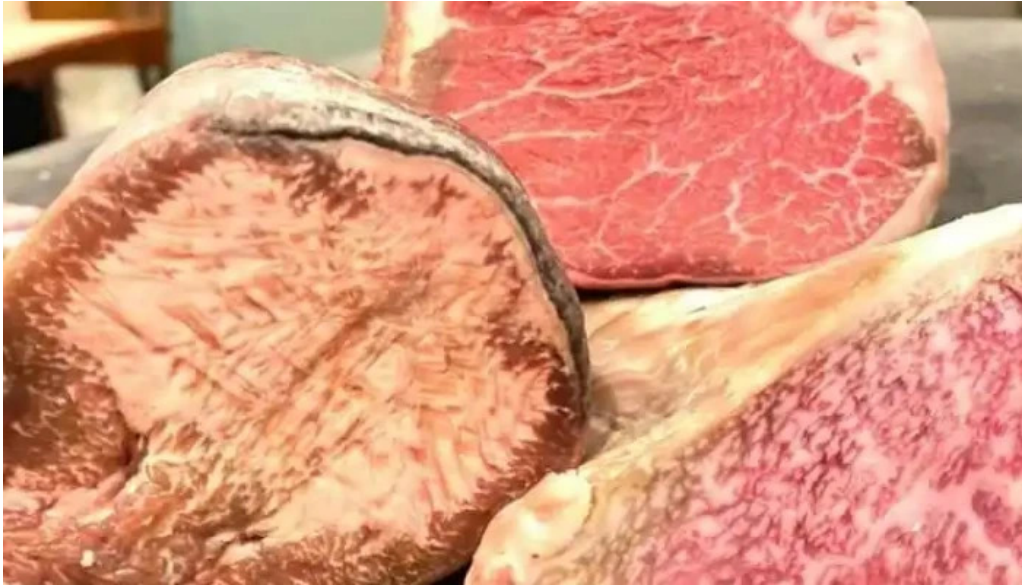
鉄板焼き hisui201 神戸ビーフ