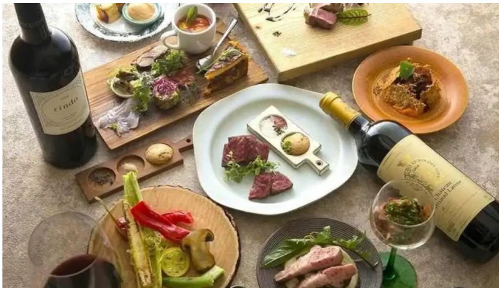
鉄板焼き hisui201 料理飲み物