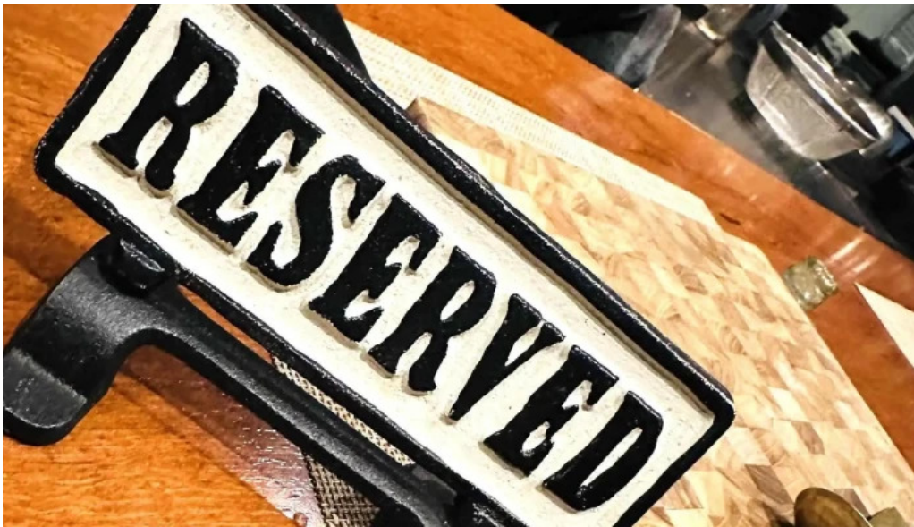
鉄板焼き hisui201 行き方