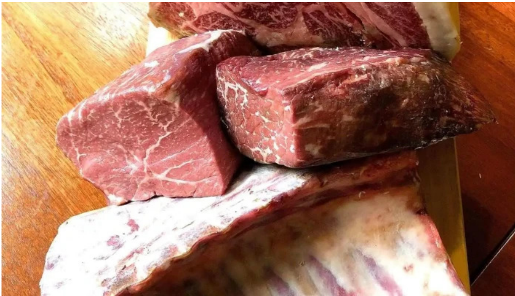
鉄板焼き hisui201 牛肉