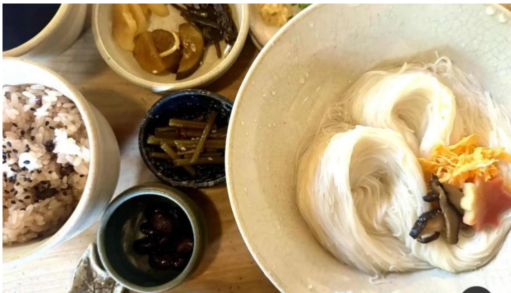
三輪の里 池側 麺