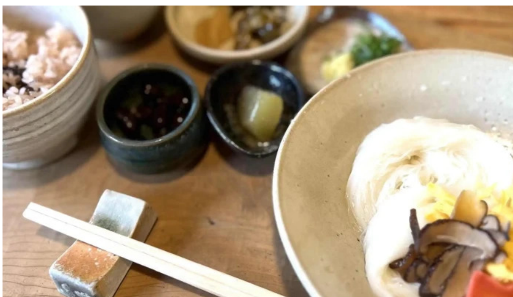
三輪の里 池側 instagram