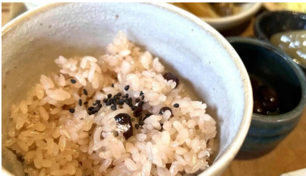
三輪の里 池側 ウェブサイト