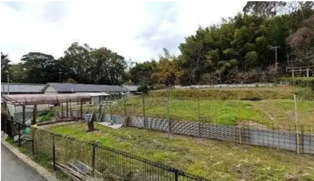
三輪の里 池側 桜井市