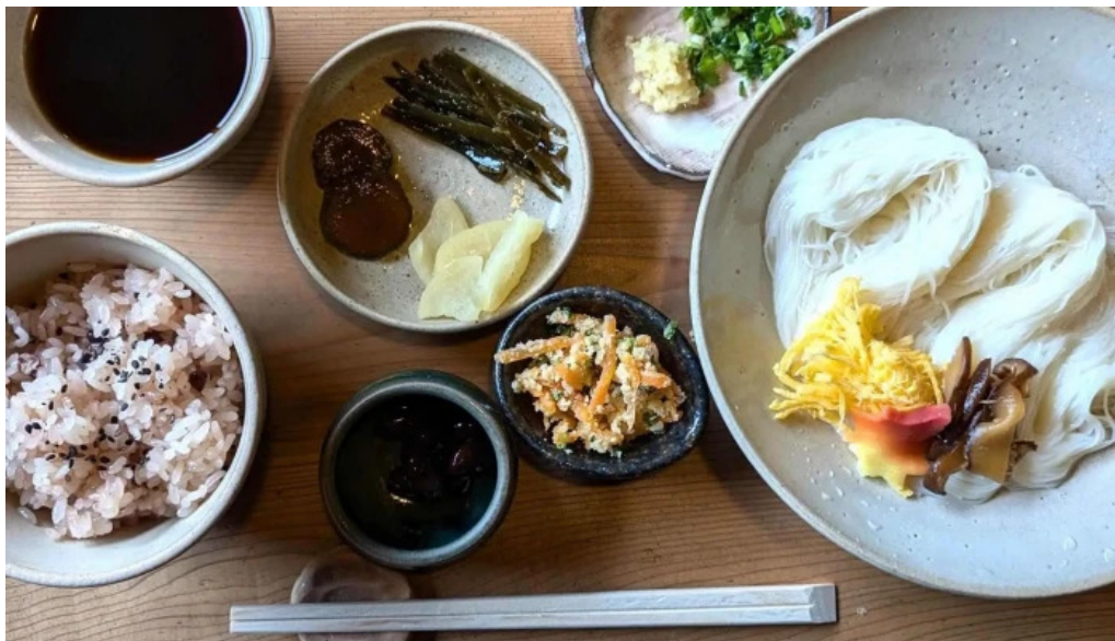
三輪の里 池側 動画