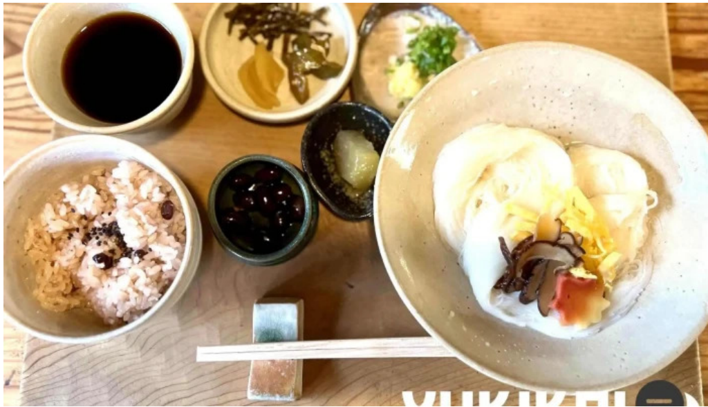
三輪の里 池側 料理飲み物