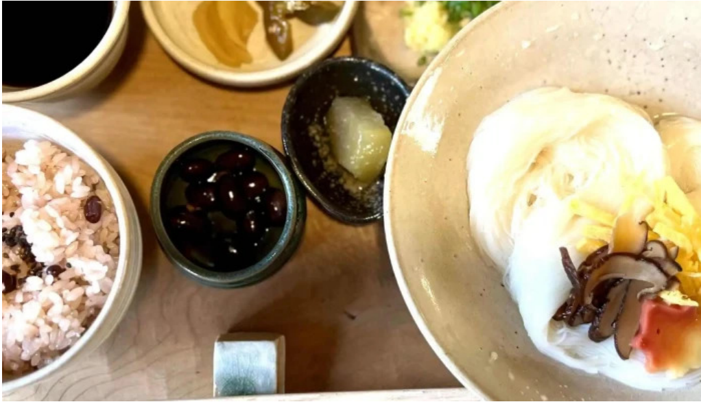
三輪の里 池側 プロモーション