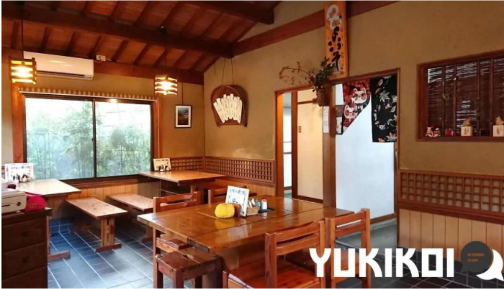
三輪の里 池側 雰囲気