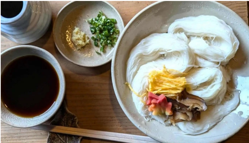
三輪の里 池側 エリア