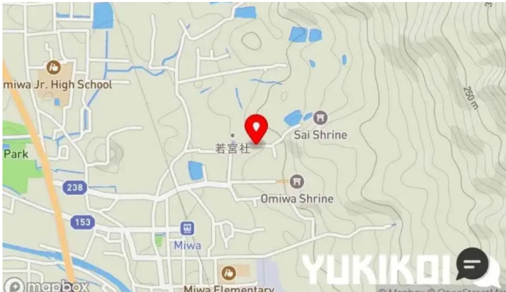
三輪の里 池側 地図