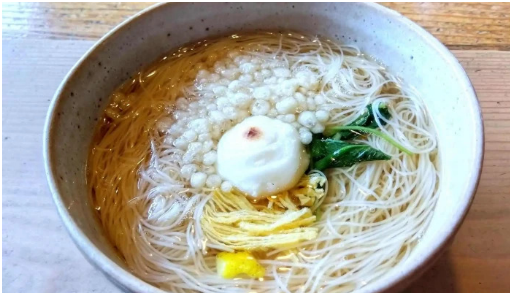
三輪の里 池側 ラーメン