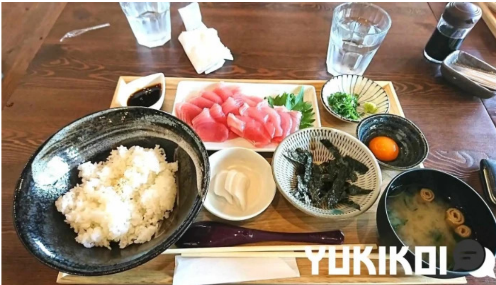
厚焼卵 おびの茶屋 料理飲み物