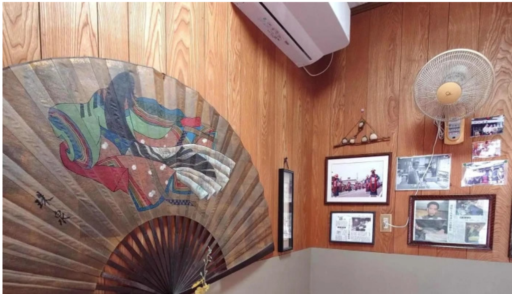
厚焼卵 おびの茶屋 カタログ