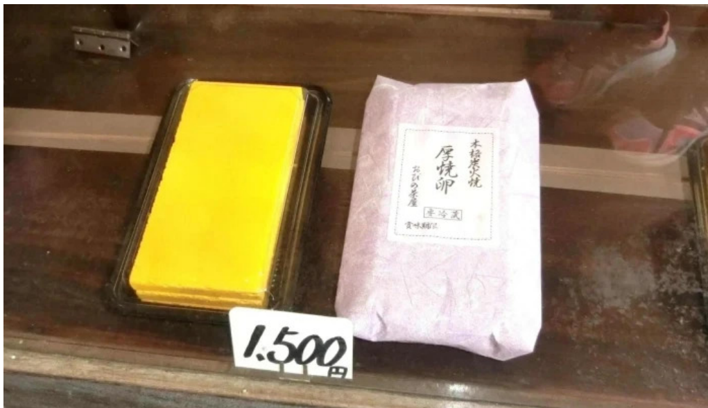
厚焼卵 おびの茶屋 営業時間