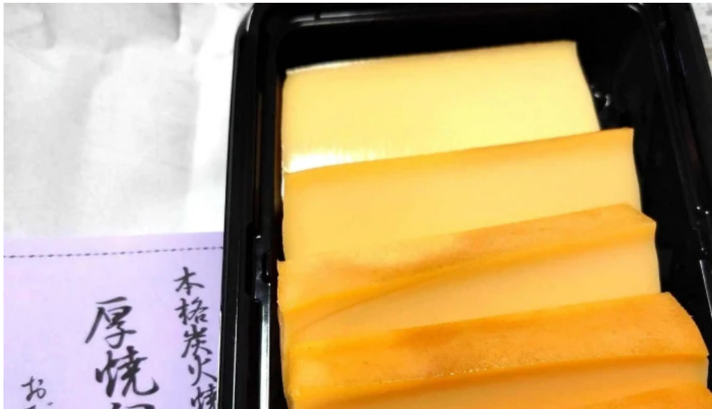
厚焼卵 おびの茶屋 プロモーション