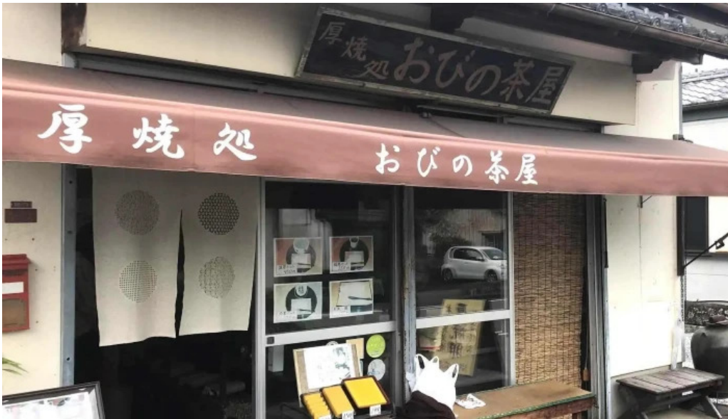
厚焼卵 おびの茶屋 番号