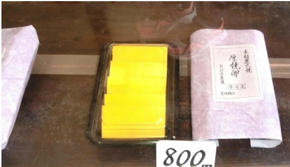
厚焼卵 おびの茶屋 instagram