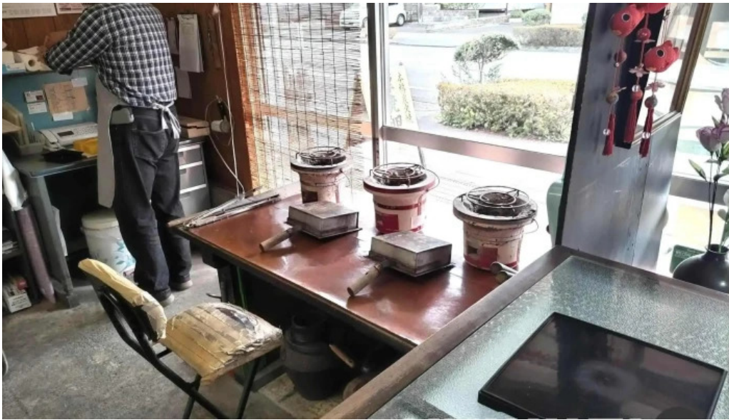
厚焼卵 おびの茶屋 雰囲気