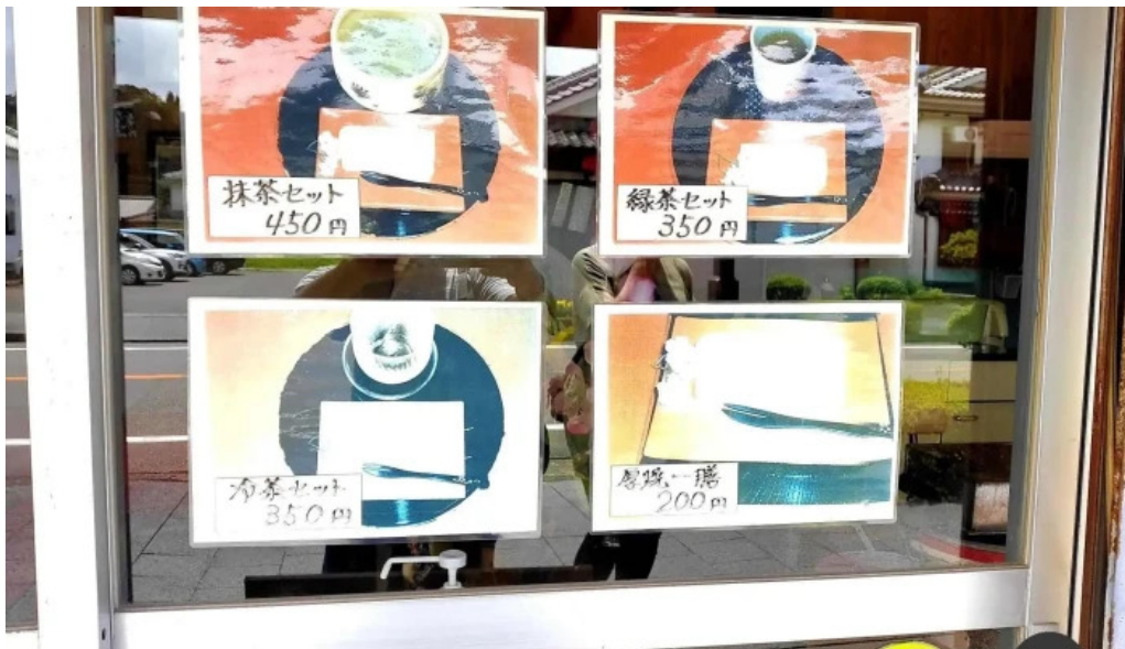
厚焼卵 おびの茶屋 メニュー