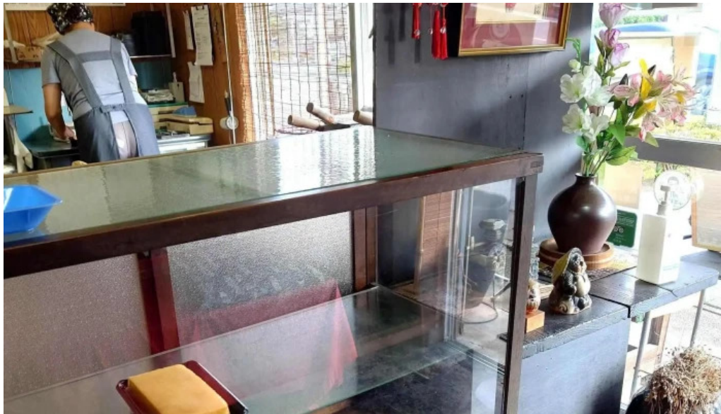
厚焼卵 おびの茶屋 動画