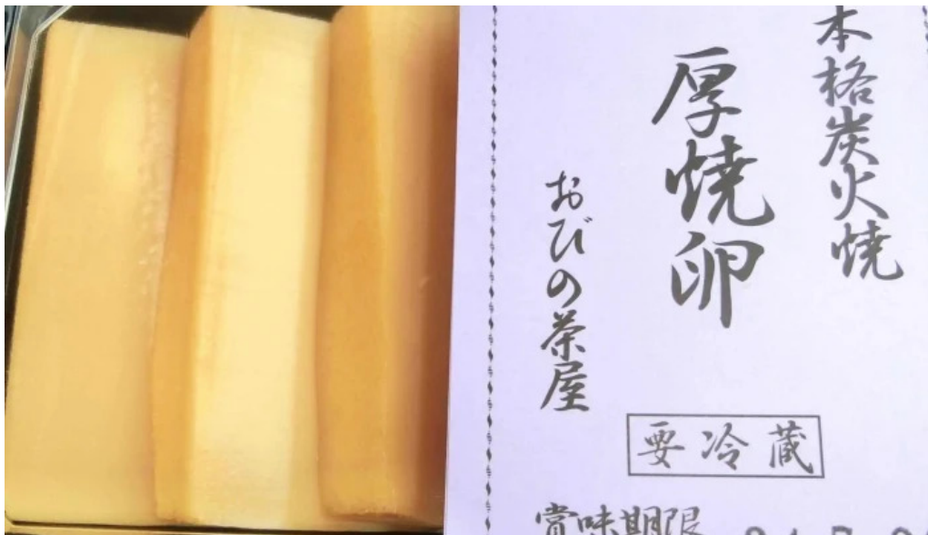
厚焼卵 おびの茶屋 どこ