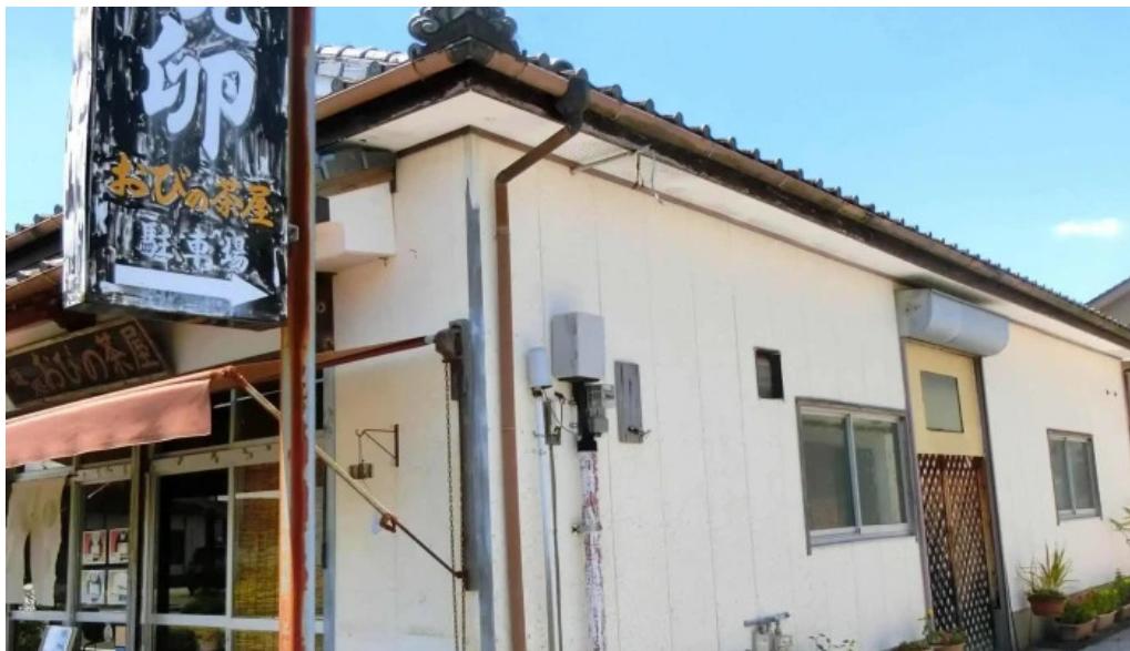
厚焼卵 おびの茶屋 電話