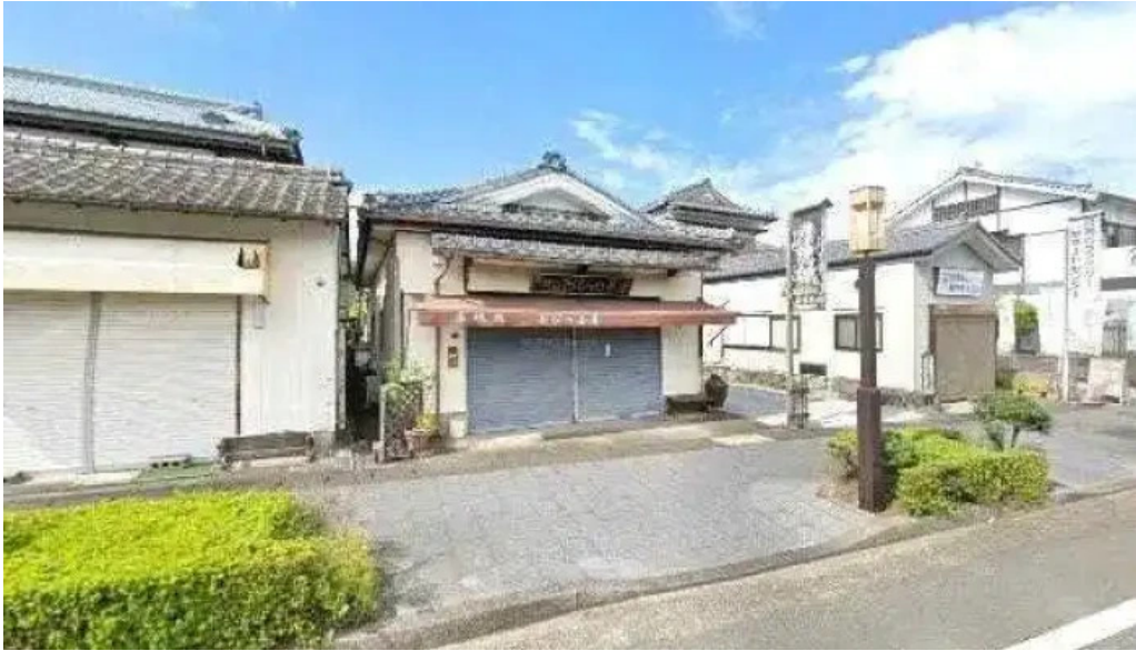
厚焼卵 おびの茶屋 日南市