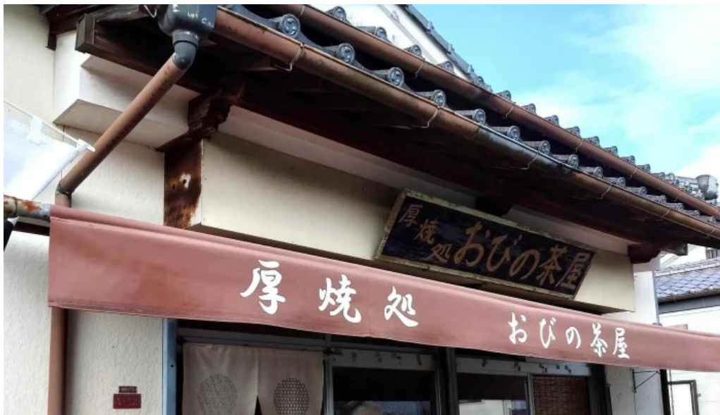
厚焼卵 おびの茶屋 スコア