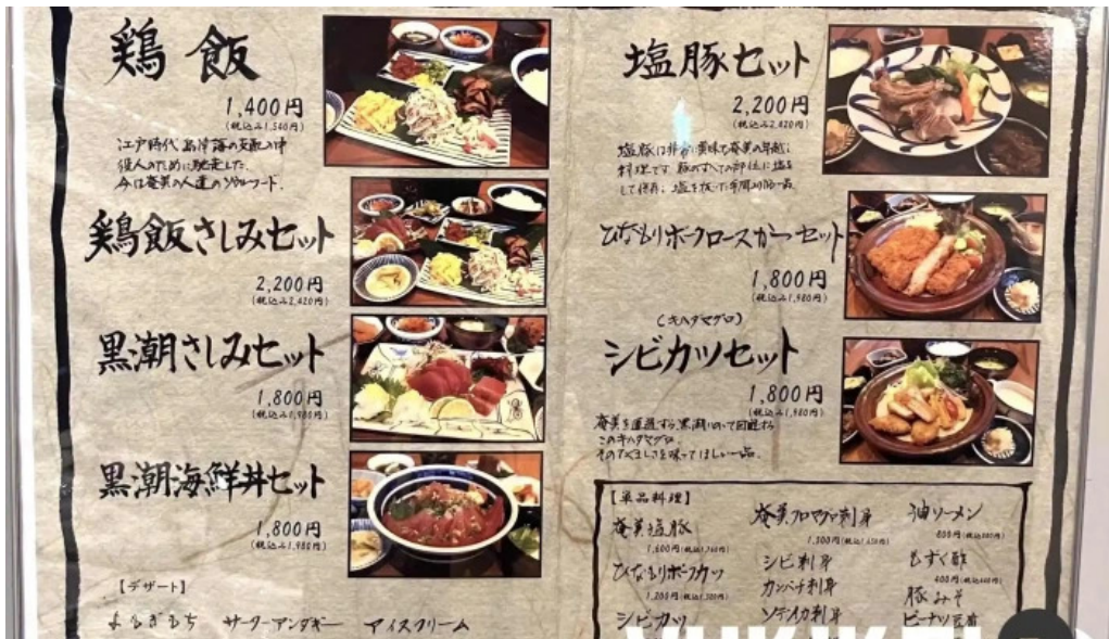
鶏飯 郷土料理 愛かな メニュー