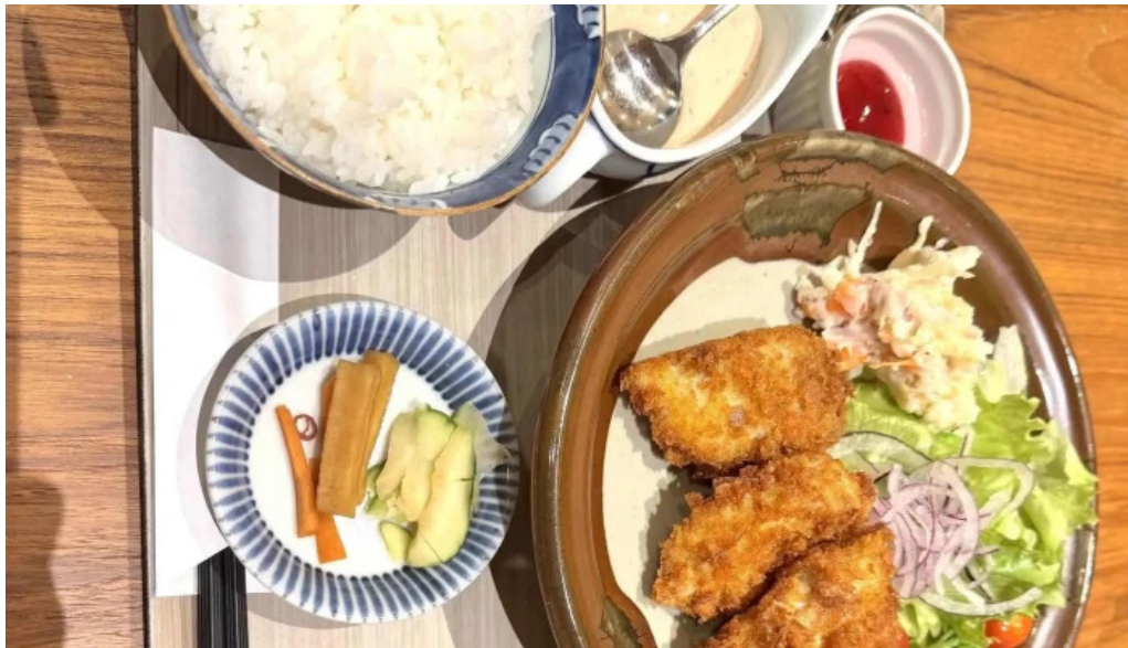
鶏飯 郷土料理 愛かな 割引