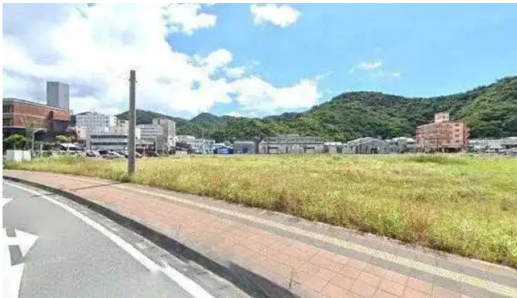
鶏飯 郷土料理 愛かな 奄美市