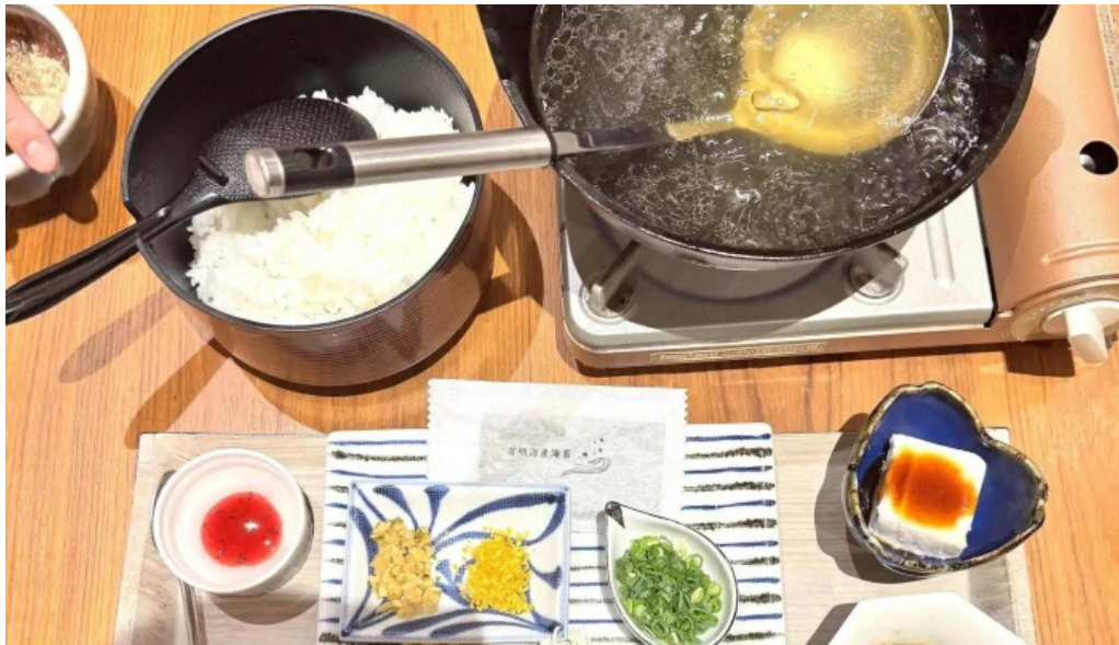
鶏飯 郷土料理 愛かな 動画