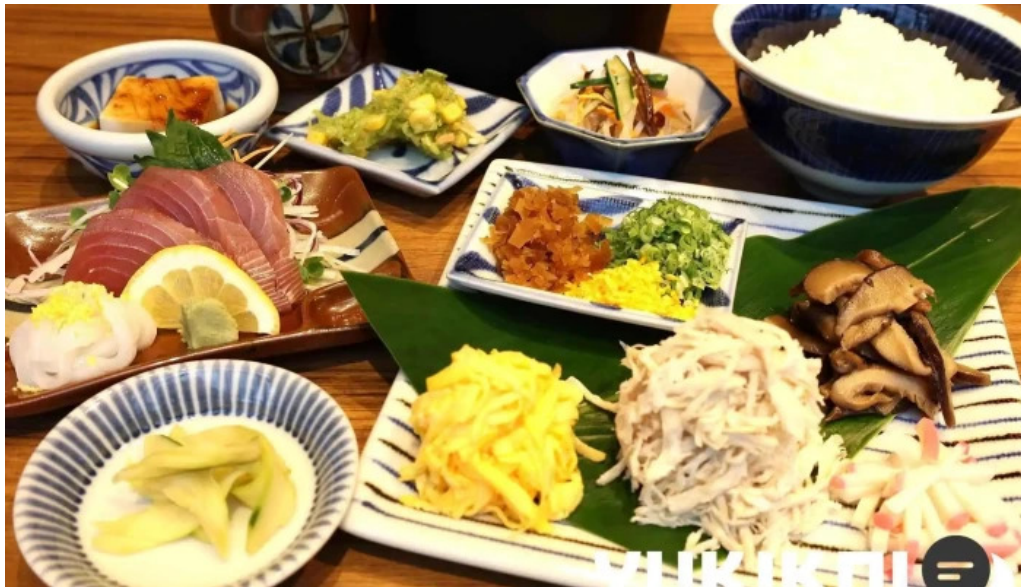
鶏飯 郷土料理 愛かな