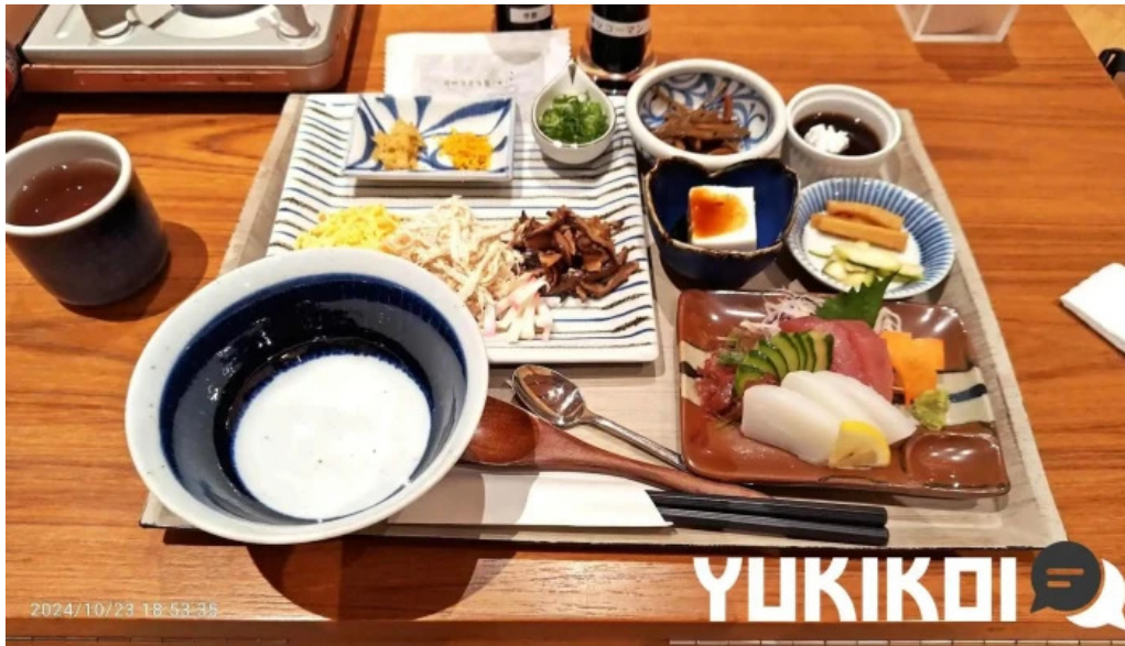
鶏飯 郷土料理 愛かな 最新