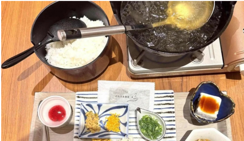
鶏飯 郷土料理 愛かな 料金