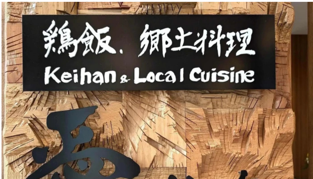
鶏飯 郷土料理 愛かな instagram