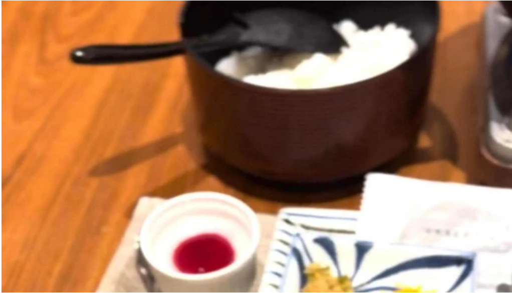
鶏飯 郷土料理 愛かな 近く