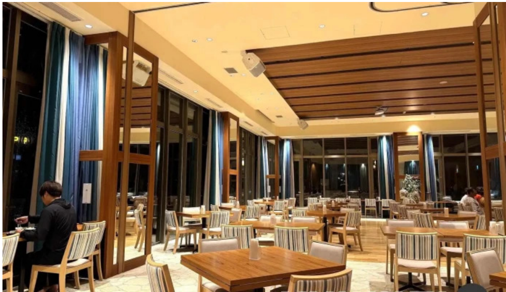
鶏飯 郷土料理 愛かな 雰囲気