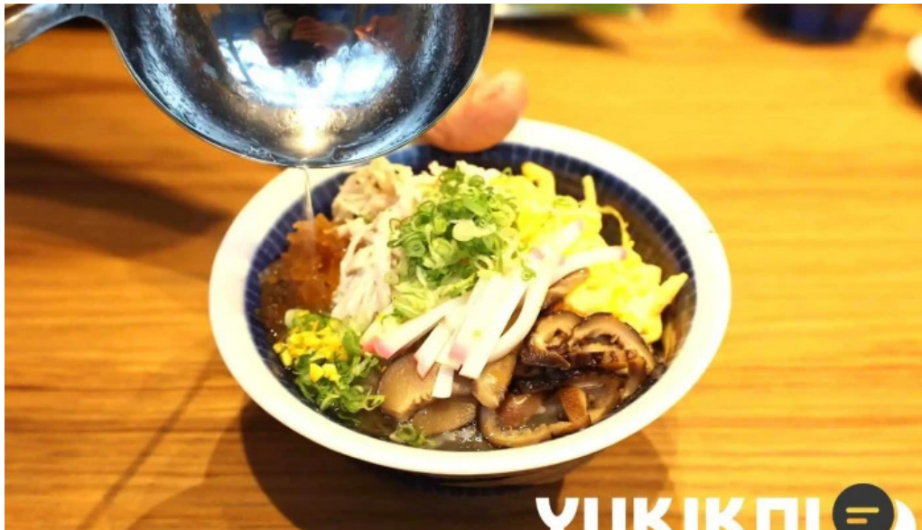
鶏飯 郷土料理 愛かな 麺