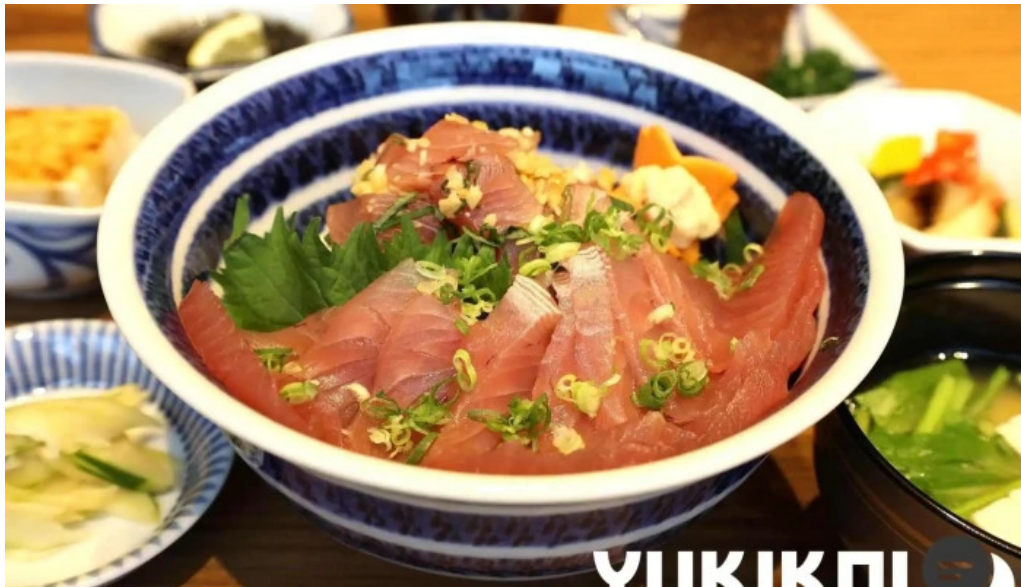
鶏飯 郷土料理 愛かな 料理飲み物