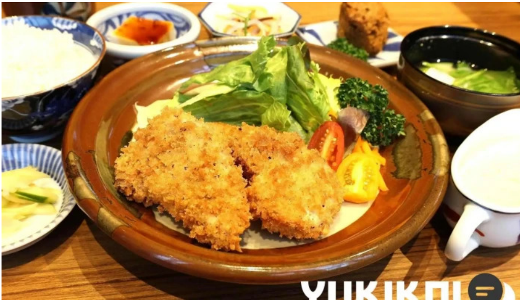
鶏飯 郷土料理 愛かな 豚カツ