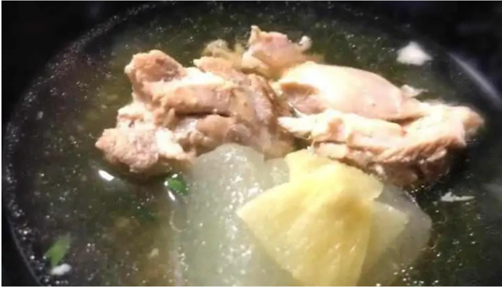
喜多八 チキンスープ