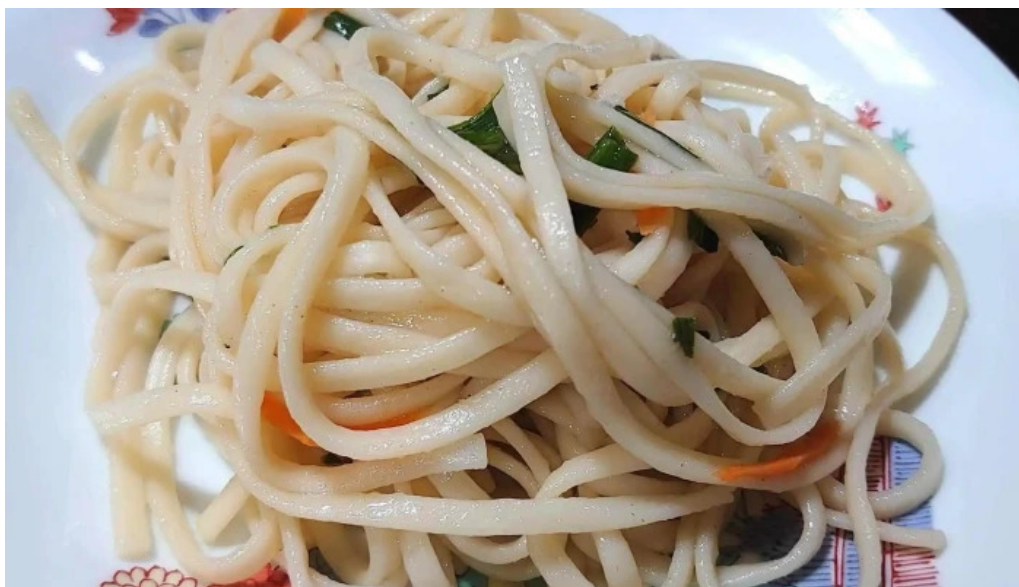
喜多ハスパゲッティ