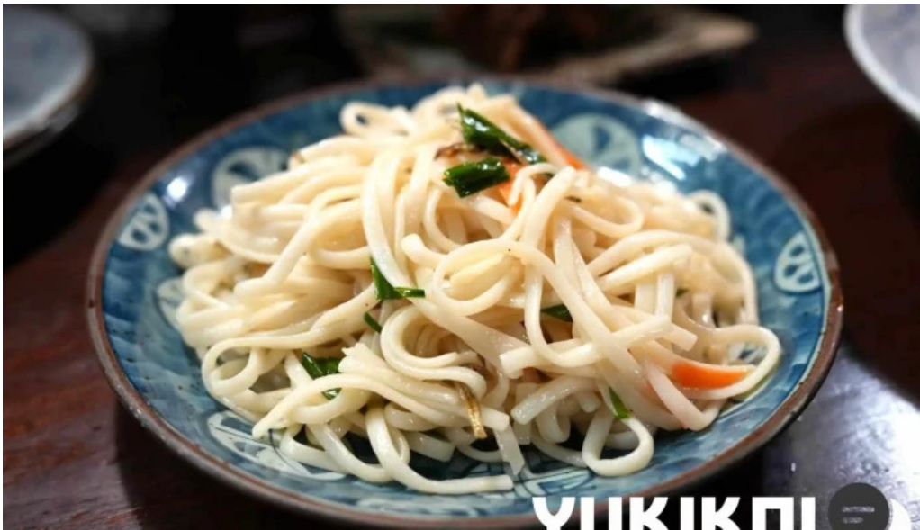
喜多八 料理飲み物