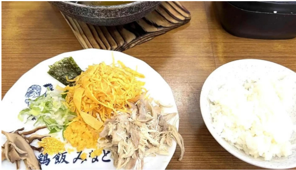
みなとや鶏飯 動画