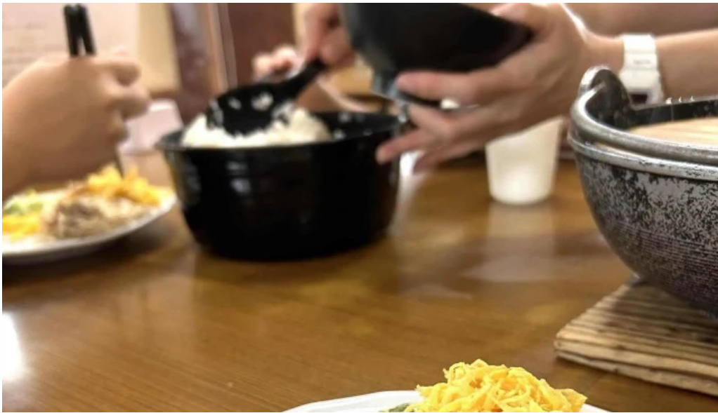
みなとや鶏飯 行き方