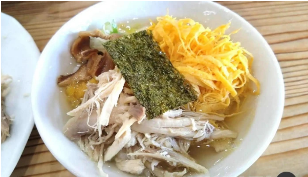
みなとや鶏飯 最新