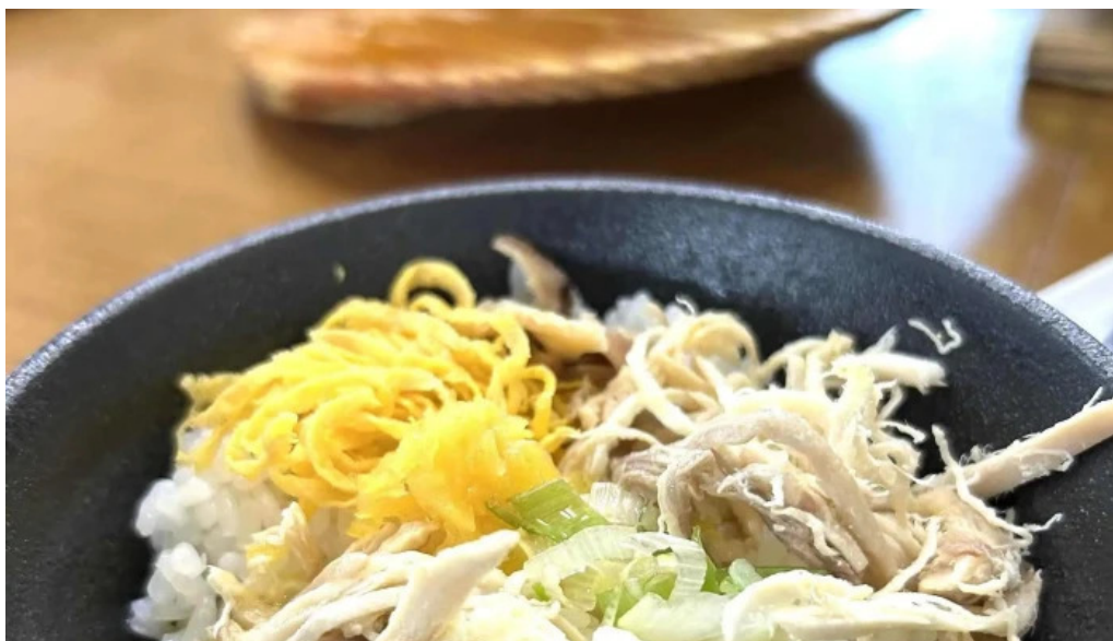
みなとや鶏飯 ウェブサイト