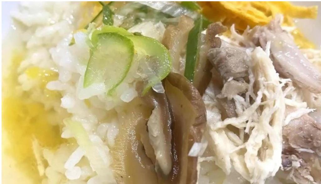
みなとや鶏飯 ラーメン