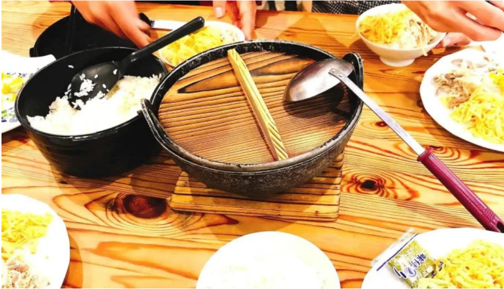
みなとや鶏飯 料理飲み物