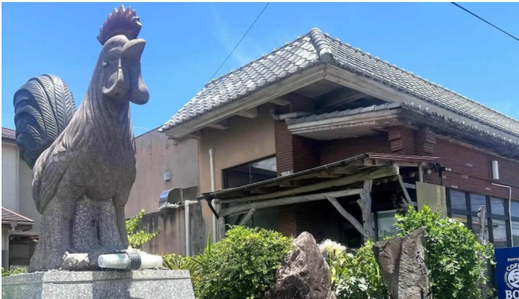
みなとや鶏飯 近く