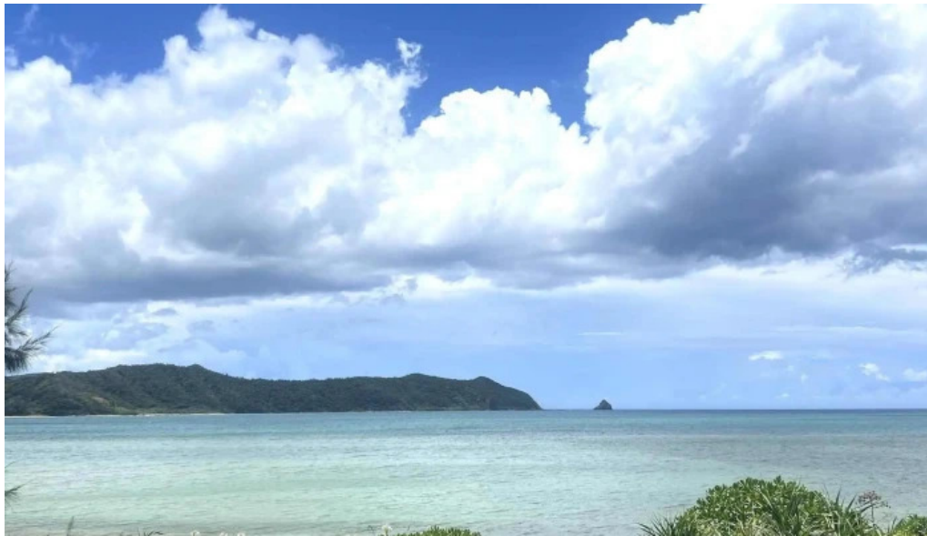
みなとや鶏飯 口コミ