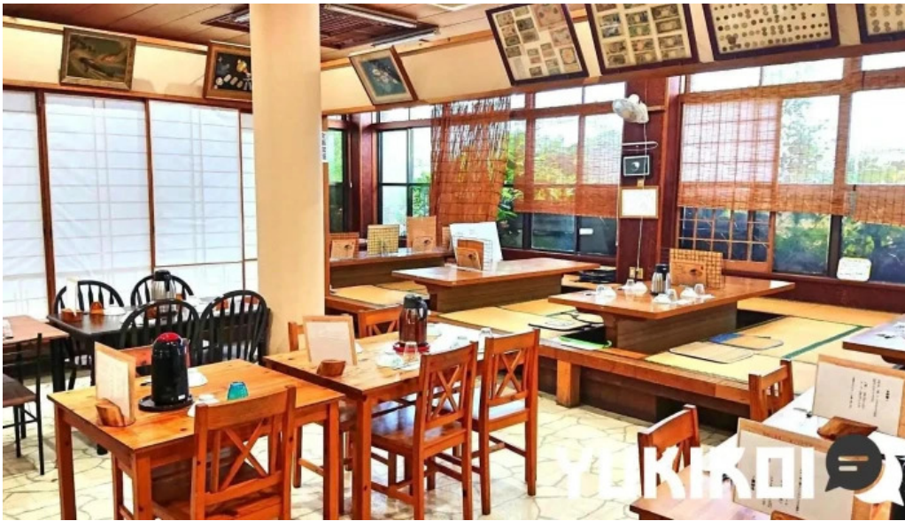
みなとや鶏飯 雰囲気