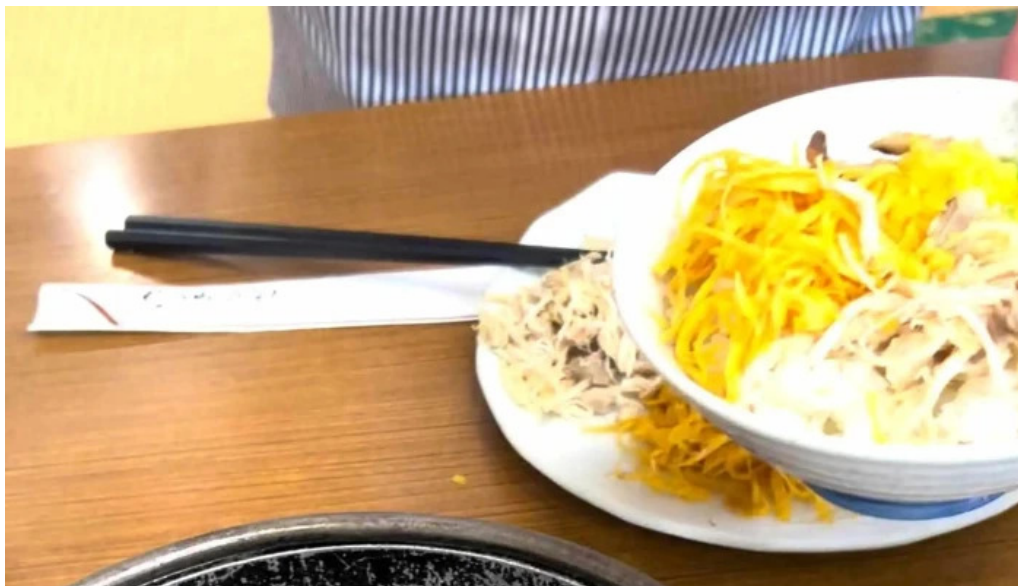
みなとや鶏飯 カタログ