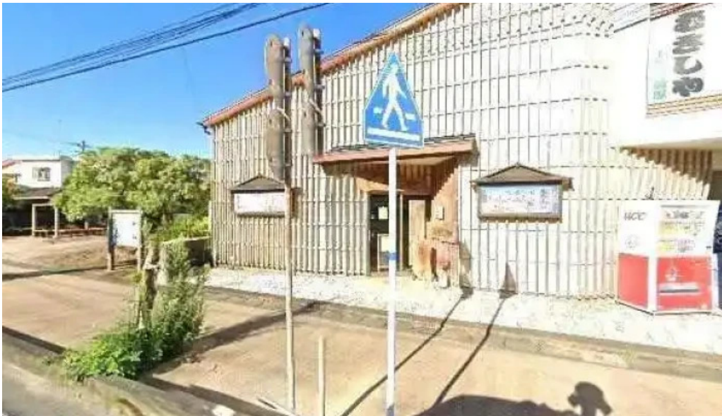
みなとや鶏飯 奄美市