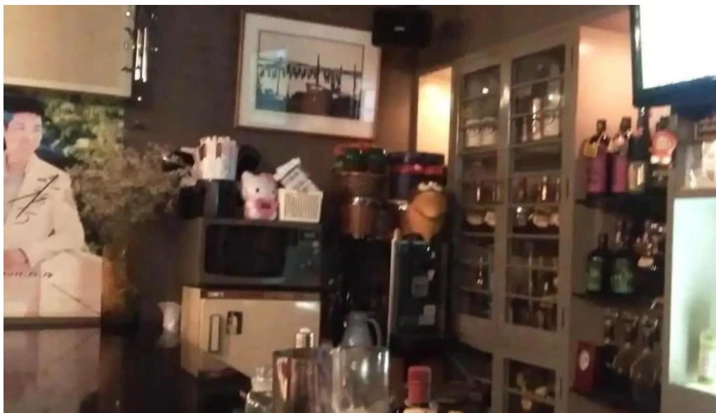
ラブネスト すべて