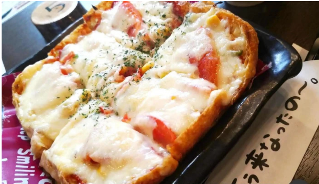
有谷口屋 ミラネーサ