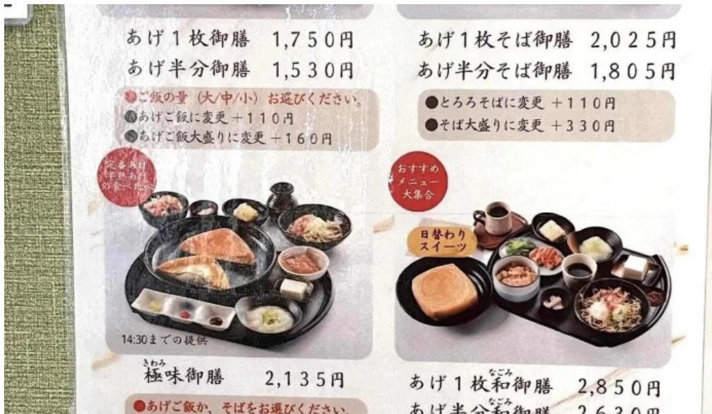
有谷口屋 メニュー