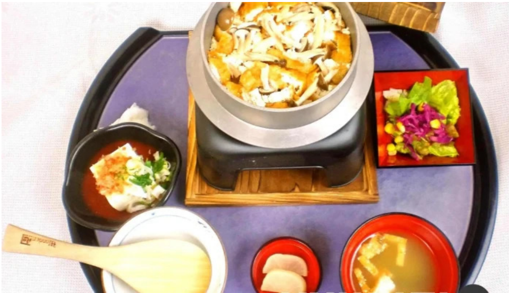
有谷口屋 料理飲み物