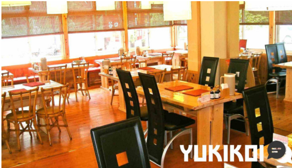
有 谷口屋 坂井市