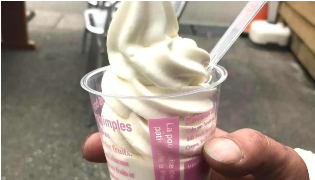
有谷口屋 アイスクリーム