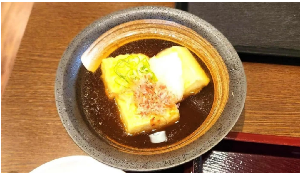
有谷口屋 comentario 1