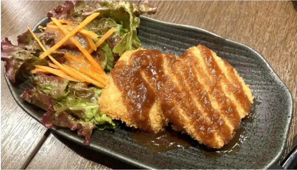
有谷口屋 チキンカツ