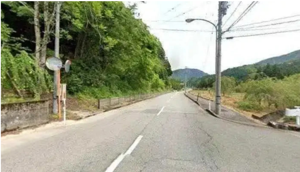
有谷口屋 ストリートビューと 360 ビュー