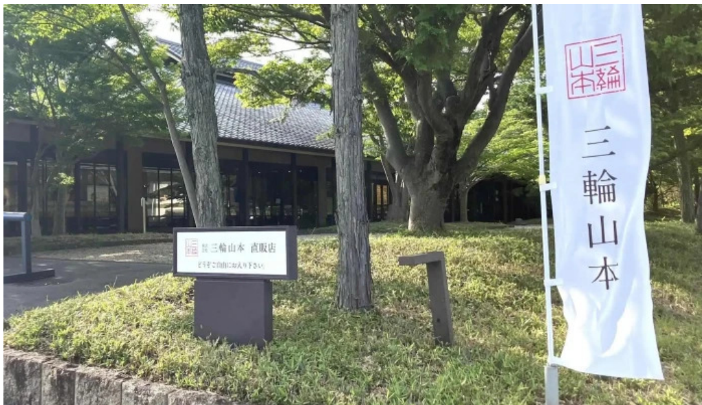
三輪山本 コメント