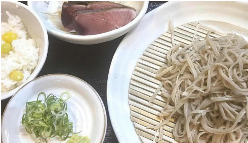
Ken gyuけんぎゅう カタログ