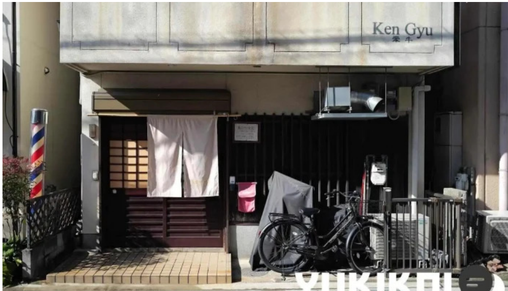
Ken gyu けんぎゅう 長岡京市