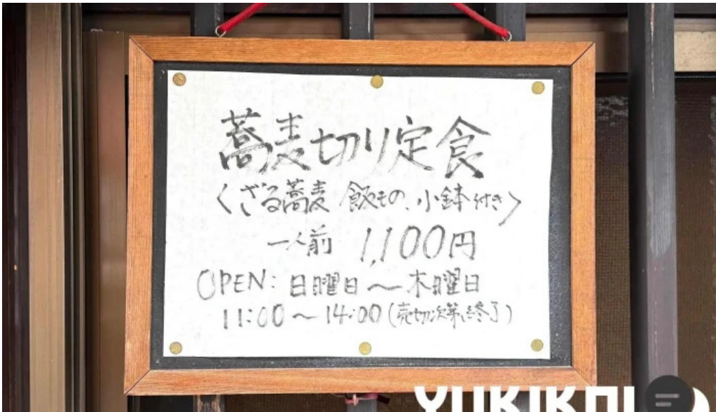
Ken gyulけんぎゅう メニュー