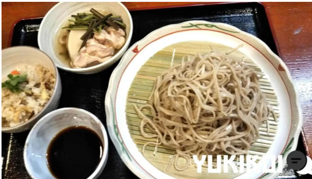
Ken gyuけんぎゅう 料理飲み物