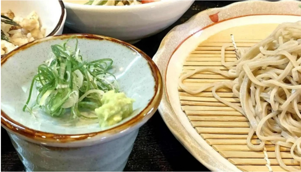
Ken gyūけんぎゅう 営業時間