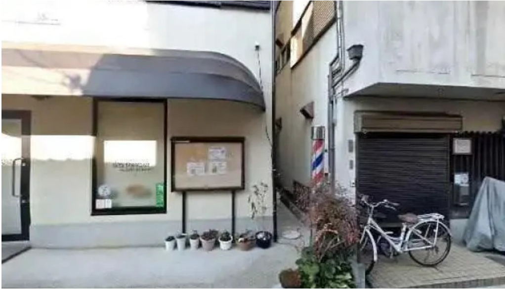
Ken gyuけんぎゅう 長岡京市