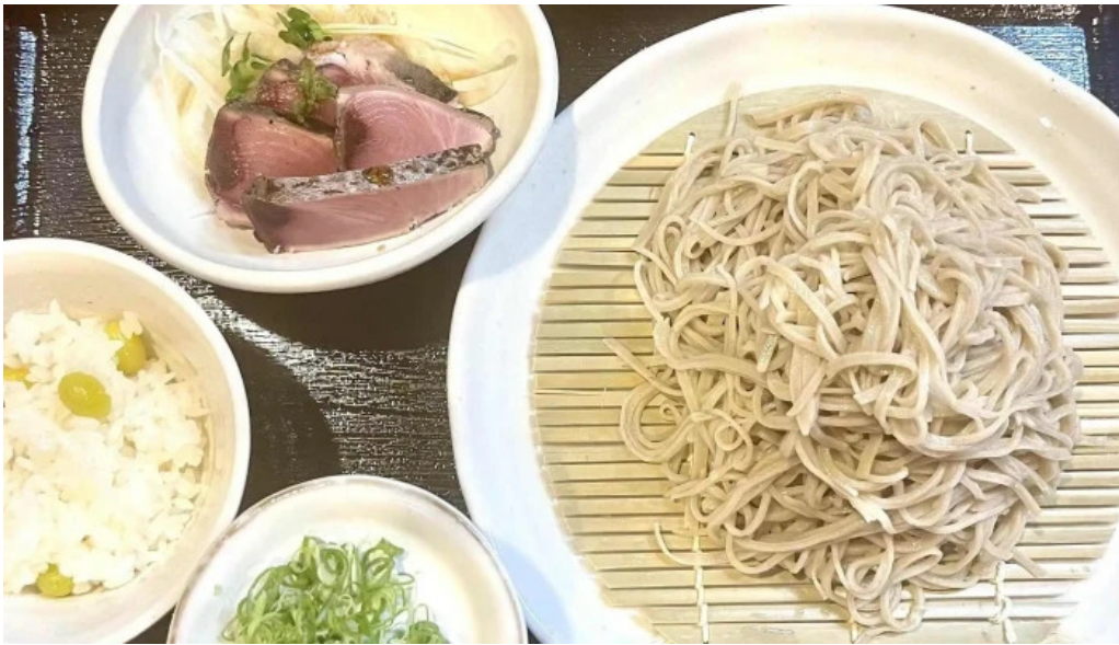
Ken gyulけんぎゅう 写真