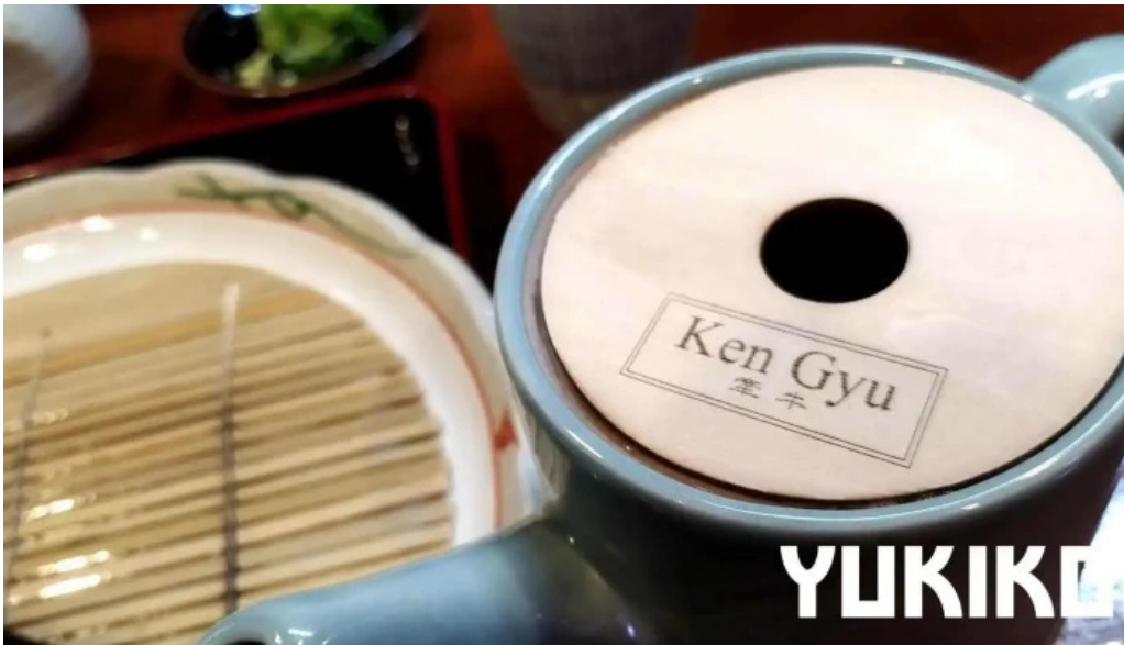
Ken gyu(けんぎゅう) 最新