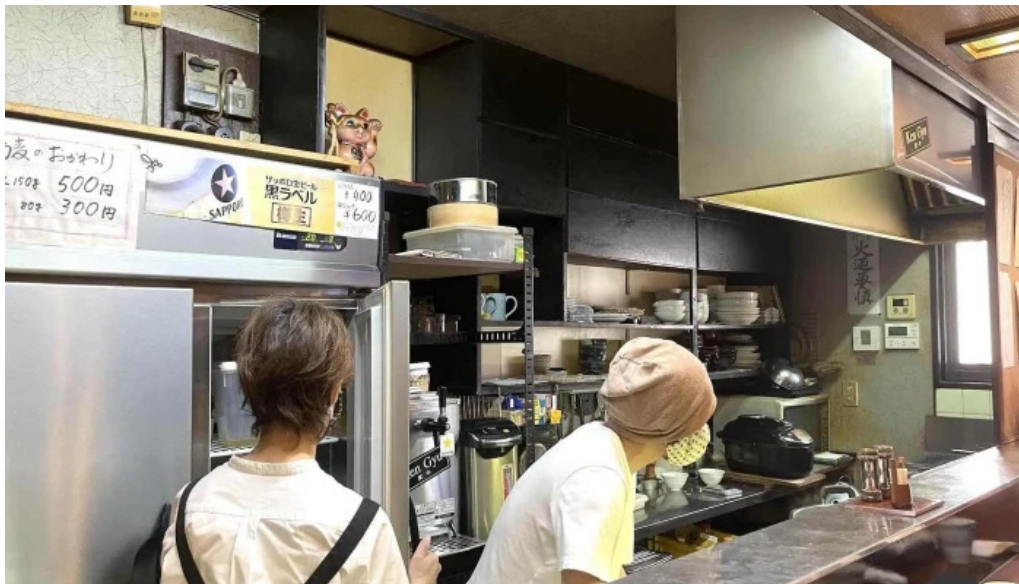
Ken gyu(けんぎゅう) 霧田気