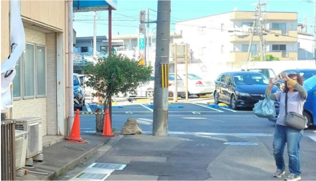
Ken gyu(けんぎゅう) スコア