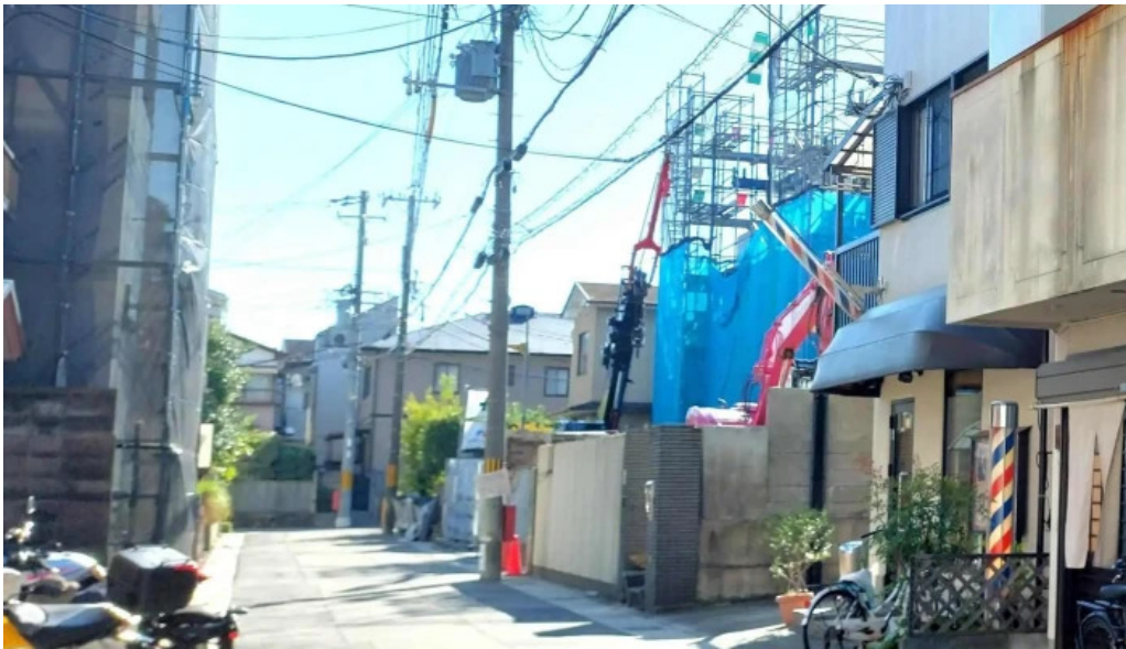
Ken gyu(けんぎゅう) コメント