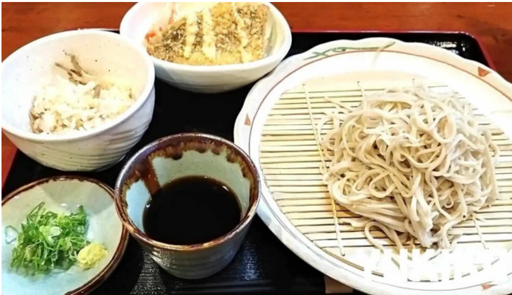
Ken gyuけんぎゅう 蕎麦