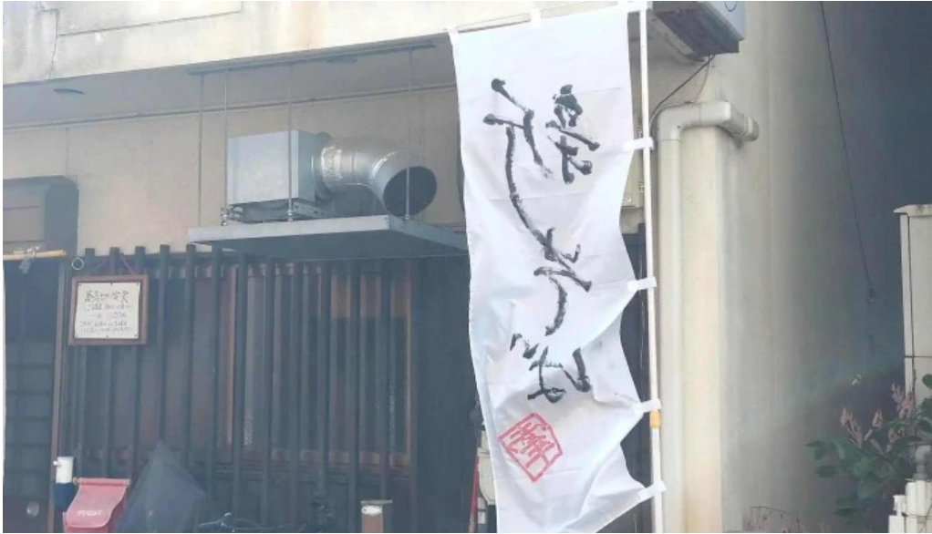
Ken gyu(けんぎゅう) 番号