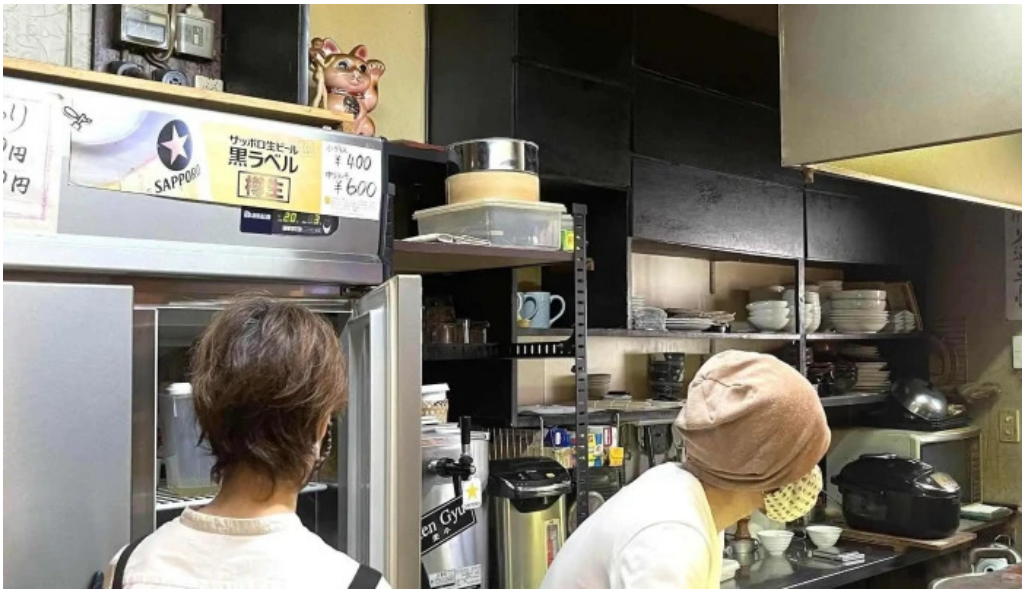
Ken gyūけんぎゅう 動画