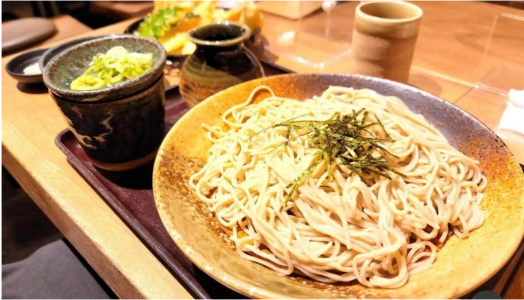
金亀庵 草津駅前店 料理飲み物