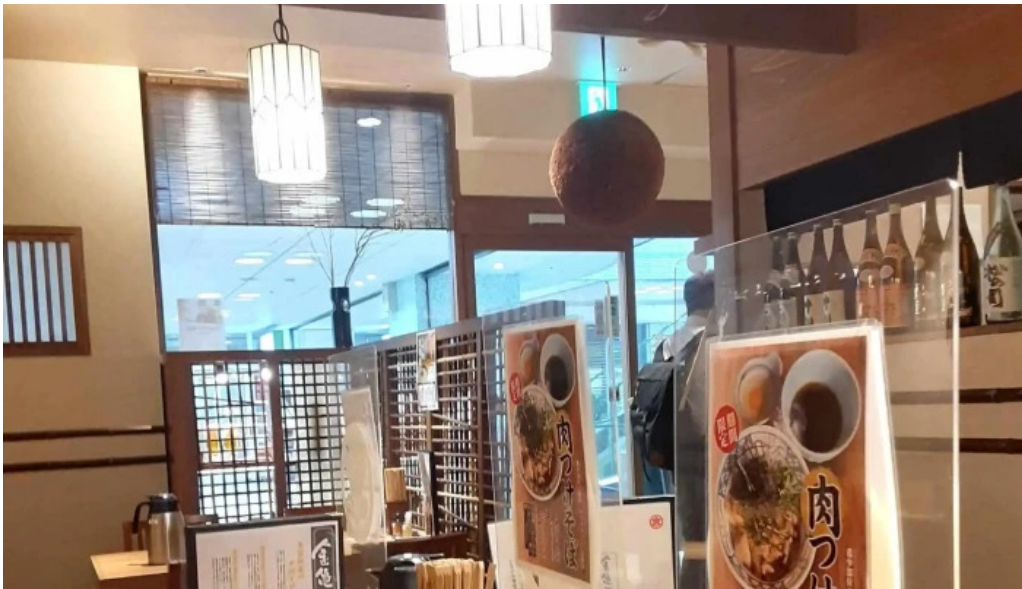
金亀庵 草津駅前店 コメント