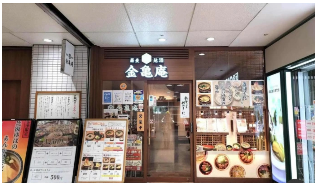
金亀庵 草津駅前店 雰囲気