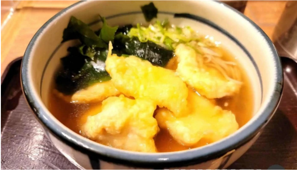
金亀庵 草津駅前店 スープ