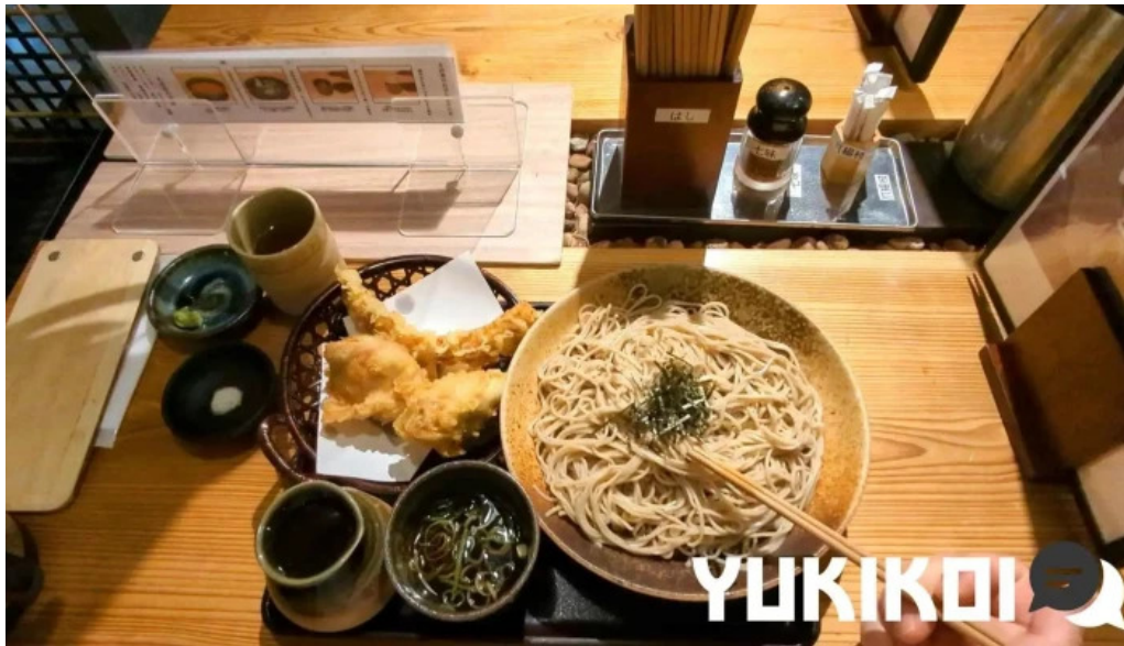
金亀庵 草津駅前店 蕎麦