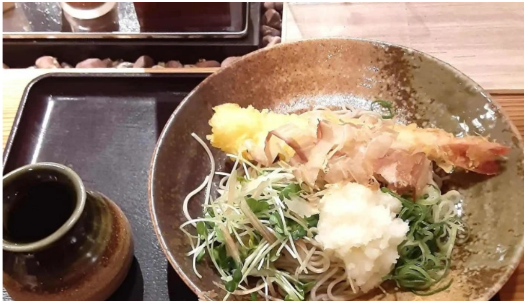
金亀庵 草津駅前店 カタログ