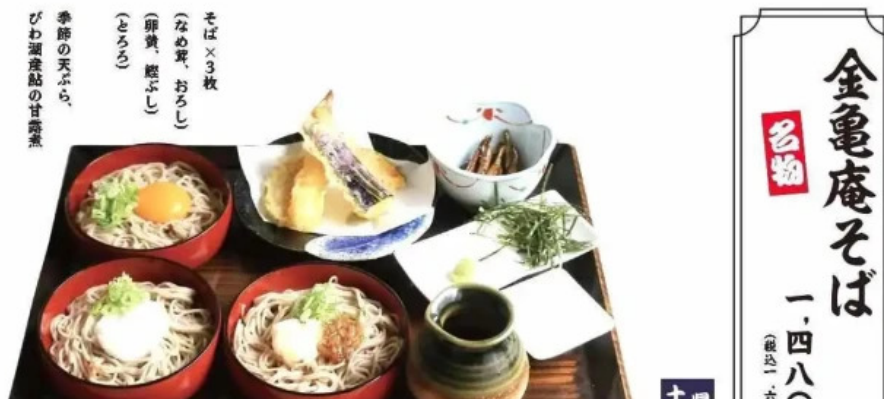
金亀庵 草津駅前店