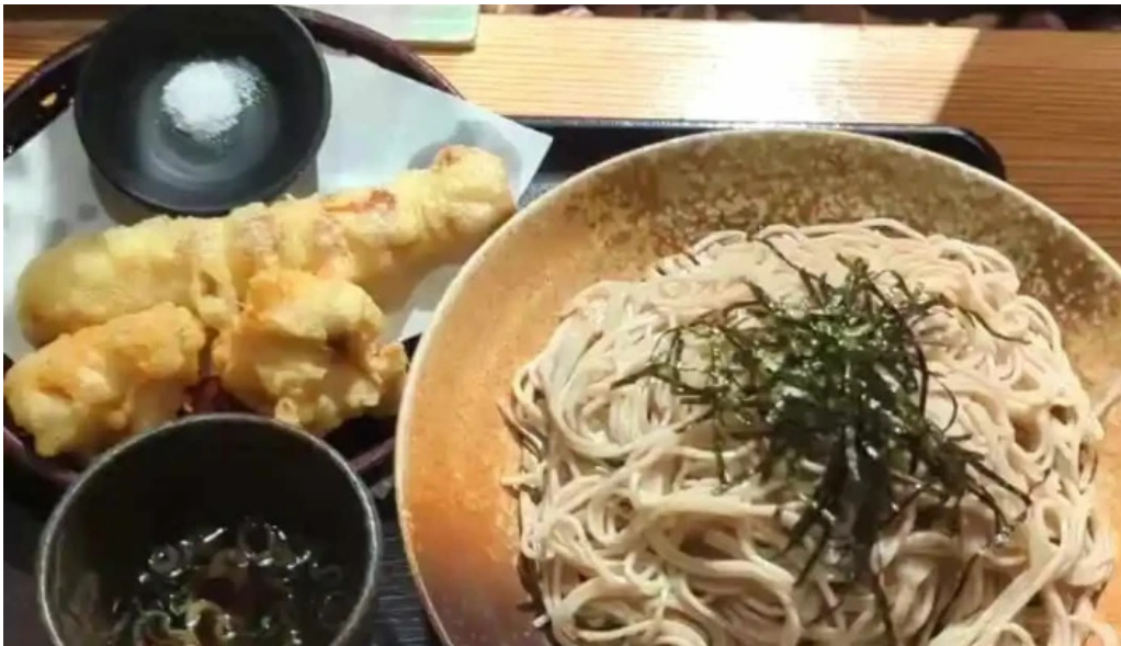
金亀庵 草津駅前店 動画