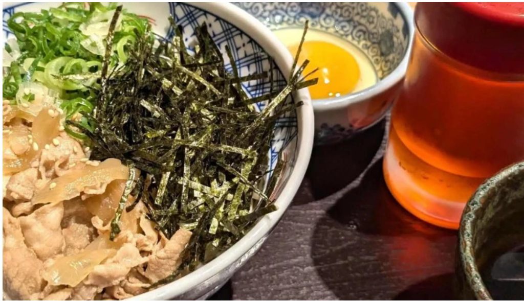
金亀庵 草津駅前店 割引