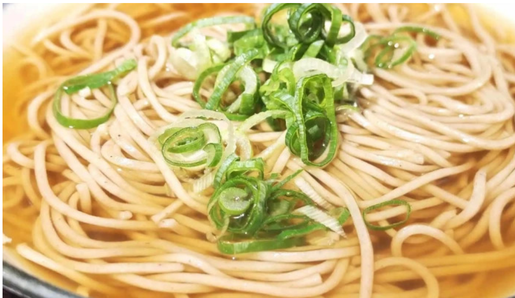
金亀庵 草津駅前店 営業中