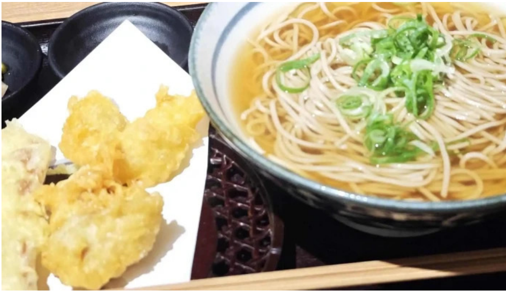
金亀庵 草津駅前店 口コミ