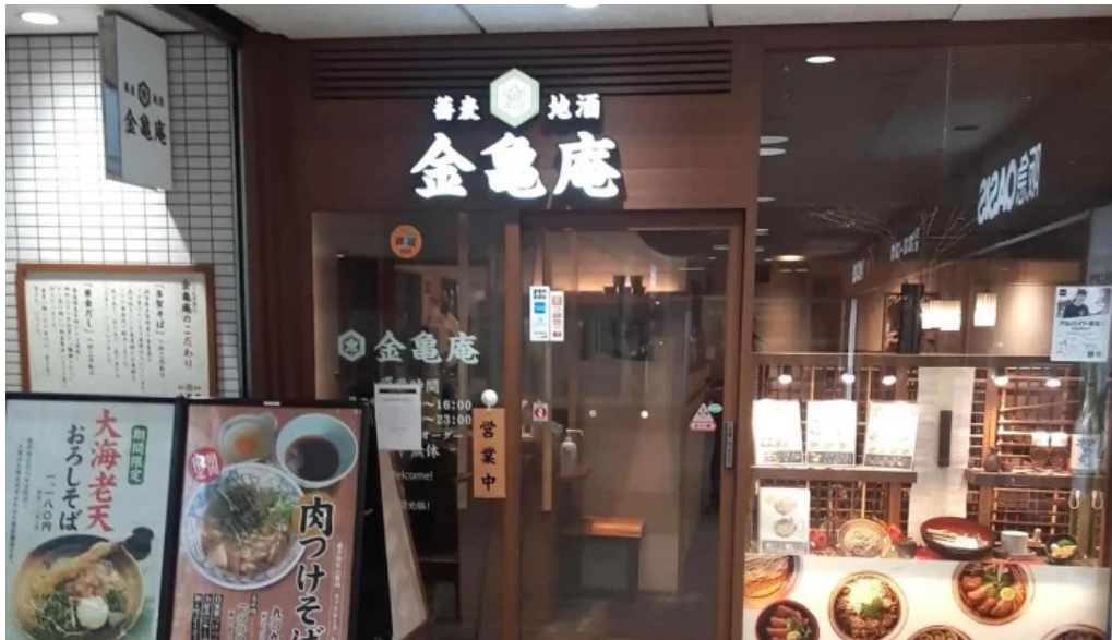
金亀庵 草津駅前店 営業時間