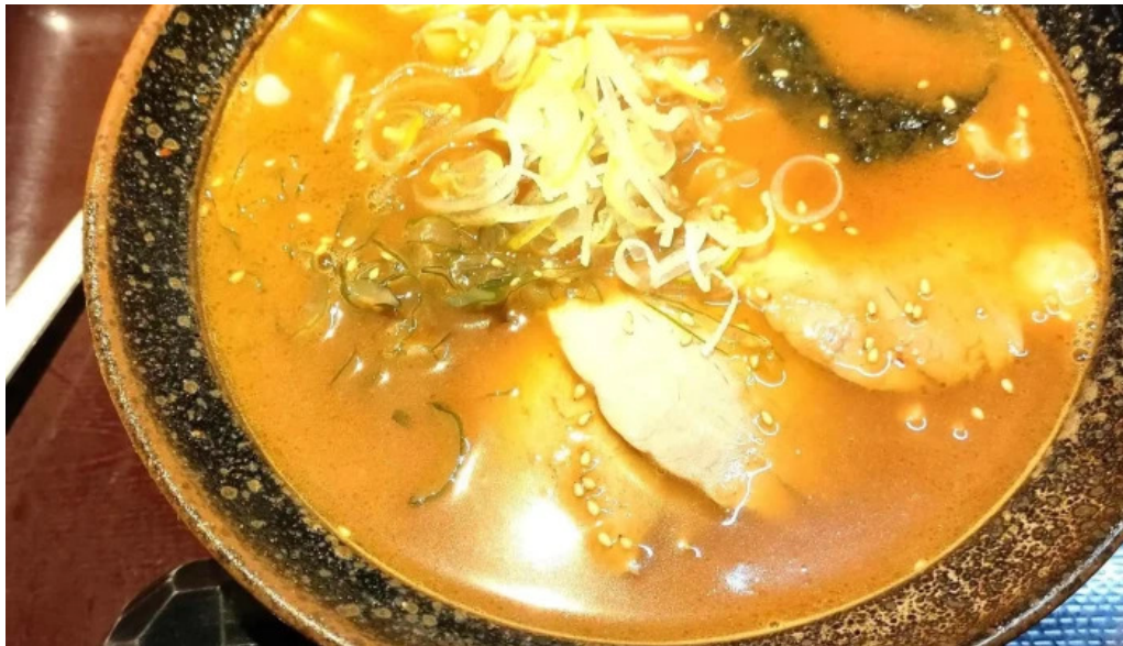
真御膳そばらーめん蔵乃麵 網走店 comentario 4