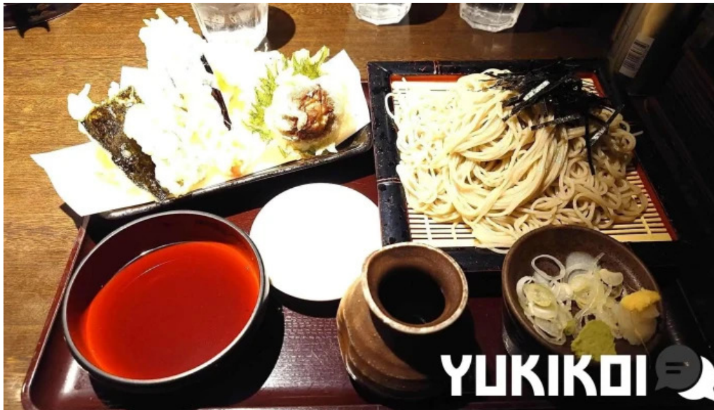
真御膳そばらーめん蔵乃麺 網走店 蕎麦