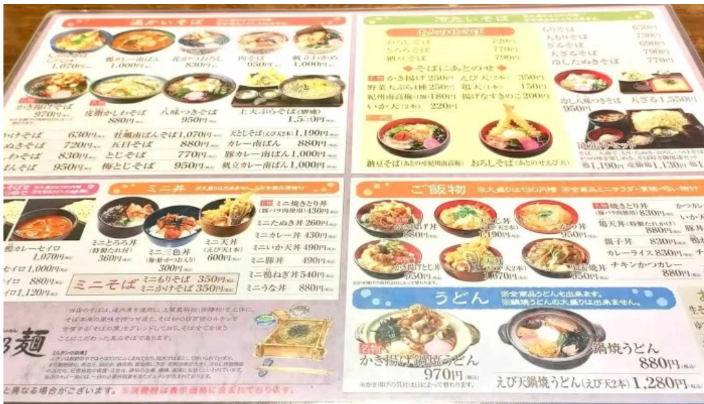
真御膳そばらーめん蔵乃麵 網走店 comentario 3