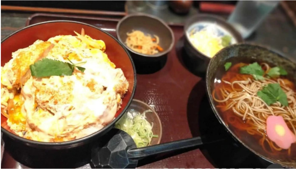
真御膳そばらーめん蔵乃麵 網走店 スープ