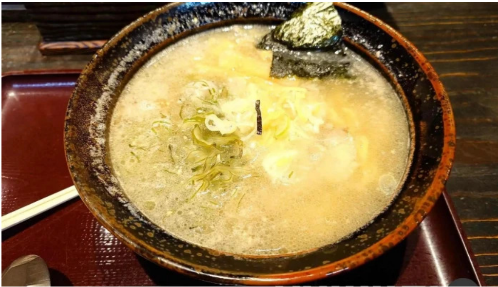
真御膳そばらーめん蔵乃麵 網走店 料理飲み物