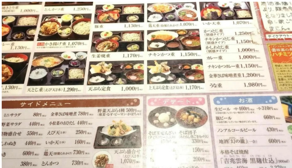
真御膳そばらーめん蔵乃麺 網走店 comentario 2