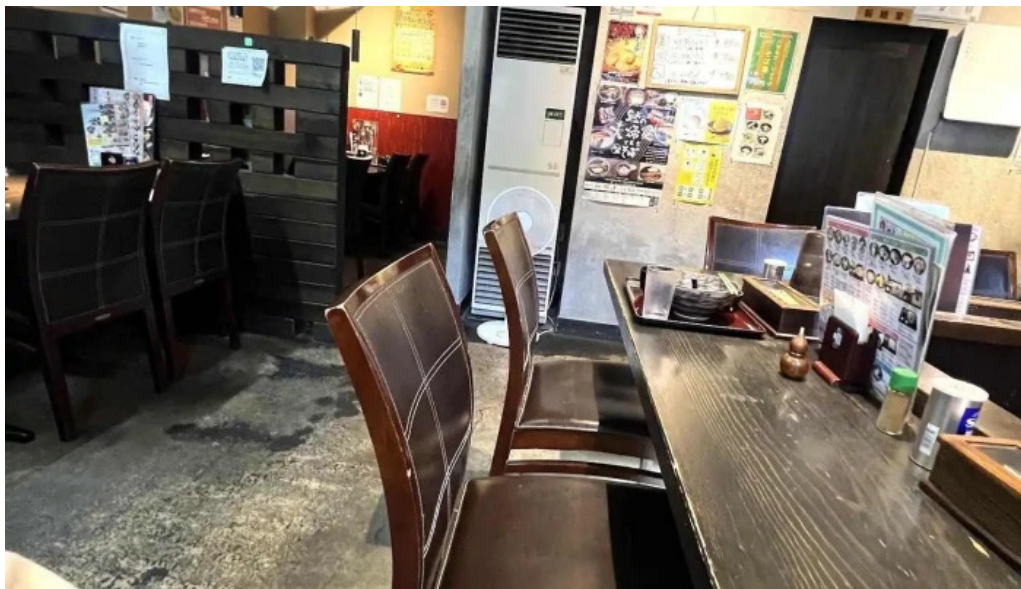
真御膳そばらーめん蔵乃麵 網走店 雰囲気