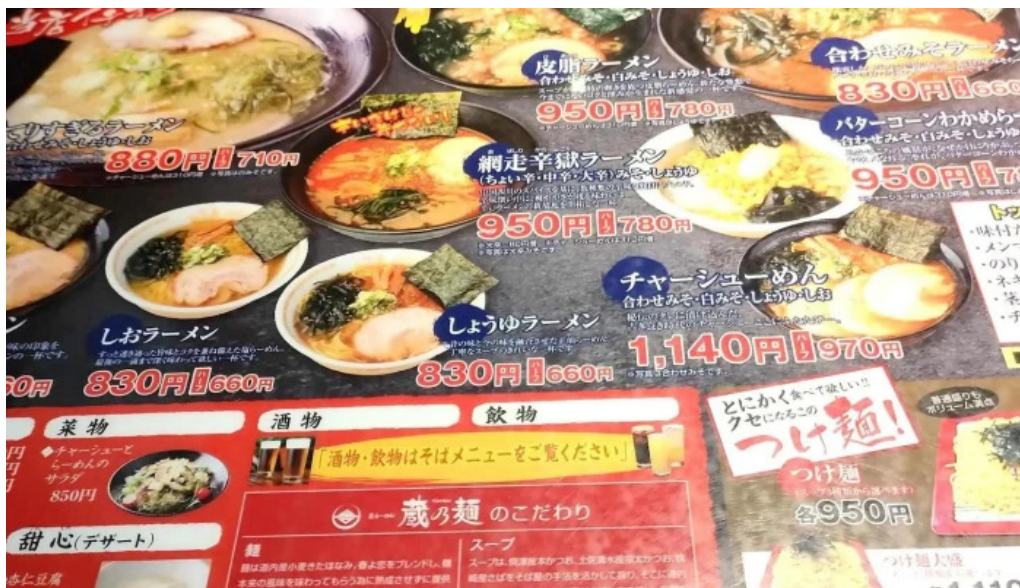
真御膳そばらーめん蔵乃麺 網走店 comentario 1