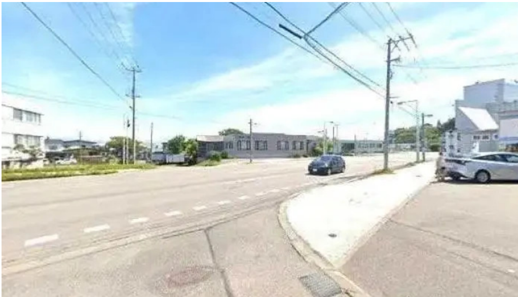
真御膳そばらーめん蔵乃麵 網走店 ストリートビューと 360 ビュー