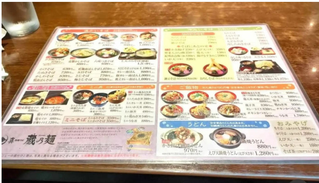
真御膳そばらーめん蔵乃麺 網走店 最新