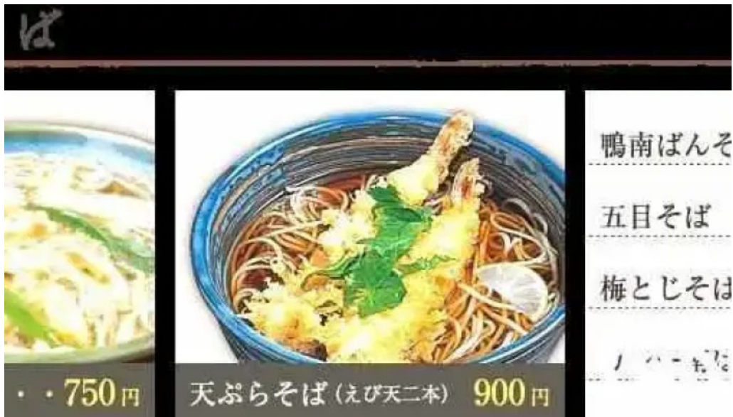
真御膳そばらーめん蔵乃麺 網走店