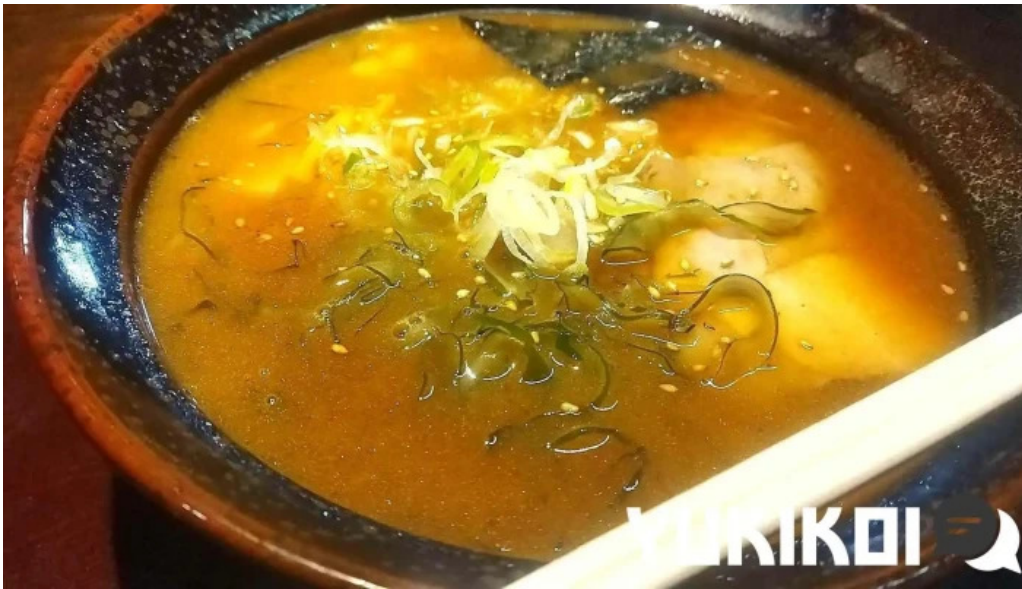
真御膳そばらーめん蔵乃麵 網走店 動画