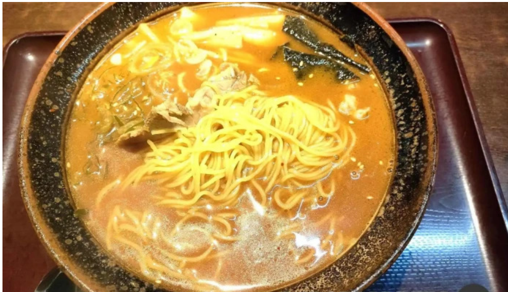
真御膳そばらーめん蔵乃麵 網走店 ラーメン