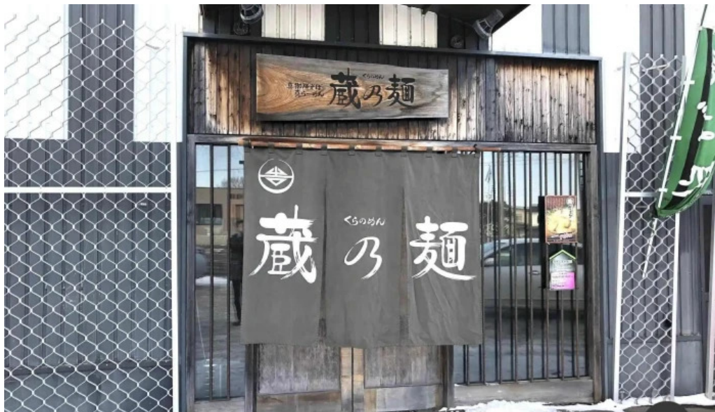
真御膳そばらーめん蔵乃麺 網走店 すべて