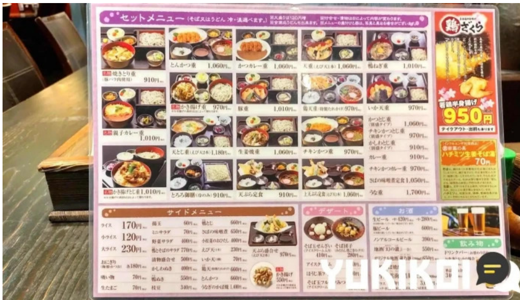
真御膳そばらーめん蔵乃麵 網走店 メニュー