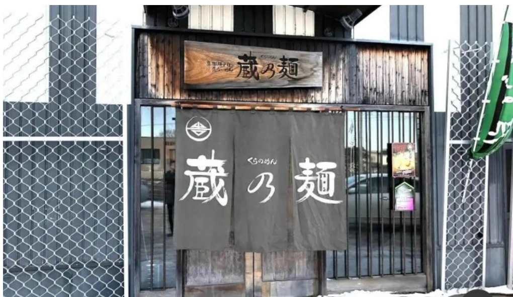
真御膳そば・ラーメン「蔵乃麺」 網走店 網走市