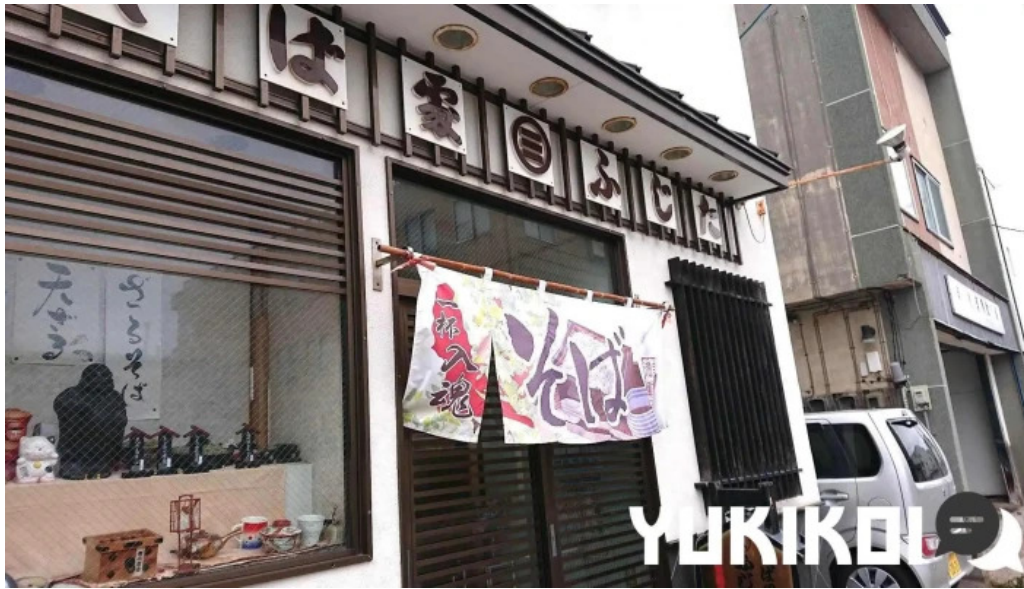
そば処 ふじた家 すべて