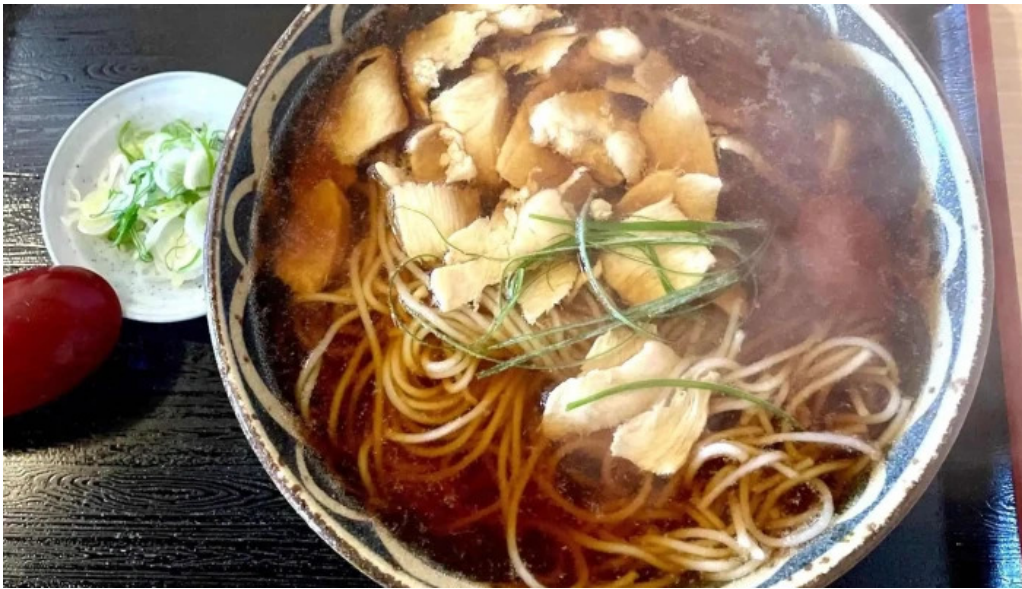
そば処 ふじた家 最新