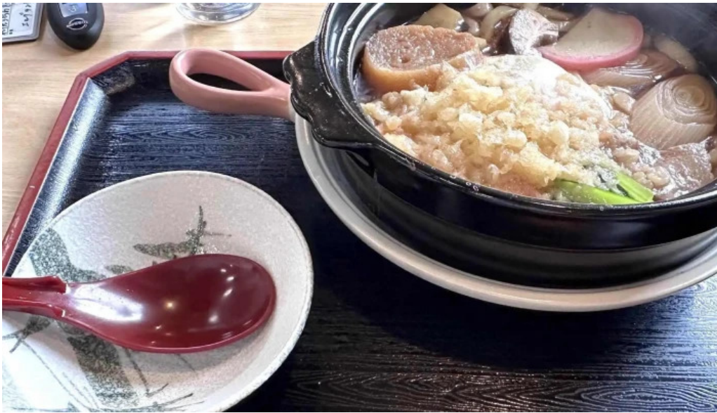
そば処 ふじた家 comentario 5