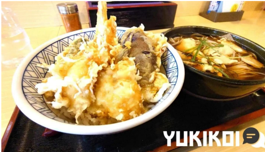
そば処 ふじた家 天ぷら