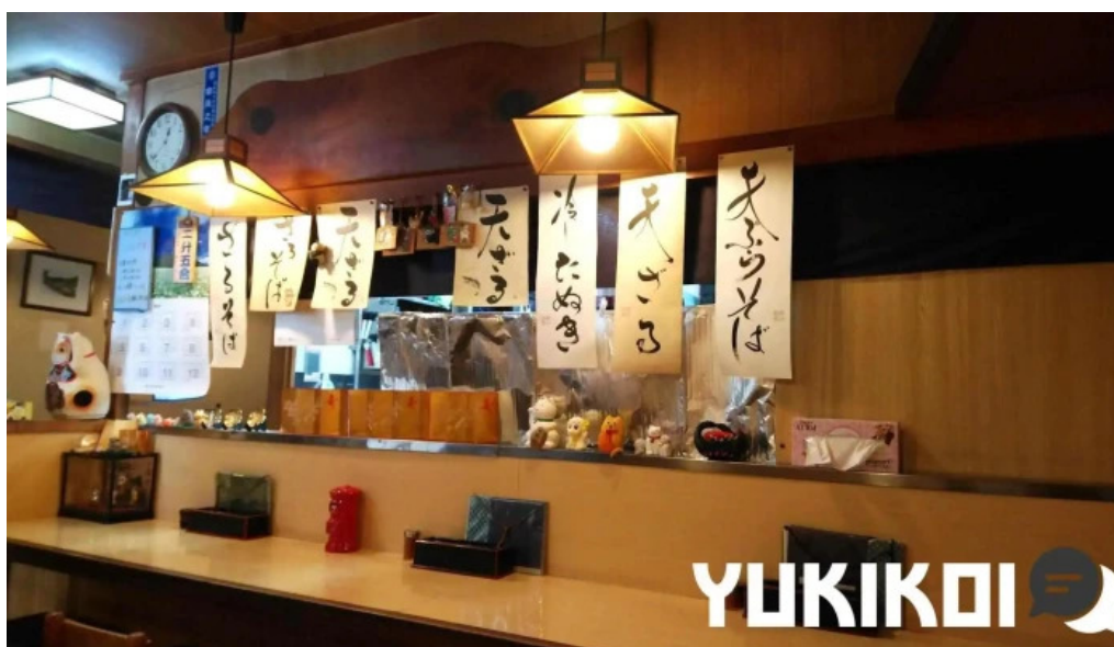
そば処 ふじた家 雰囲気