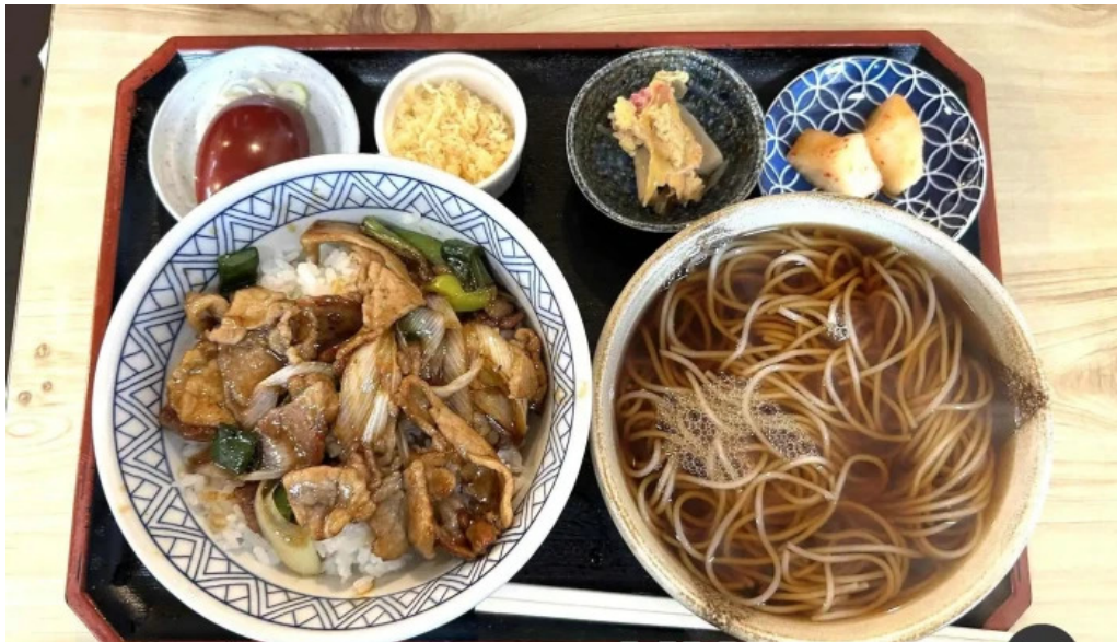
そば処 ふじた家 スープ