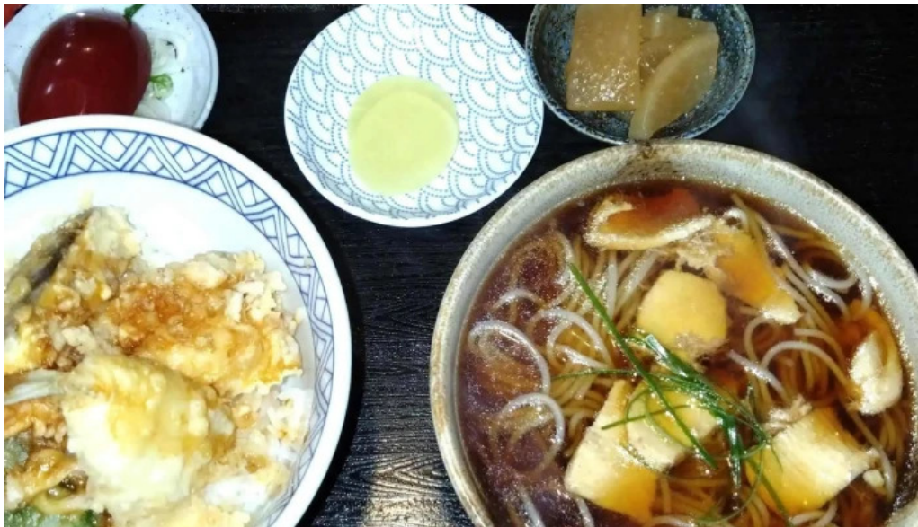
そば処 ふじた家 comentario 1