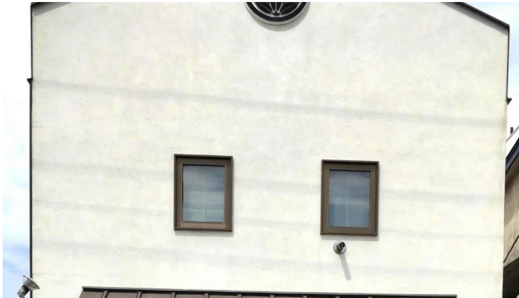
そば処 ふじた家 comentario 6