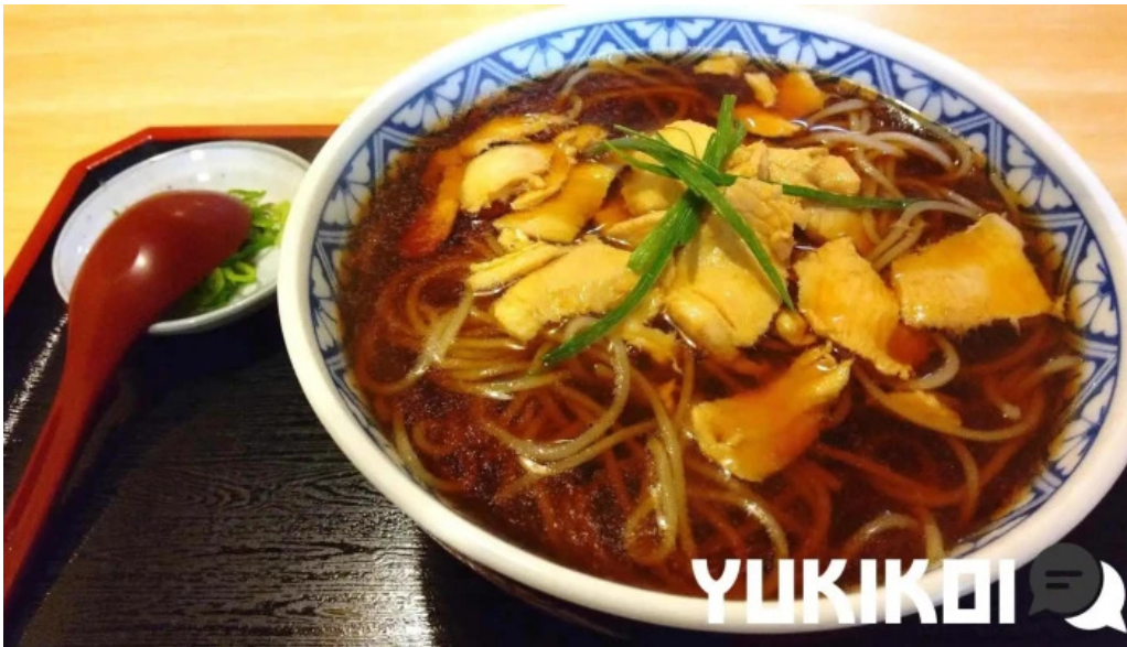
そば処 ふじた家 料理飲み物