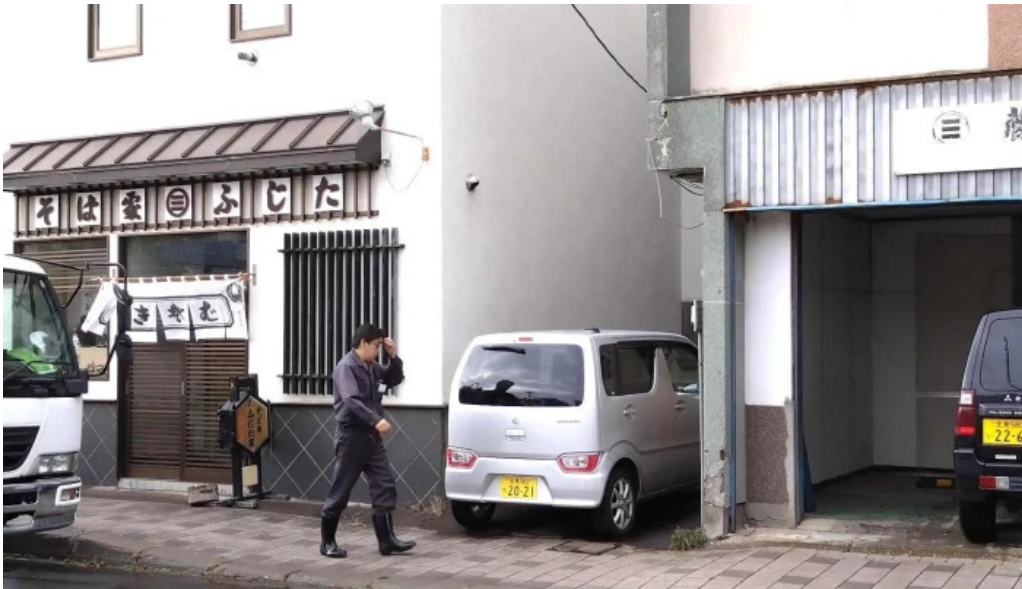
そば処 ふじた家 comentario 2