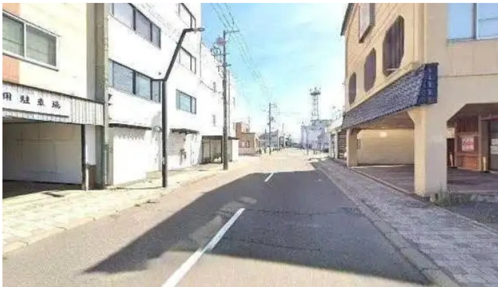
そば処 ふじた家 ストリートビューと 360 ビュー