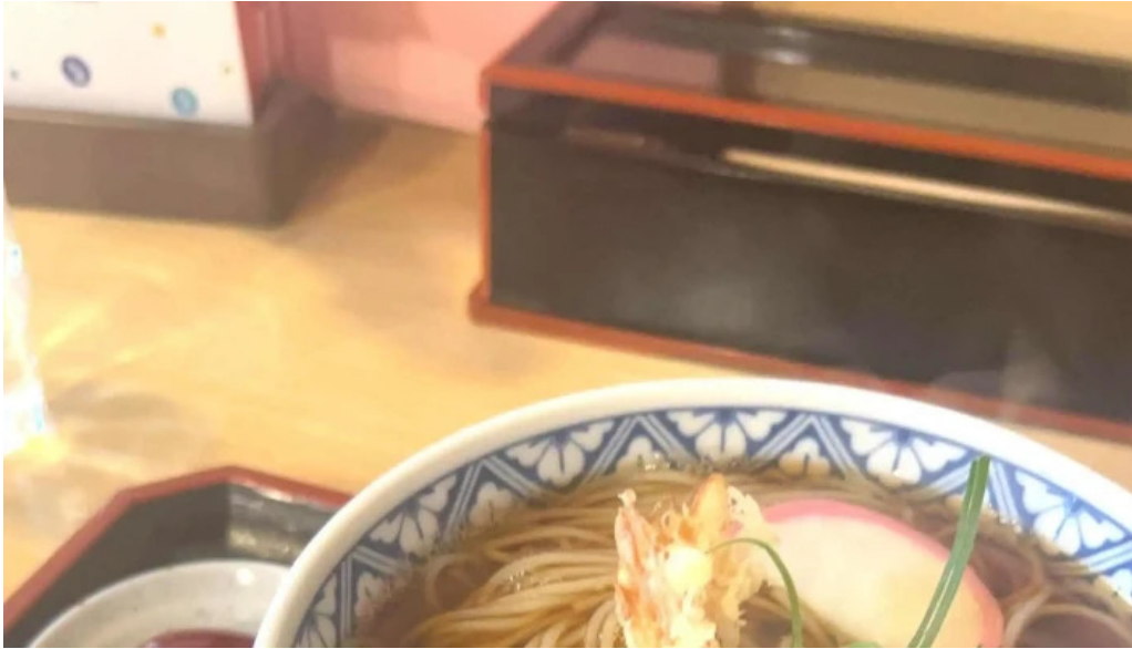
そば処 ふじた家 comentario 3