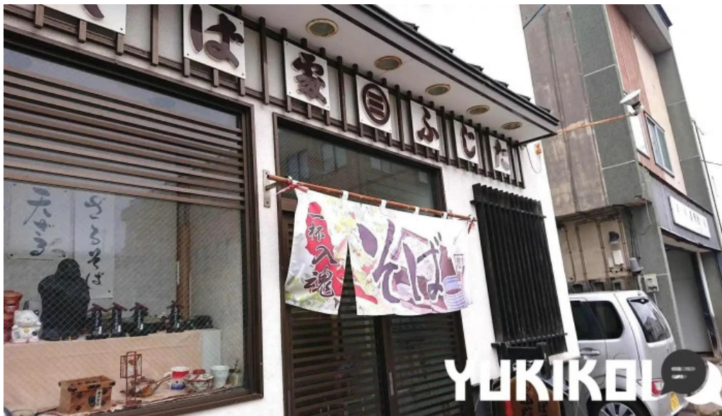
そば処 ふじた家 網走市