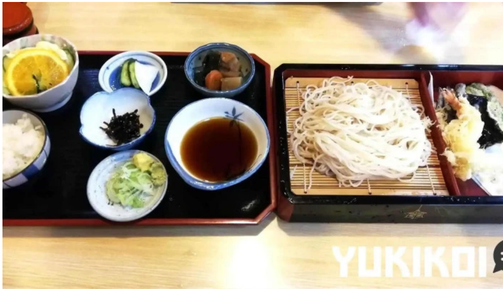
そば処 ふじた家 蕎麦