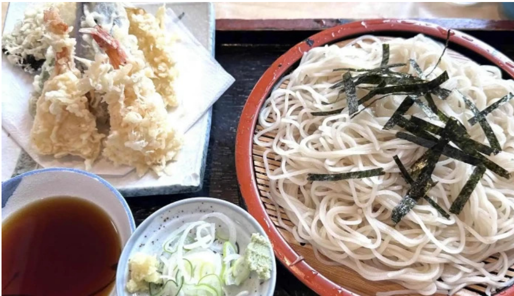
そば処 ふじた家 comentario 4