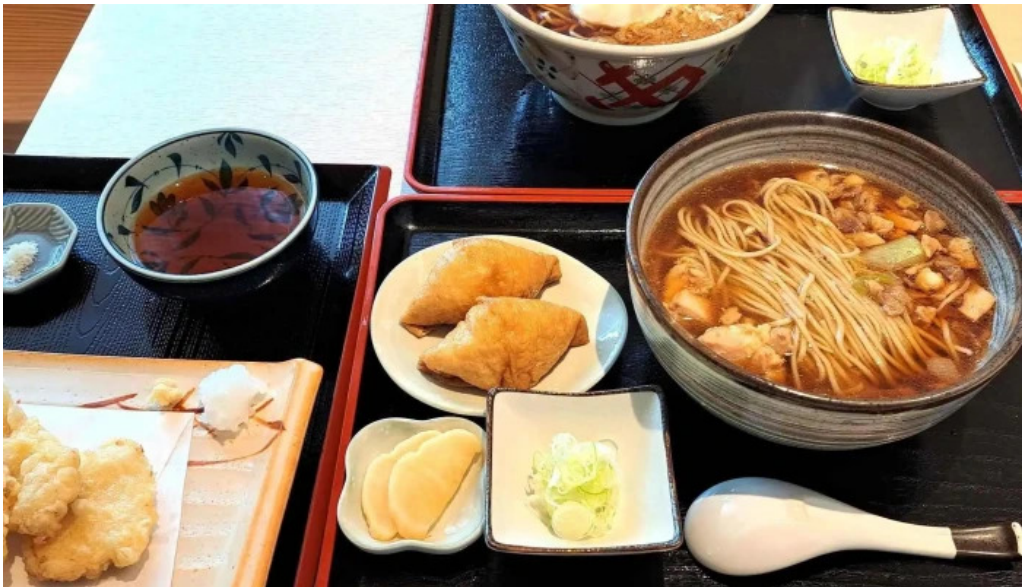
Soba 晴風 comentario 6