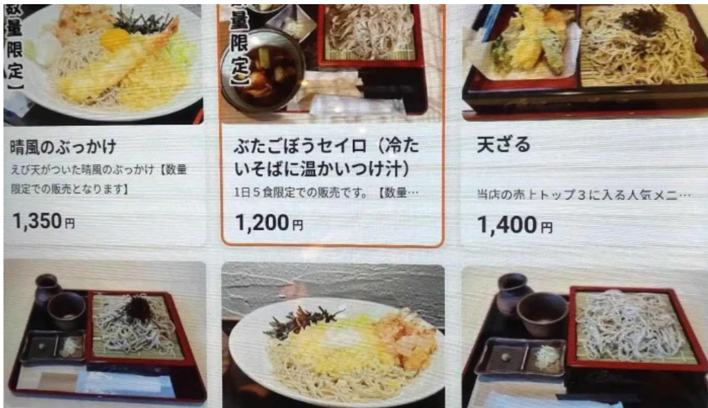
Soba 晴風 メニュー