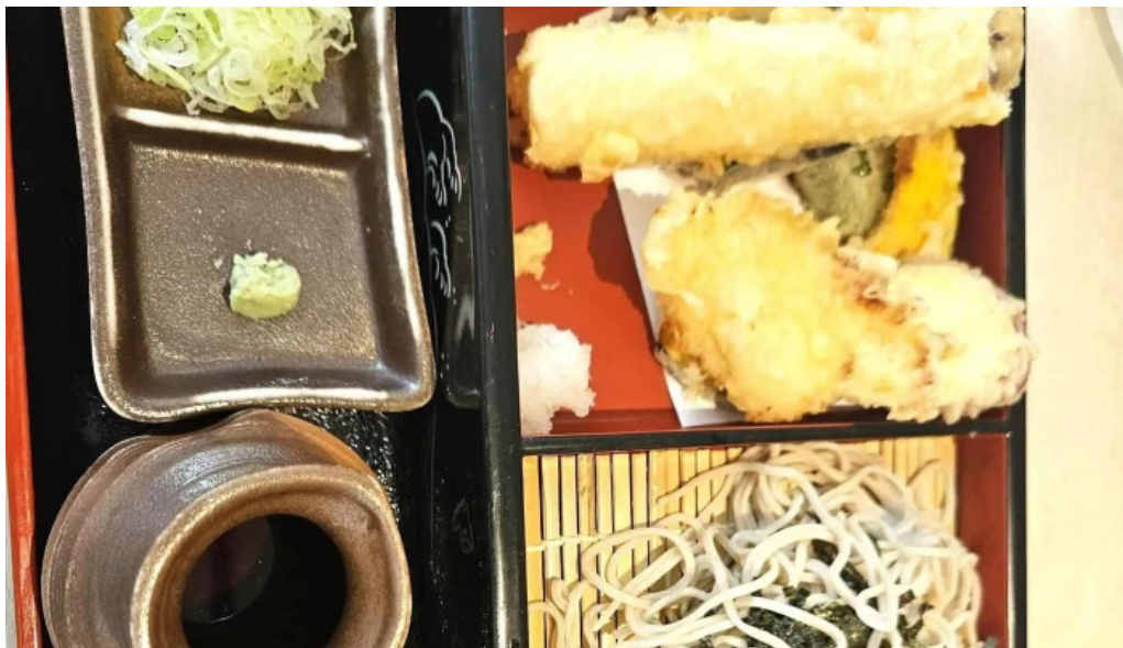
Soba 晴風 comentario 7