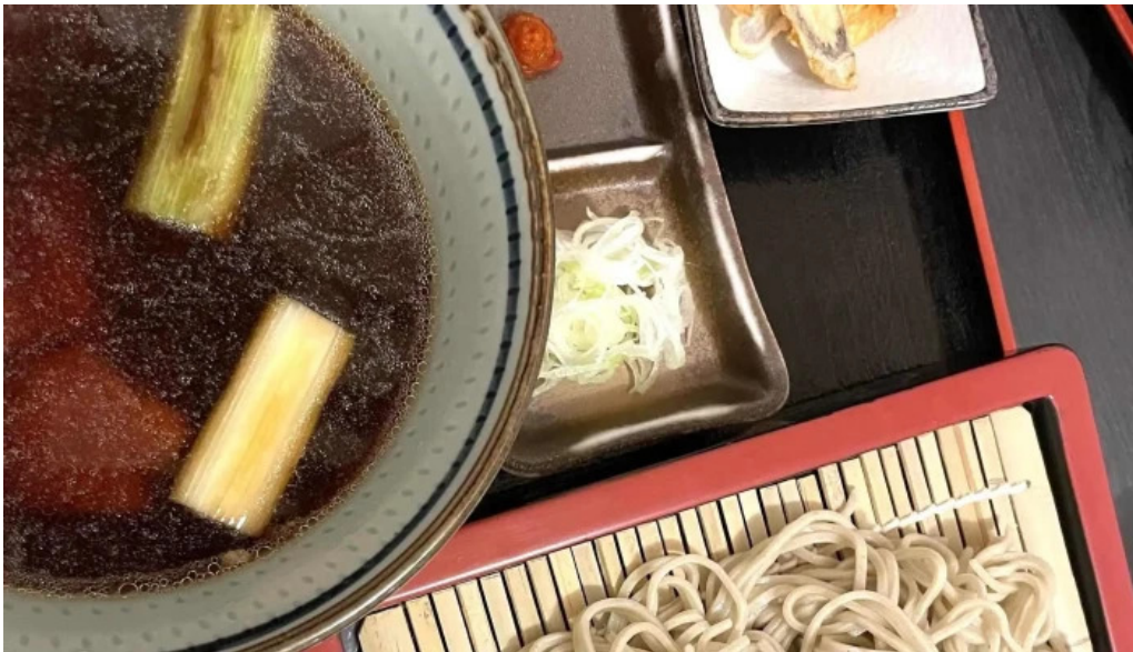
Soba 晴風 comentario 4