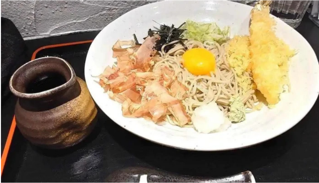
Soba 晴風 蕎麦