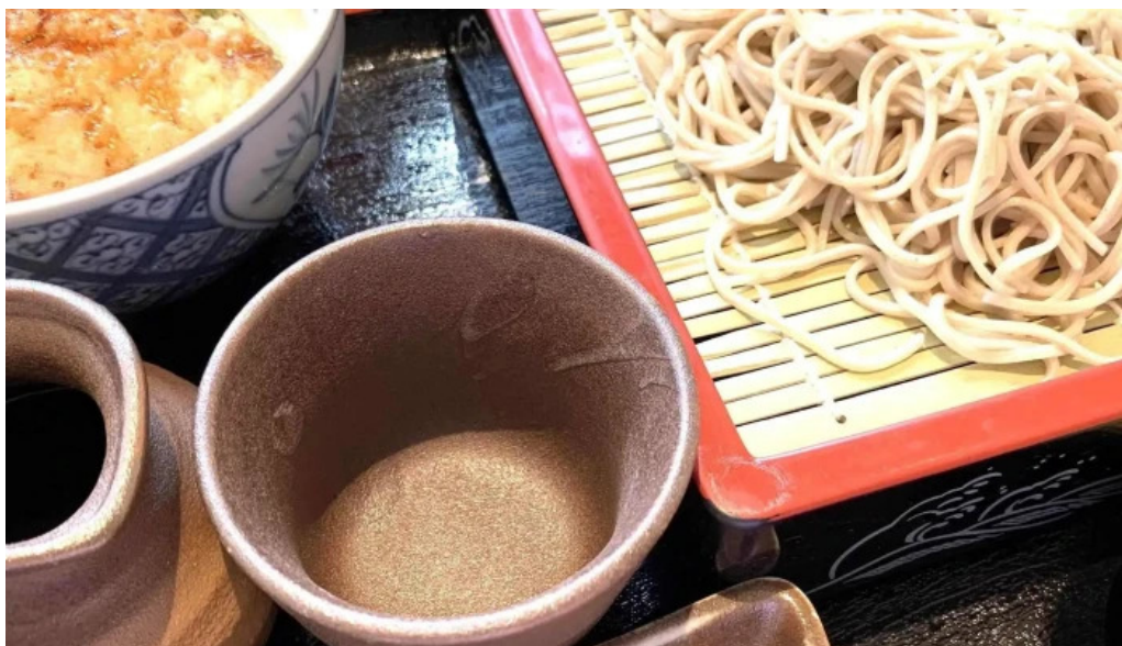
Soba 晴風 comentario 1