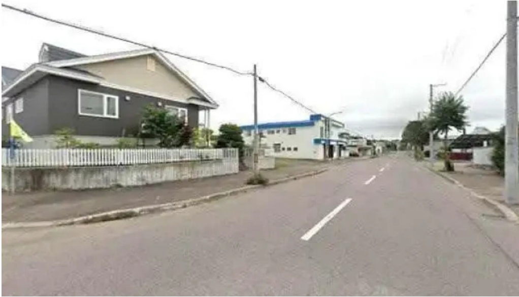
Soba 晴風 ストリートビューと 360 ビュー