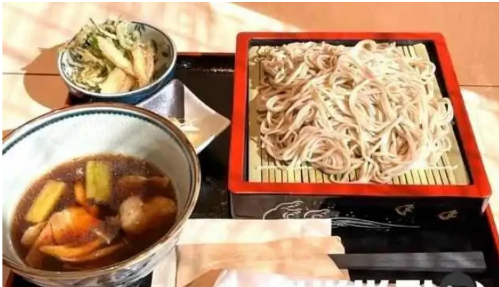
Soba 晴風 料理飲み物