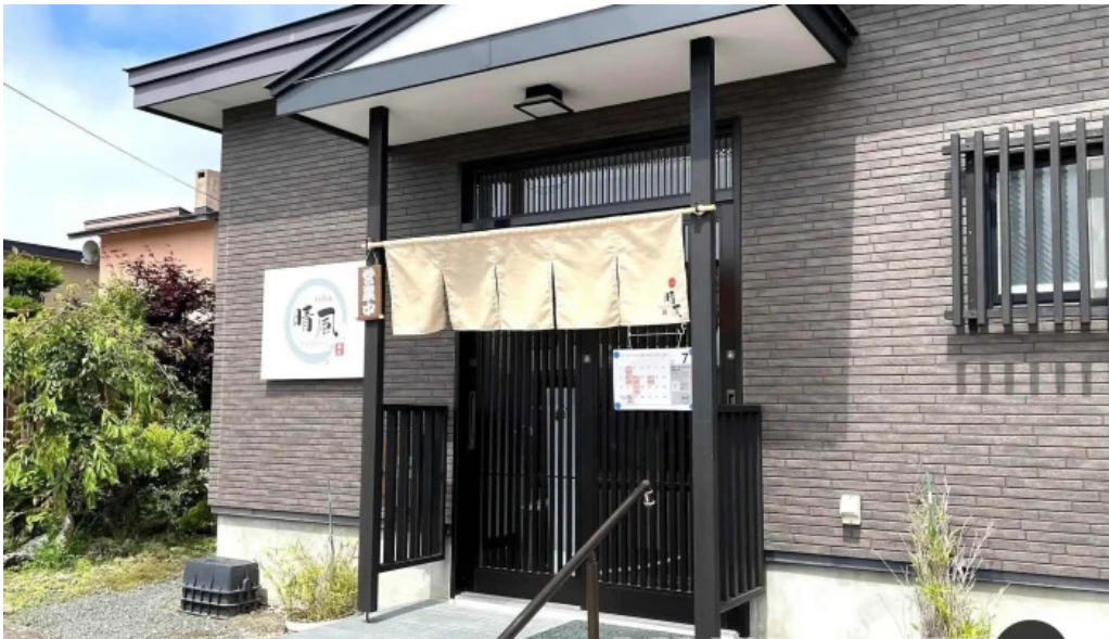
Soba 晴風