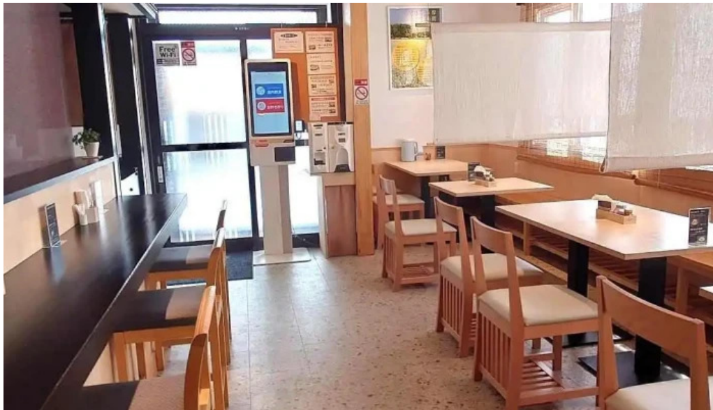
Soba 晴風 霧囿氣