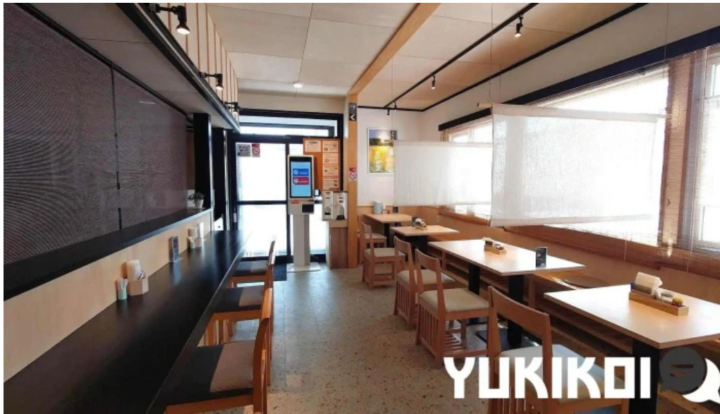
Soba 晴風 すべて