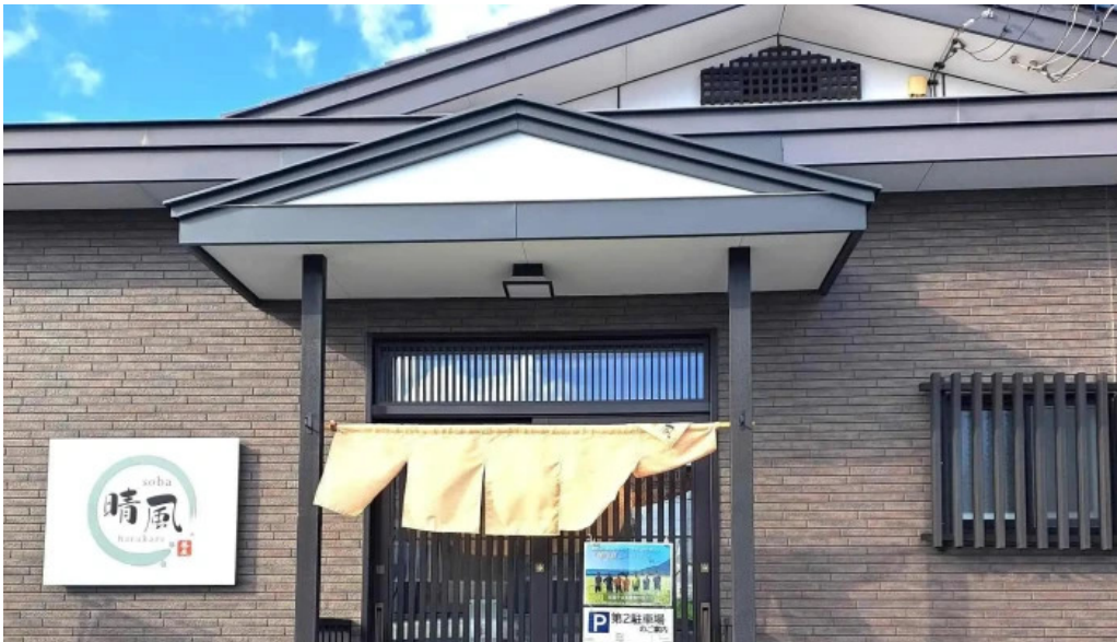
Soba 晴風 comentario 5