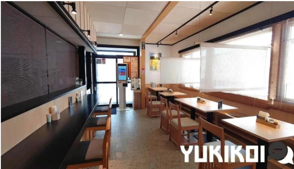
Soba 晴風 網走市