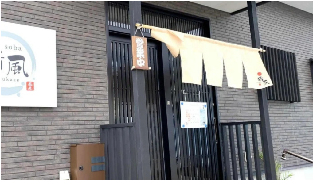
Soba 晴風 comentario 3