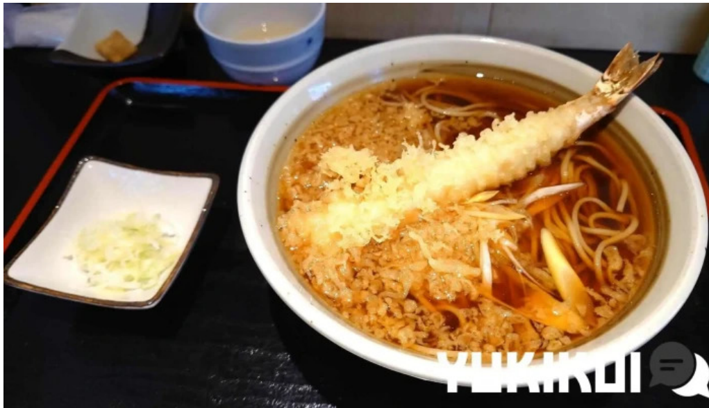
Soba 晴風 麵