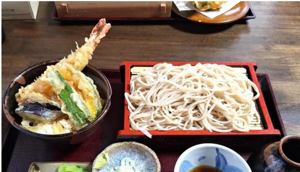
手打ちそば うえの写真