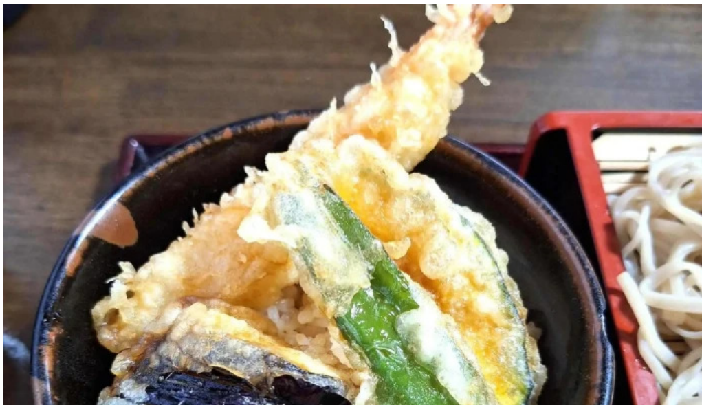
手打ちそば うえの 営業時間