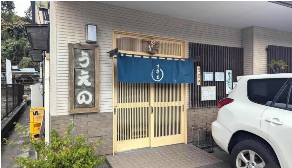
手打ちそば うえの 最新