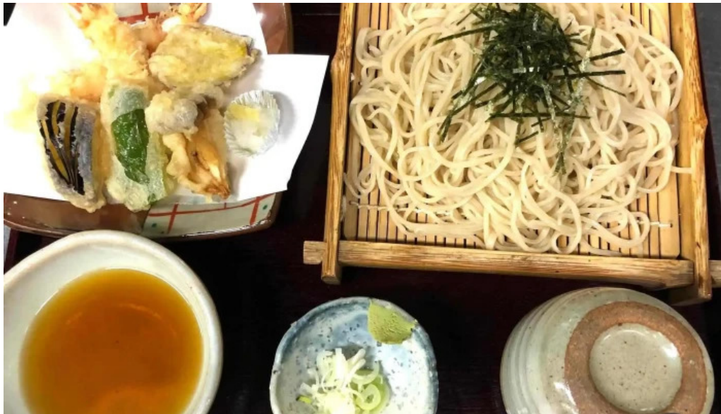
手打ちそば うえの オーナー提供