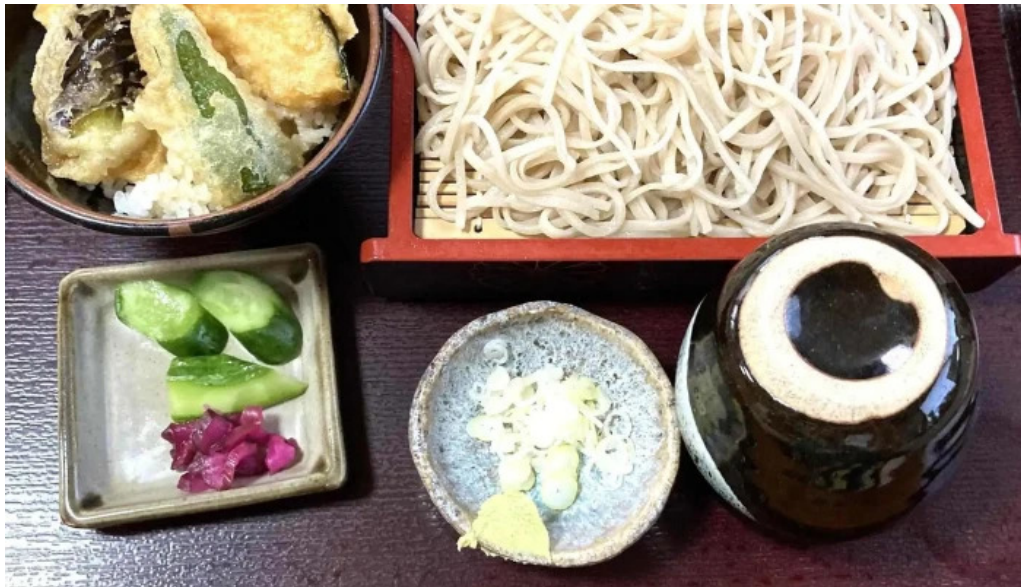
手打ちそば うえの 料金