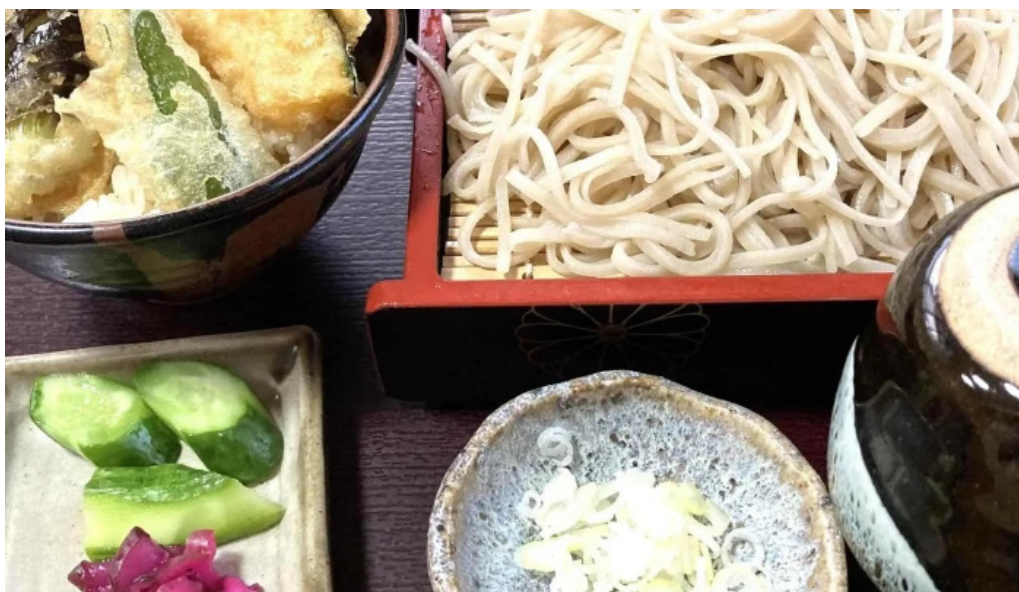
手打ちそば うえの 電話