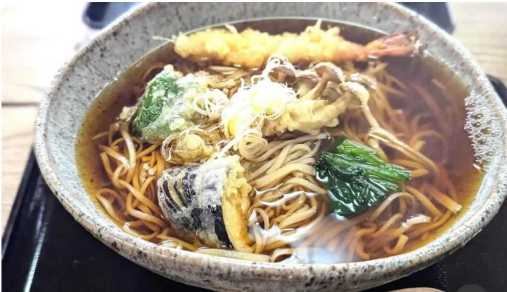
手打ちそば うえの 蕎麦