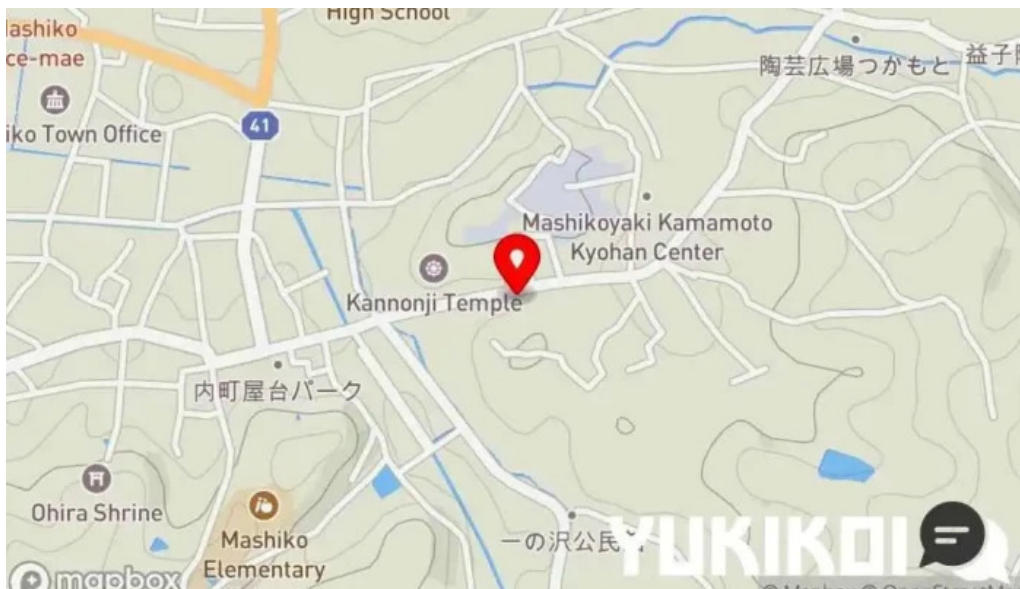
手打ちそば うえの 地図