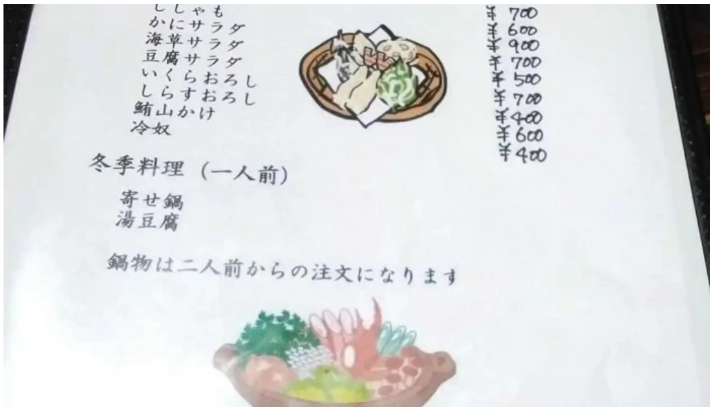
手打ちそば うえのメニュー