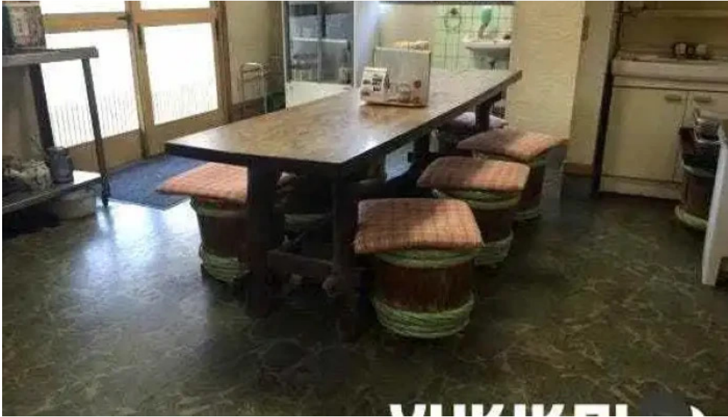
手打ちそば うえの 霧囲気