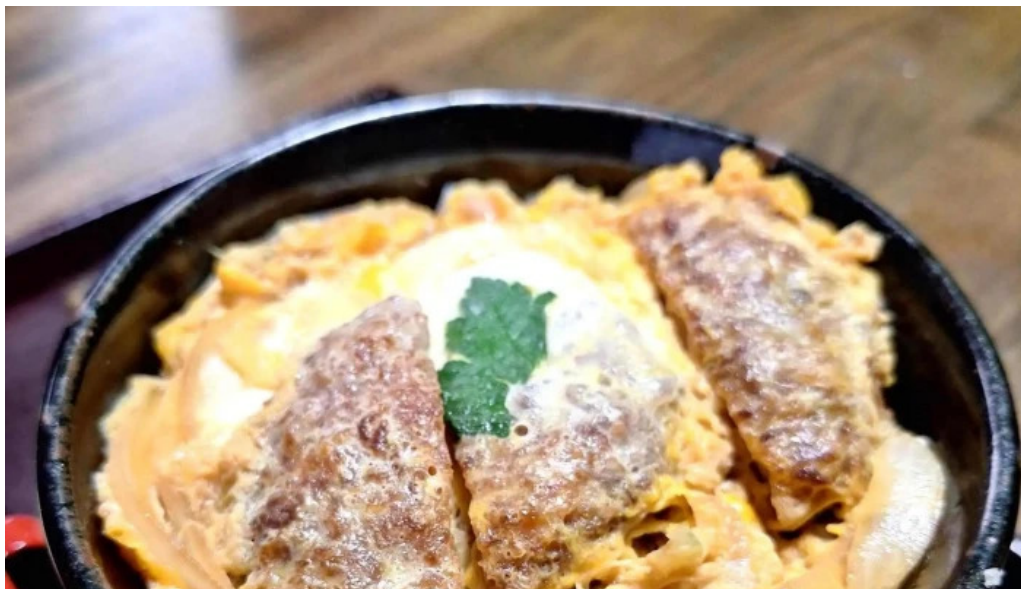
手打ちそば うえの エリア