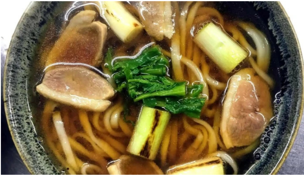
手打ちそばうえのスープ