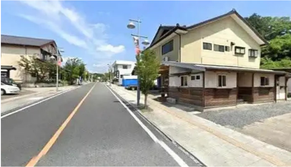
手打ちそば うえの 益子町