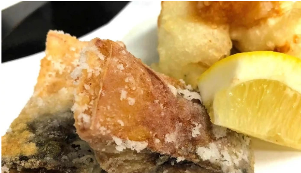
手打ちそば うえの 料理飲み物