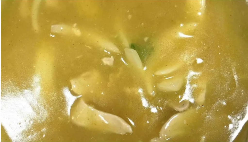
にしきそば 浜田本店 comentario 2