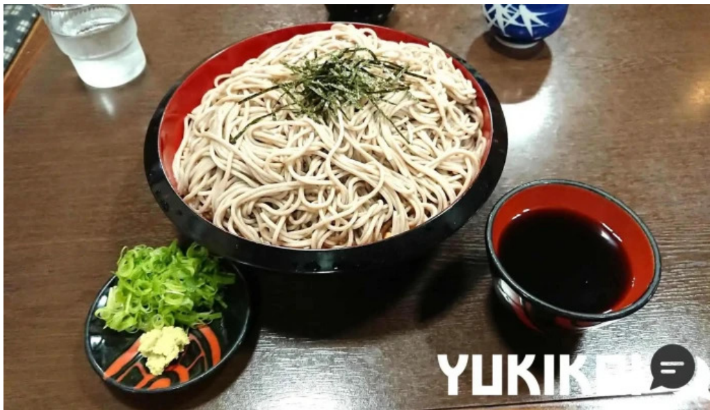
にしきそば 浜田本店 蕎麦