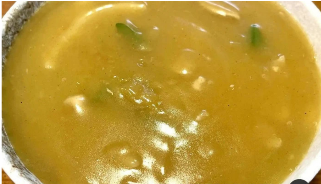
にしきそば 浜田本店 スープ