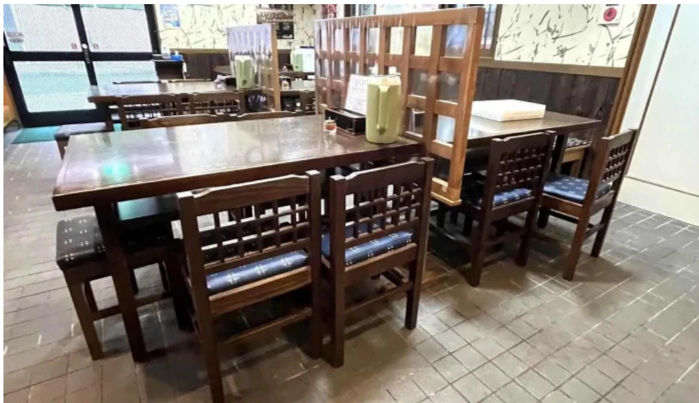
にしきそば 浜田本店 雰囲気