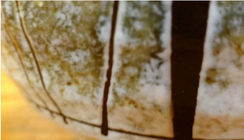
にしきそば 浜田本店 comentario 3