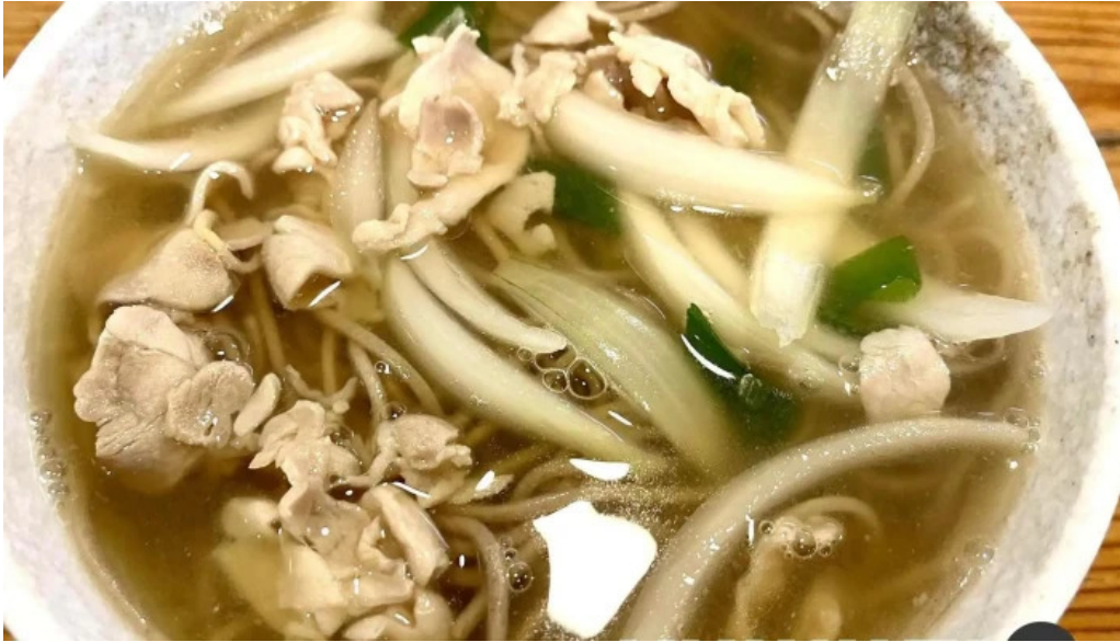
にしきそば 浜田本店 うどん