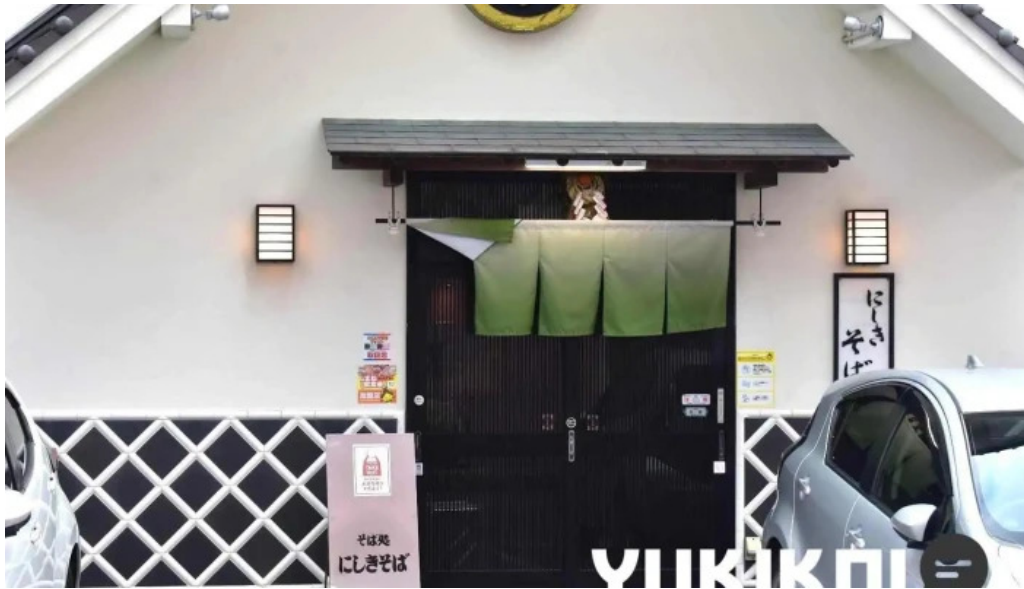
にしきそば 浜田本店 浜田市