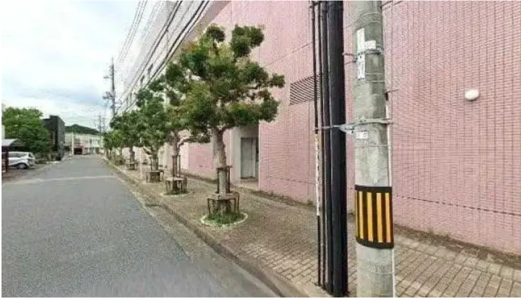
にしきそば 浜田本店 ストリートビューと 360 ビュー