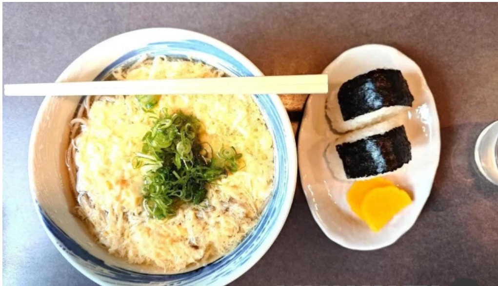
にしきそば 浜田本店 雑炊