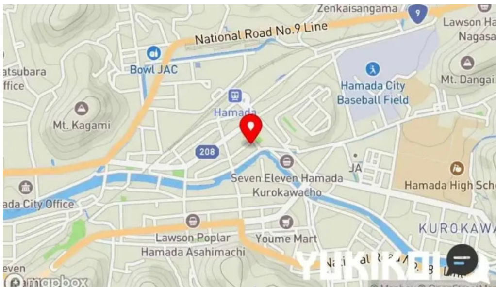
にしきそば 浜田本店地図