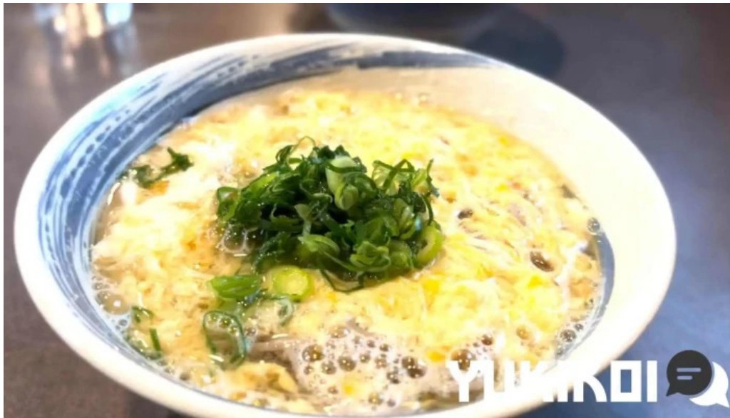
にしきそば 浜田本店 料理飲み物