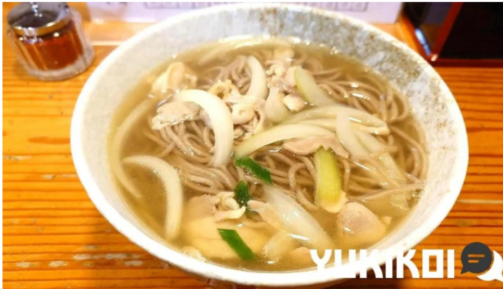
にしきそば 浜田本店 麺