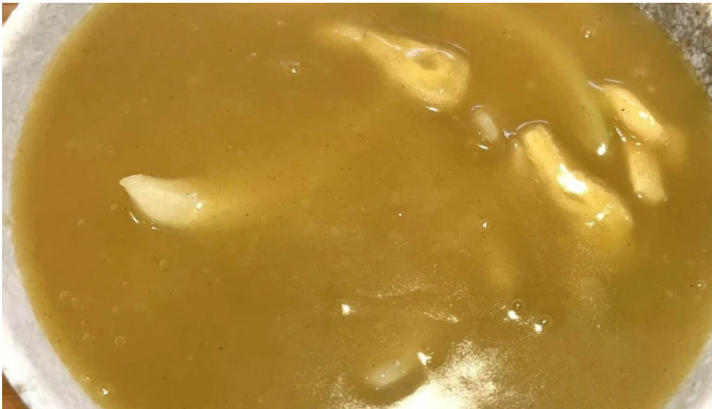
にしきそば 浜田本店 comentario 1