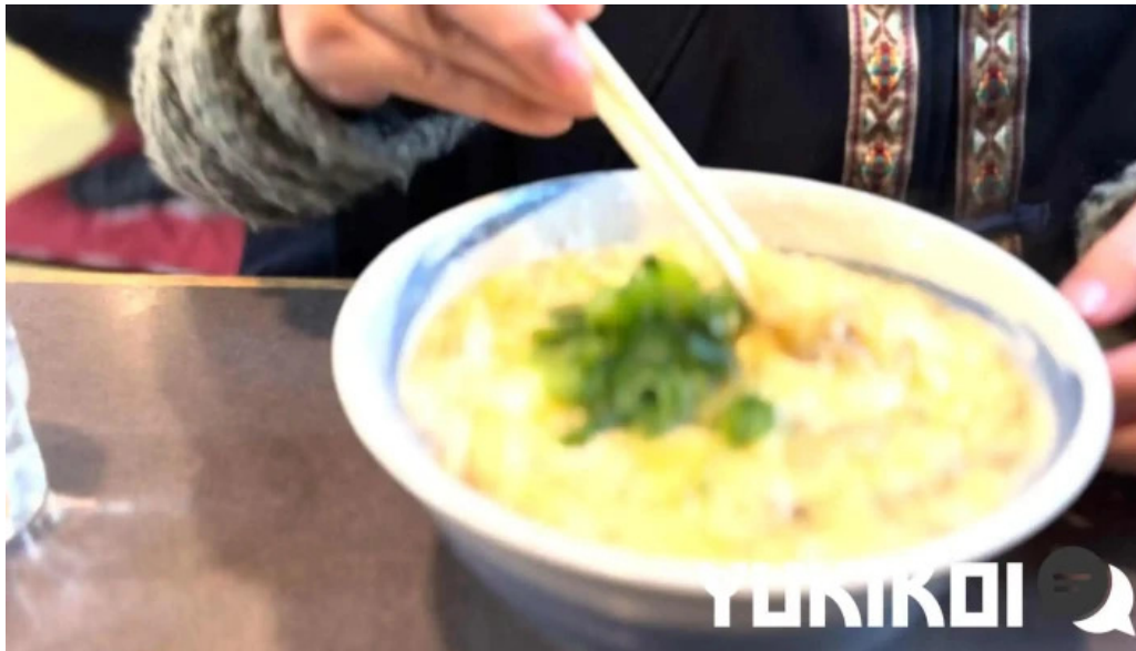
にしきそば 浜田本店 動画