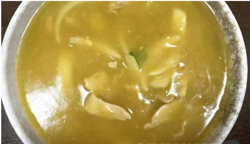
にしきそば 浜田本店 最新