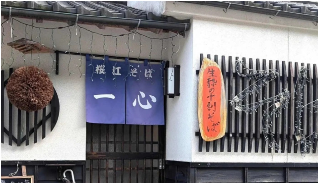
桜江そば 一心 comentario 2