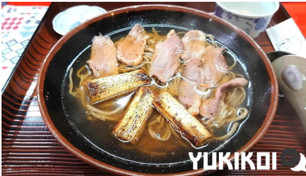
桜江そば 一心 料理飲み物