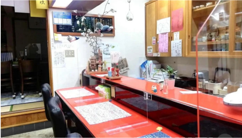
桜江そば 一心 雰囲気