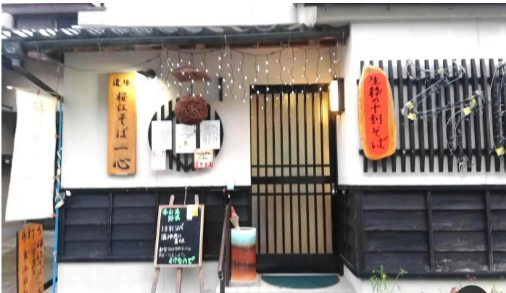
桜江そば 一心 すべて