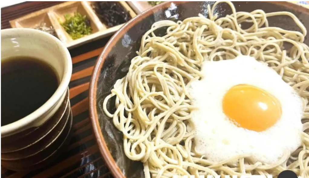
桜江そば 一心 蕎麦