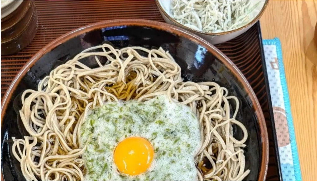
桜江そば 一心 comentario 3