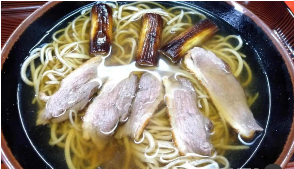
桜江そば 一心 ラーメン