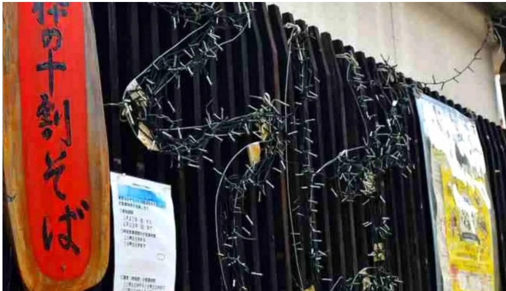
桜江そば 一心 comentario 6