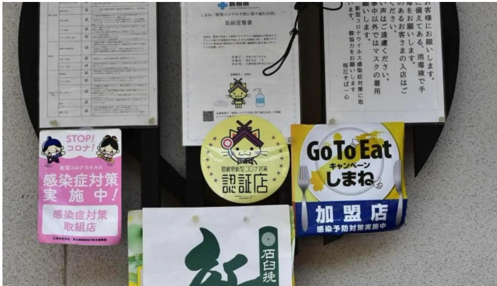
桜江そば 一心 comentario 7