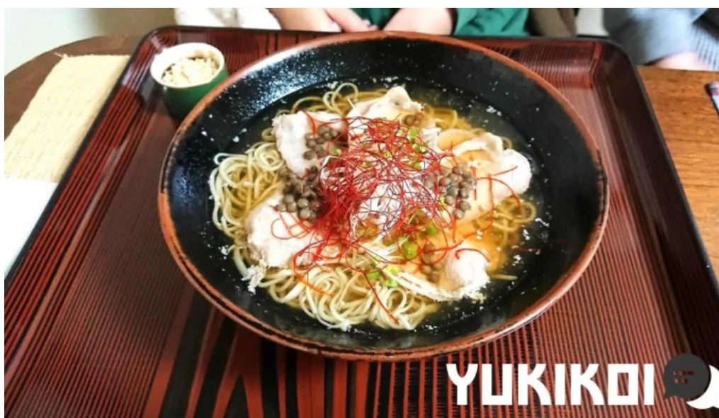
桜江そば 一心 麺