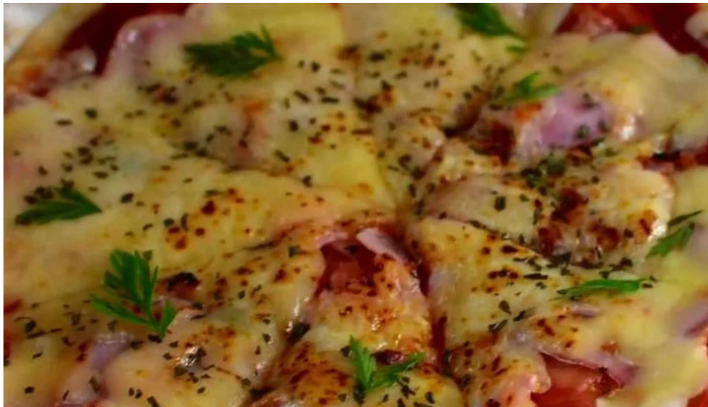
桜江そば 一心 comentario 4