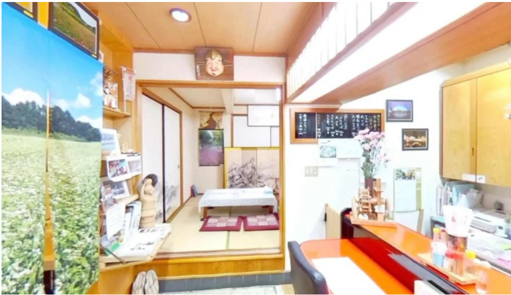
桜江そば 一心 ストリートビューと 360 ビュー