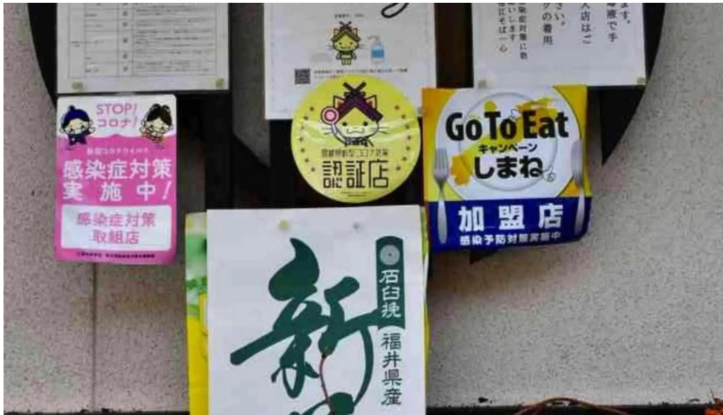
桜江そば 一心 comentario 5