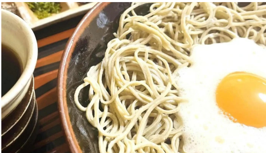
桜江そば 一心 comentario 1