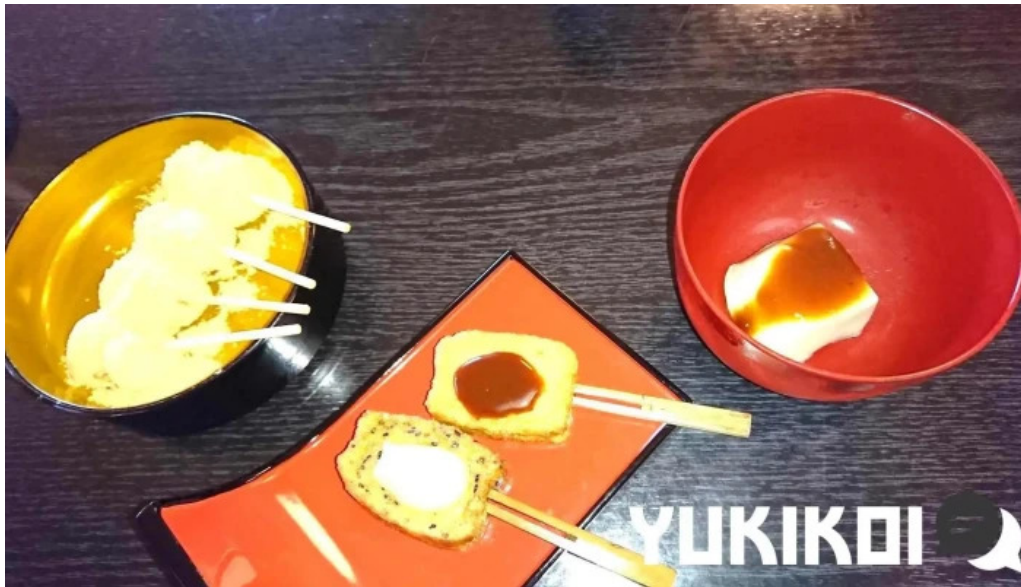
永平寺の館 雲粹 フラン