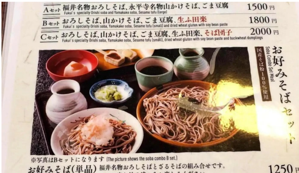
永平寺の館 雲粹 メニュー