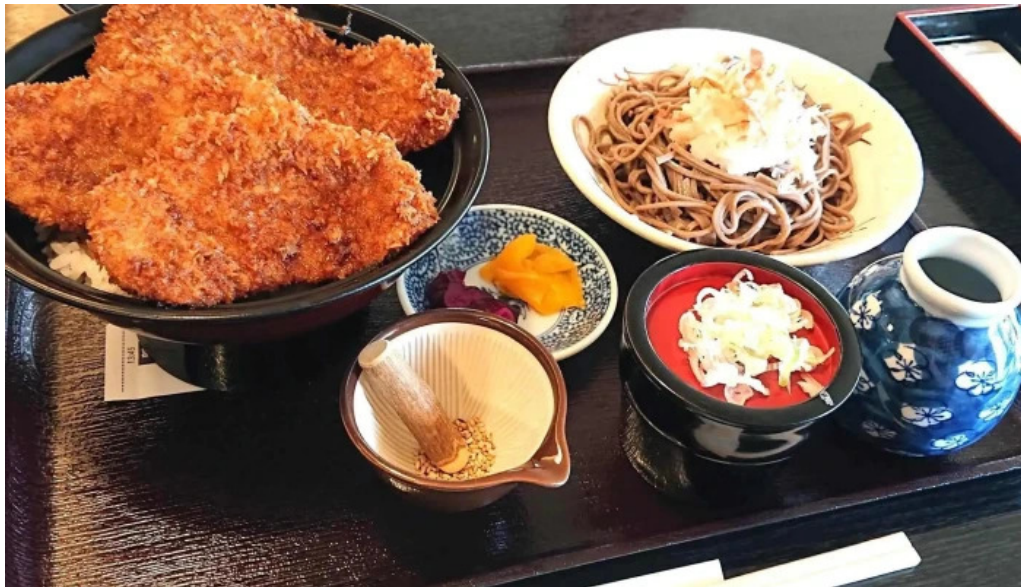
永平寺の館 雲粋 comentario 1