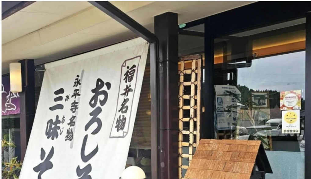
永平寺の館 雲粋 comentario 5