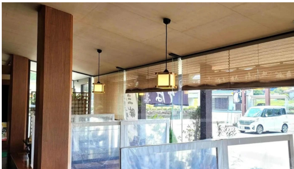
永平寺の館 雲粹 霧田気