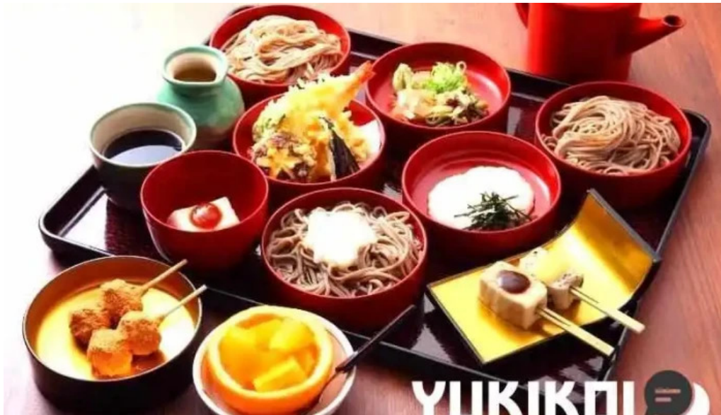
永平寺の館 雲粹 料理飲み物