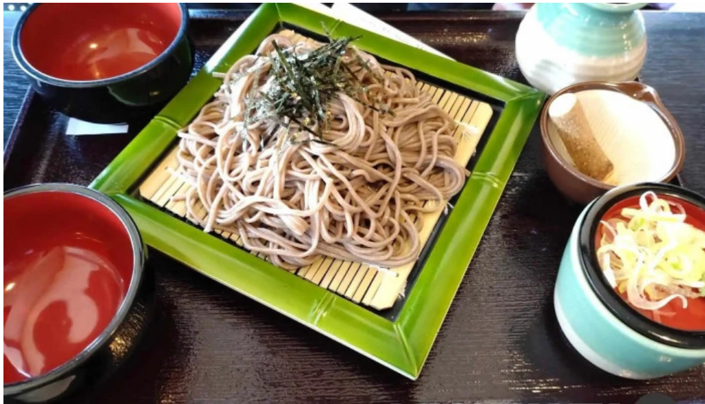
永平寺の館 雲粹 蕎麦