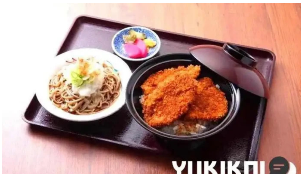
永平寺の館 雲粹 豚カツ