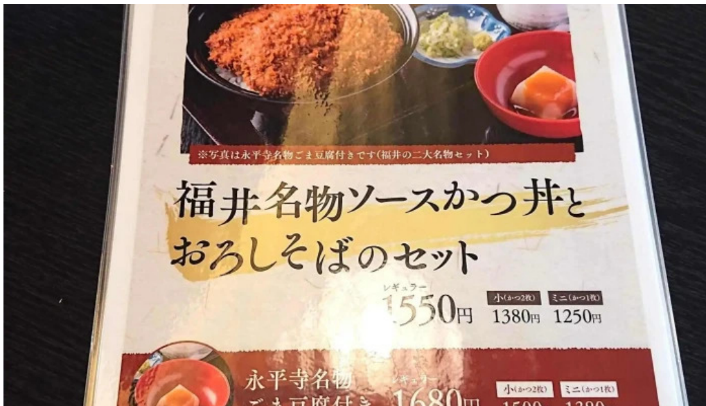
永平寺の館 雲粋 comentario 4