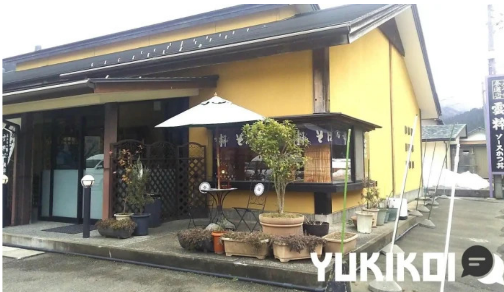
永平寺の館 雲粹 すべて