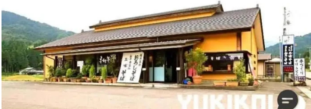
永平寺の館 雲粹 オーナー提供