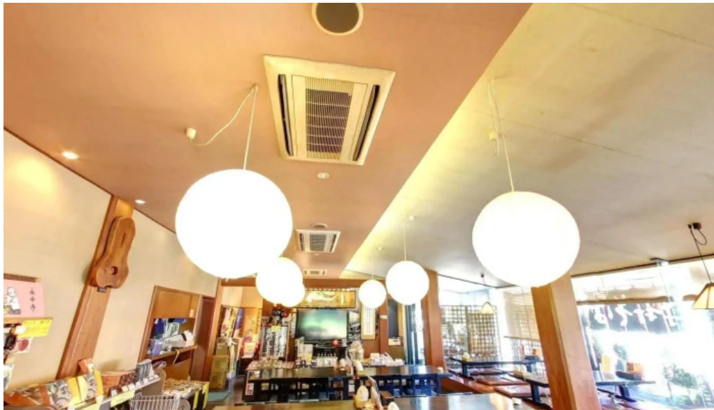
永平寺の館 雲粹 ストリートビューと 360 ビュー