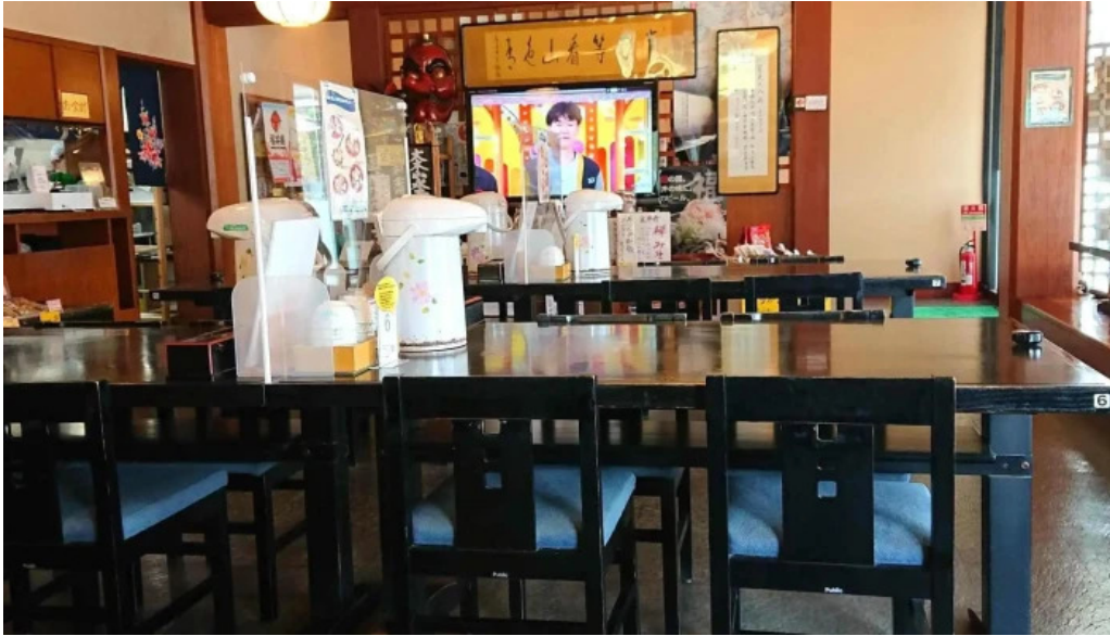
永平寺の館 雲粋 comentario 3