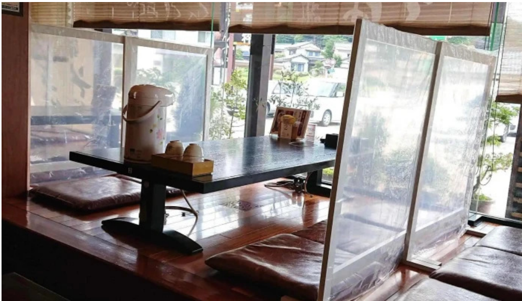
永平寺の館 雲粋 comentario 2