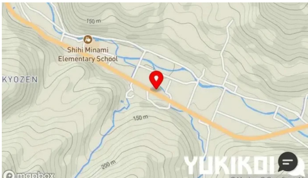
永平寺の館 雲粹地図