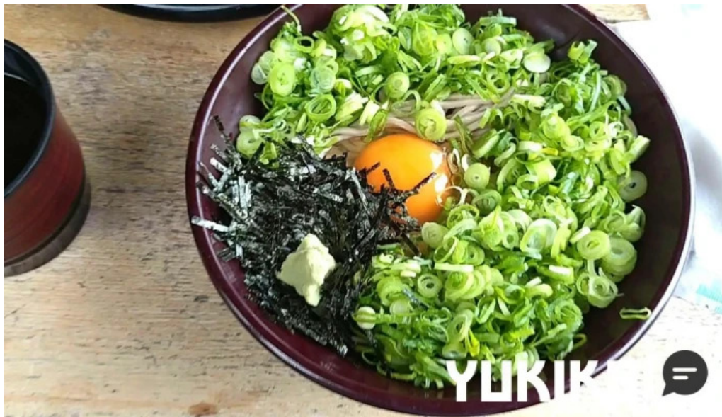
荒神の里 笠そば 蕎麦