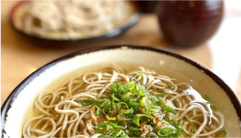
荒神の里 笠そば 料理飲み物