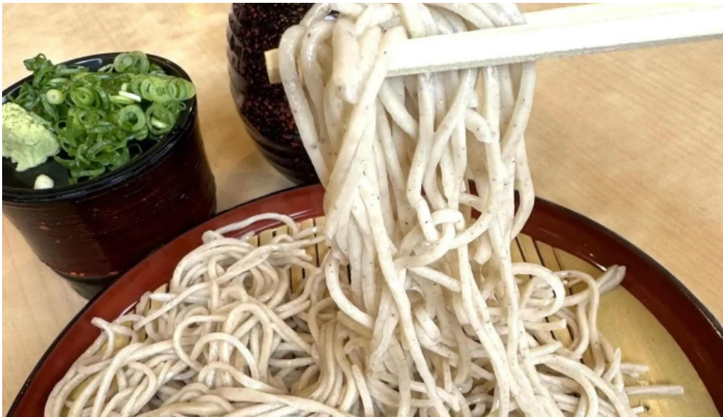
荒神の里 笠そば 営業中