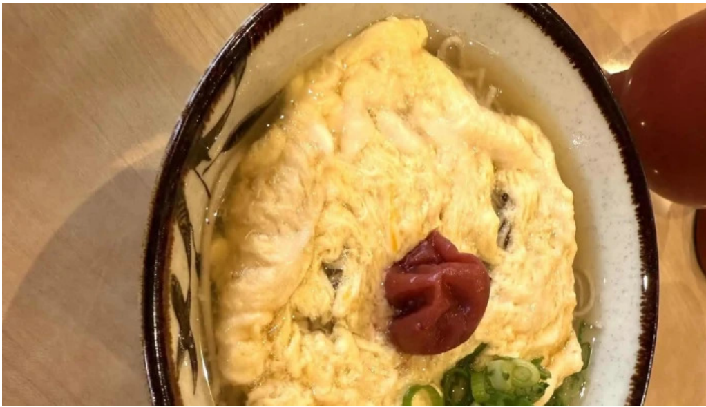
荒神の里 笠そば ロコミ