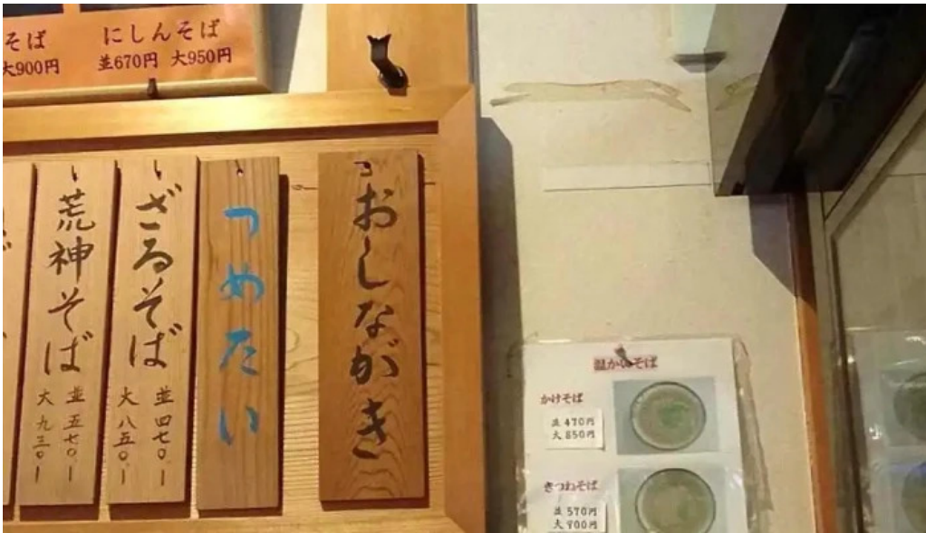
荒神の里 笠そば 動画