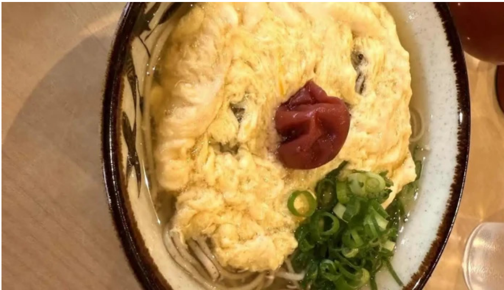
荒神の里 笠そば 最新