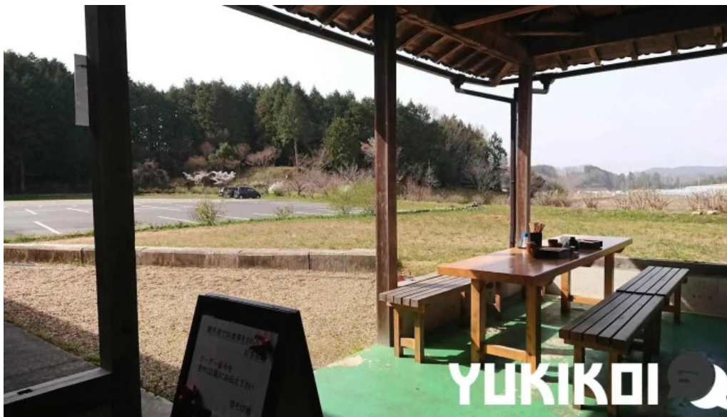
荒神の里 笠そば 雰囲気