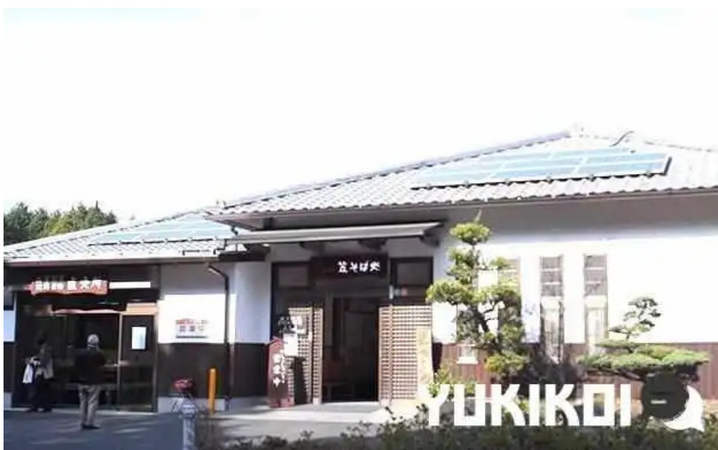
荒神の里 笠そば