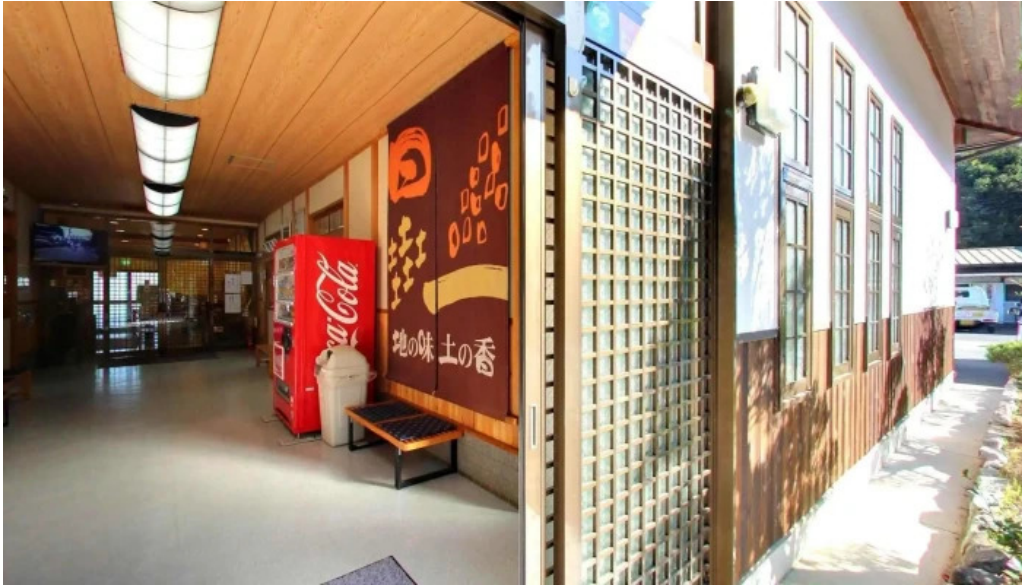
荒神の里 笠そば 桜井市