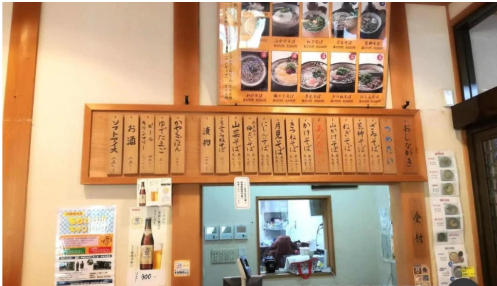
荒神の里 笠そば メニュー