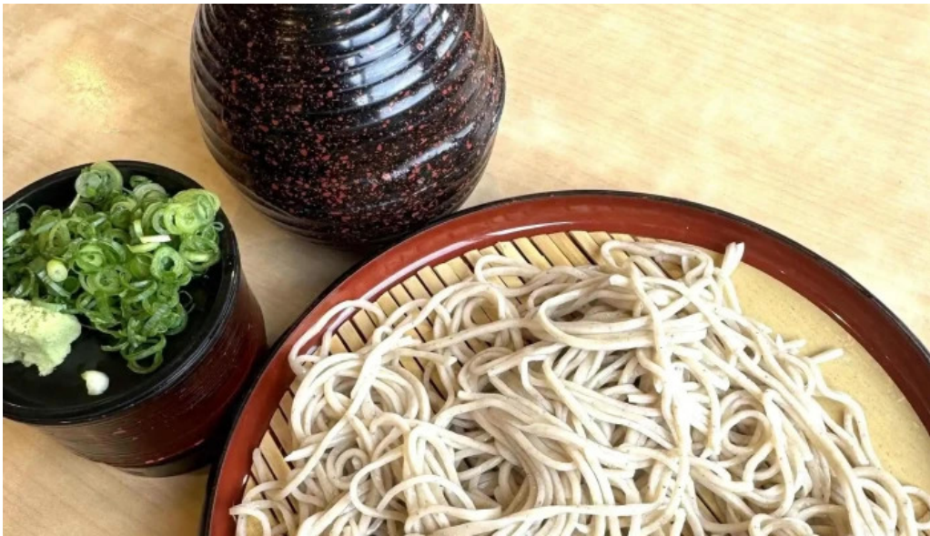
荒神の里 笠そば 所在地