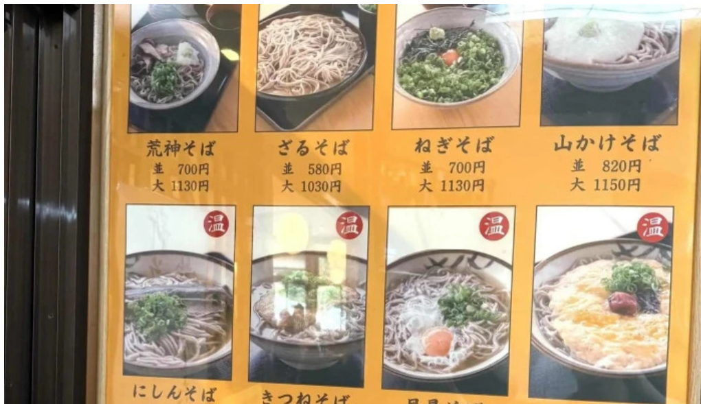
荒神の里 笠そば 行き方