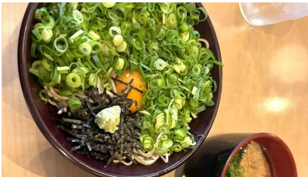
荒神の里 笠そば カタログ