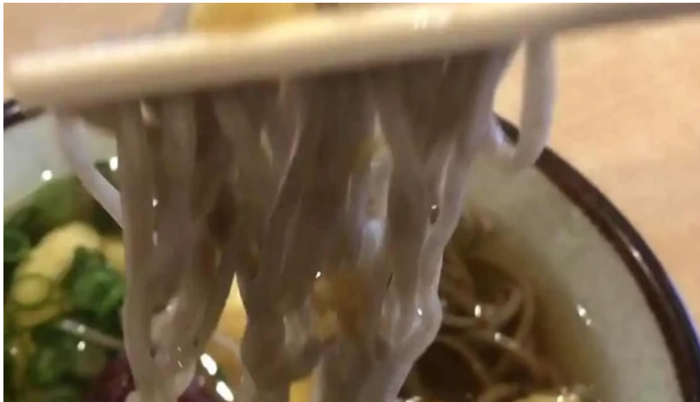
荒神の里 笠そば スープ