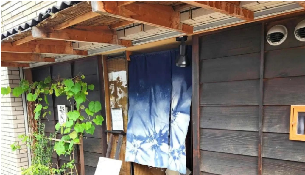
手打ちそばしゅう 口コミ