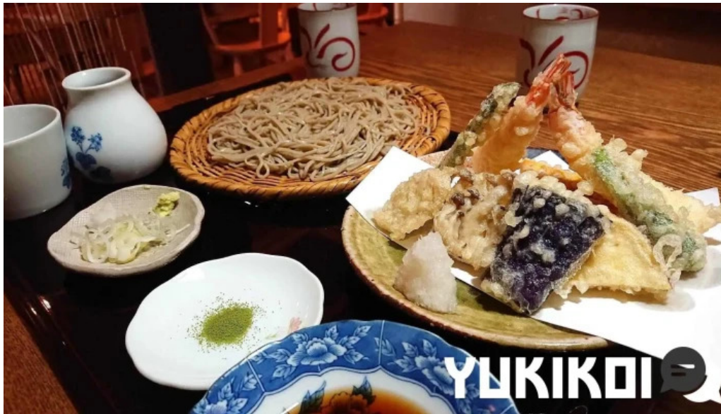
手打ちそばしゅう 蕎麦