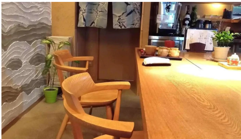
手打ちそばしゅう 雰囲気