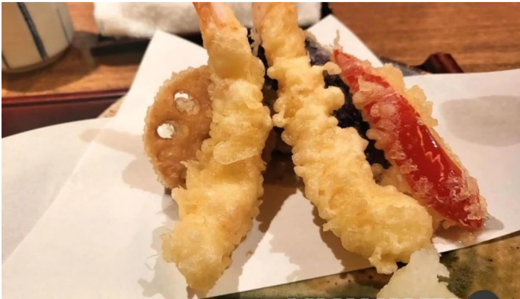
手打ちそばしゅう 天ぷら