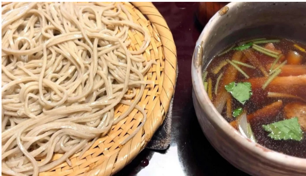
手打ちそばしゅう 番号