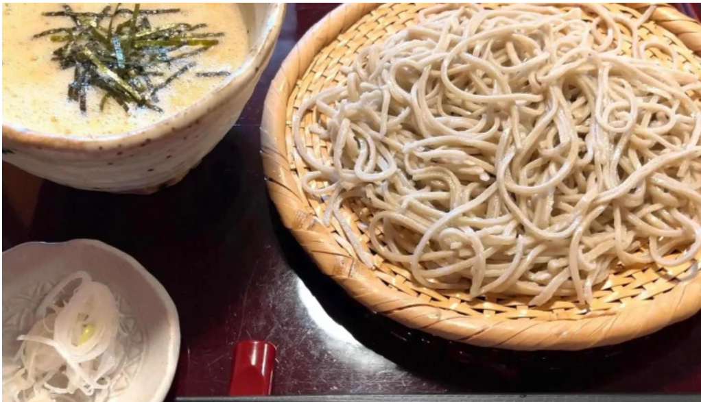
手打ちそばしゅう住所