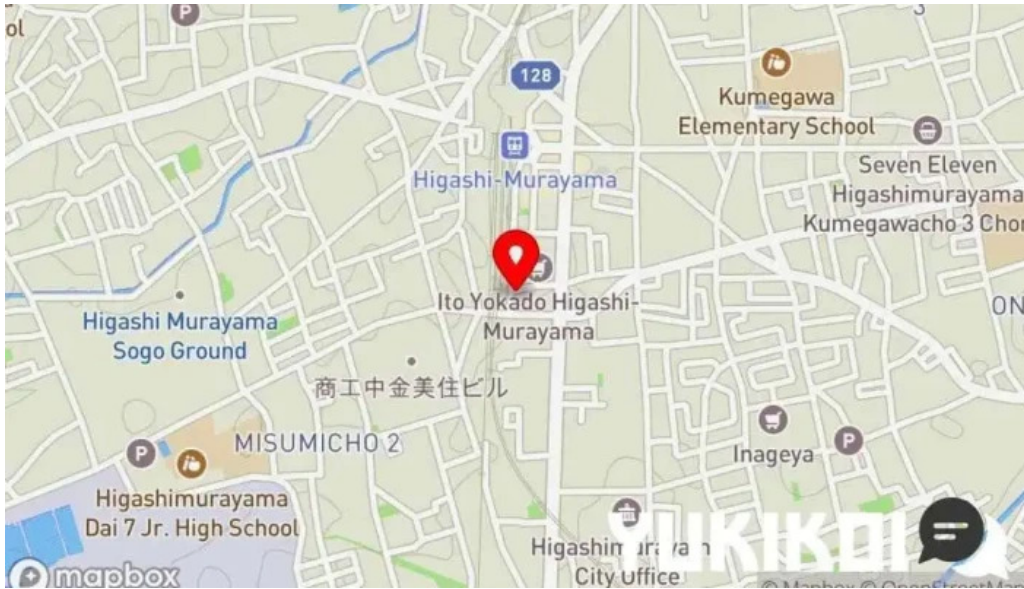
手打ちそばしゅう 地図