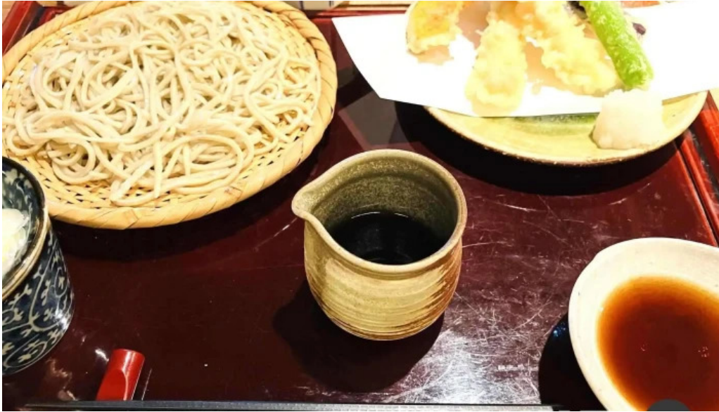
手打ちそばしゅう 料理飲み物