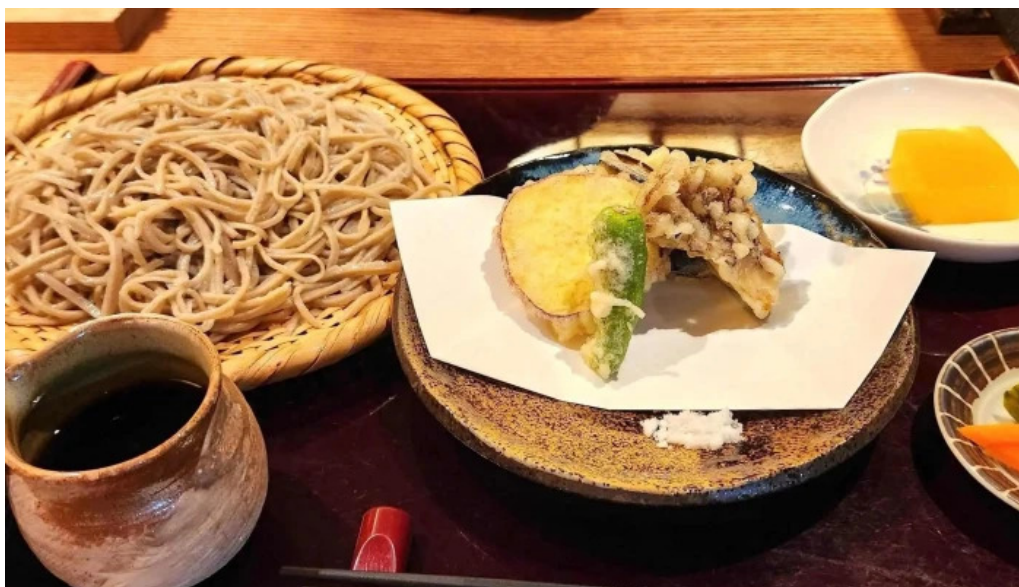
手打ちそば しゅう ウェブサイト