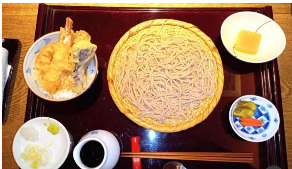
手打ちそばしゅう 麺