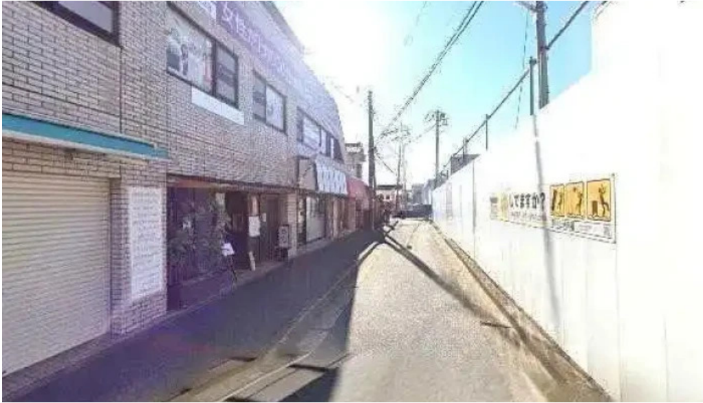
手打ちそばしゅう 東村山市