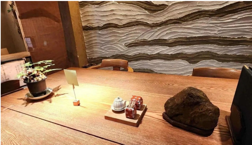
手打ちそばしゅう 料金