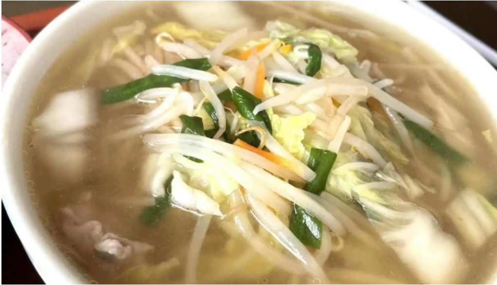
八山庵 料理飲み物