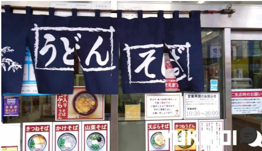
桃中軒 御殿場駅構内そば店 西口 動画