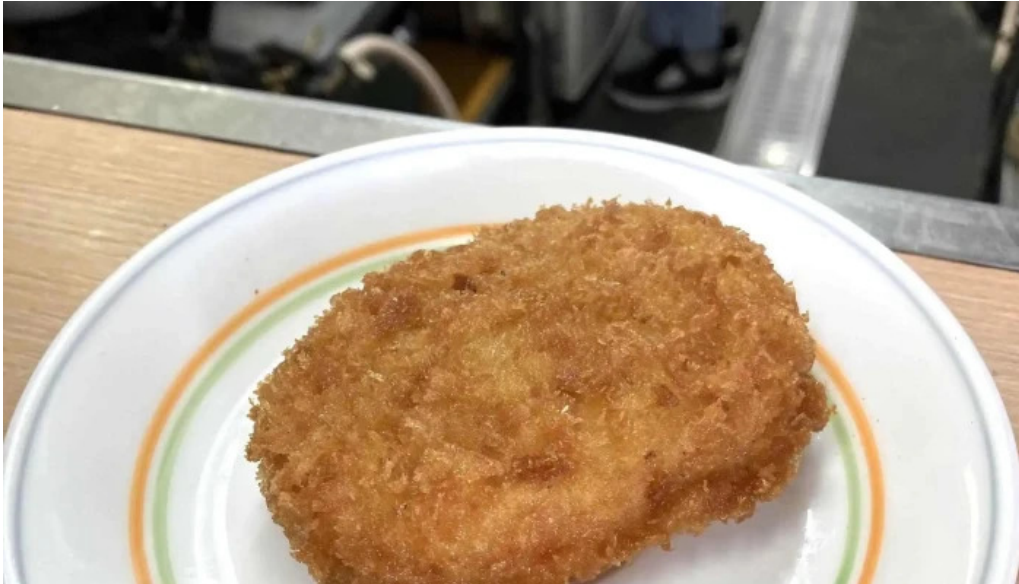
桃中軒 御殿場駅構内そば店 西口 instagram