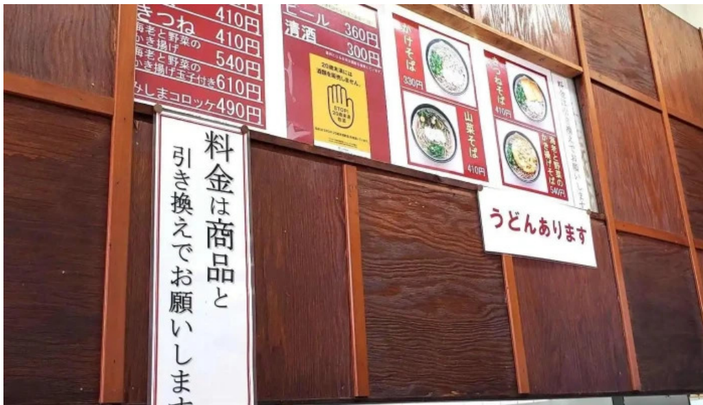
桃中軒 御殿場駅構内そば店 西口 メニュー