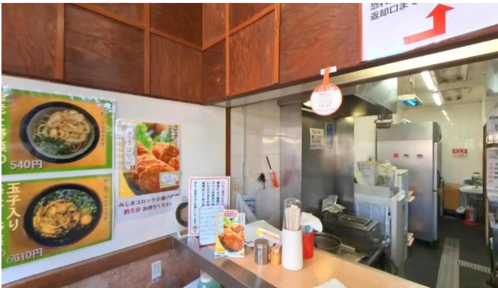
桃中軒 御殿場駅構内そば店 西口 御殿場市