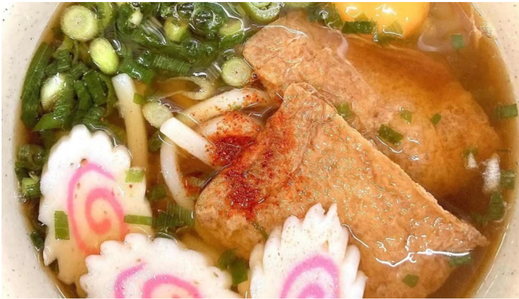
桃中軒 御殿場駅構内そば店 西口 プロモーション