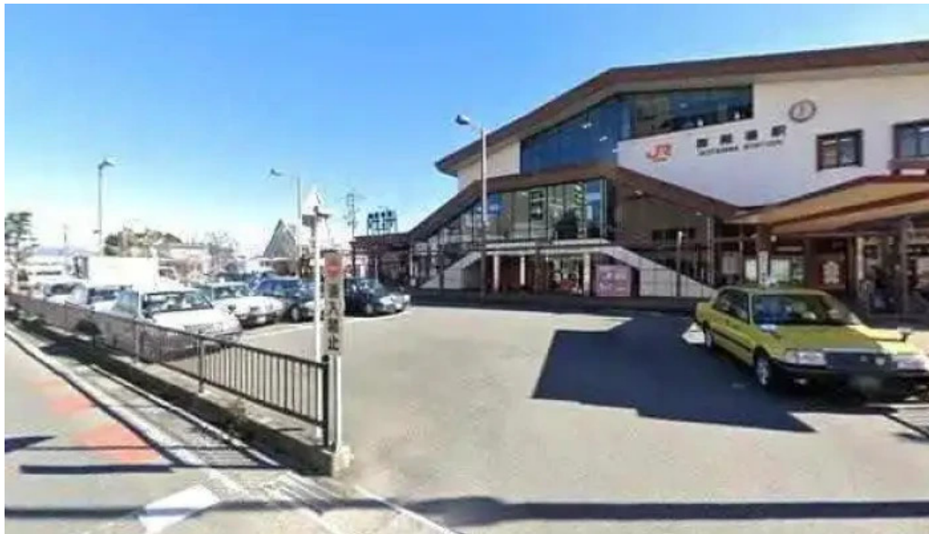
桃中軒 御殿場駅構内そば店 西口 最新