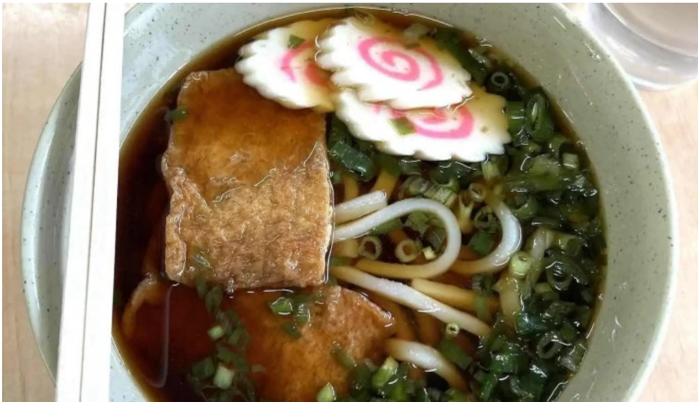
桃中軒 御殿場駅構内そば店 西口 料理飲み物