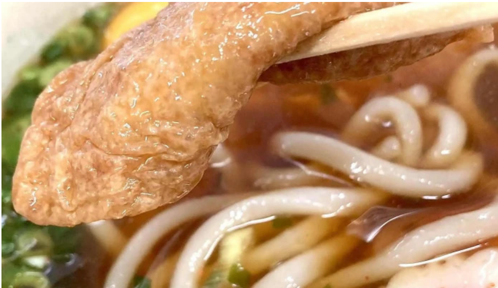
桃中軒 御殿場駅構内そば店 西口 ココミ