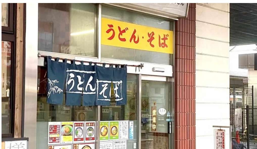
桃中軒 御殿場駅構内そば店 西口 近く