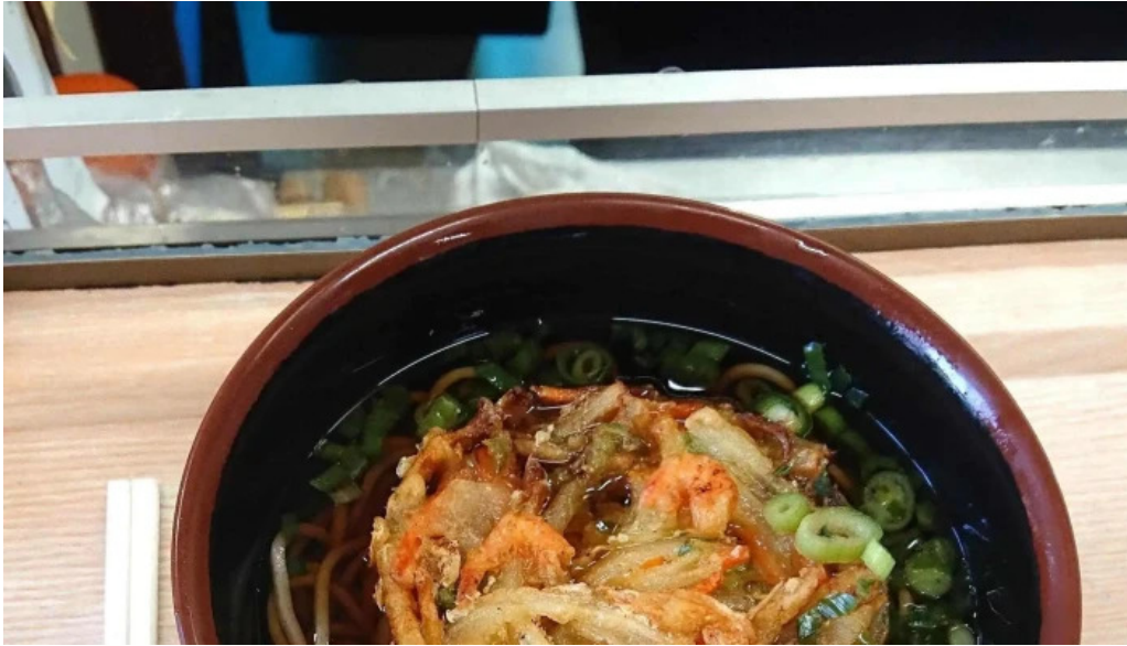
桃中軒 御殿場駅構内そば店 西口 スコア