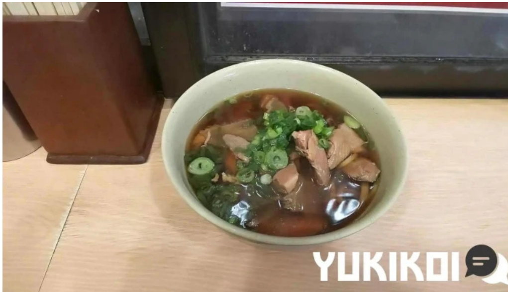
桃中軒 御殿場駅構内そば店 西口 牛肉麺