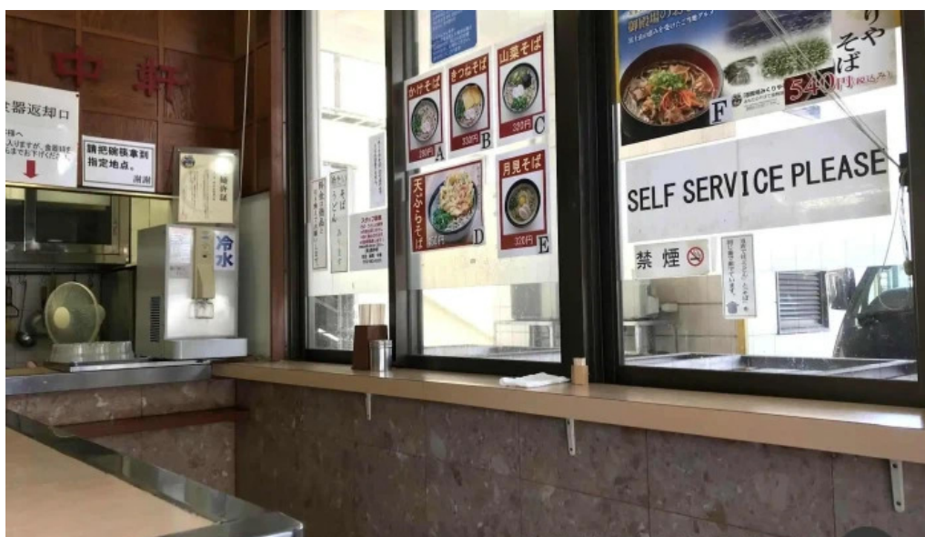
桃中軒 御殿場駅構内そば店 西口 雰囲気