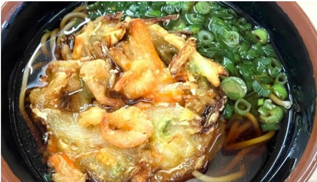
桃中軒 御殿場駅構内そば店 西口 ウェブサイト