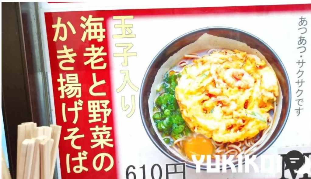
桃中軒 御殿場駅構内そば店 西口 スープ