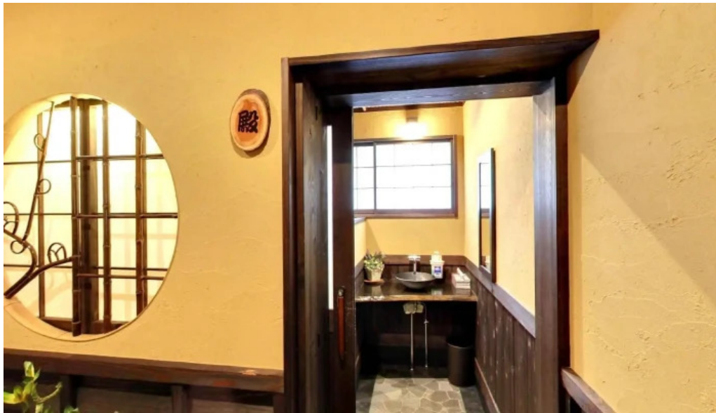
手打そば金太郎御殿場本店 御殿場市