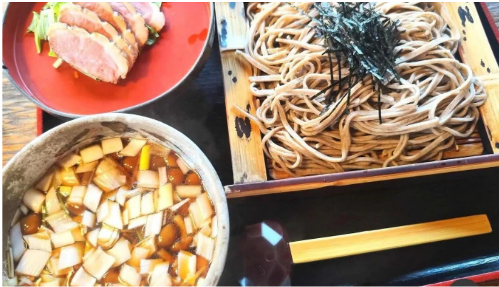
手打そば金太郎御殿場本店 麵