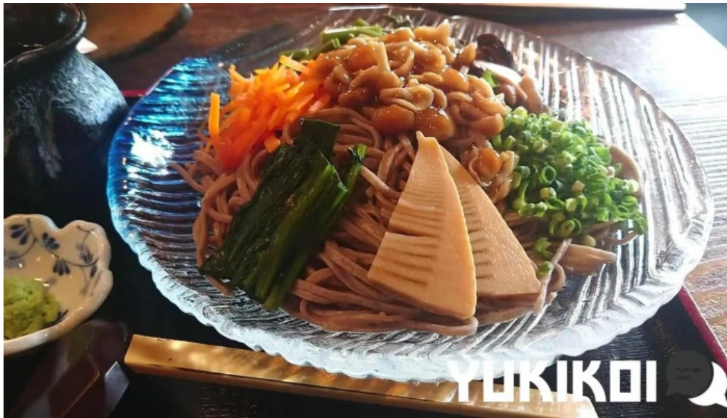
手打そば金太郎御殿場本店 蕎麦