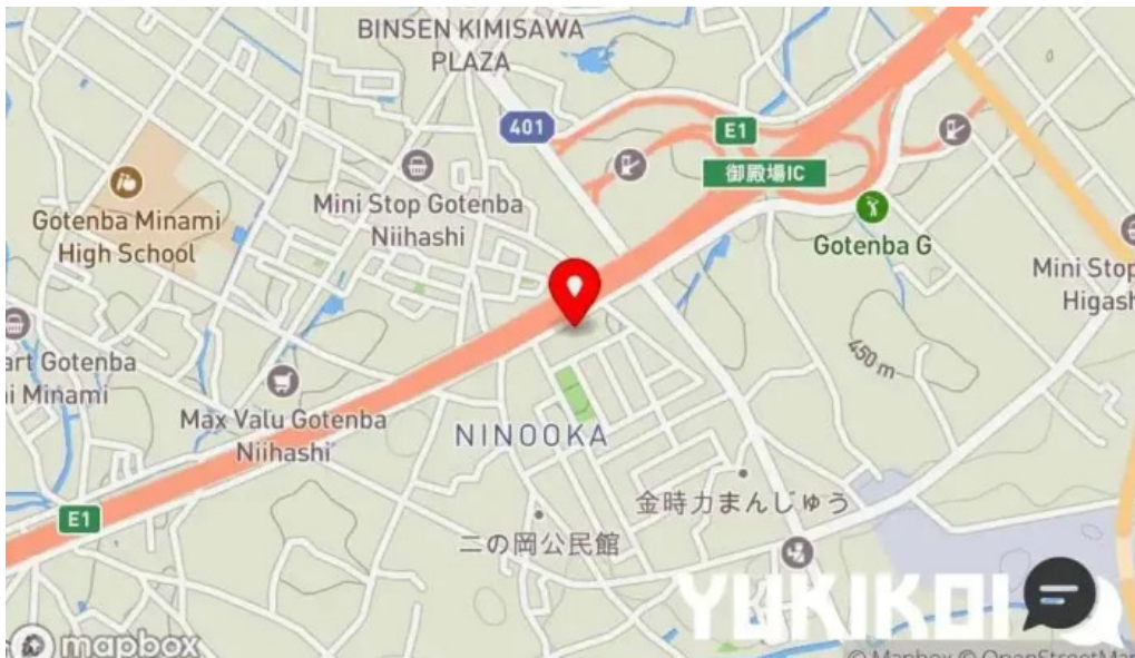
手打そば金太郎御殿場本店 地図