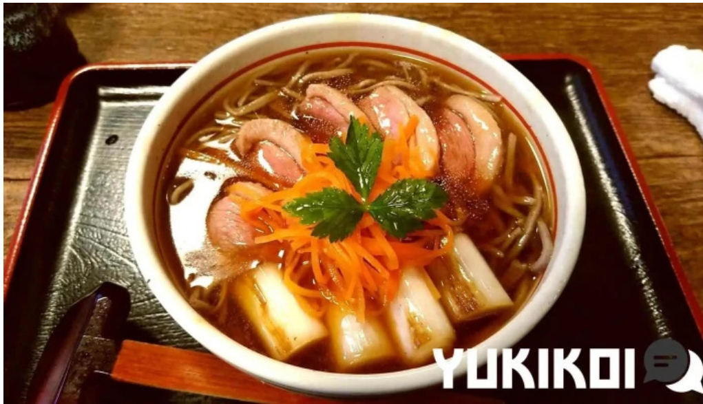
手打そば金太郎御殿場本店 ラーメン