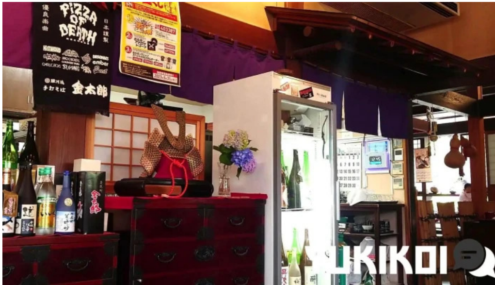
手打そば金太郎御殿場本店 動画