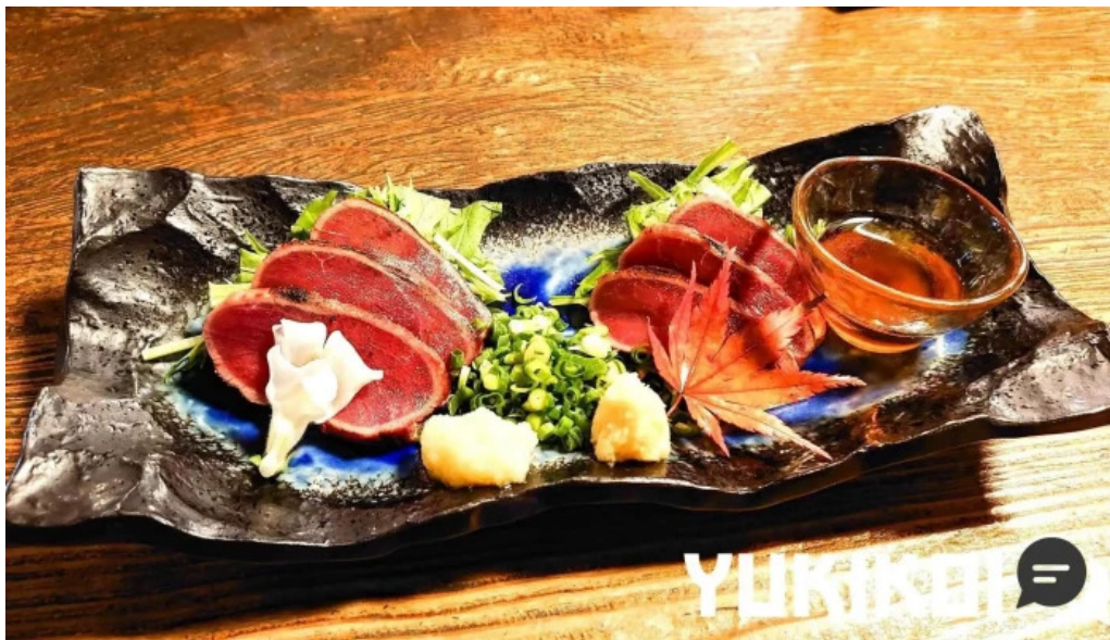
手打そば金太郎御殿場本店 刺身