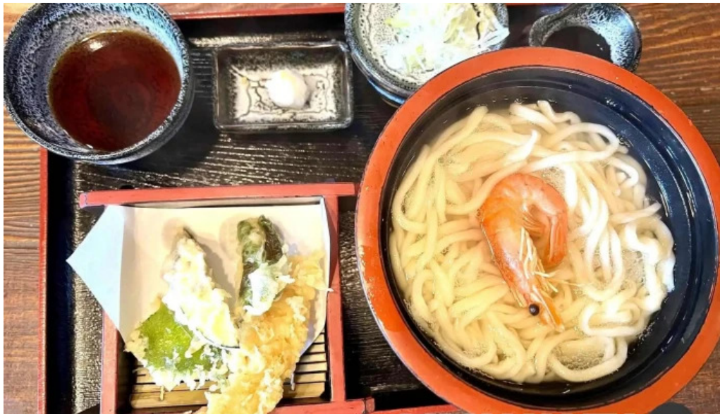
手打そば金太郎御殿場本店 うどん