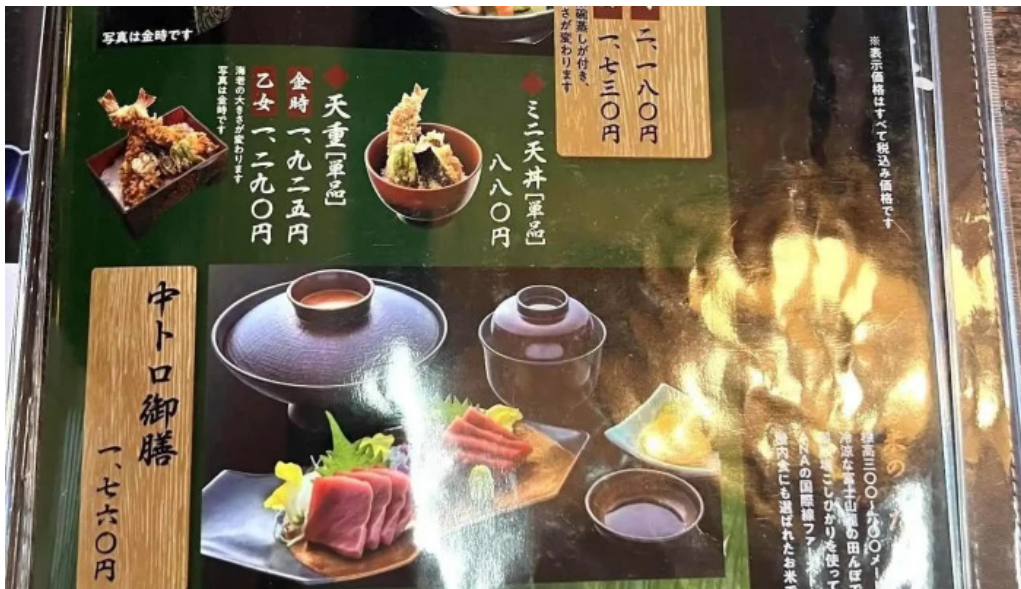
手打そば金太郎御殿場本店 メニュー