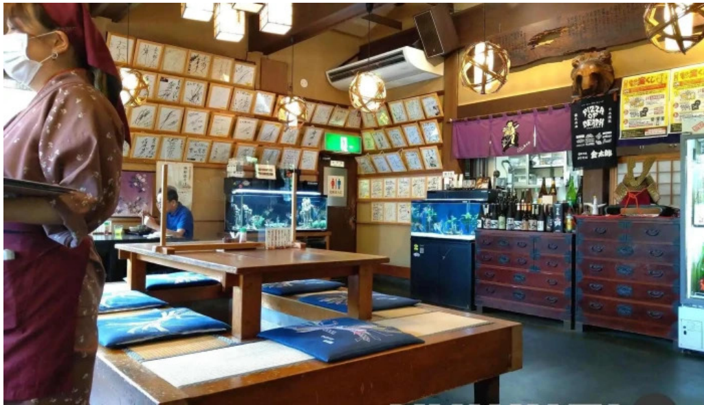
手打そば金太郎御殿場本店 雰囲気