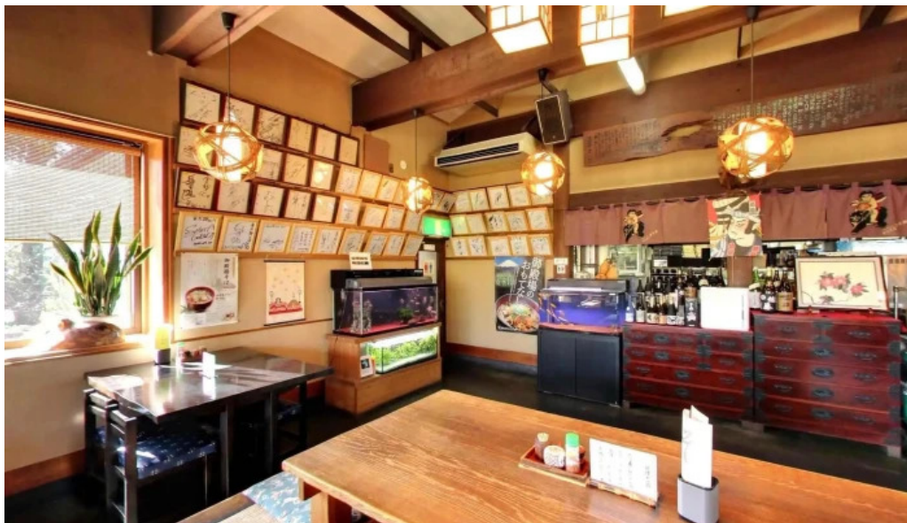
手打そば金太郎御殿場本店 オーナー提供