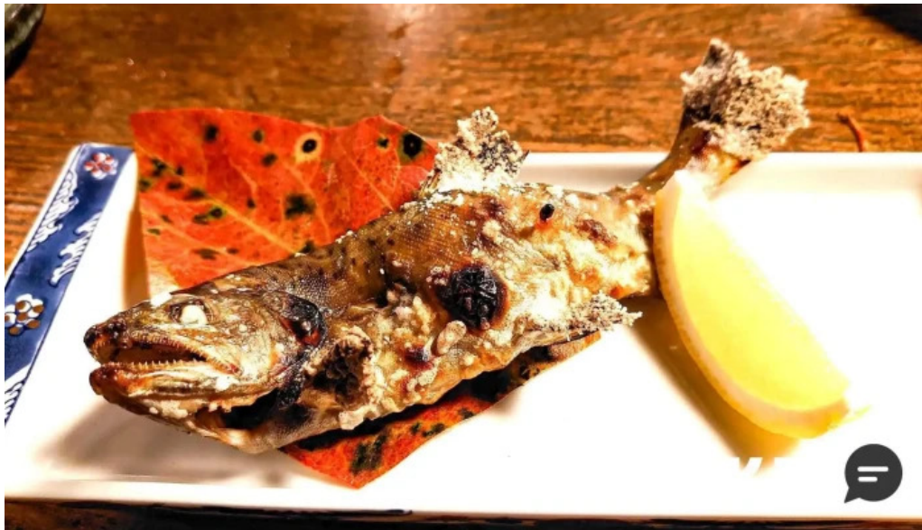
手打そば金太郎御殿場本店 サバ