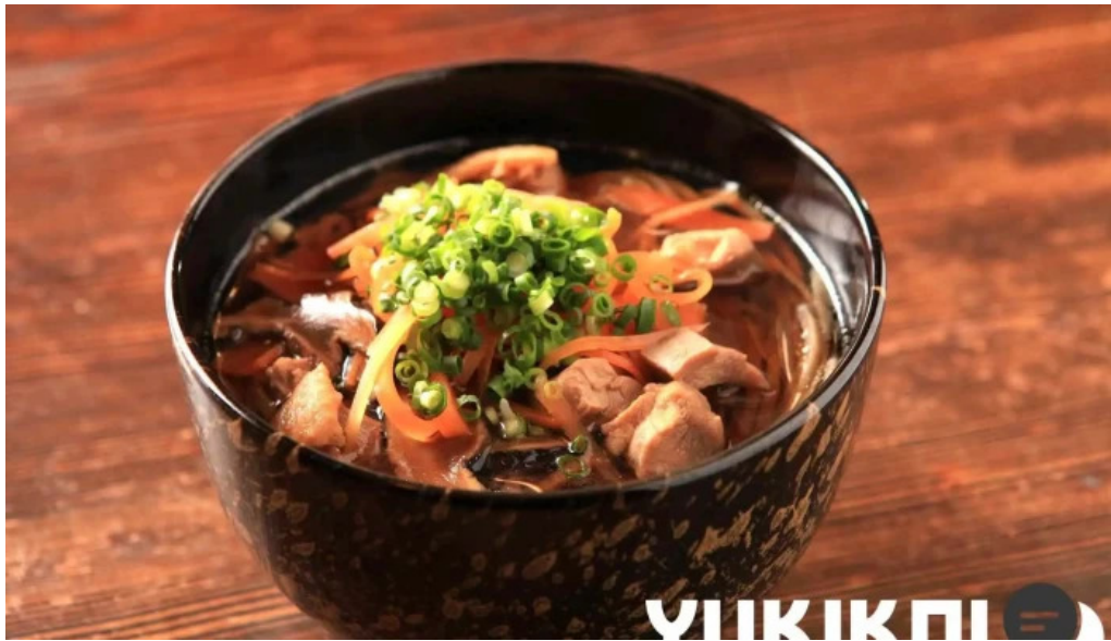
手打そば金太郎御殿場本店 料理飲み物