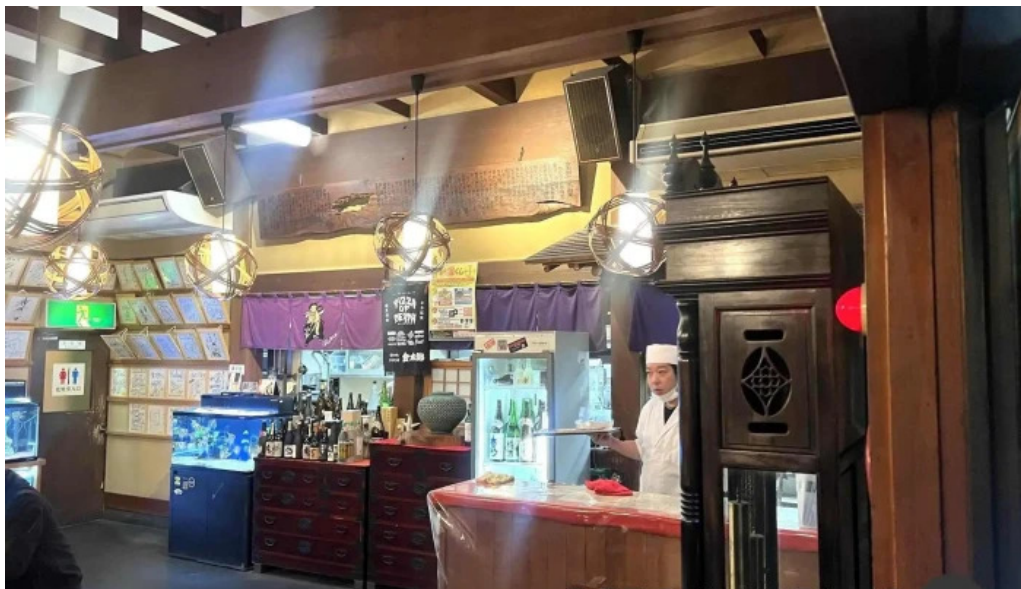
手打そば金太郎御殿場本店 最新