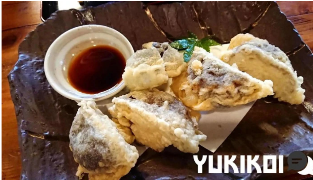
手打そば金太郎御殿場本店 天ぷら