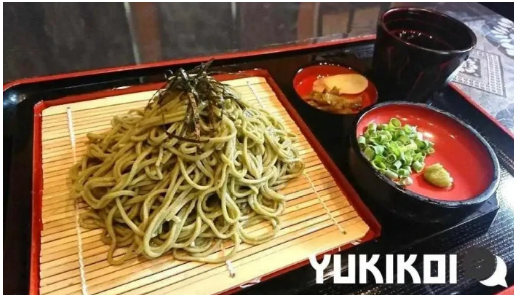
奄美菜膳 つむぎ庵 蕎麦