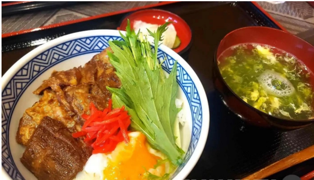
奄美菜膳 つむぎ庵 ラーメン