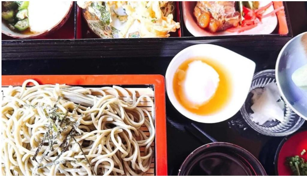
奄美菜膳 つむぎ庵 住所