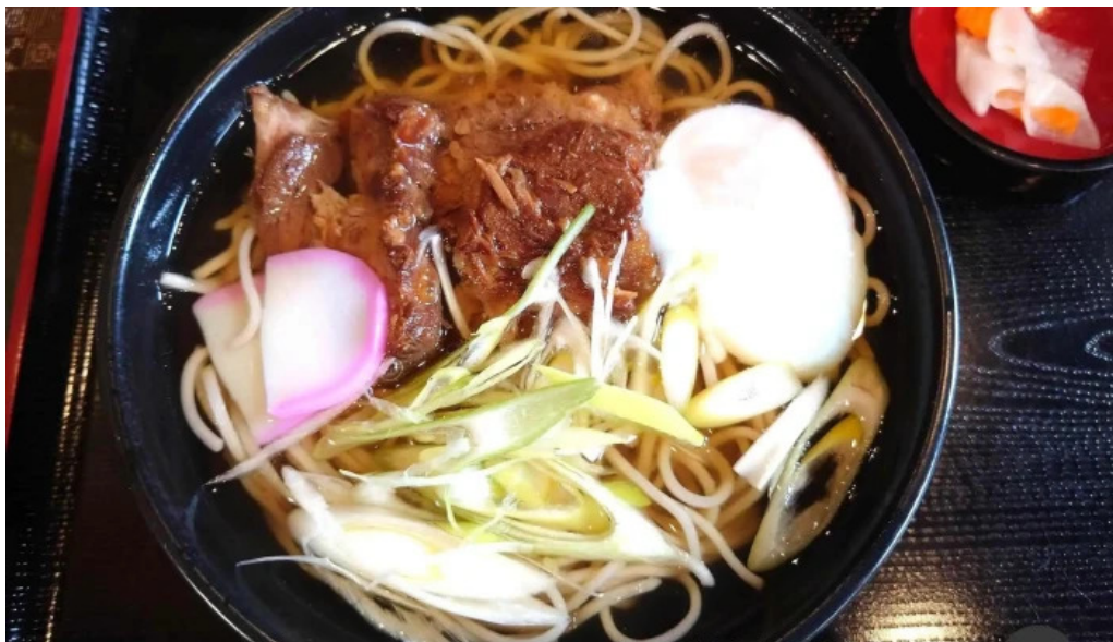
奄美菜膳 つむぎ庵 最新