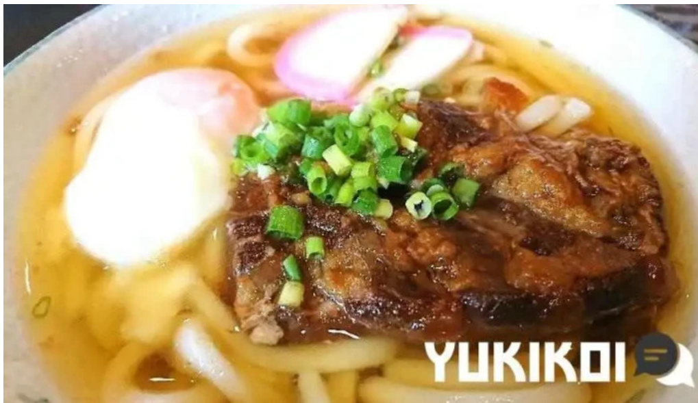
奄美薬膳 つむぎ庵 うどん