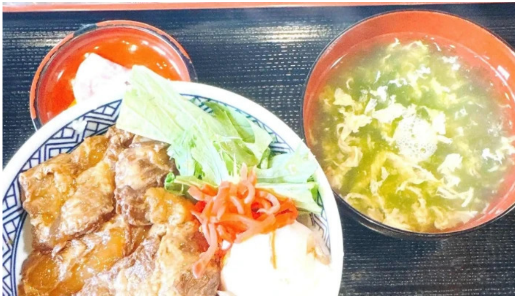
奄美菜膳 つむぎ庵 動画