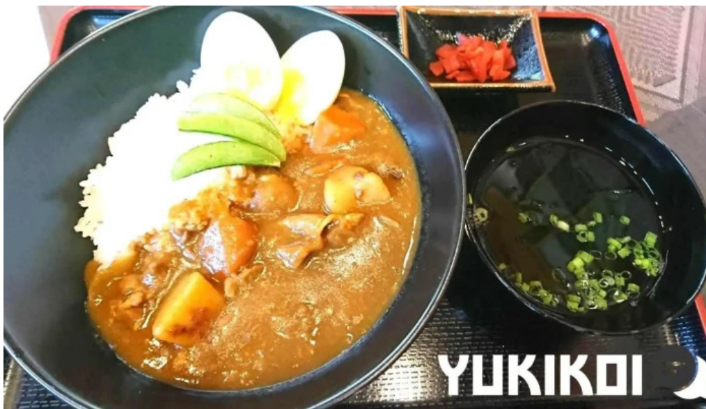
奄美薬膳 つむぎ庵 スープ