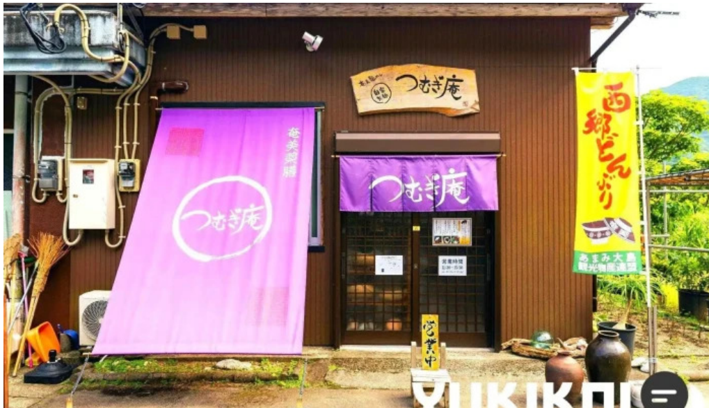
奄美薬膳 つむぎ庵 オーナー提供