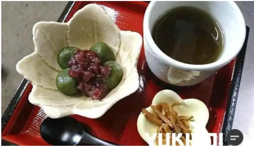
奄美薬膳 つむぎ庵 料理飲み物