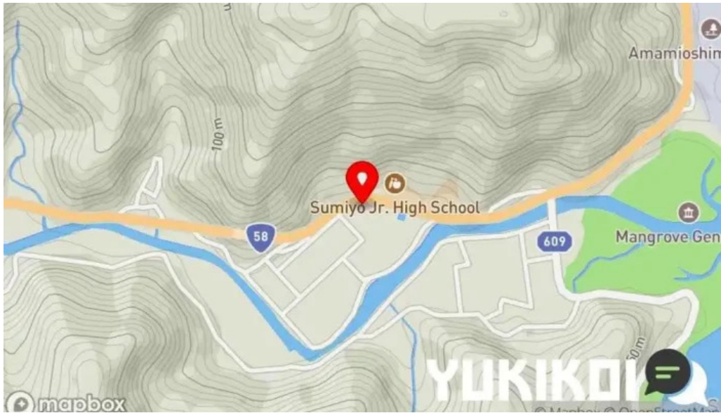
奄美菜膳 つむぎ庵 地図