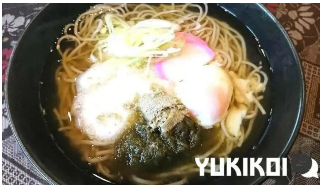
奄美薬膳 つむぎ庵 麺