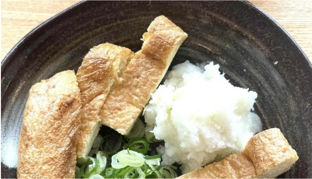
大宮亭 comentario 4