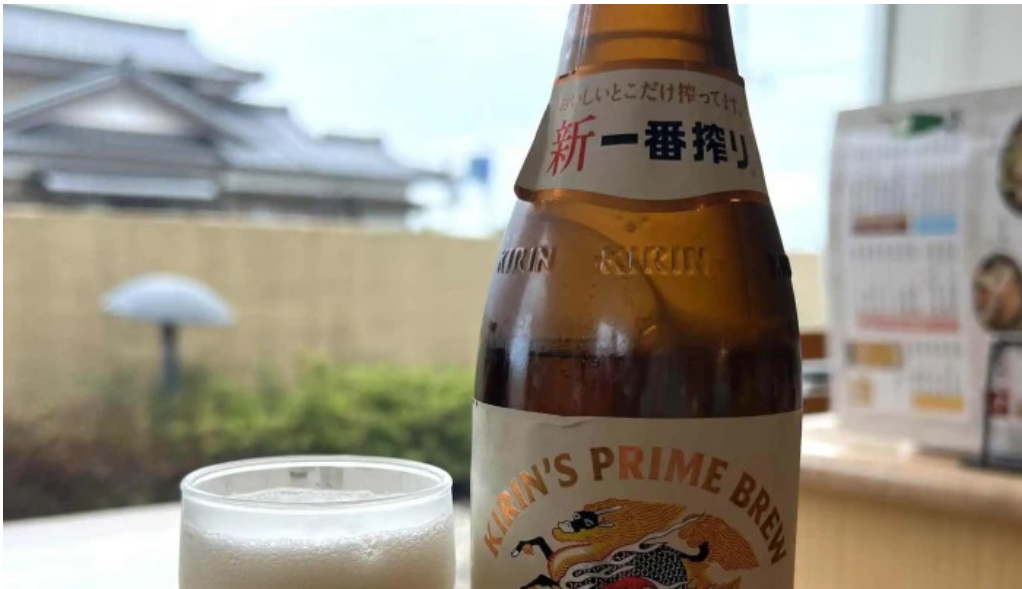
大宮亭 comentario 3