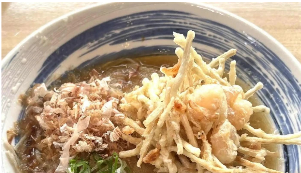
大宮亭 comentario 2