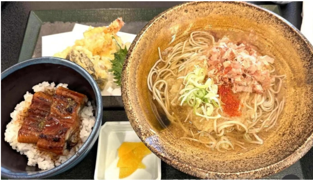
大宮亭 料理飲み物