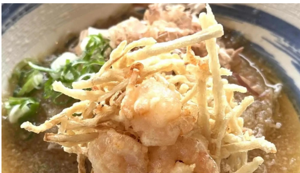
大宮亭 comentario 1