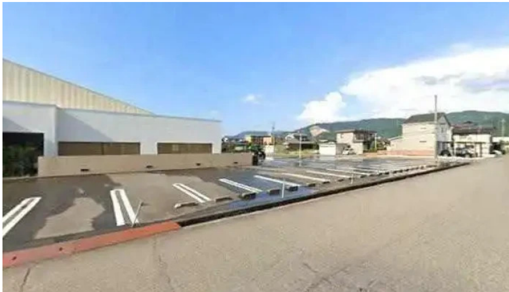
大宮亭 ストリートビューと 360 ビュー