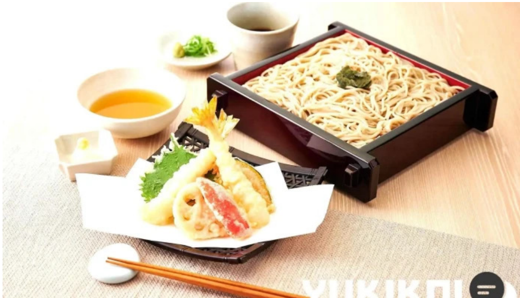
蕎菜 目黒店