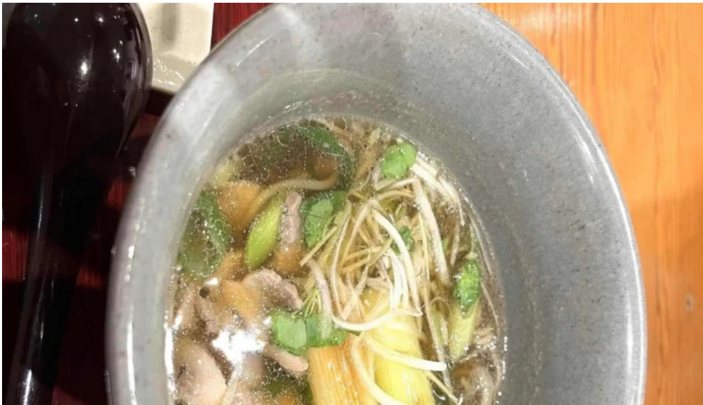
蕎菜 目黒店 口コシ