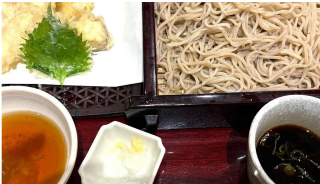
蕎菜 目黒店 カタログ