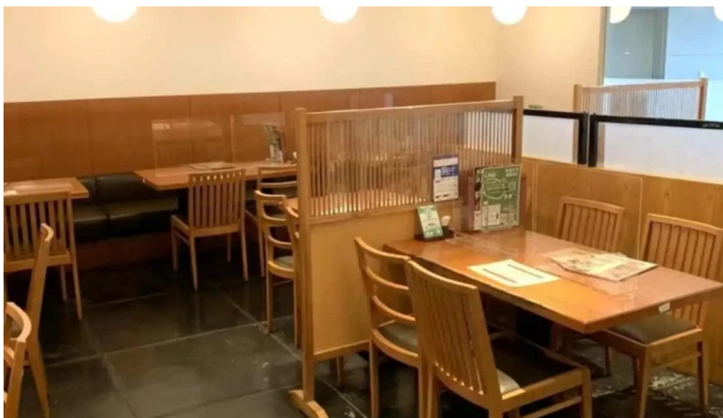
蕎麦 目黒店 雰囲気