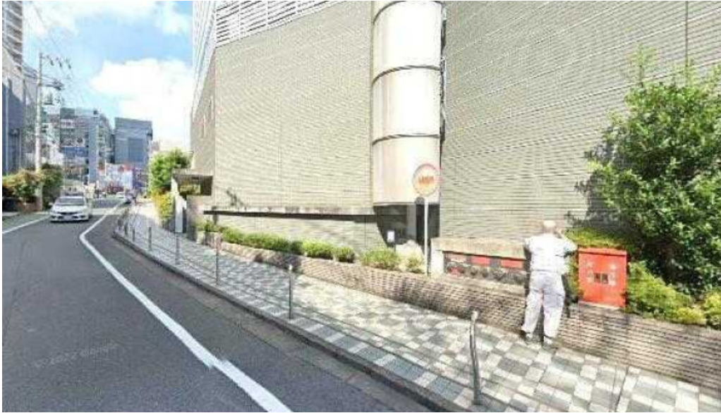
蕎菜 目黒店 品川区