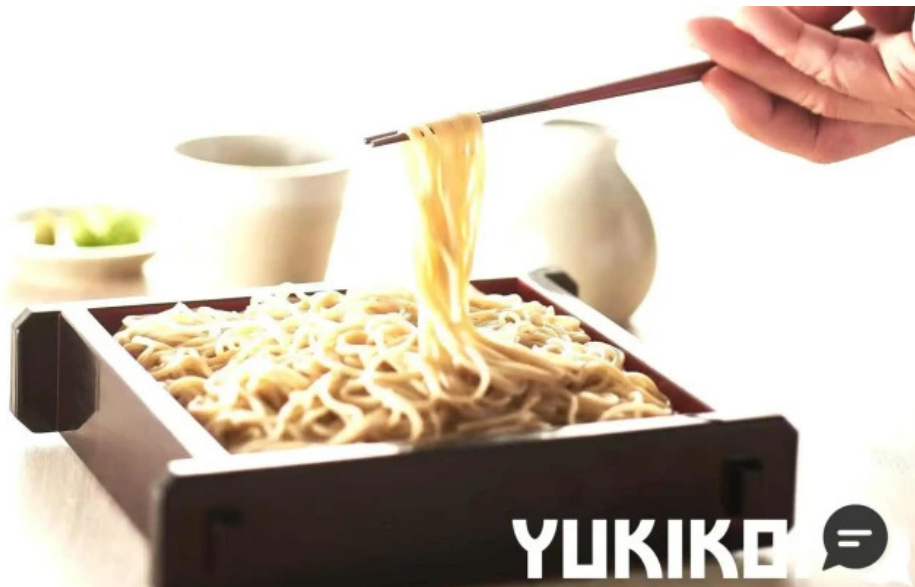
蕎菜 目黒店 蕎麦