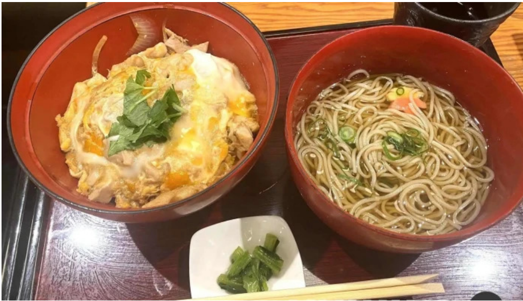
蕎菜 目黒店 スープ