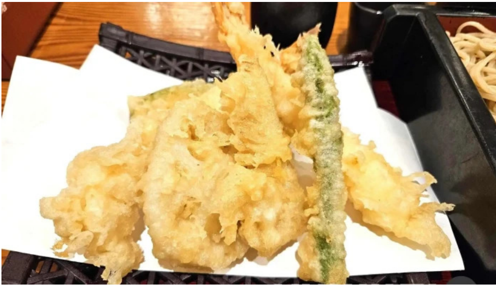
蕎菜 目黒店 天ぷら