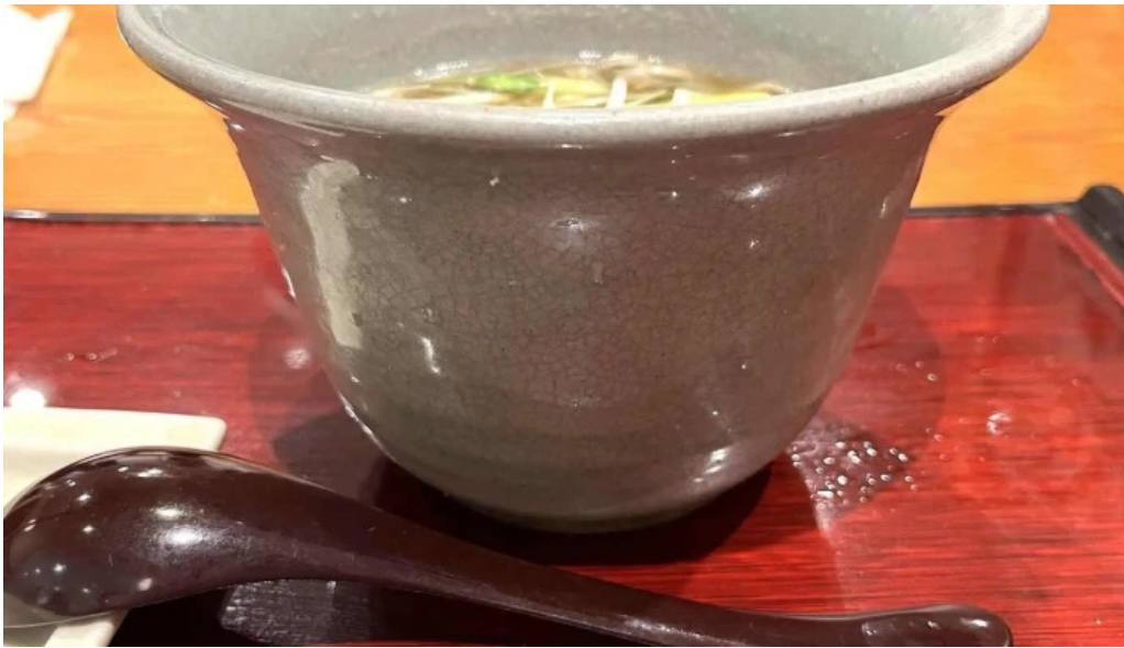
蕎菜 目黒店 動画