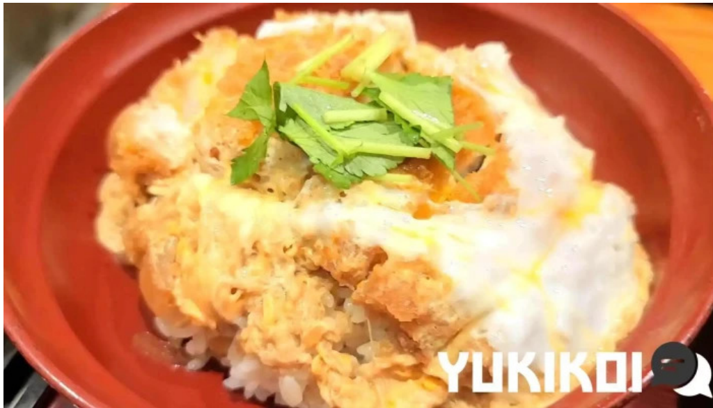
蕎菜 目黒店 カツ丼