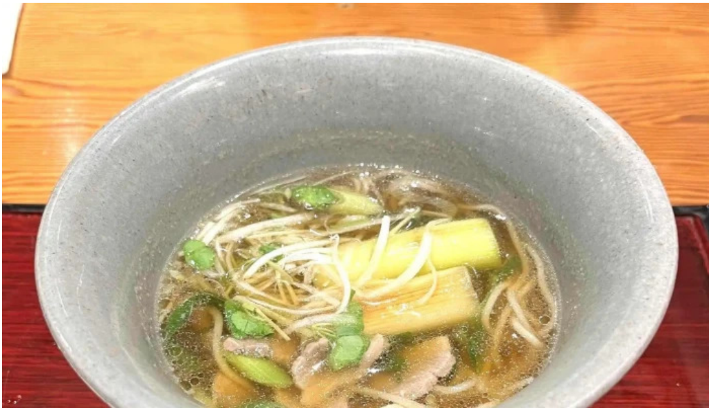
蕎菜 目黒店 コメント