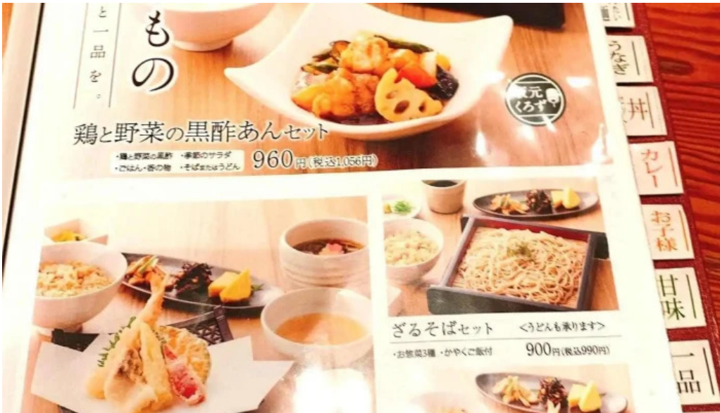
蕎菜 目黒店 メニュー