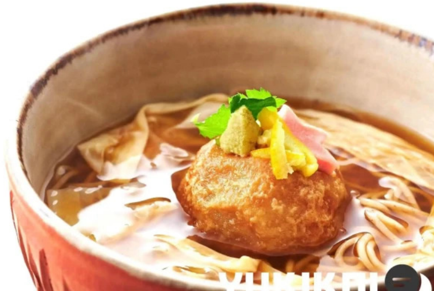
蕎菜 目黒店 料理飲み物