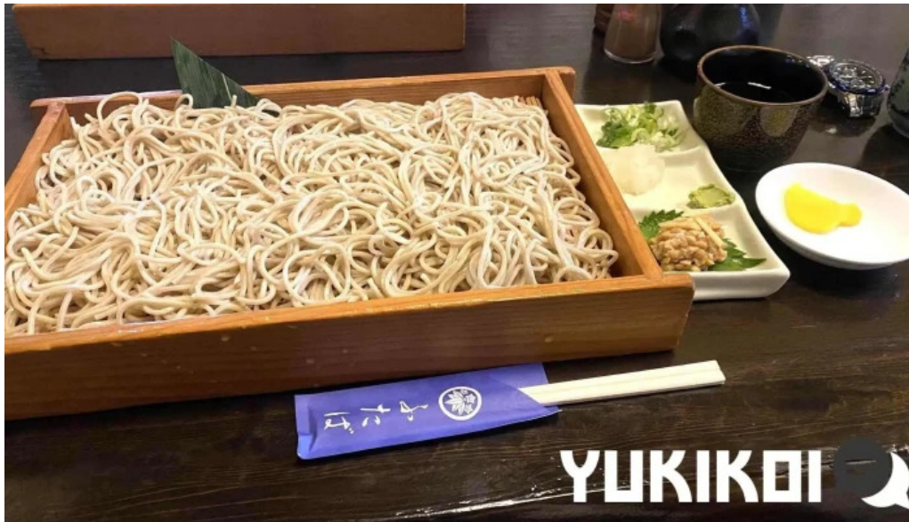
食事処ふたば 最新