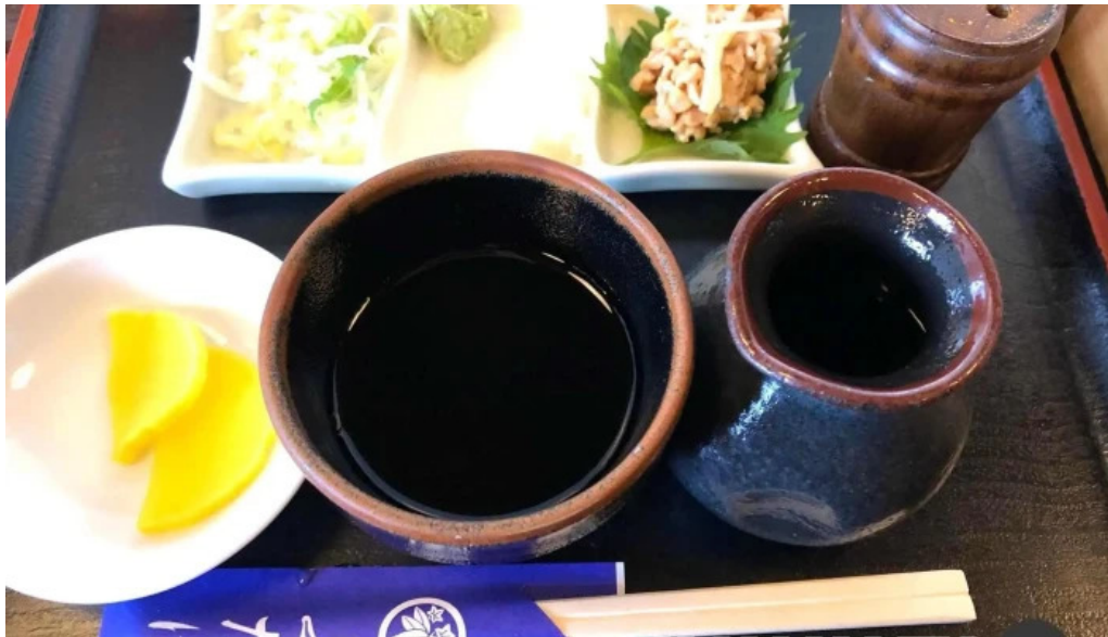
食事処ふたば 懐石