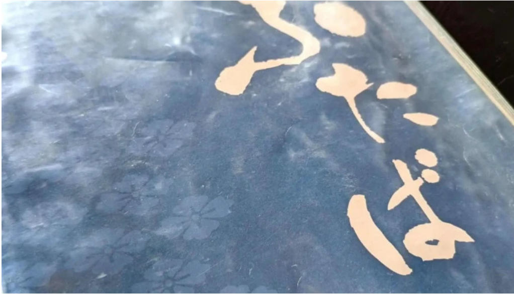
食事処ふたば 営業時間