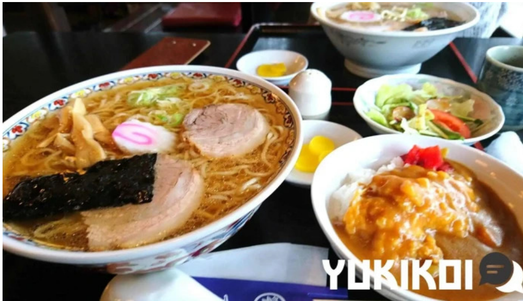
食事処ふたば ラーメン