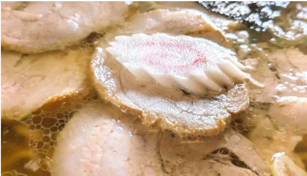
食事処ふたば プロモーション