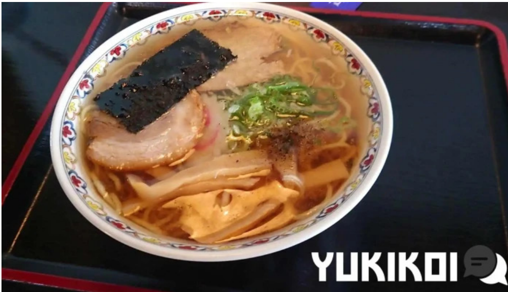
食事処ふたば 動画