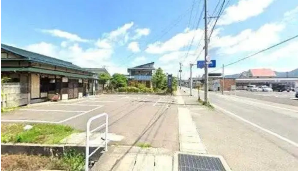
食事処ふたば 南陽市