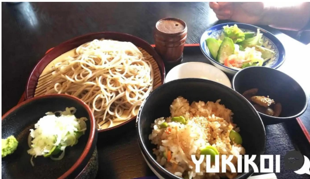
食事処ふたば 料理飲み物