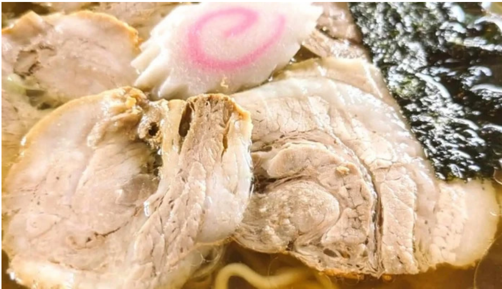
食事処ふたば 営業中