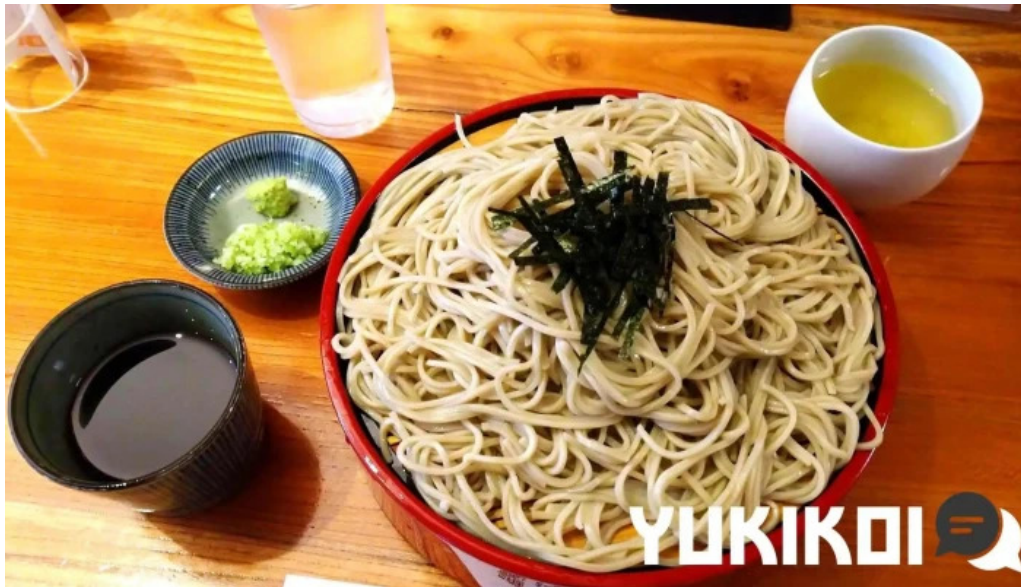
丸一蕎麦屋 料理飲み物