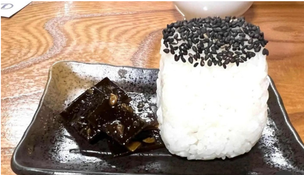
丸一蕎麦屋 おにぎり