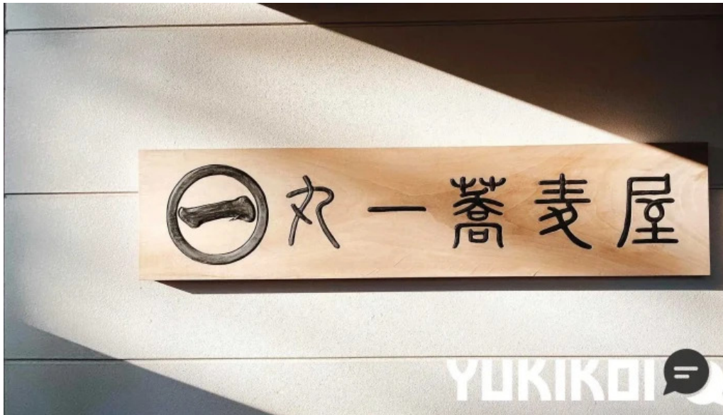
丸一蕎麦屋