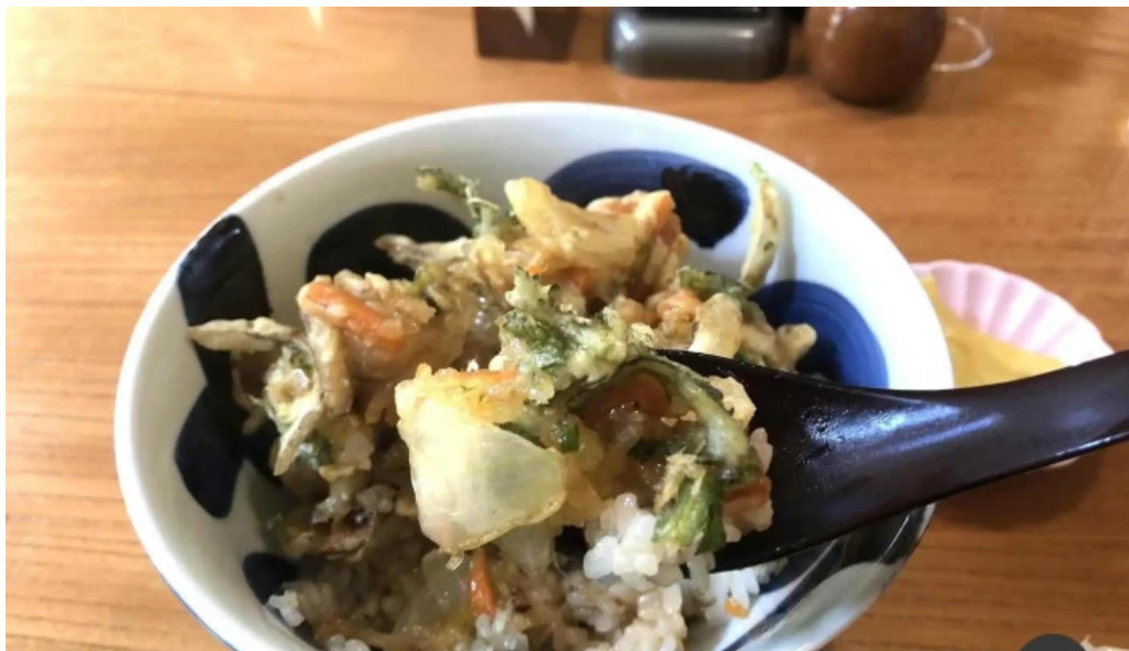
丸一蕎麦屋 天ぷら