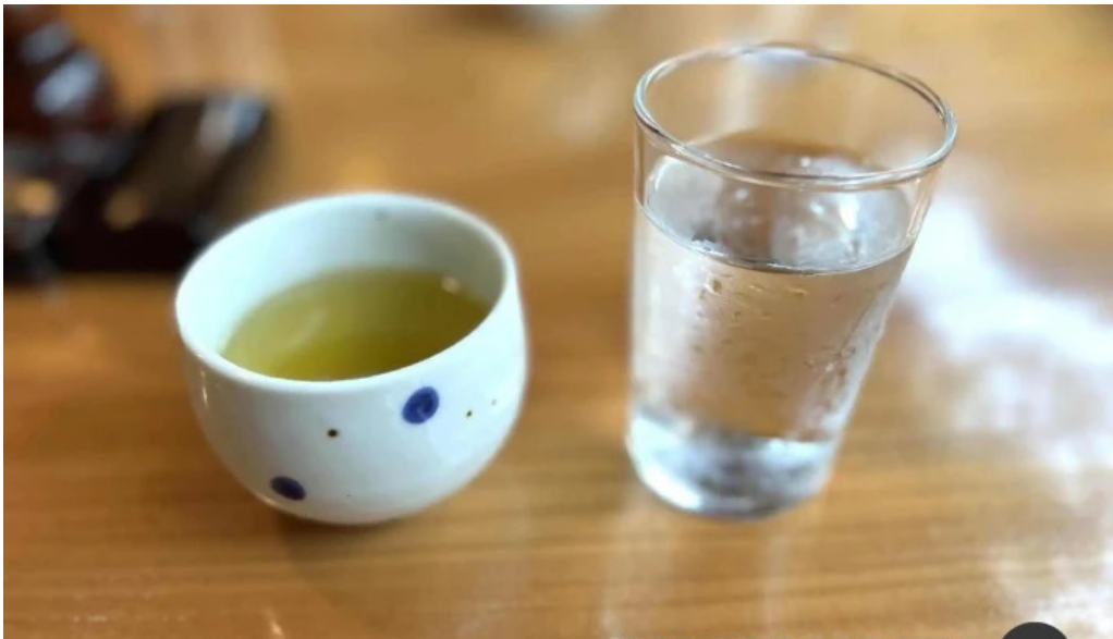
丸一蕎麦屋 日本酒