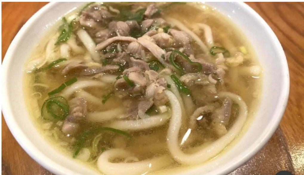
丸一蕎麦屋 フォー