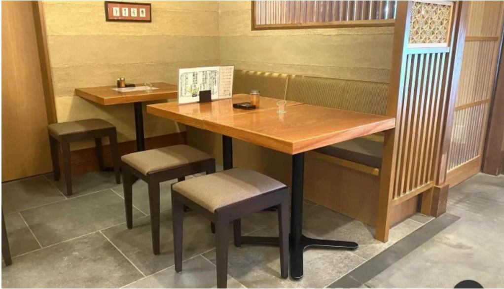
丸一蕎麦屋 雰囲気