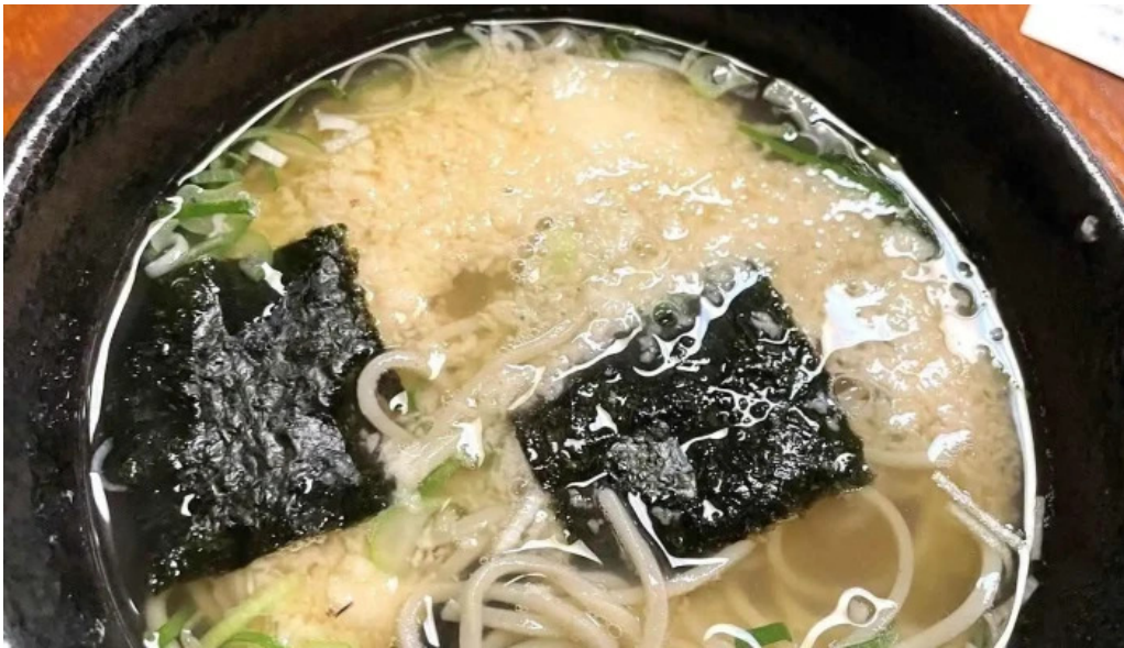
丸一蕎麦屋 ラーメン