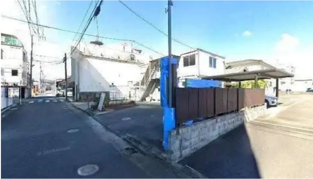
丸一蕎麦屋 人吉市