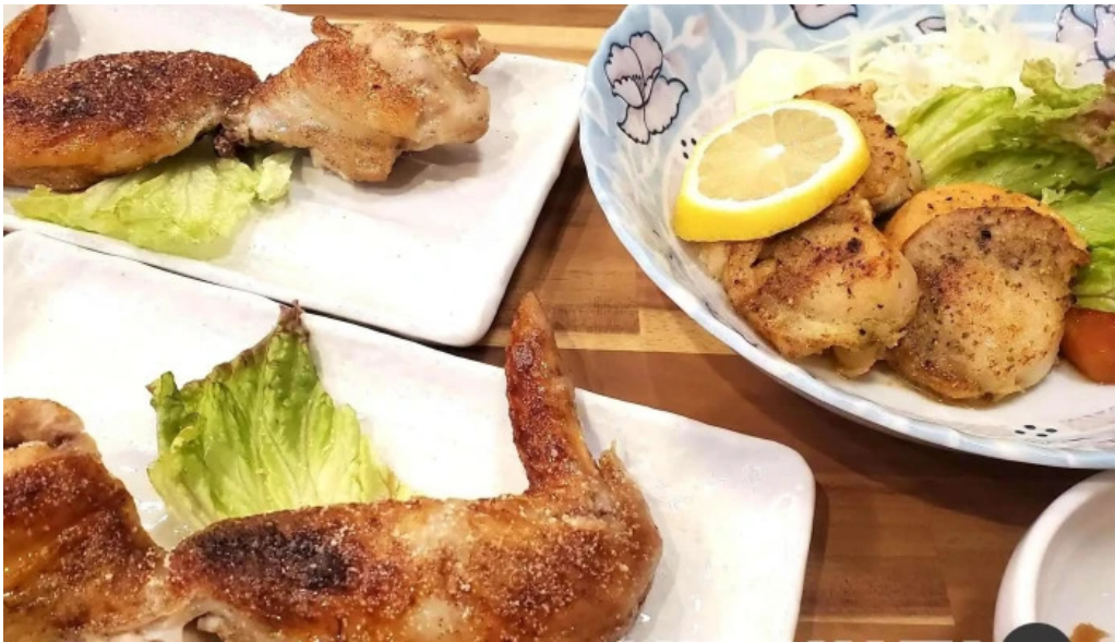
志のぶ 料理飲み物