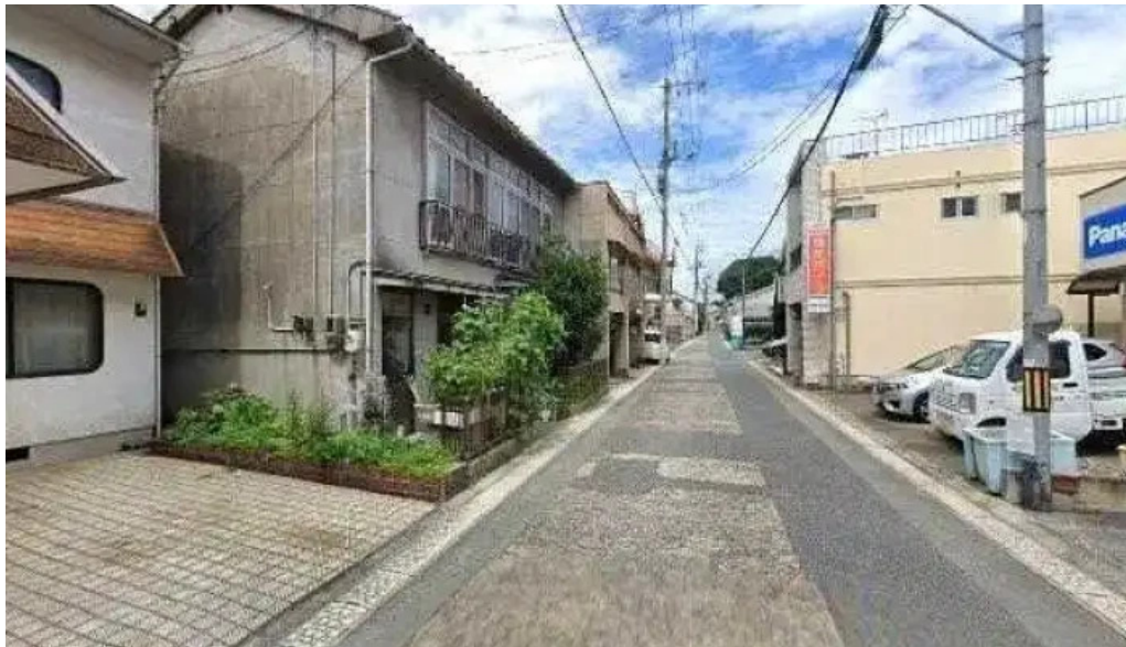
志のぶ ストリートビューと 360 ビュー