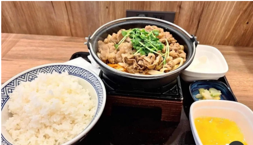
吉野家 16号線野田店 すき焼き