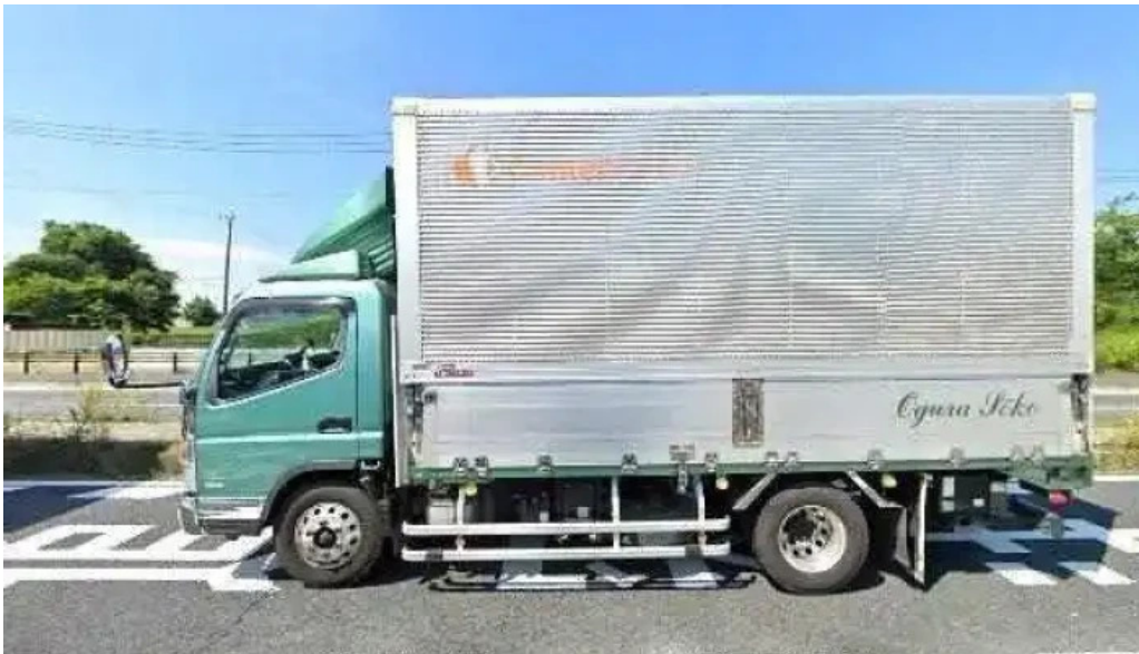
吉野家 16号線野田店 野田市