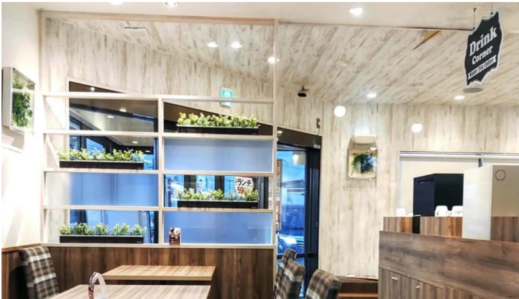
吉野家 16号線野田店 どこ