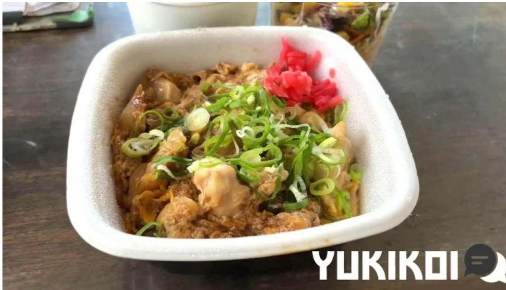
吉野家 16号線野田店 動画