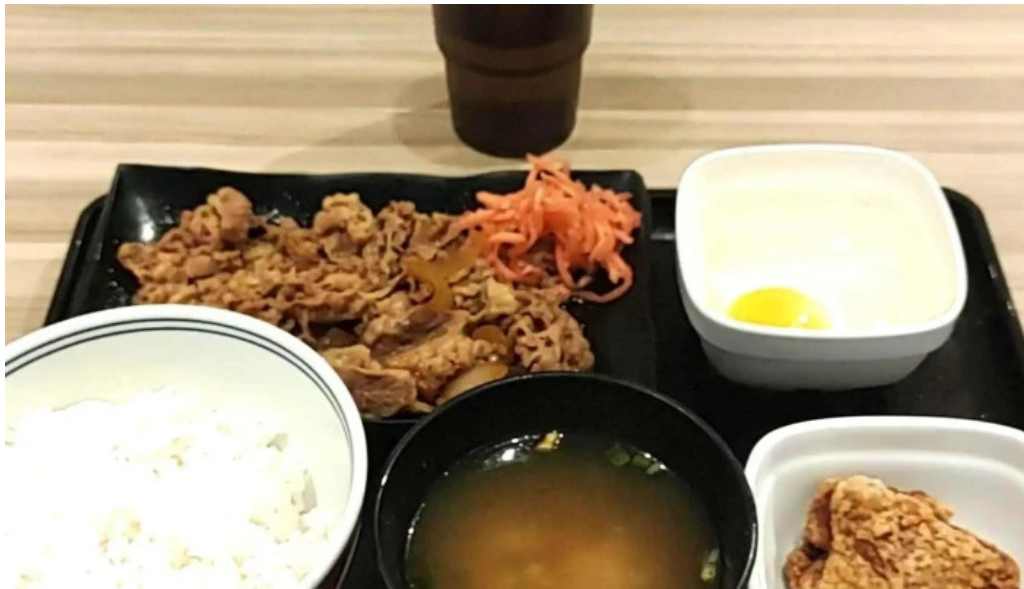
吉野家 16号線野田店 口コシ