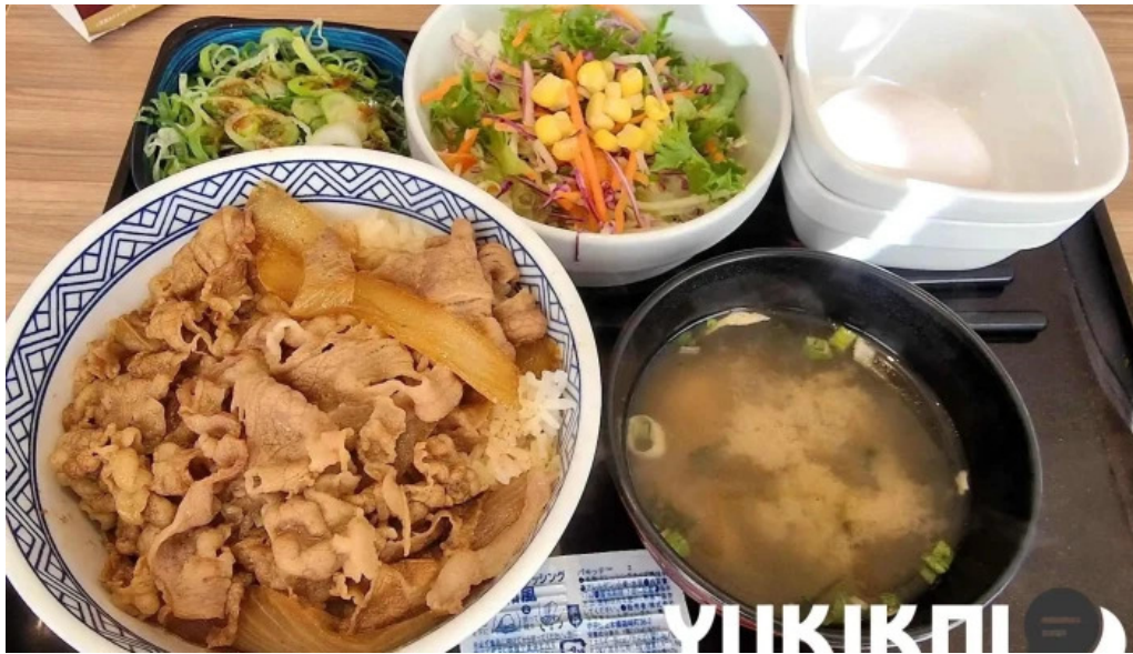
吉野家 16号線野田店 最新