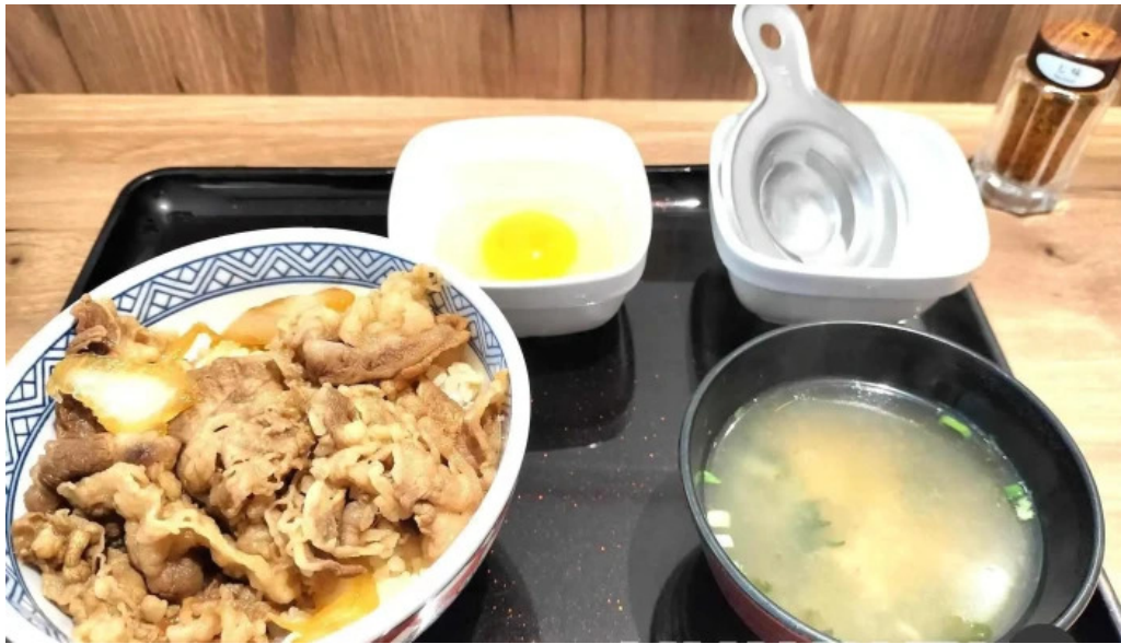
吉野家 16号線野田店 味噌汁