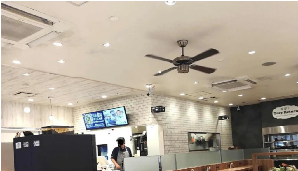
吉野家 16号線野田店 所在地