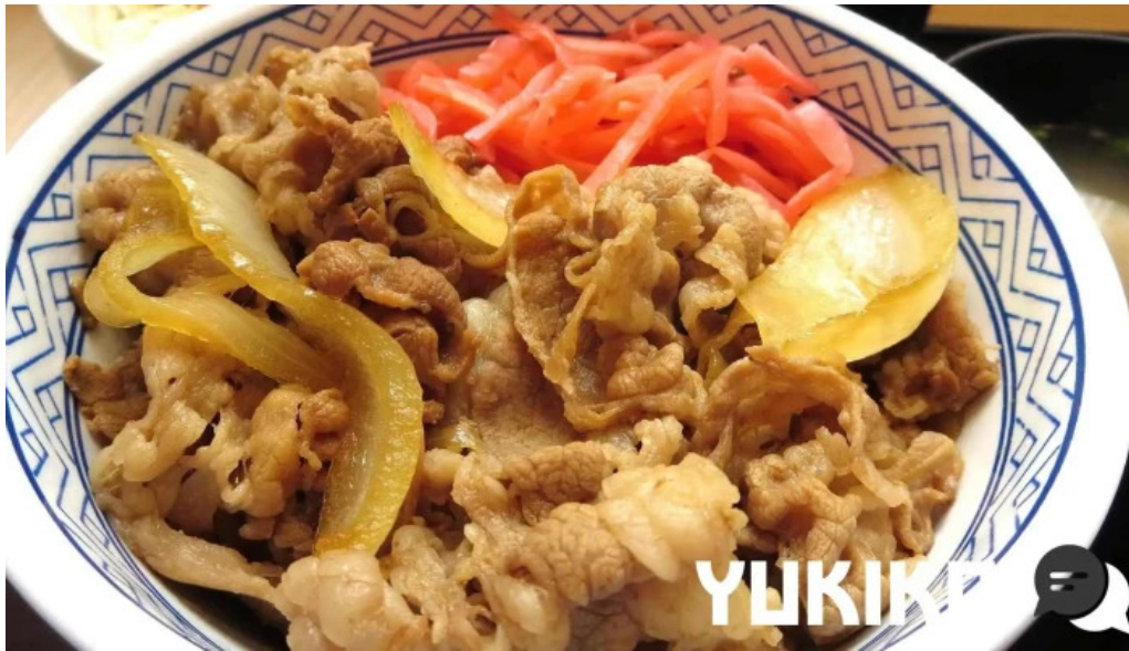
吉野家 16号線野田店 料理飲み物