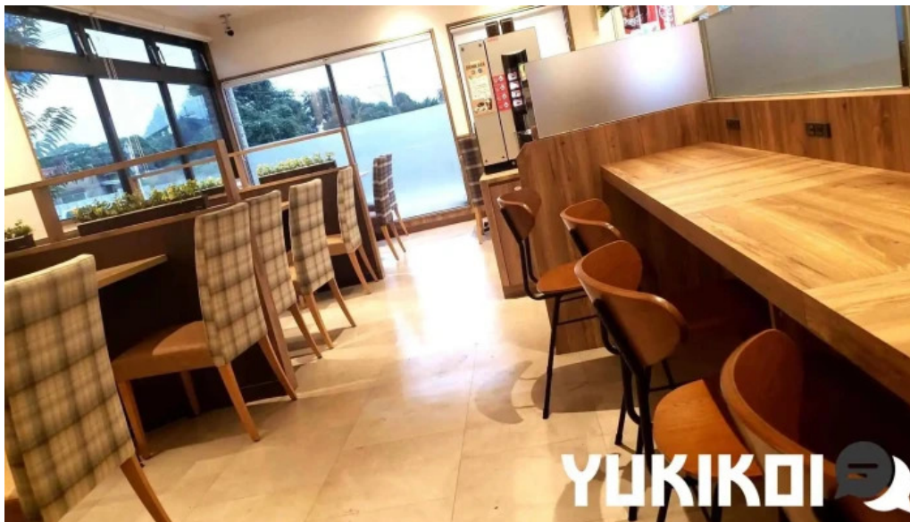
吉野家 16号線野田店 雰囲気