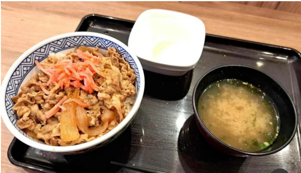
吉野家 16号線野田店 牛丼