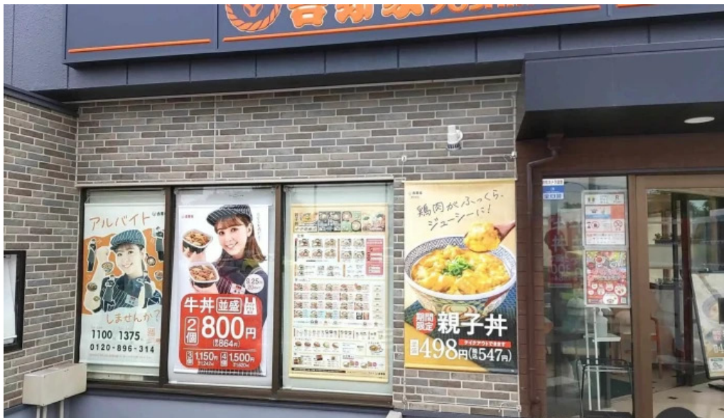
吉野家 16号線野田店 メニュー