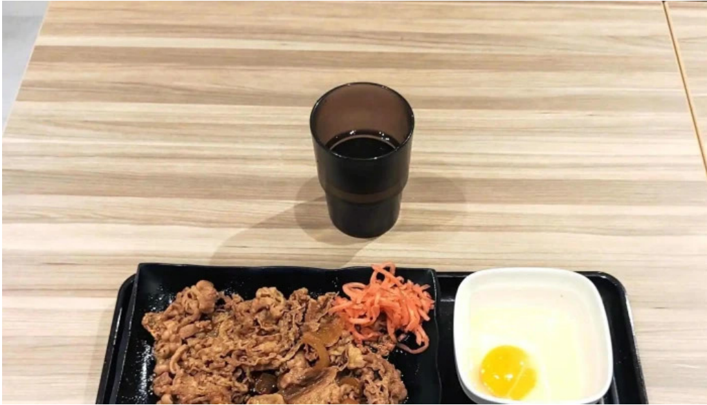
吉野家 16号線野田店 コメント