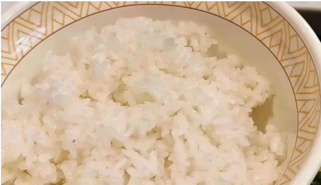
すき家 11号観音寺植田店 動画