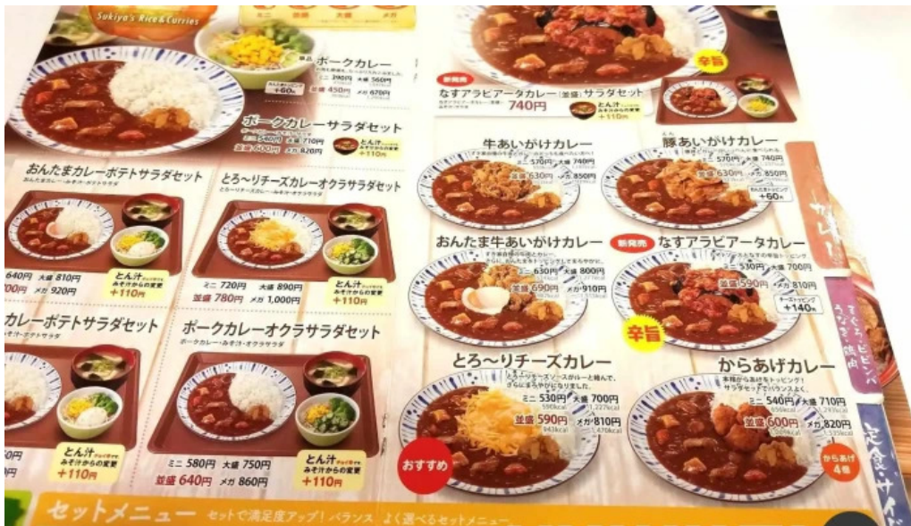
すき家 11号観音寺植田店 メニュー