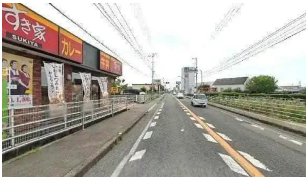
すき家 11号観音寺植田店 観音寺市