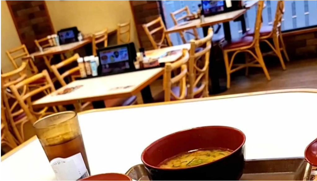
すき家 11号観音寺植田店 割引