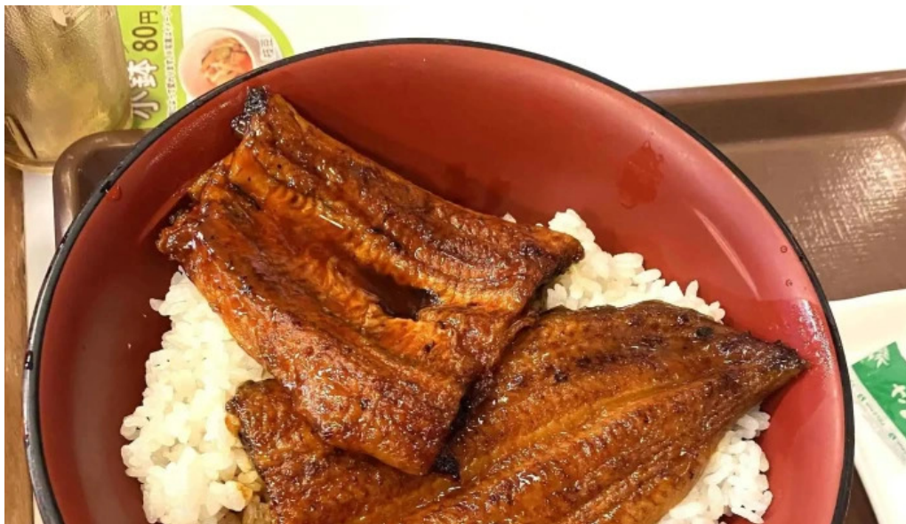
すき家 11号観音寺植田店 スコア