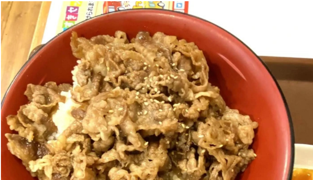
すき家 11号観音寺植田店 住所