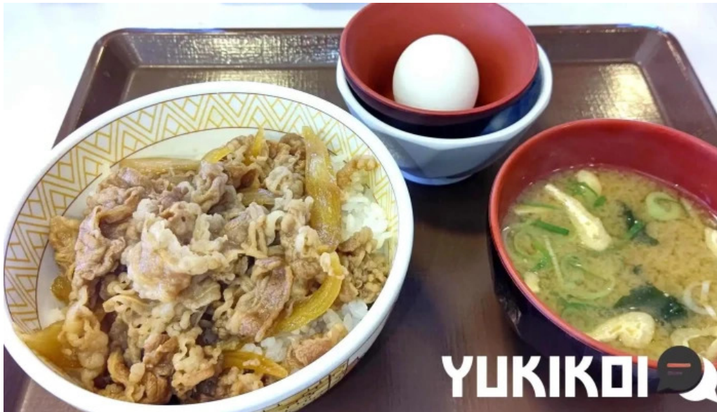
すき家 11号観音寺植田店 牛丼