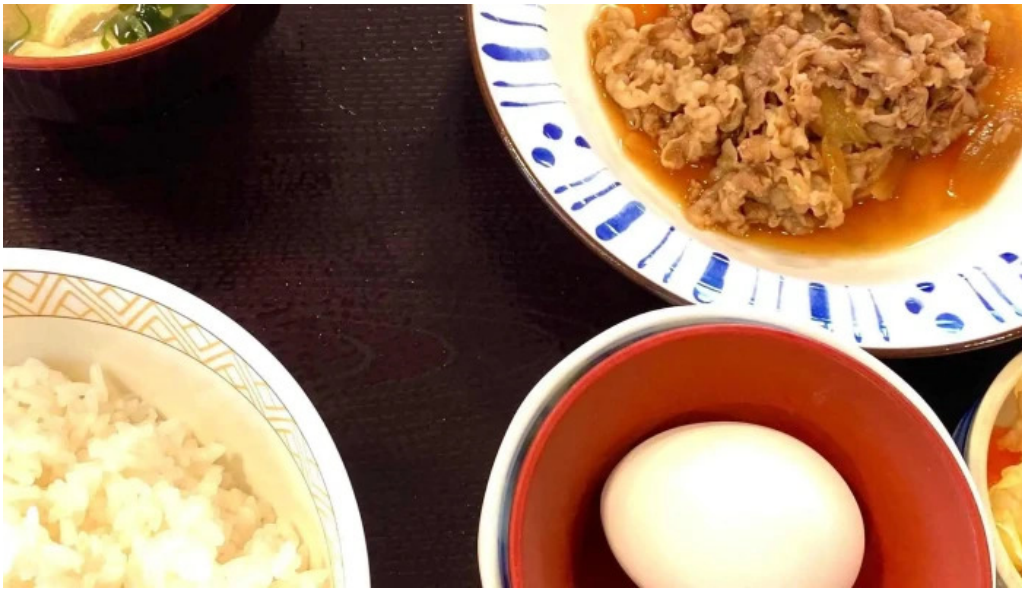
すき家 11号観音寺植田店 営業時間