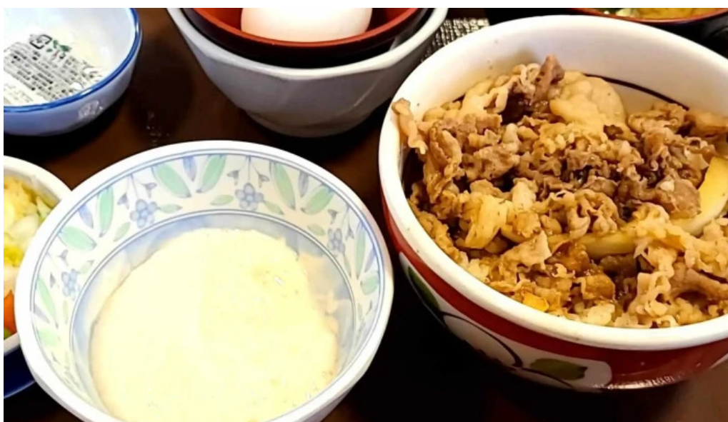
すき家 11号観音寺植田店 instagram