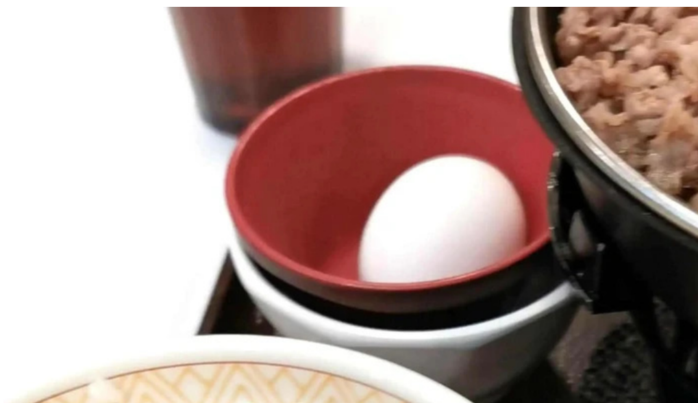
すき家 11号観音寺植田店 どこ