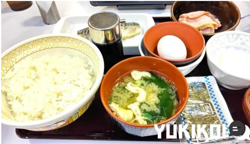
すき家 11号観音寺植田店 料理飲み物