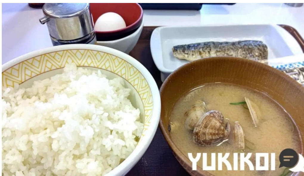
すき家 11号観音寺植田店 豚汁