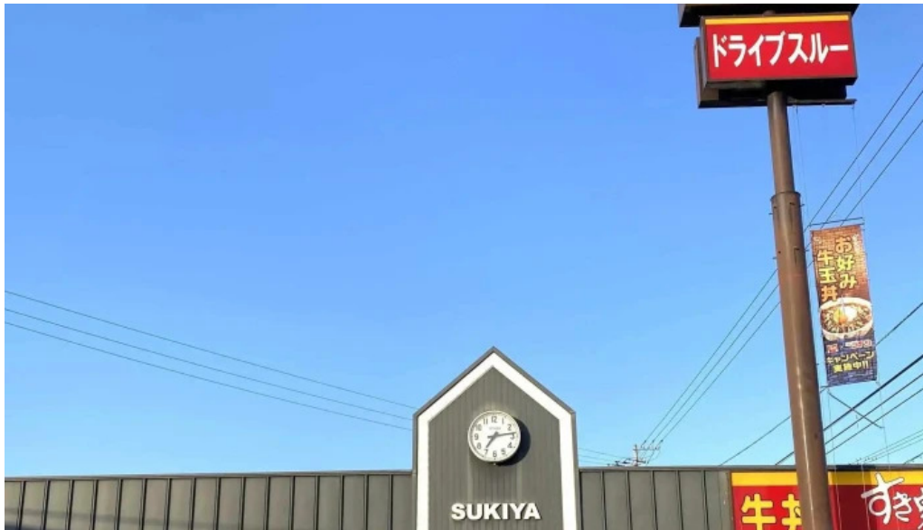
すき家 11号観音寺植田店 行き方