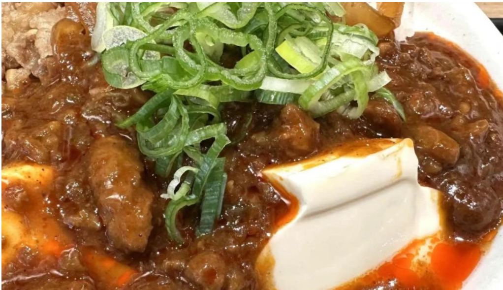
松屋 枚方店 写真