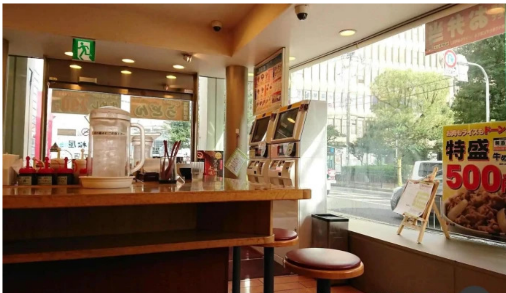
松屋 枚方店 雰囲気