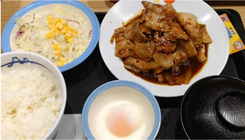
松屋 枚方店 コメント