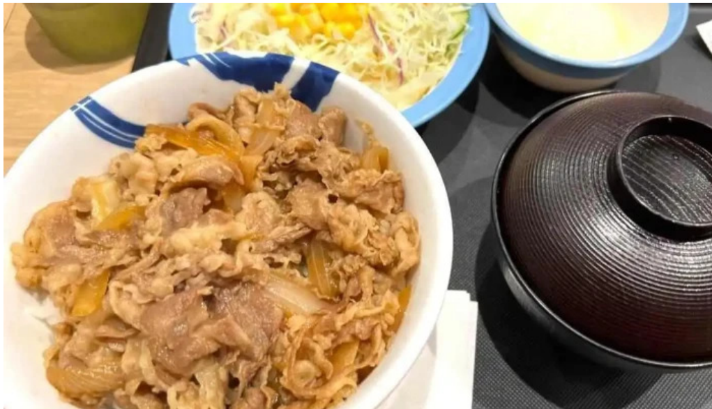
松屋 枚方店 料理飲み物