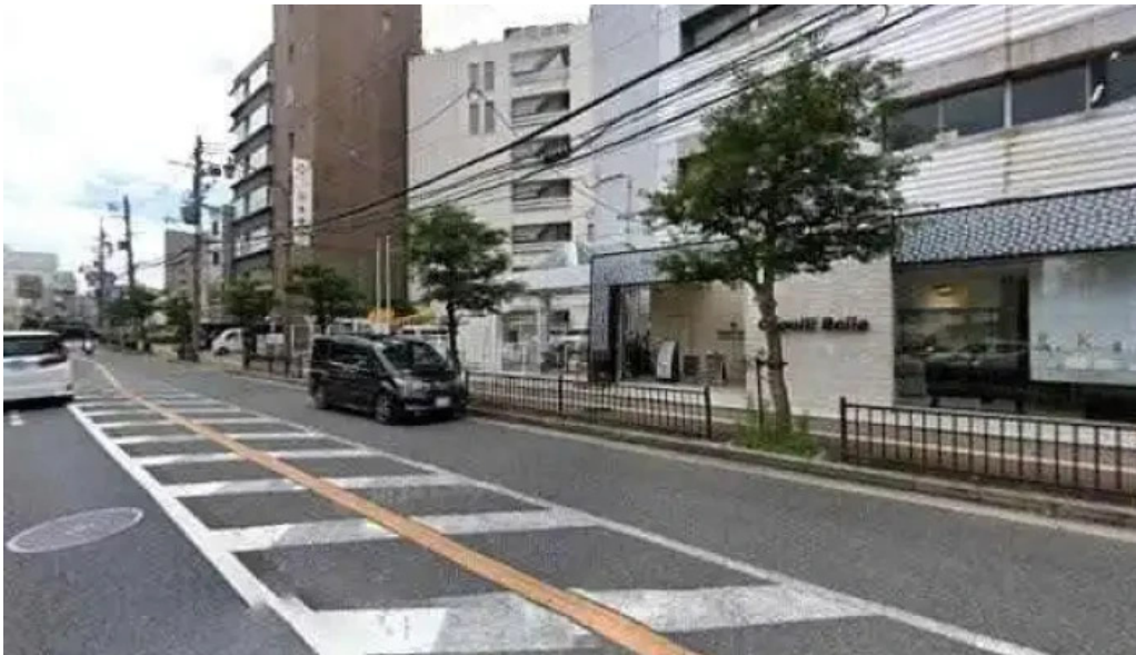
松屋 枚方店 枚方市