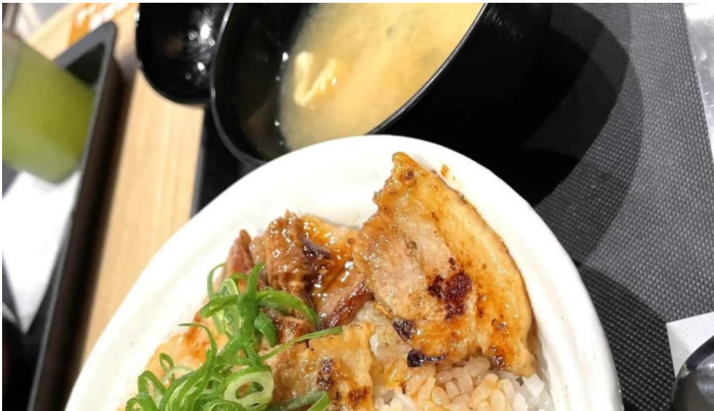
松屋 枚方店 エリア