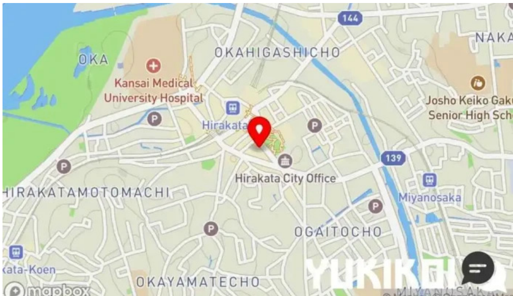
松屋 枚方店 地図