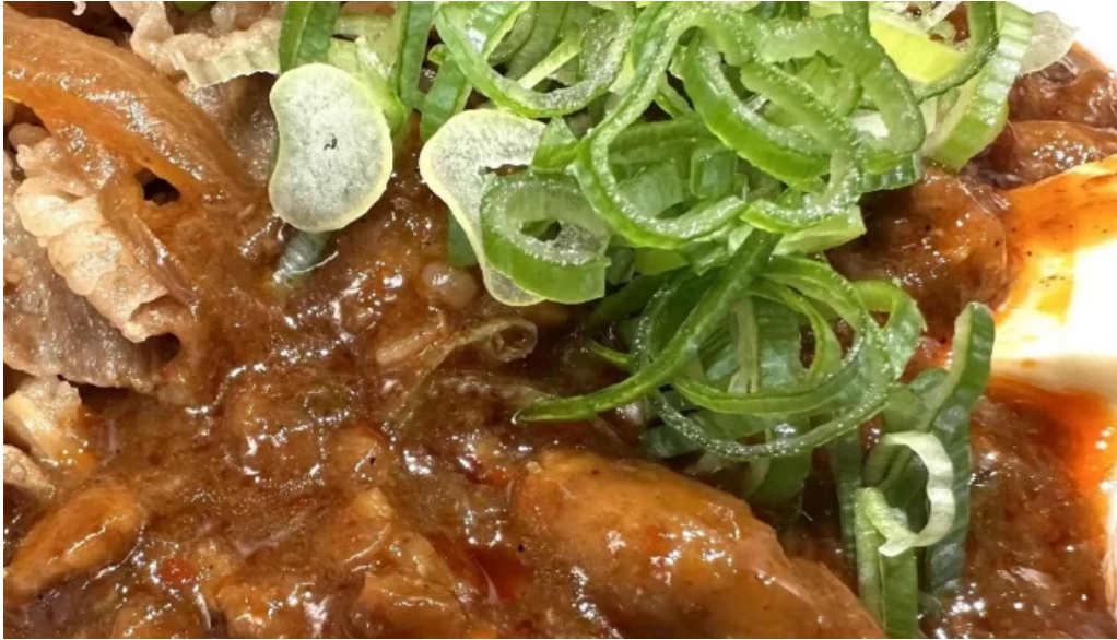
松屋 枚方店 ウェブサイト