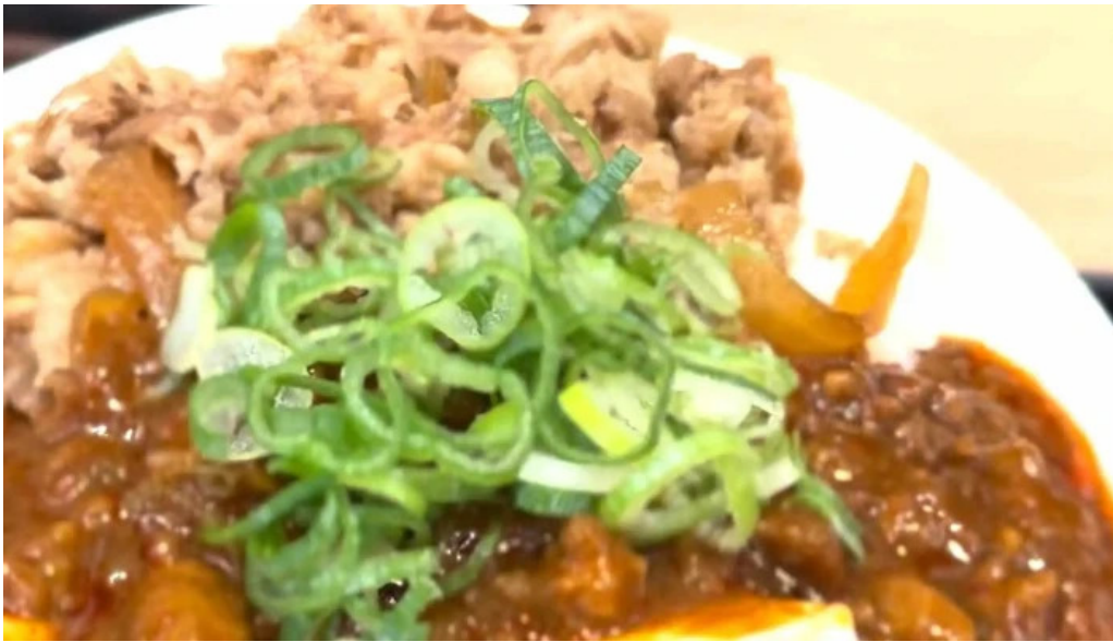
松屋 枚方店 動画