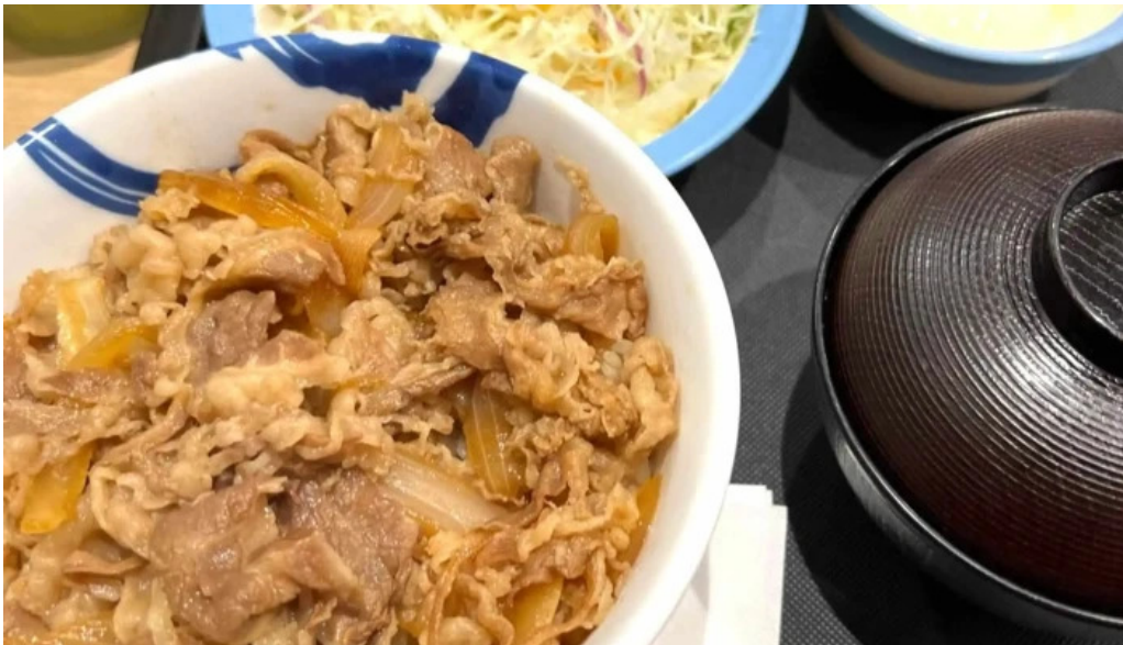
松屋 枚方店 どこ