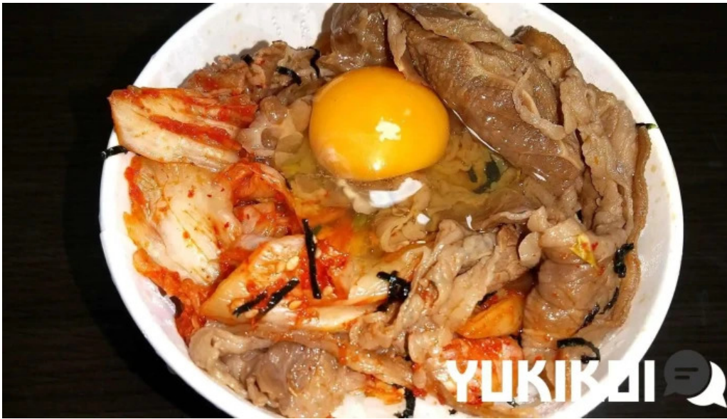
松屋 枚方店 牛丼