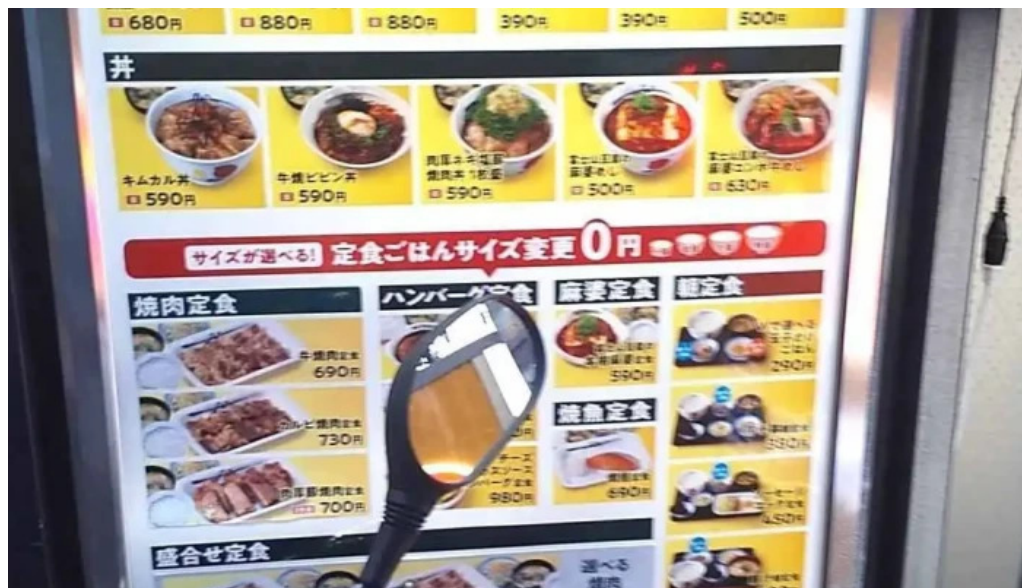
松屋 枚方店 メニュー