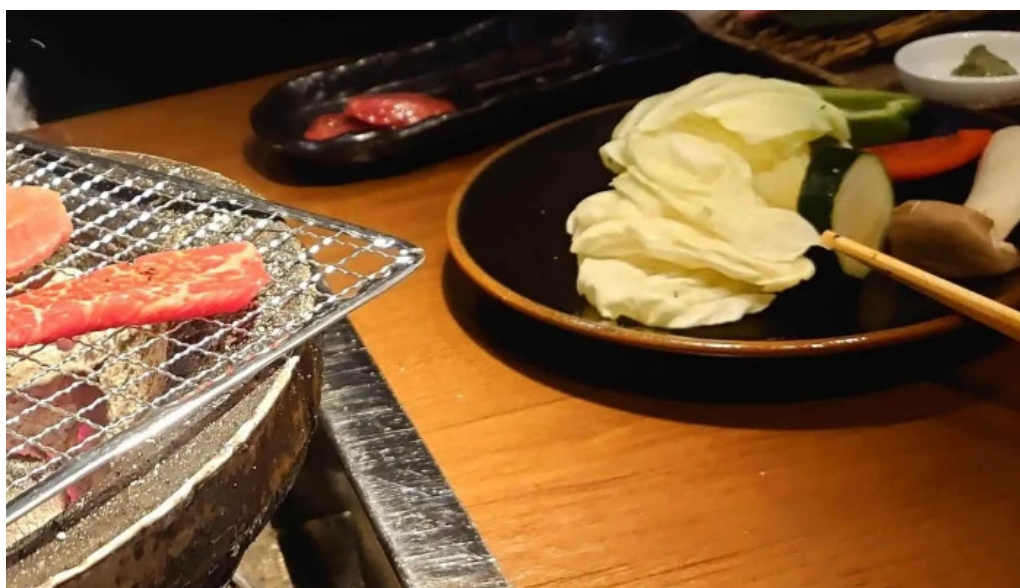
肉匠 綾商店 行き方