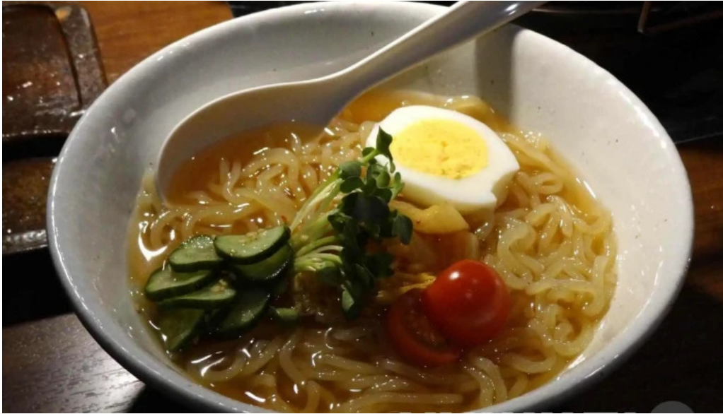
肉匠 綾商店 ラーメン