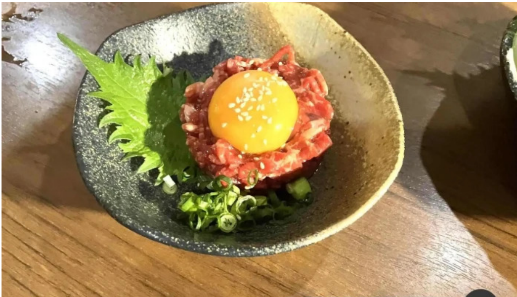
肉匠 綾商店 ユッケ