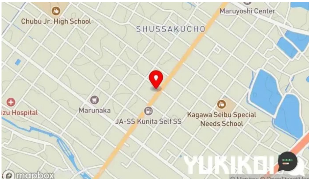
肉匠 綾商店 地図