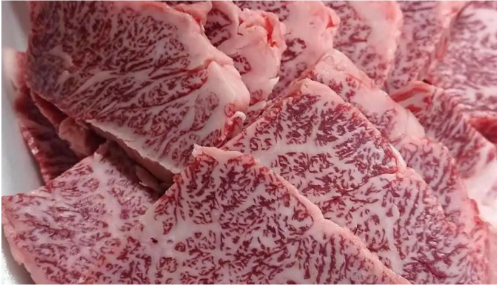
肉匠 綾商店 料理飲み物