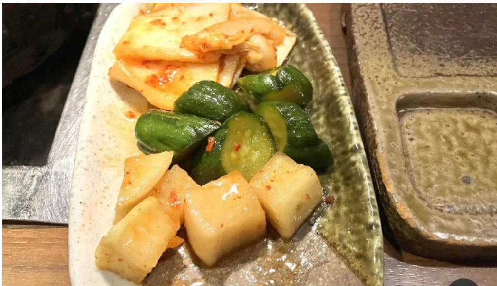
肉匠 綾商店 キムチ