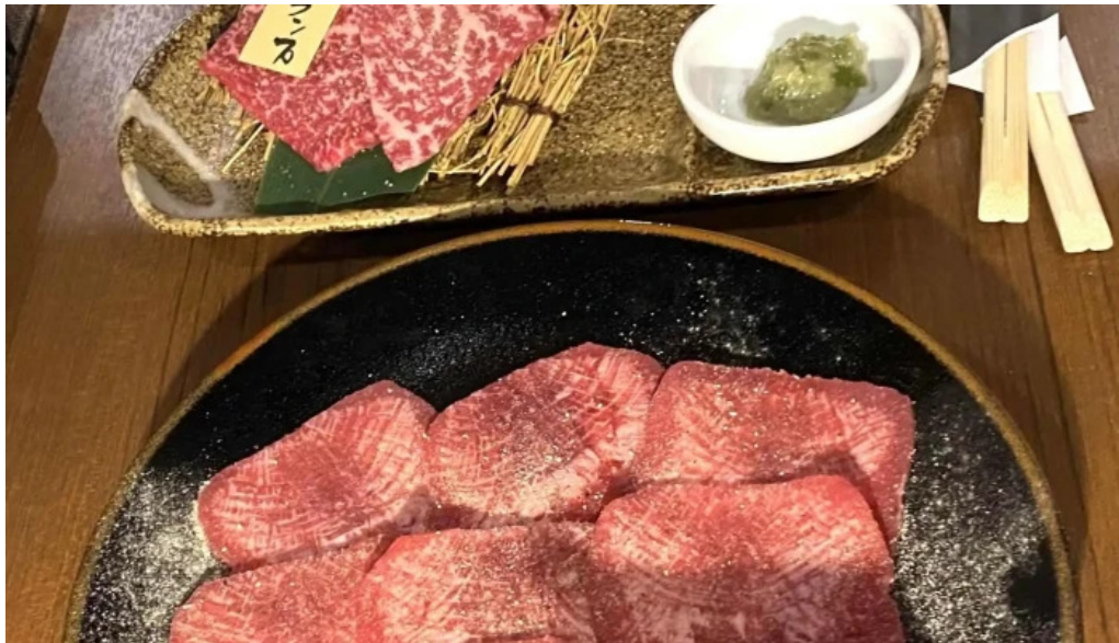
肉匠 綾商店 コメント