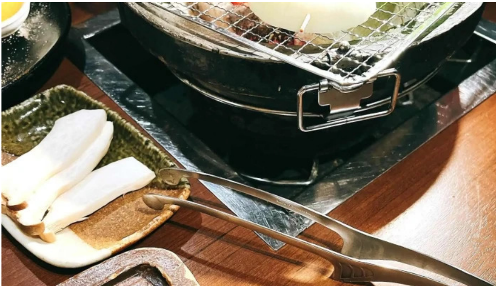
肉匠 綾商店 写真