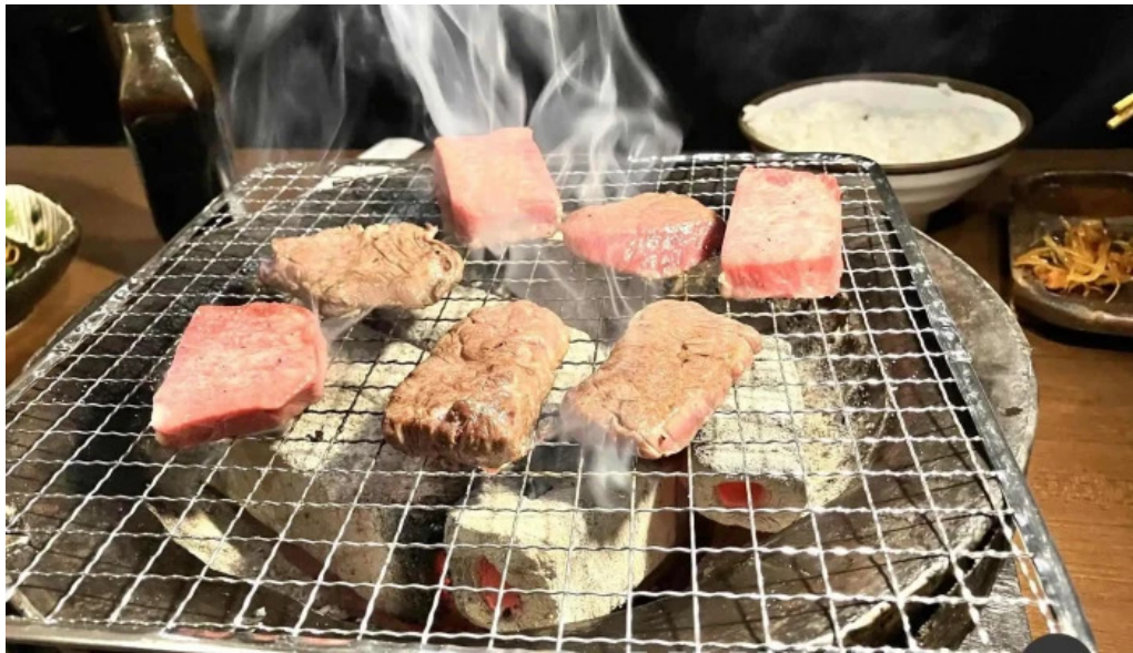
肉匠 綾商店 バーベキュー