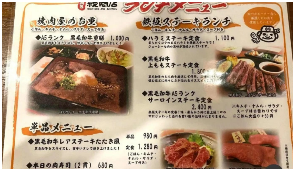
肉匠 綾商店 メニュー