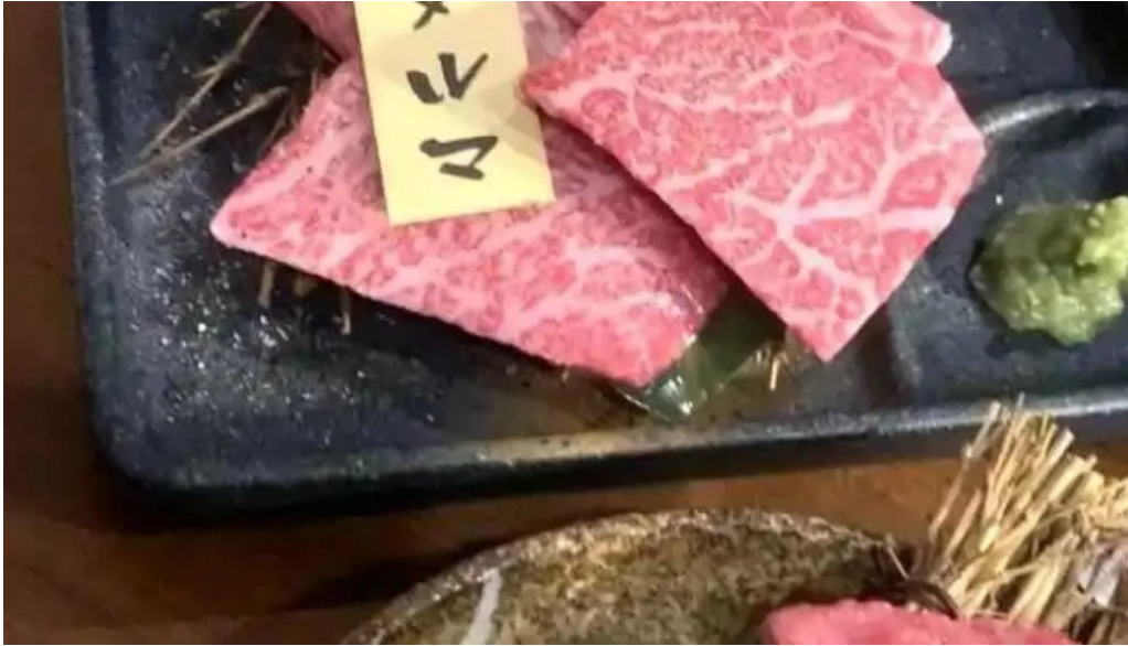
肉匠 綾商店 動画