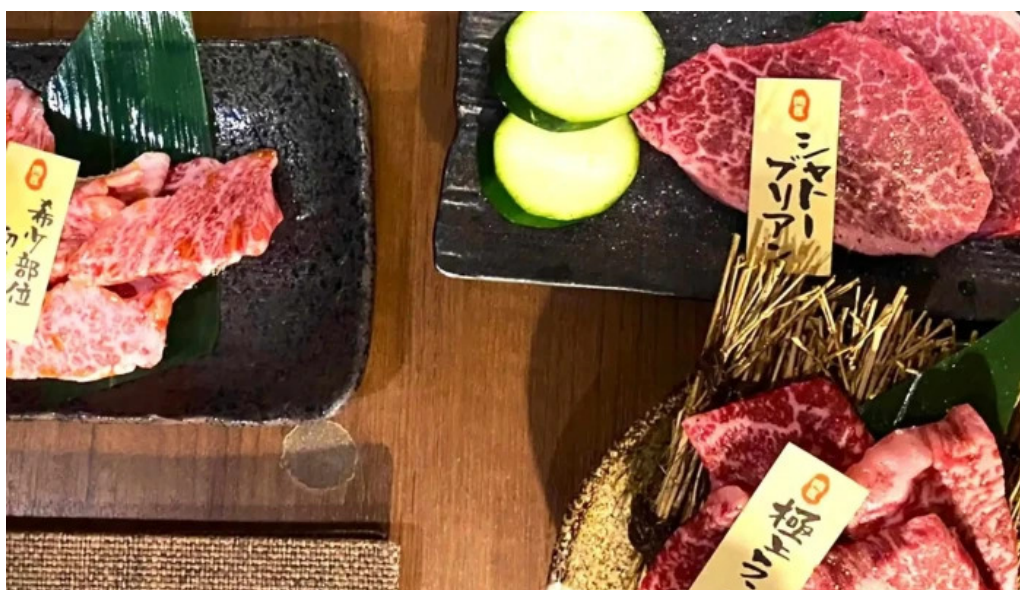
肉匠 綾商店 番号