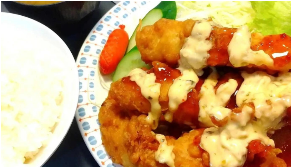
焼肉定食 カトウ instagram