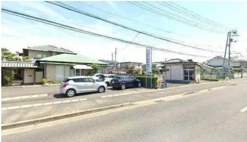
焼肉定食 カトウ 観音寺市