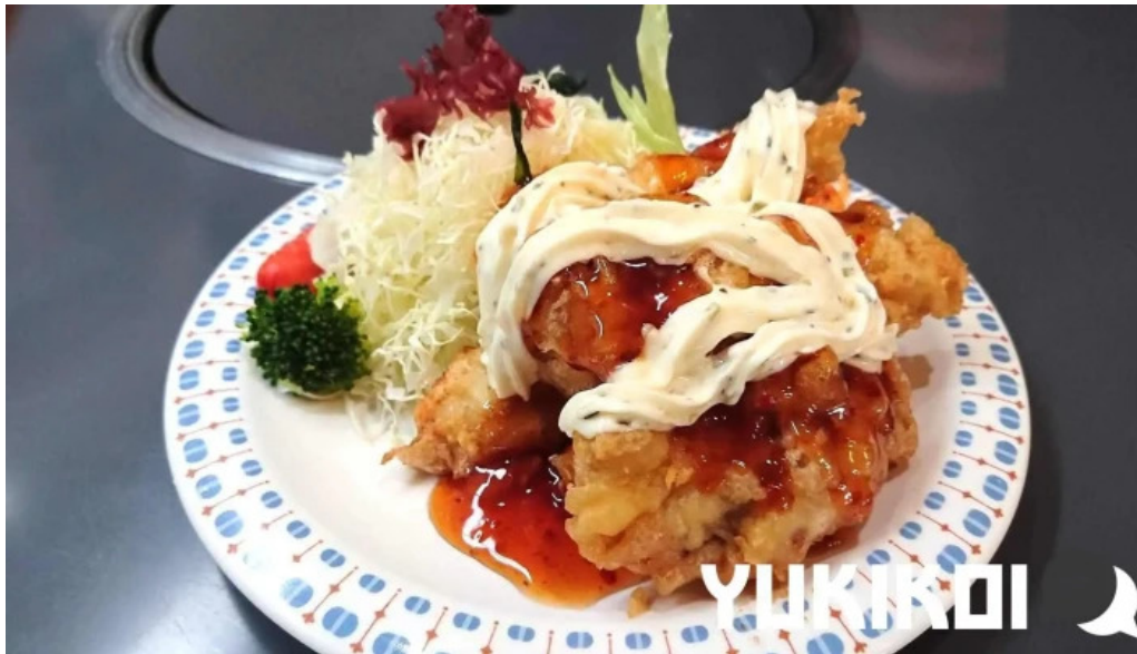
焼肉定食 カトウ 料理飲み物