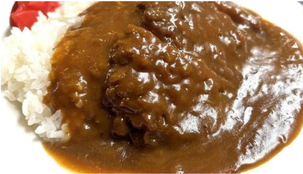
焼肉定食 カトウ カレー