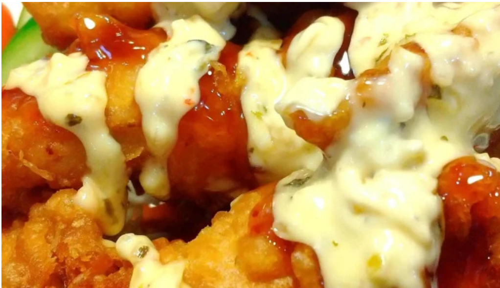
焼肉定食 カトウ 近く