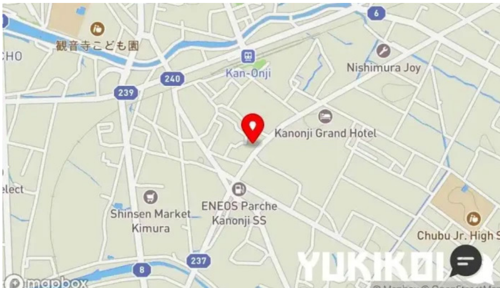
焼肉定食 カトウ 地図