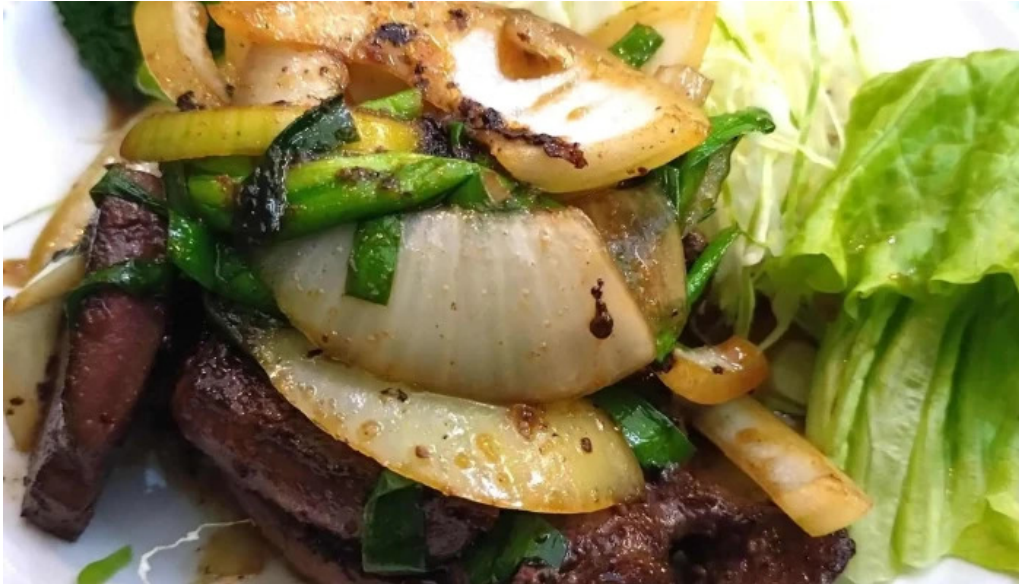
焼肉定食 カトウ 住所