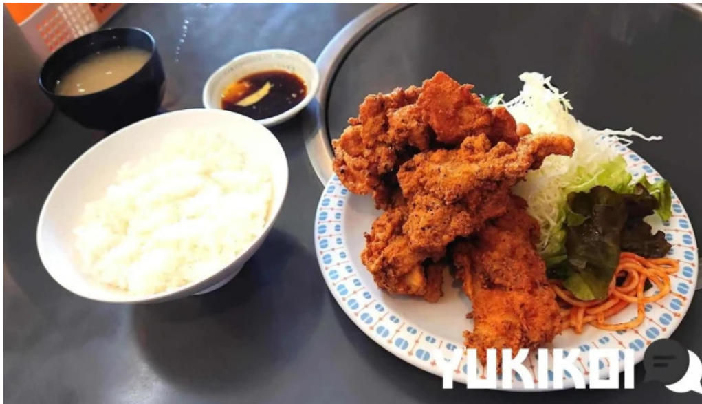
焼肉定食 カトウ 豚カツ