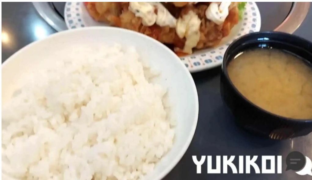
焼肉定食 カトウ 動画