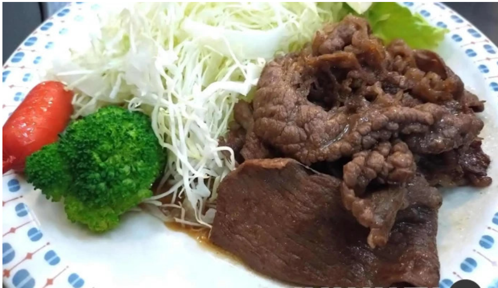
焼肉定食 カトウ 最新