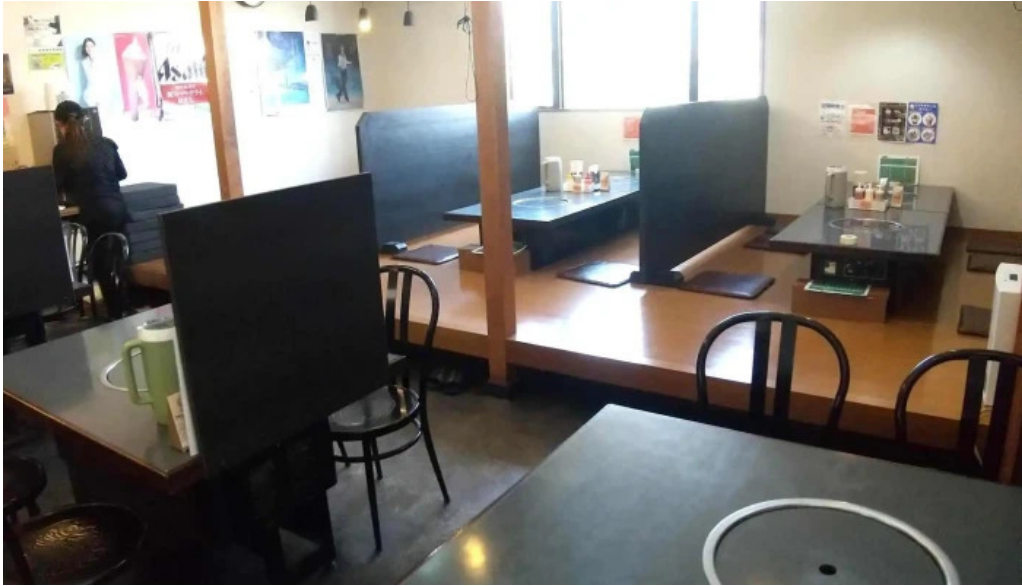
焼肉定食 カトウ 雰囲気