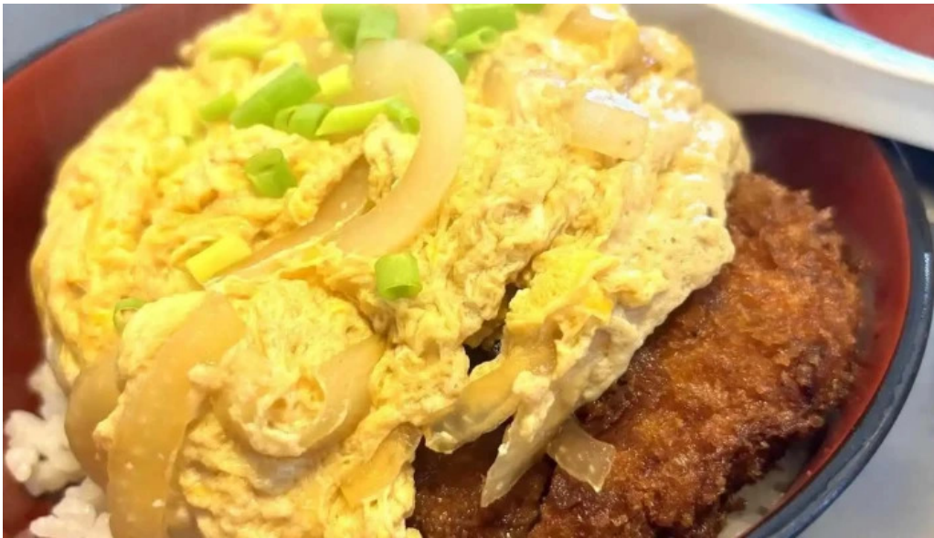
焼肉定食 カトウ カツ丼