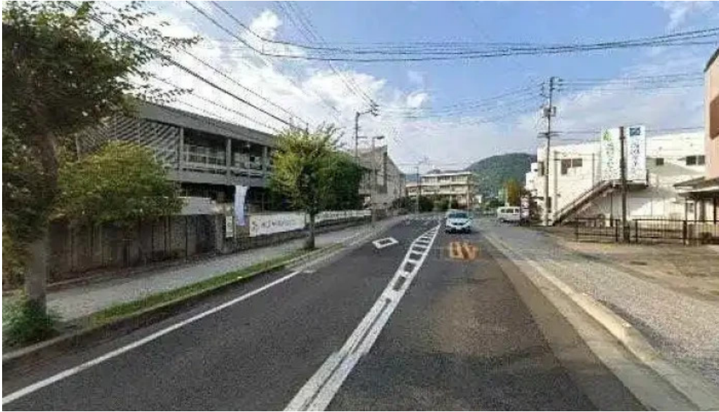
ほるもん屋とも八 観音寺市