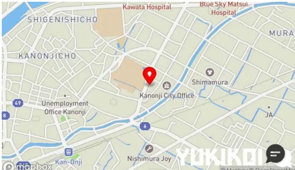
ほるもん屋とも八 地図