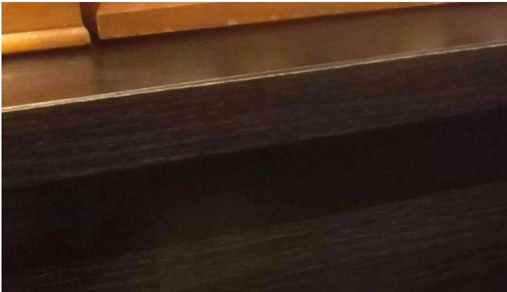
ほるもん屋とも八 どころ