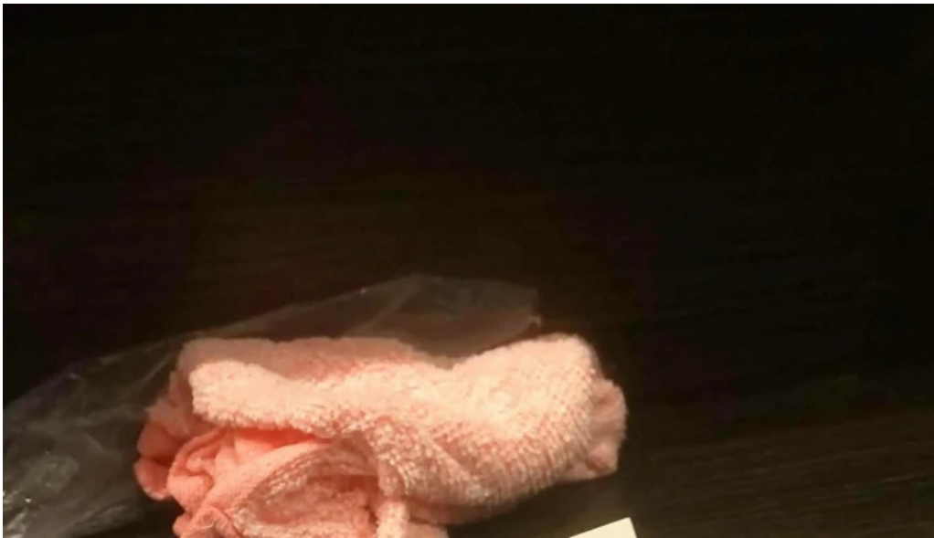
ほるもん屋とも八 写真