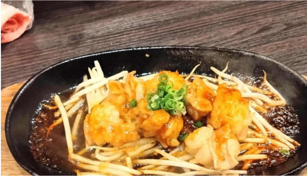
ほるもん屋とも八 割引