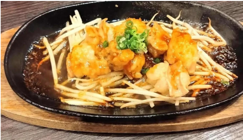
ほるもん屋とも八 料理飲み物