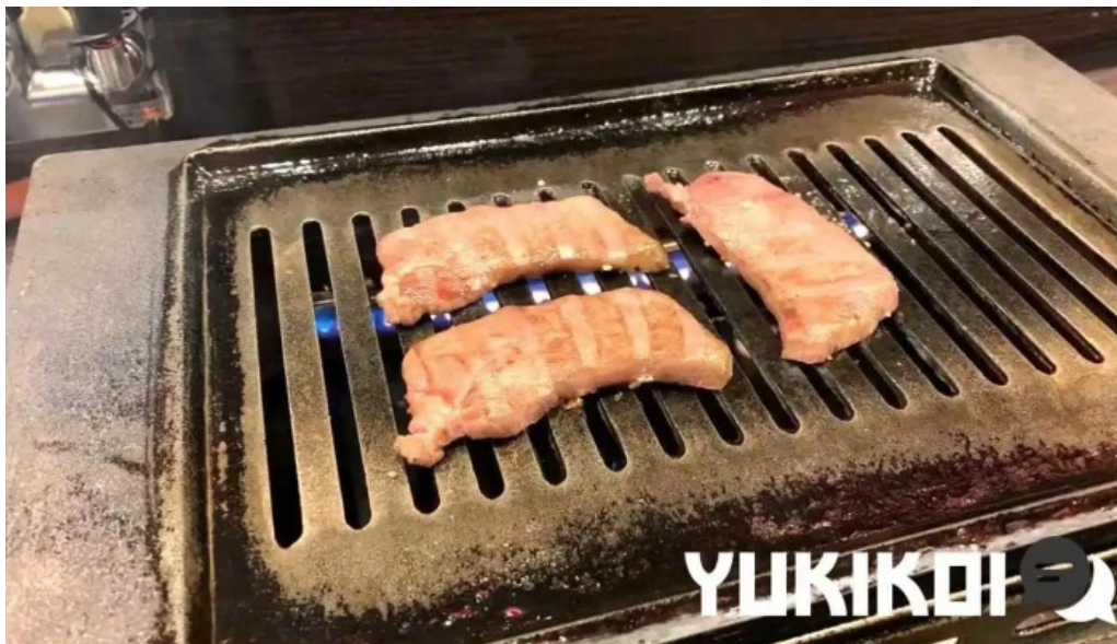
ほるもん屋とも八 動画