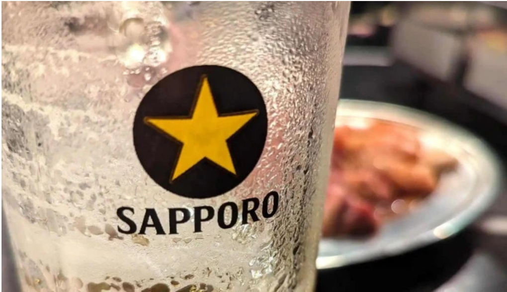
ほるもん屋とも八コメント