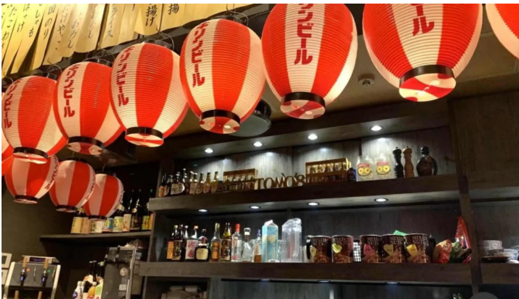
ほ르몬屋とも八 雰囲気