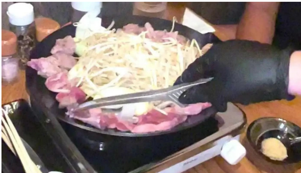
網走 生ラムジンギスカンフラミンゴ 動画