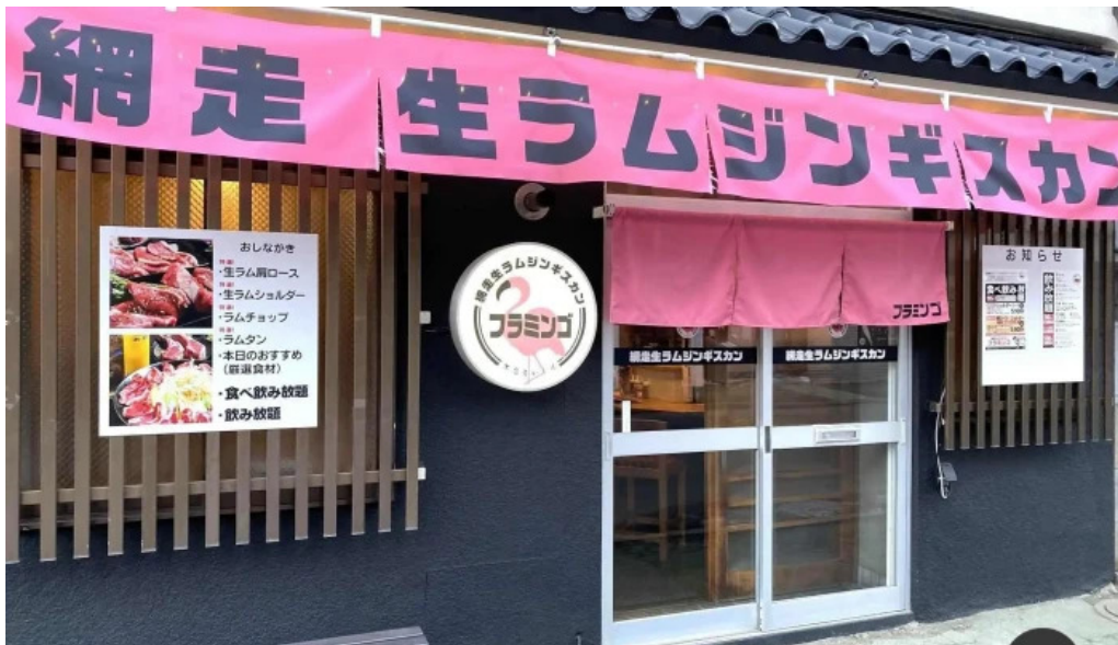
網走 生ラムジンギスカンフラミンゴ すべて