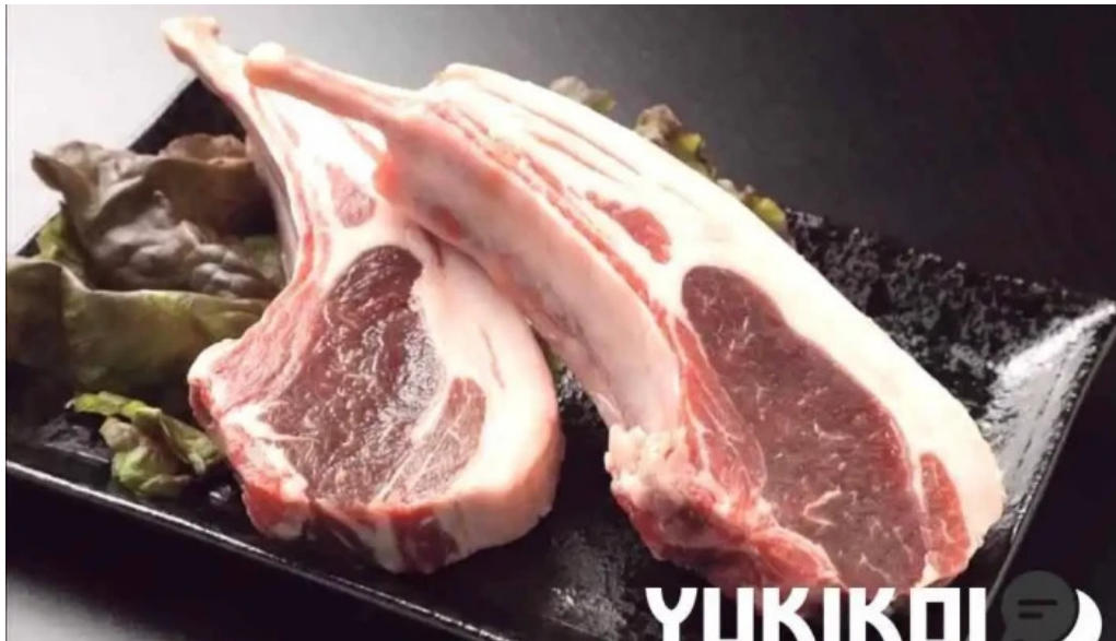
網走 生ラムジンギスカンフラミンゴ