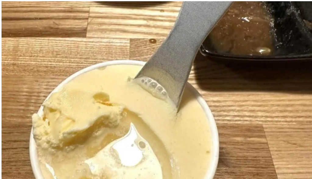
網走 生ラムジンギスカンフラミンゴ 最新