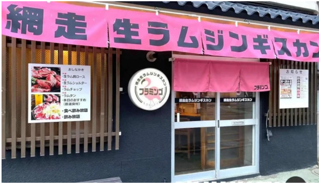
網走 生ラムジンギスカンフラミンゴ 網走市