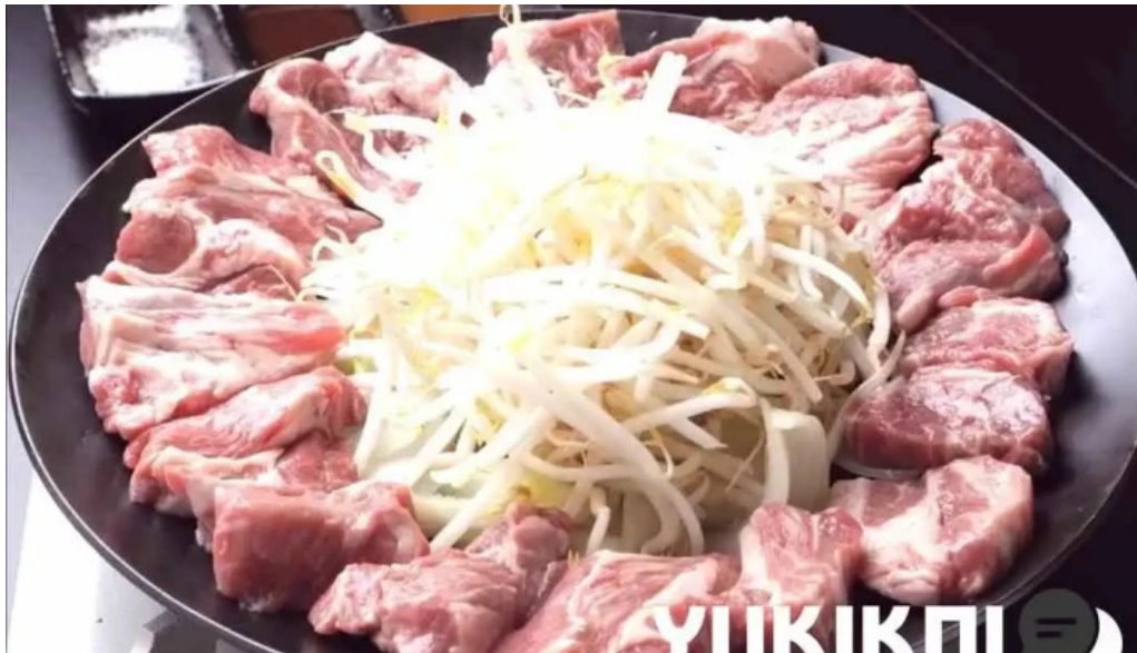
網走 生ラムジンギスカンフラミンゴ 料理飲み物