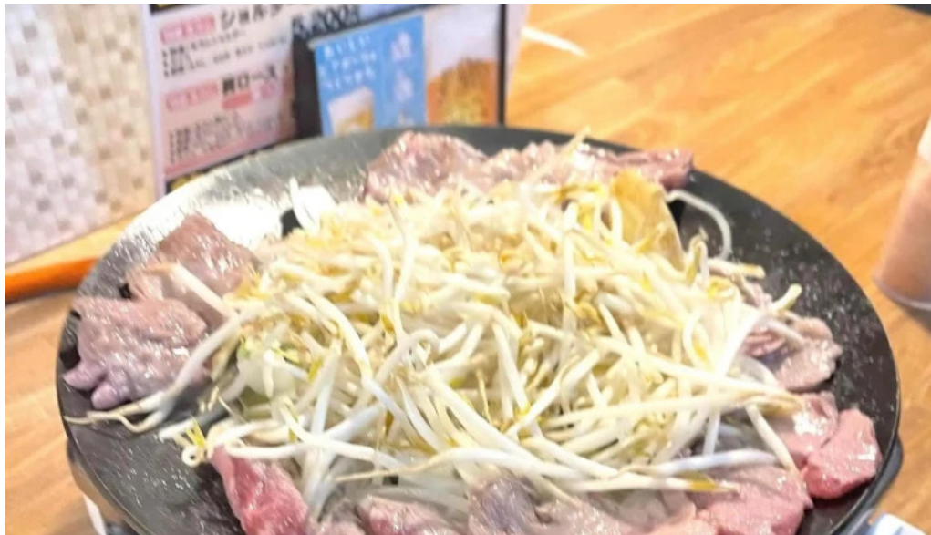
網走 生ラムジンギスカンフラミンゴ comentario 6