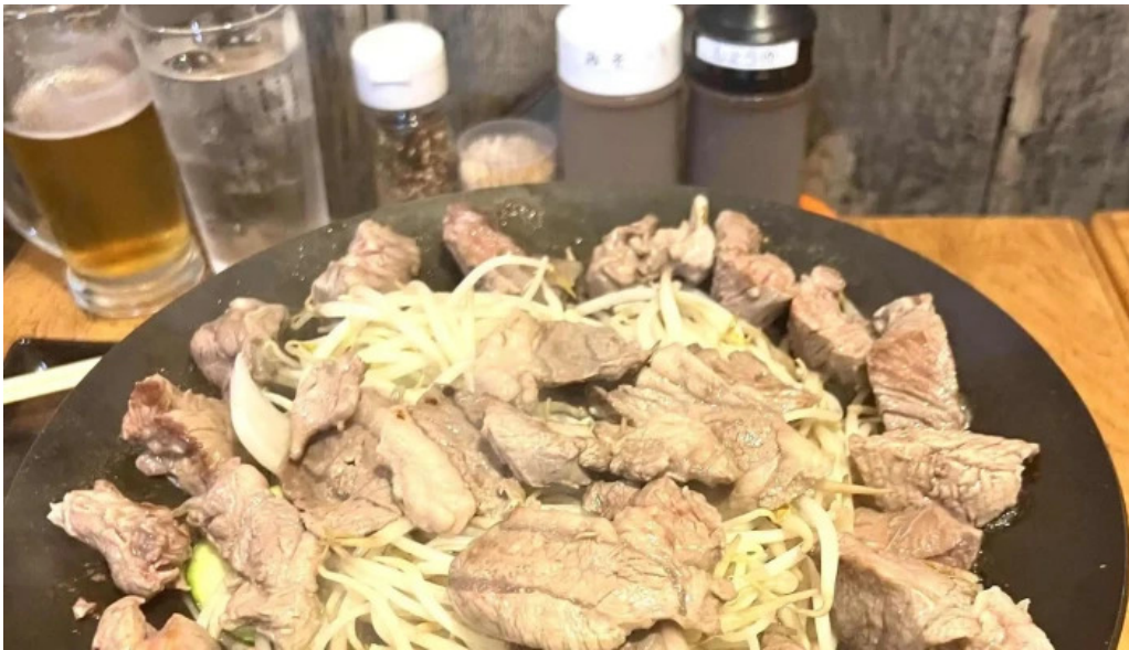
網走 生ラムジンギスカンフラミンゴ comentario 4