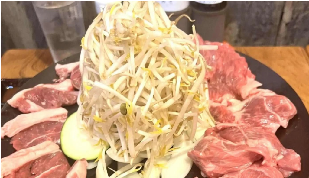
網走 生ラムジンギスカンフラミンゴ comentario 2