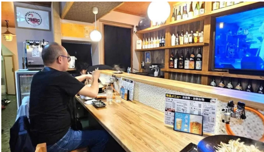
網走 生ラムジンギスカンフラミンゴ 雰囲気