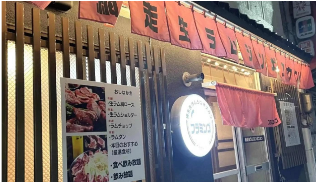
網走 生ラムジンギスカンフラミンゴ comentario 7