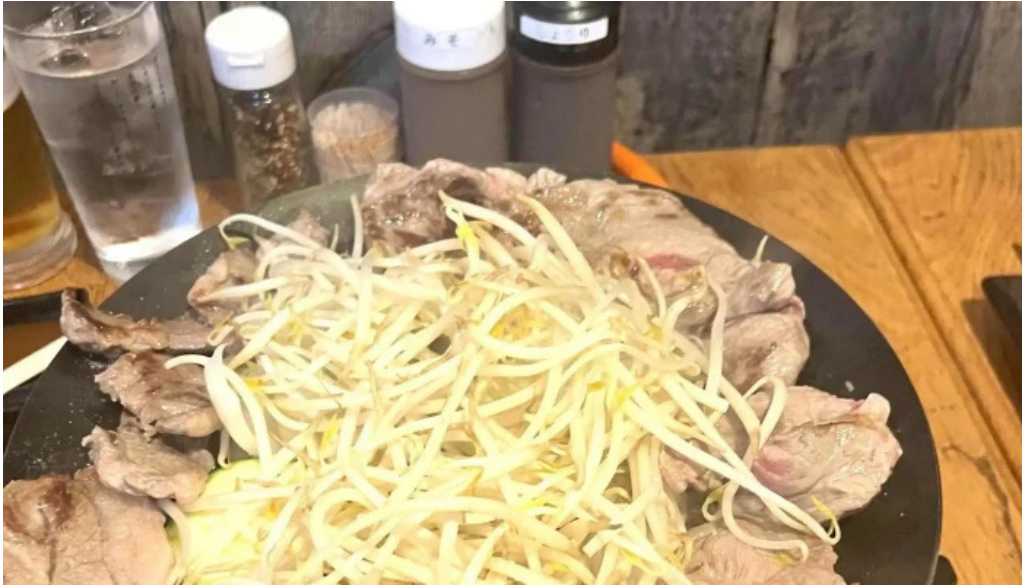
網走 生ラムジンギスカンフラミンゴ comentario 3