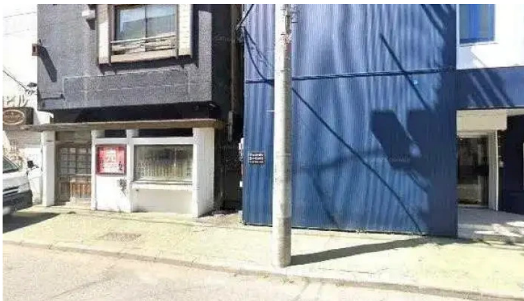
網走 生ラムジンギスカンフラミンゴ ストリートビューと 360 ビュー