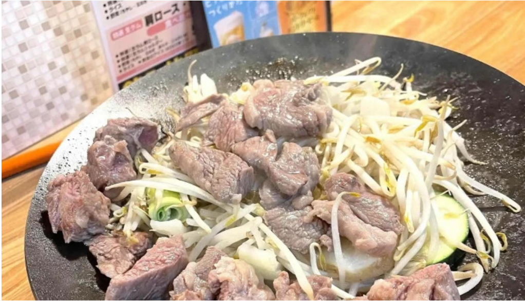
網走 生ラムジンギスカンフラミンゴ comentario 5