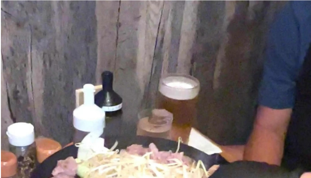
網走 生ラムジンギスカンフラミンゴ comentario 1