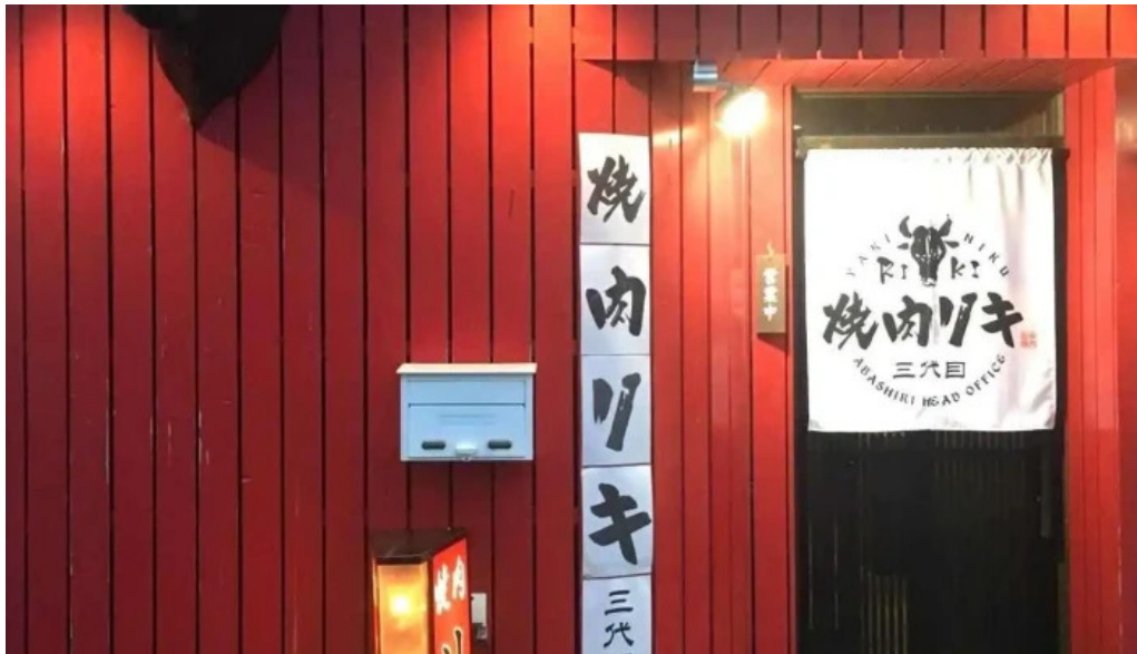
焼肉リキ三代目 すべて