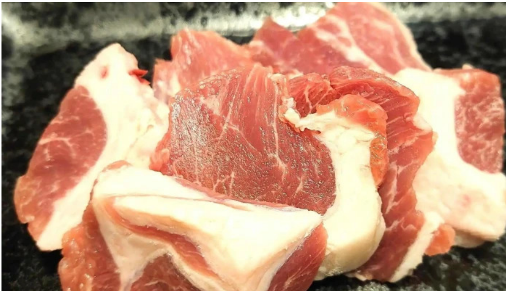
焼肉リキ三代目 comentario 2