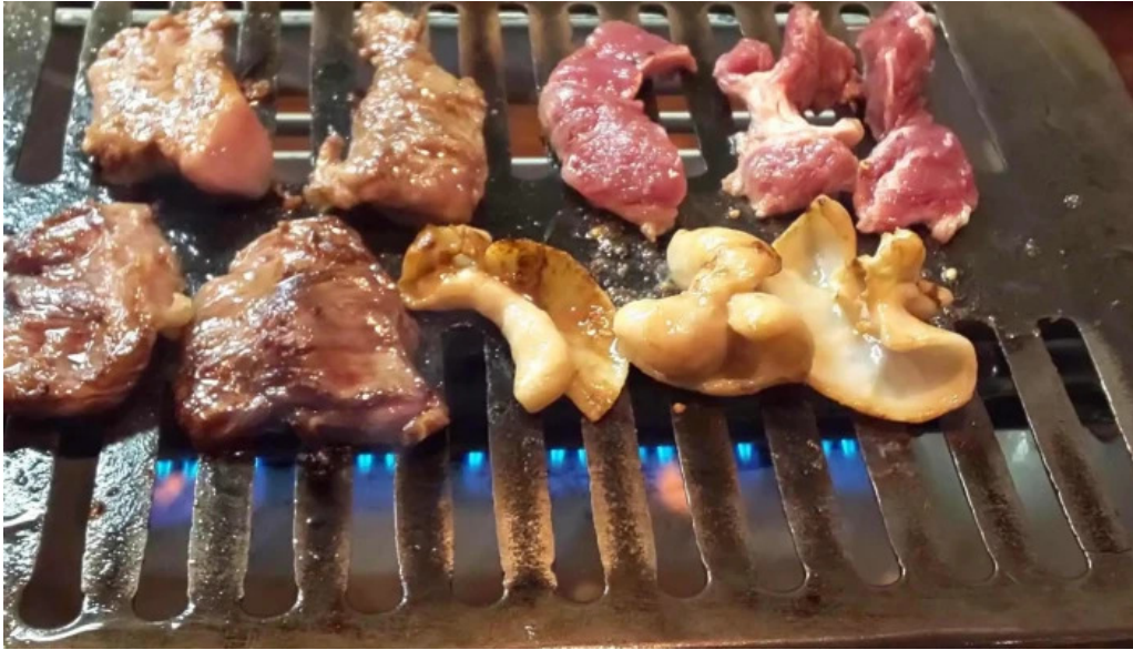
焼肉リキ三代目 comentario 5