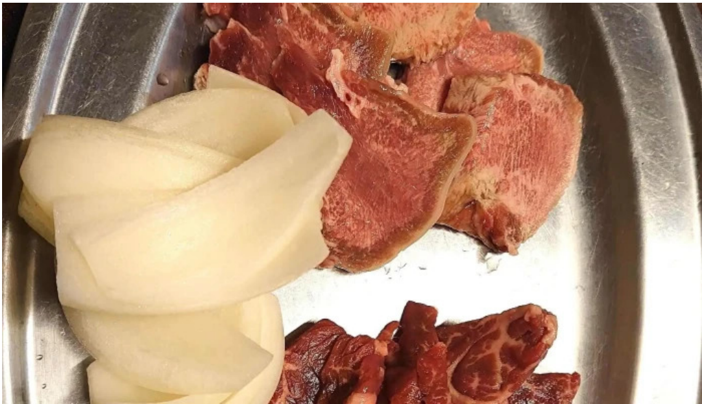
焼肉リキ三代目 comentario 4