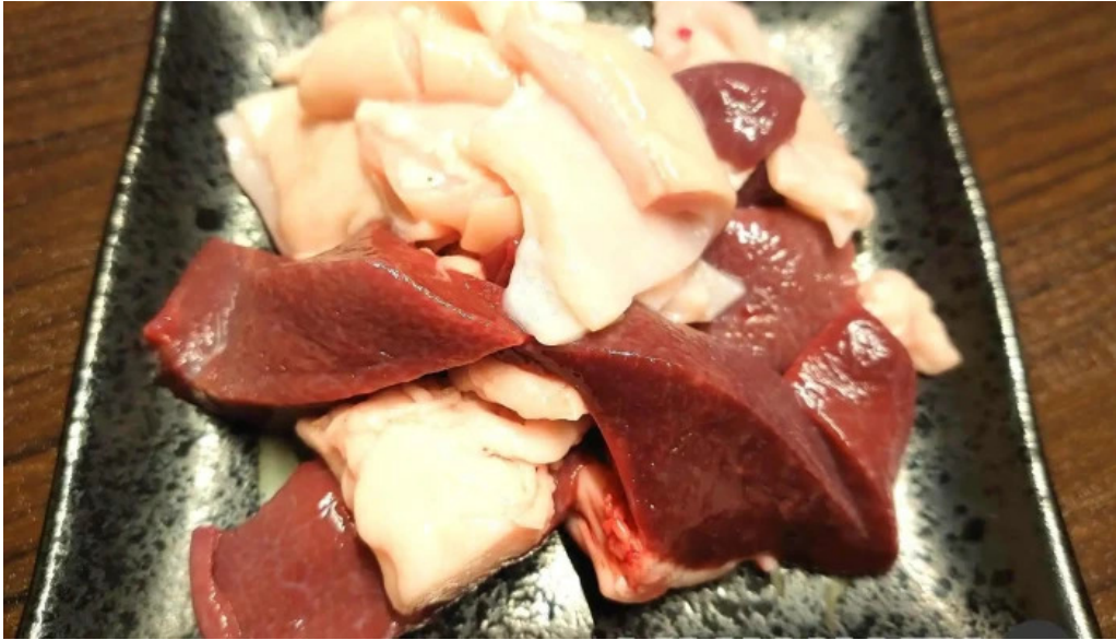
焼肉リキ三代目 ホルモン焼き