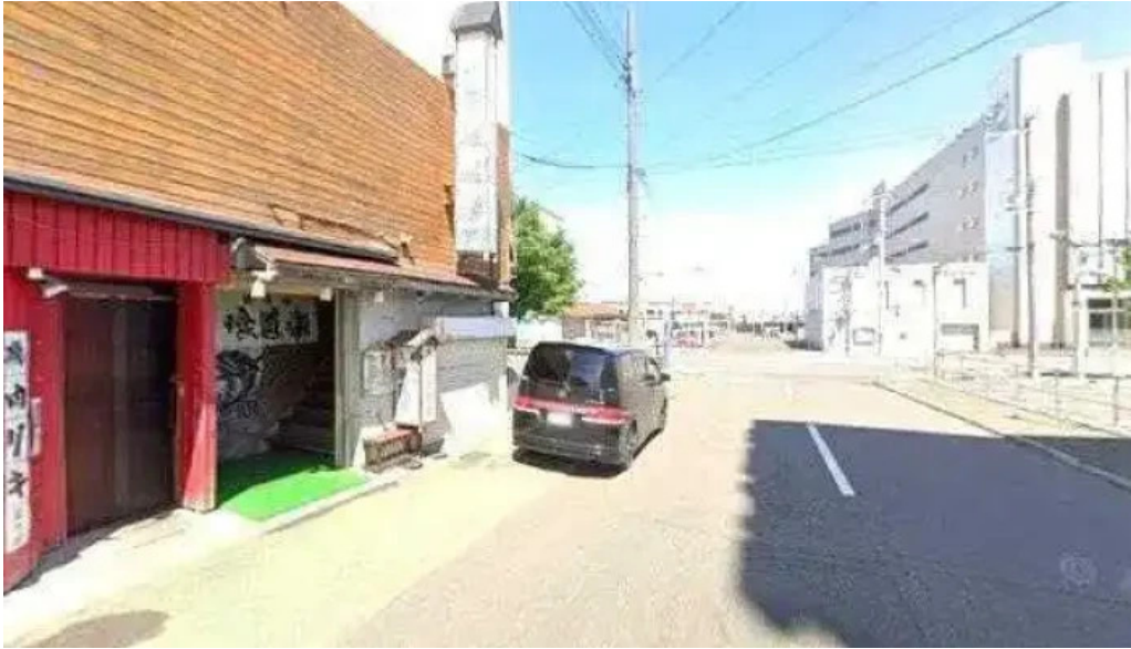
焼肉リキ三代目 ストリートビューと 360 ビュー