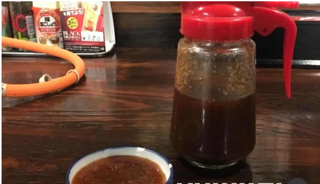
焼肉リキ三代目 料理飲み物