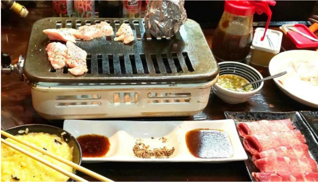
焼肉リキ三代目 comentario 7