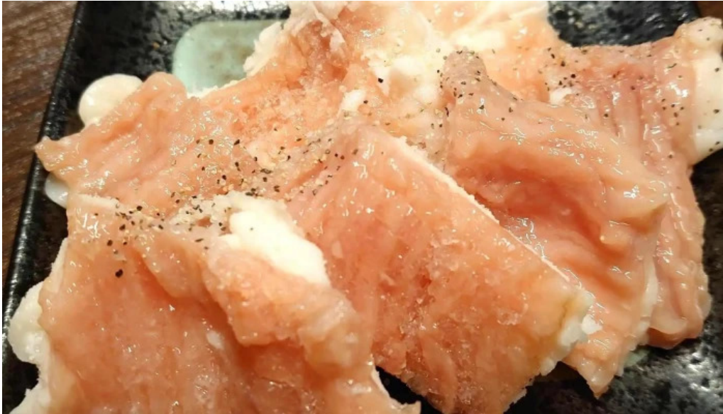
焼肉リキ三代目 comentario 1