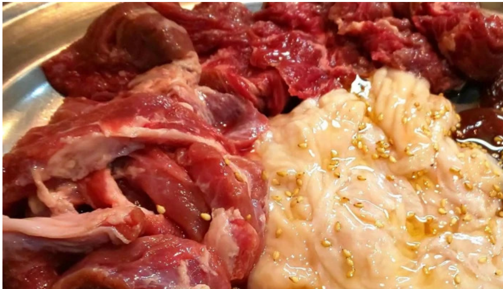
焼肉リキ三代目 comentario 8