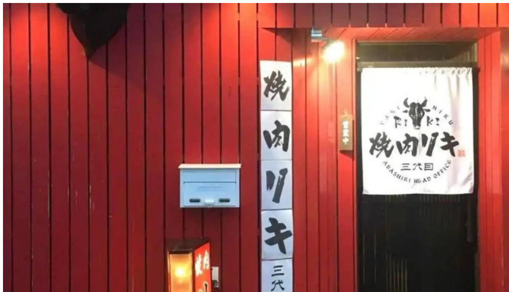
焼肉リキ三代目 網走市