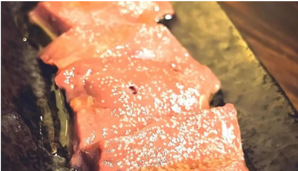
焼肉リキ三代目 オーナー提供