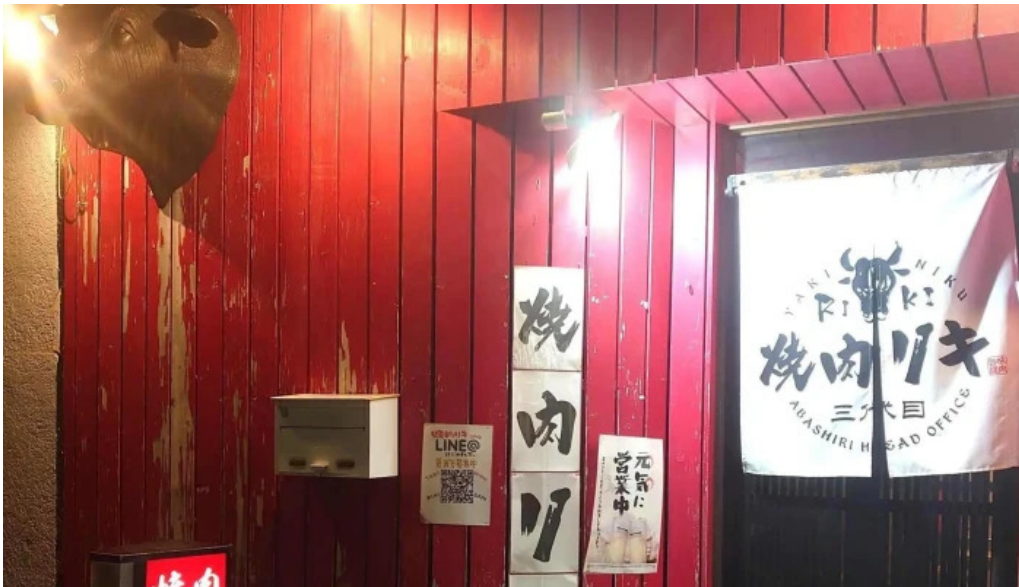
焼肉リキ三代目 comentario 3