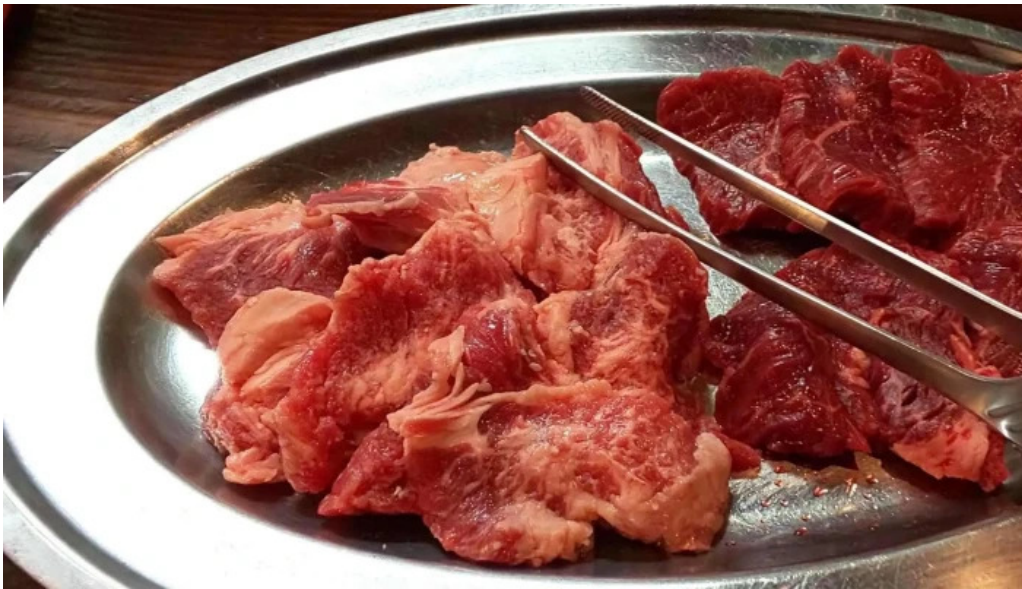
焼肉リキ三代目 comentario 6