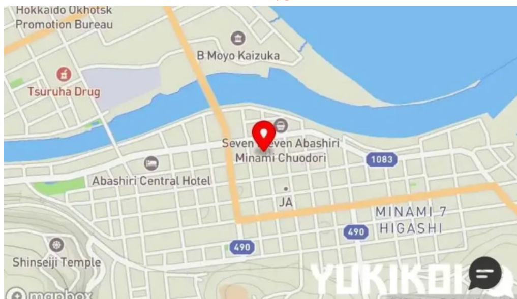
焼肉パンサン 二代目地図