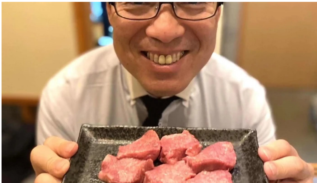
焼肉パンサン 二代目 comentario 3