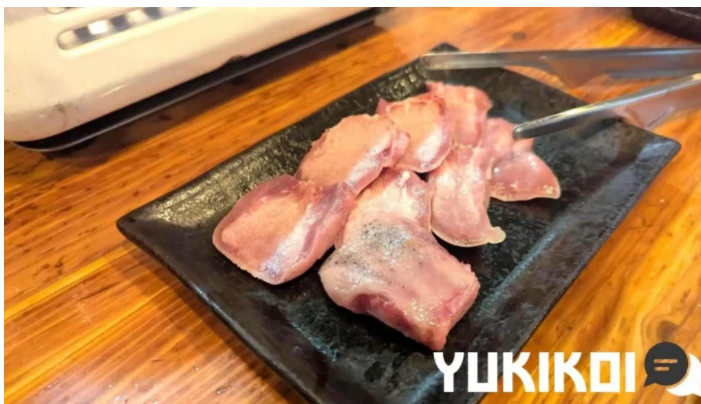
焼肉パンサン 二代目 最新