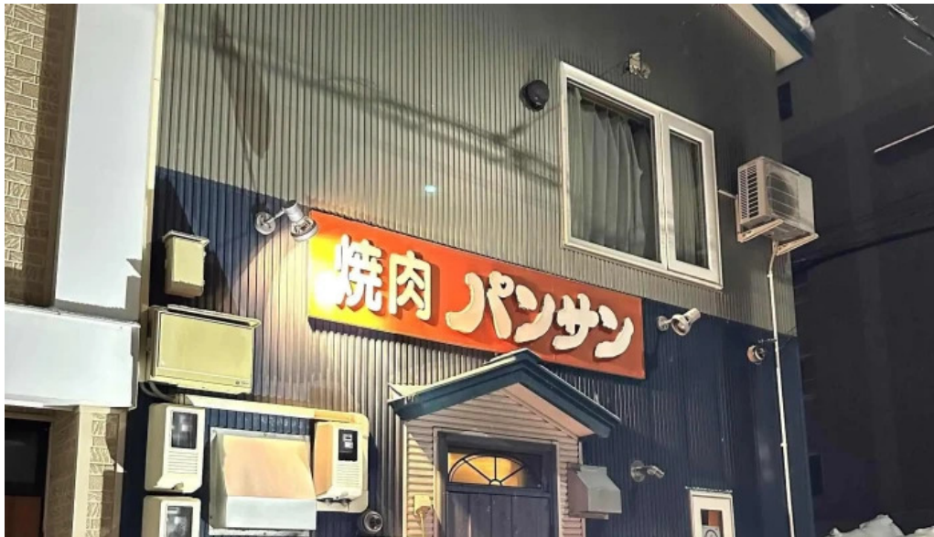
焼肉パンサン 二代目 comentario 6