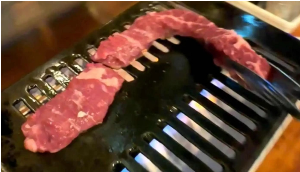
焼肉パンサン 二代目 動画