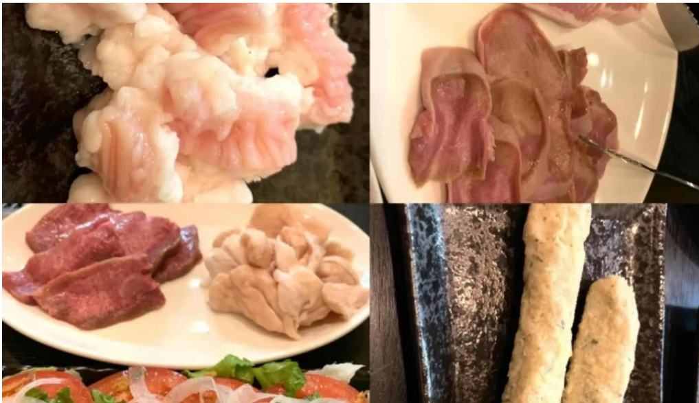
焼肉パンサン 二代目 comentario 8