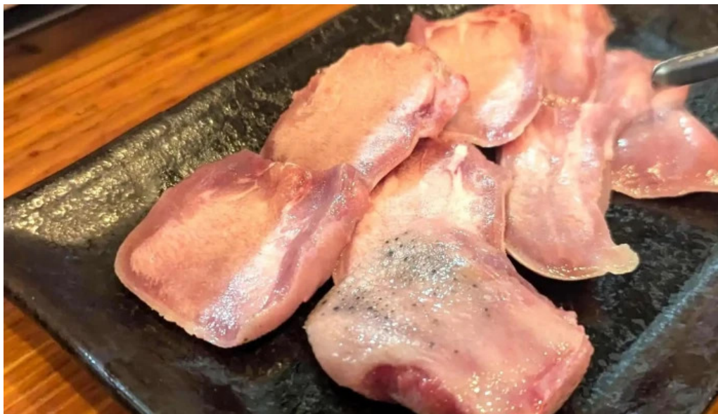
焼肉パンサン 二代目 comentario 5