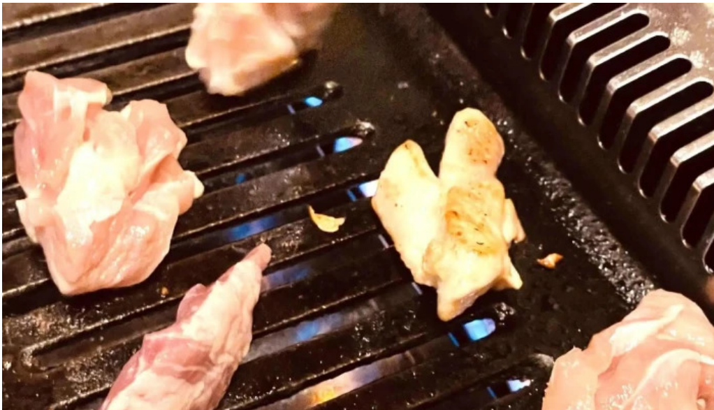
焼肉パンサン 二代目 comentario 1