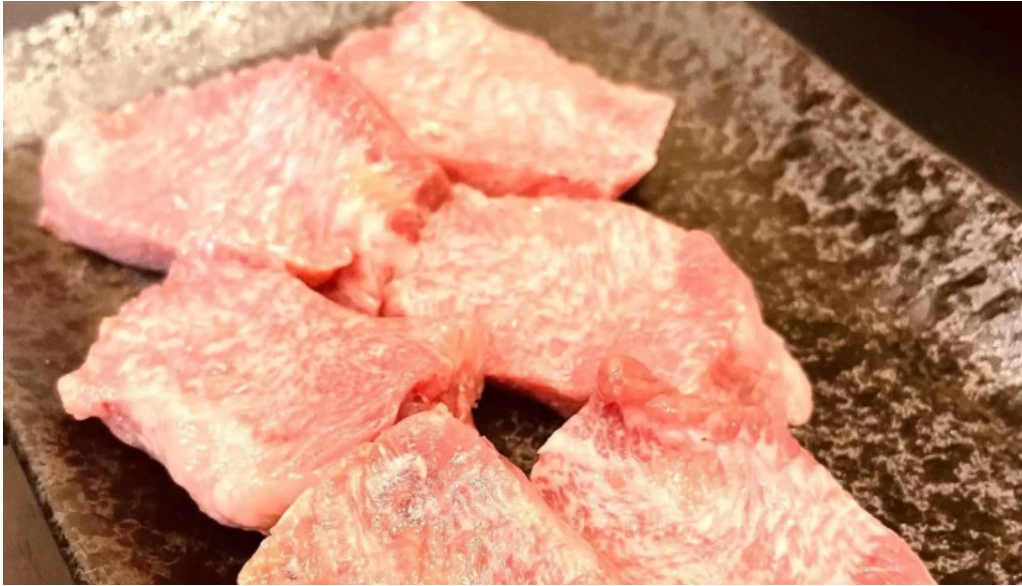
焼肉パンサン 二代目 comentario 2