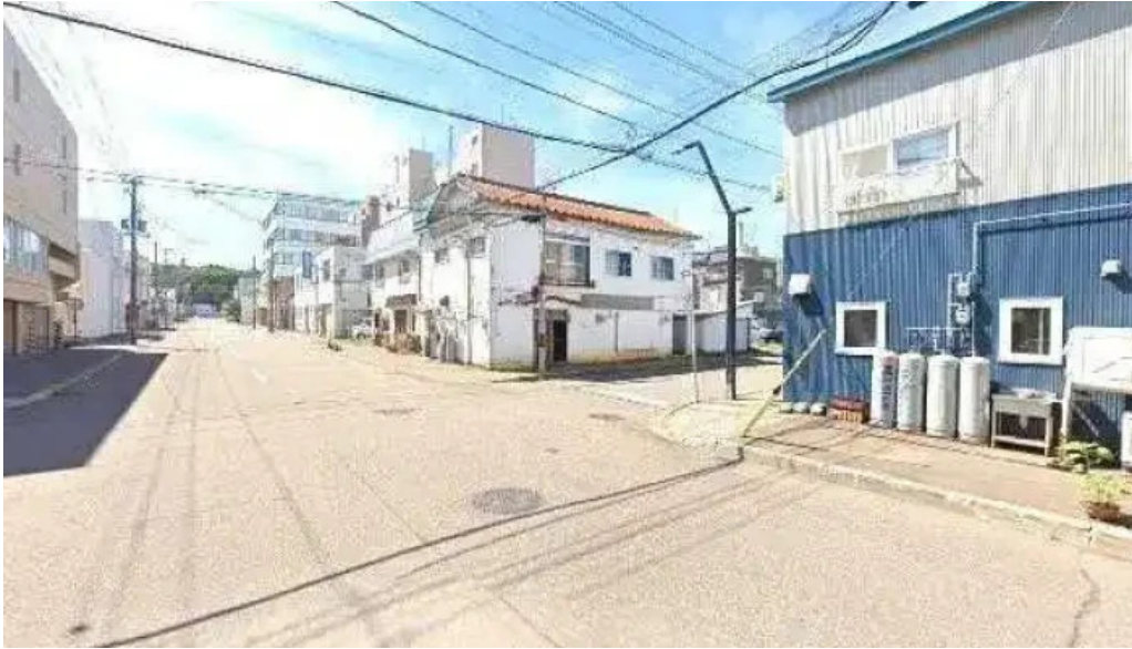
焼肉パンサン 二代目 ストリートビューと 360 ビュー