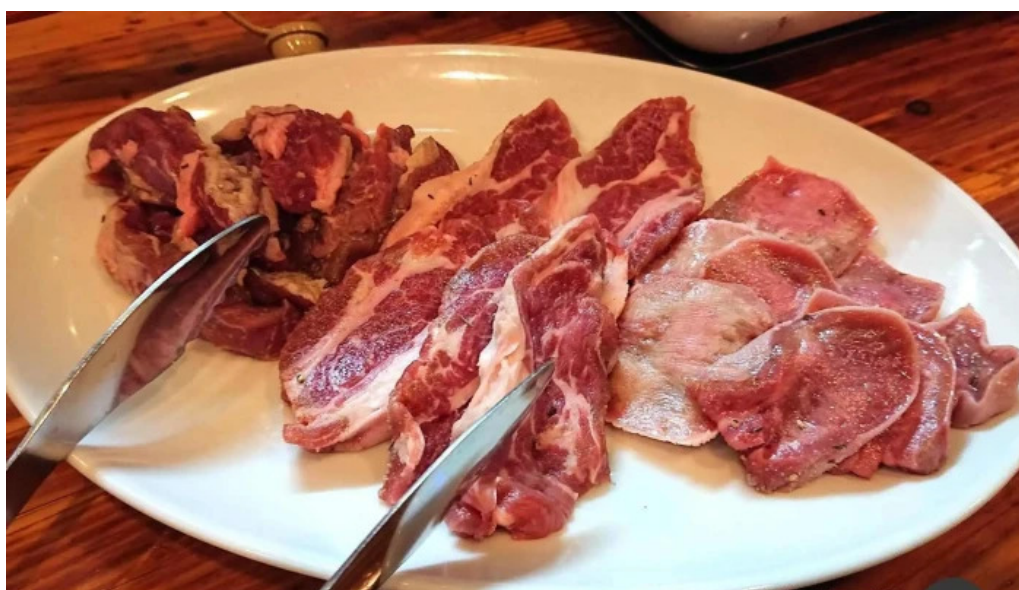
焼肉パンサン 二代目 料理飲み物