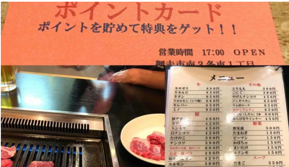
焼肉パンサン 二代目 comentario 7