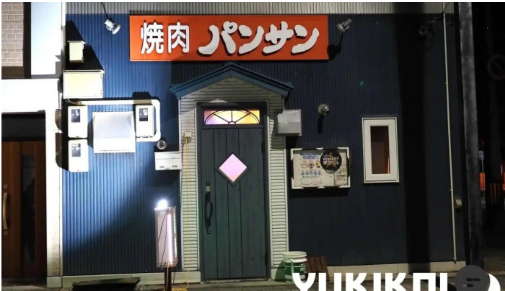
焼肉パンサン 二代目 すべて