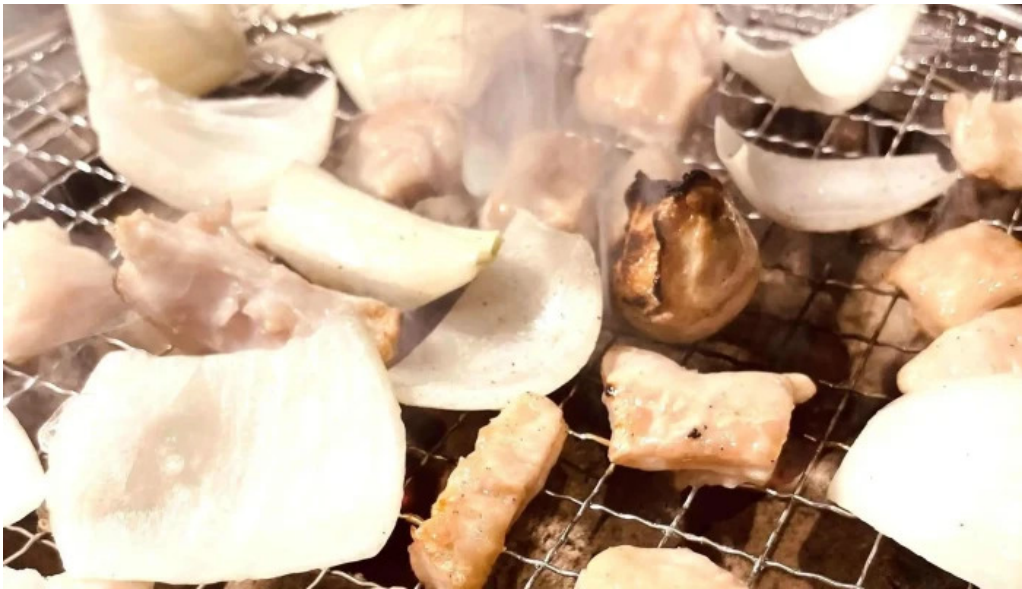
焼肉 ダイニング 萬次郎 comentario 3