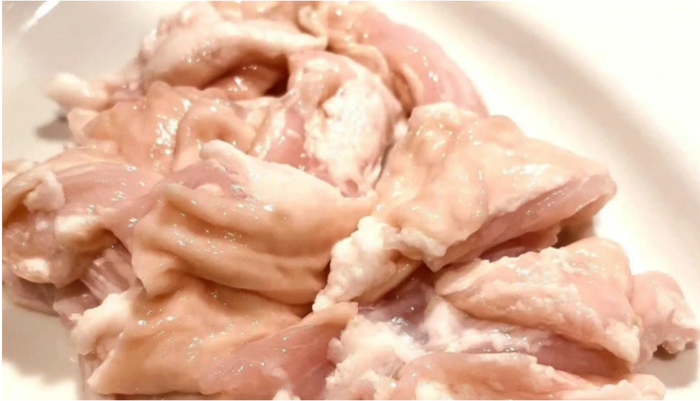
焼肉 ダイニング 萬次郎 comentario 4