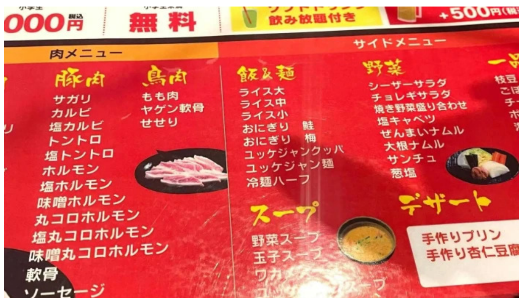
焼肉 ダイニング 萬次郎 comentario 6