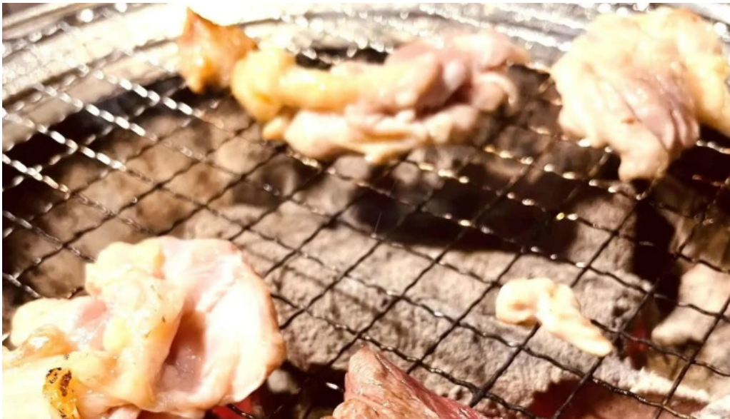
焼肉 ダイニング 萬次郎 comentario 1