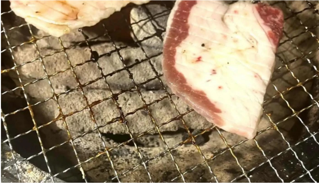
焼肉 ダイニング 萬次郎 バーベキュー