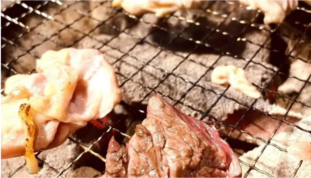
焼肉 ダイニング 萬次郎 すべて