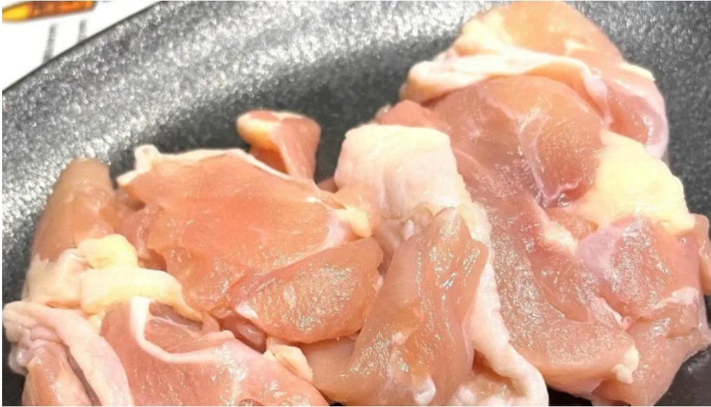
焼肉 ダイニング 萬次郎 comentario 2