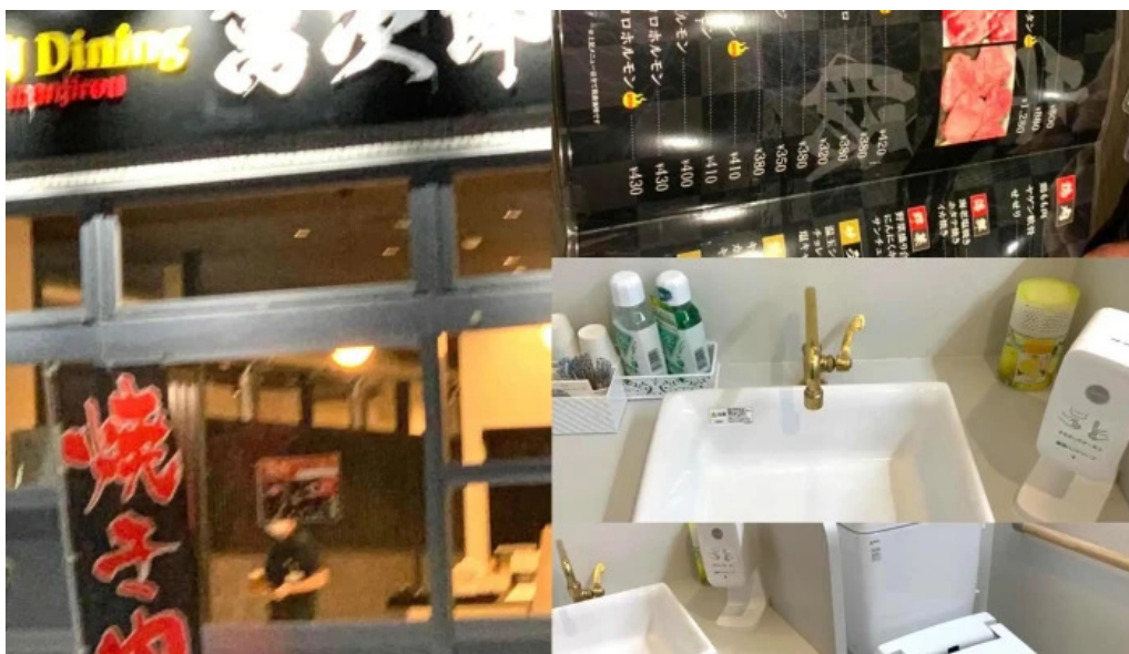
焼肉 ダイニング 萬次郎 メニュー