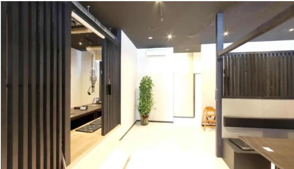
焼肉 ダイニング 萬次郎 ストリートビューと 360 ビュー