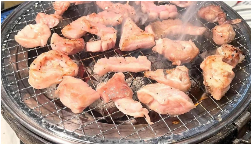
焼肉 ダイニング 萬次郎 comentario 7