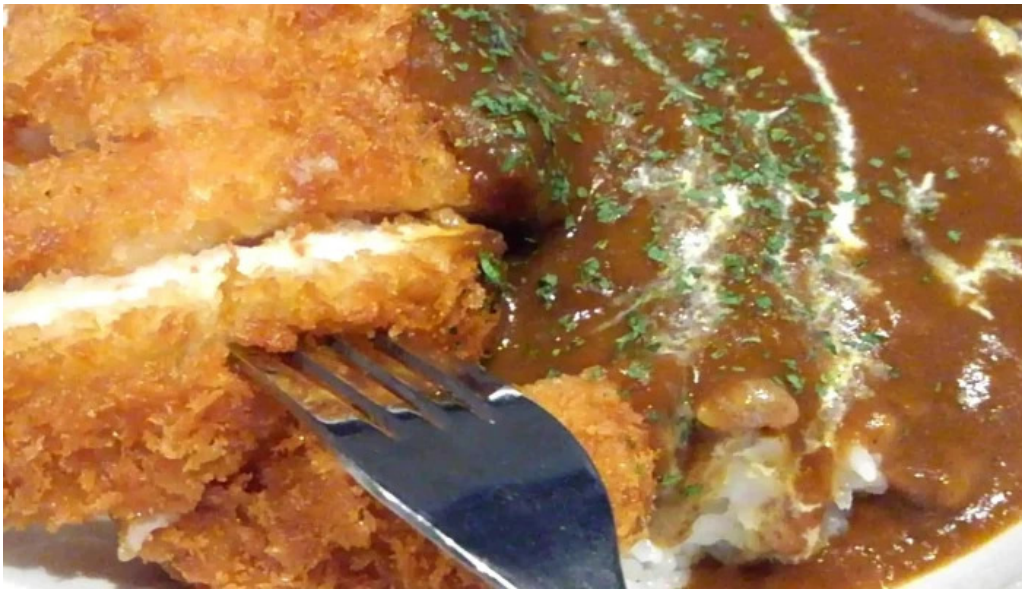
焼肉 ダイニング 萬次郎 comentario 9