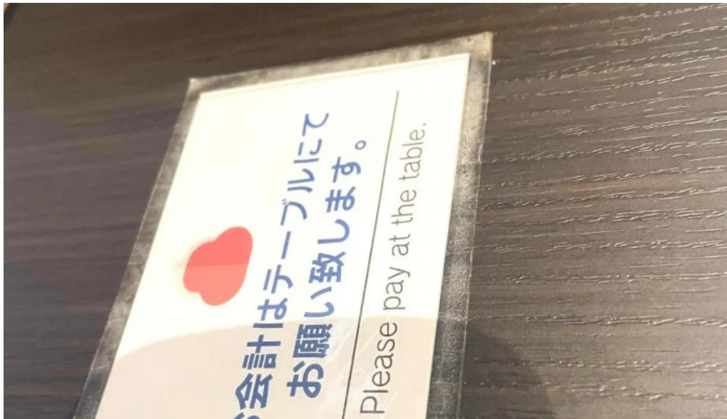
焼肉 ダイニング 萬次郎 comentario 8