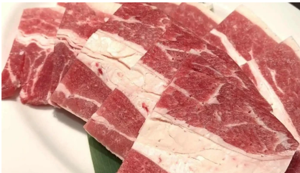
焼肉 ダイニング 萬次郎 料理飲み物