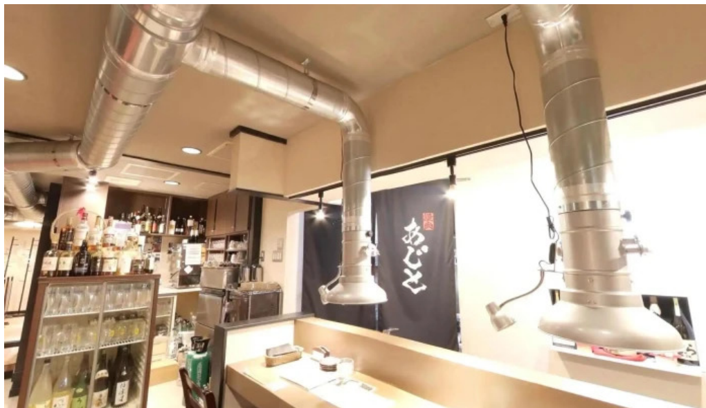
焼肉 あじと ストリートビューと 360 ビュー