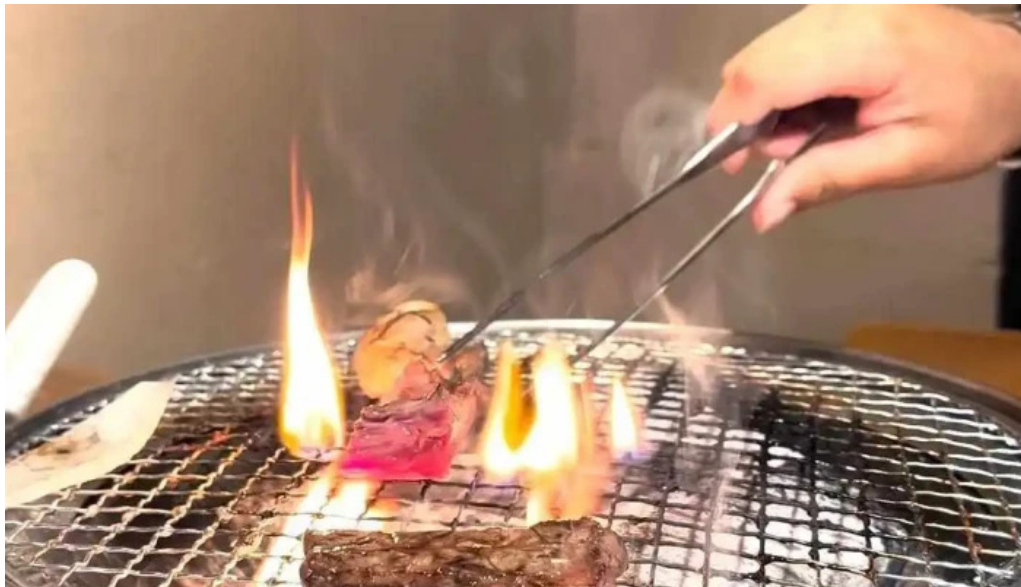
焼肉 あじと 動画