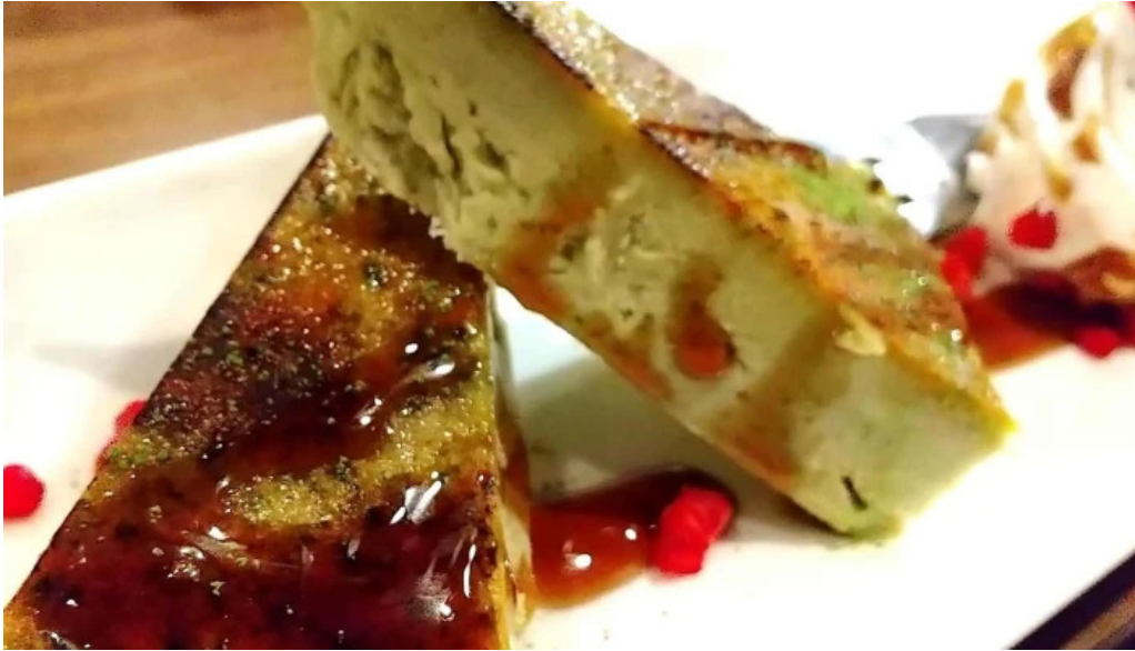
焼肉 あじと comentario 4