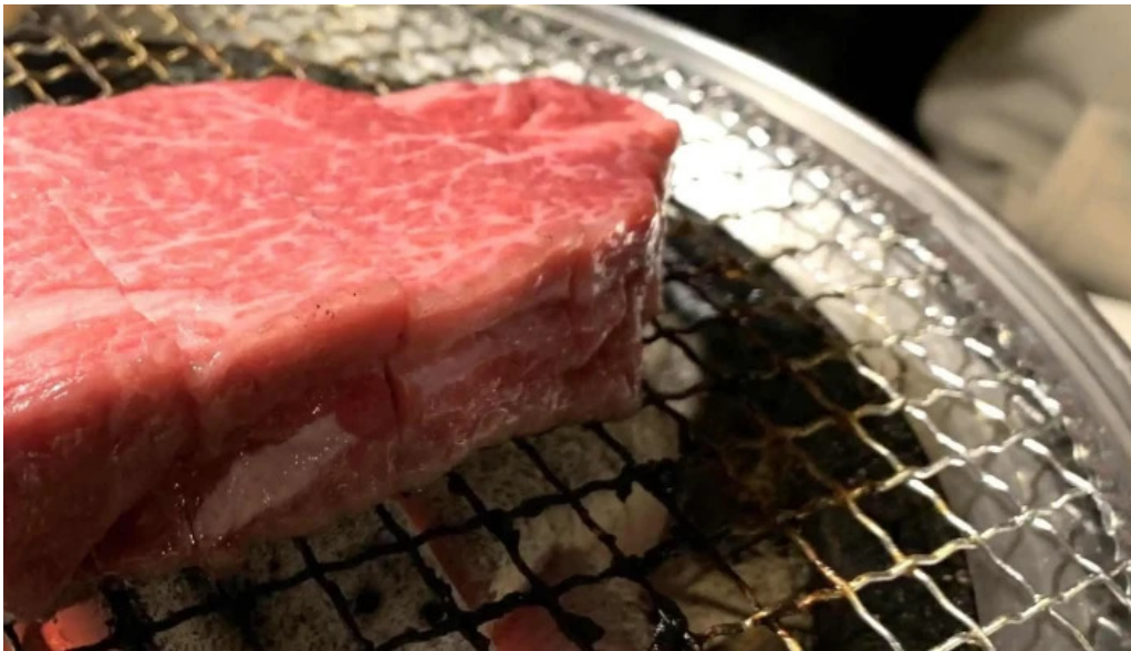
焼肉 あじと comentario 7