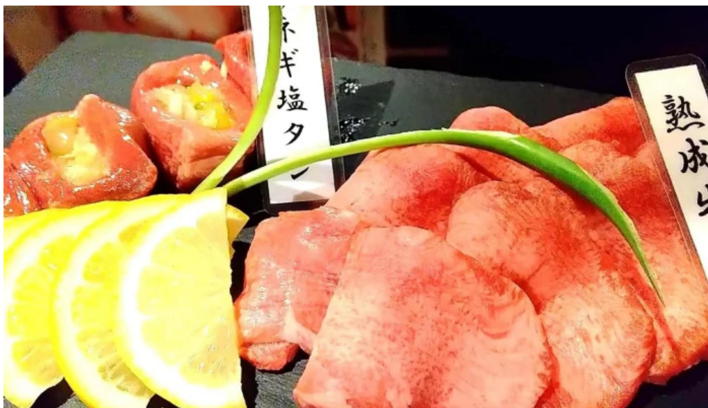
焼肉 あじと comentario 2