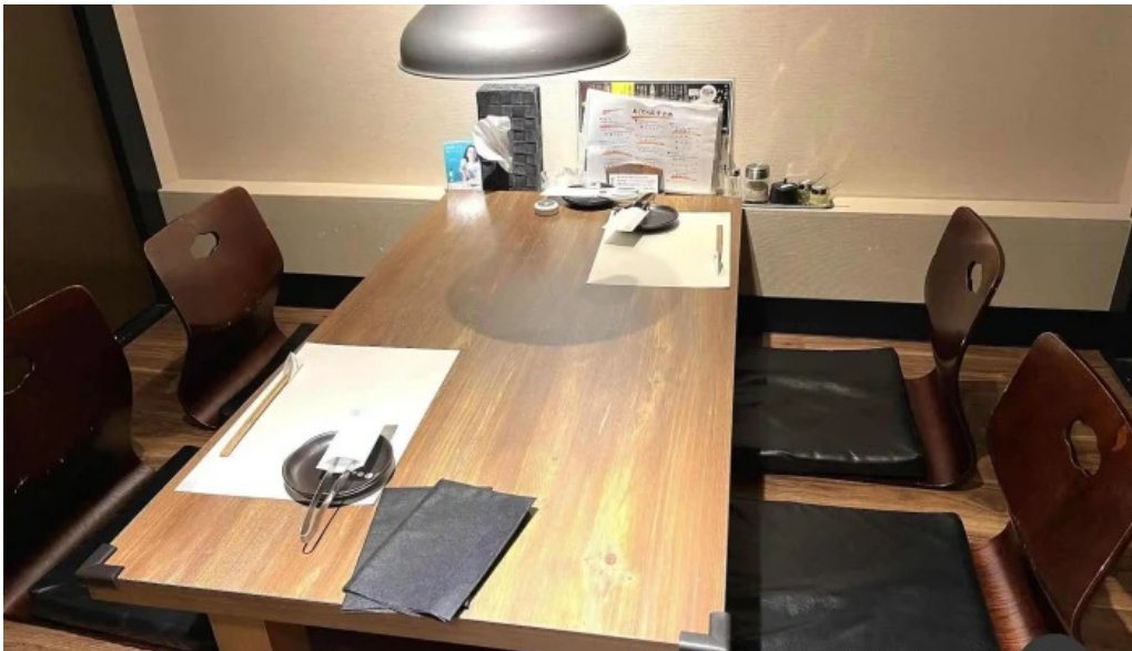
焼肉 あじと すべて