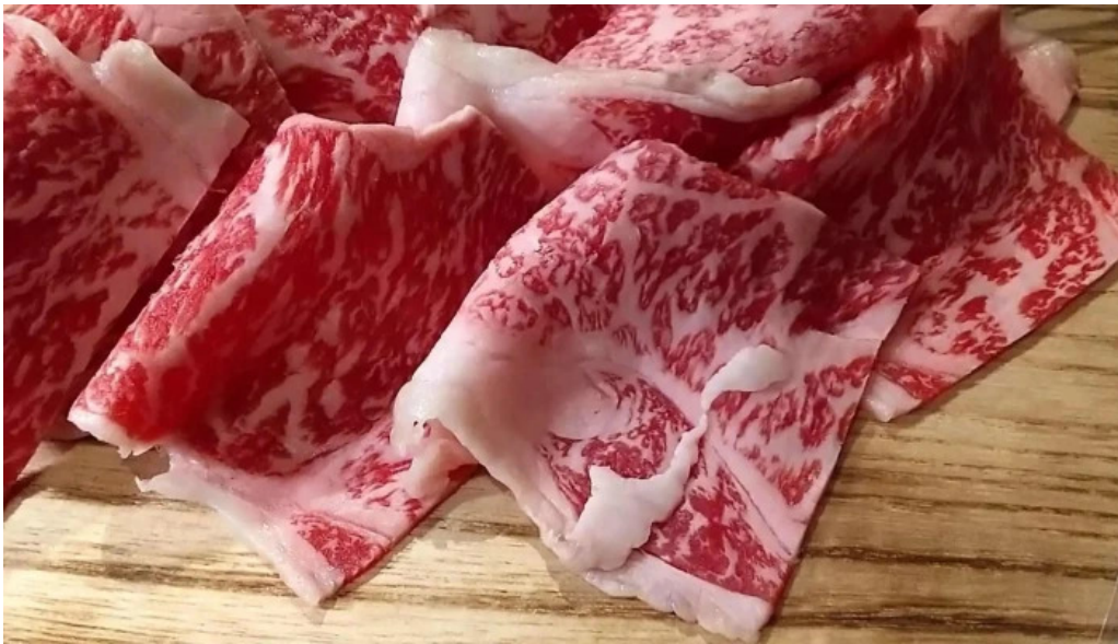
焼肉 あじと comentario 3