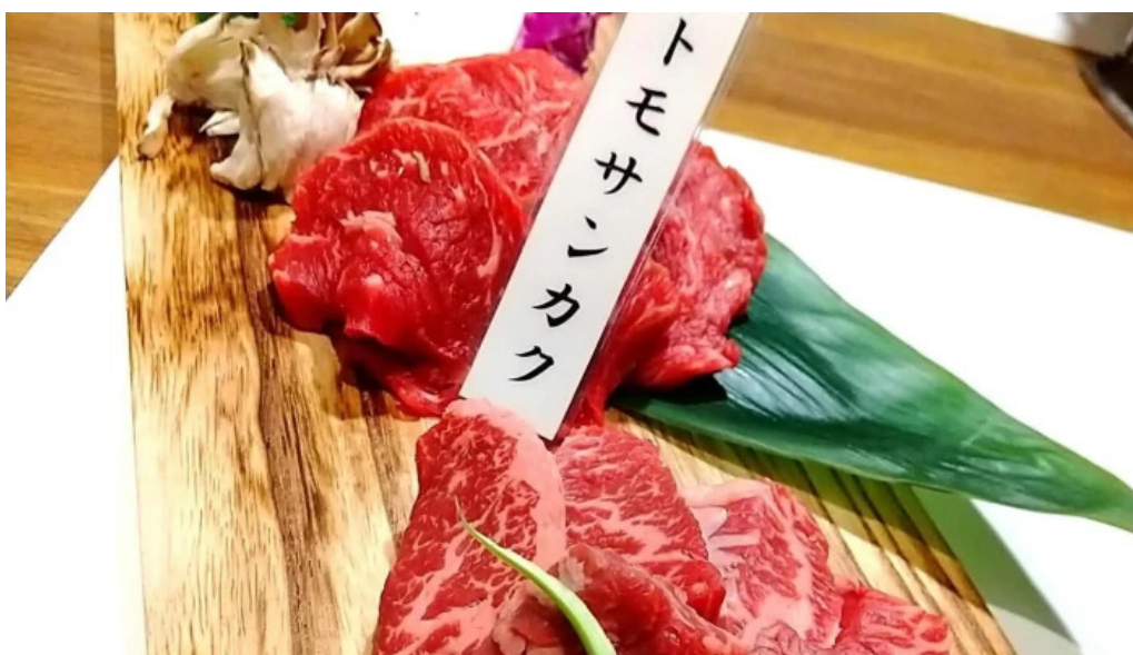
焼肉 あじと comentario 1