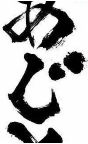
焼肉 あじと オーナー提供