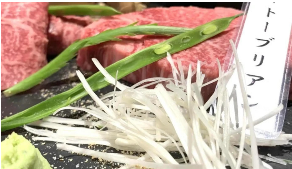
焼肉 あじと comentario 5