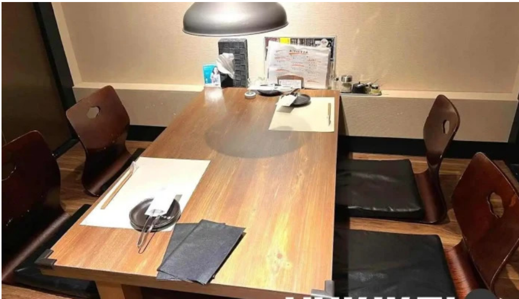
焼肉 あじと 網走市