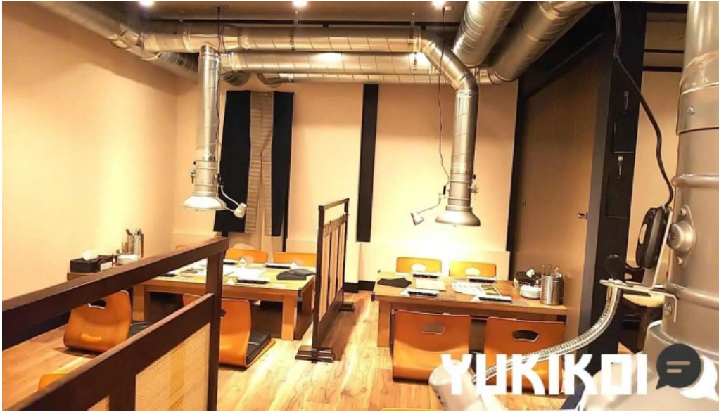
焼肉 あじと 霧圀気