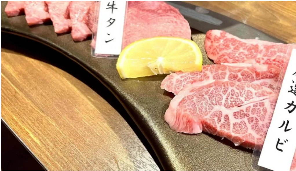
焼肉 あじと comentario 8