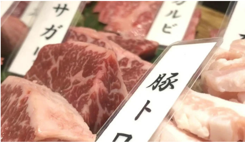
焼肉 あじと comentario 6