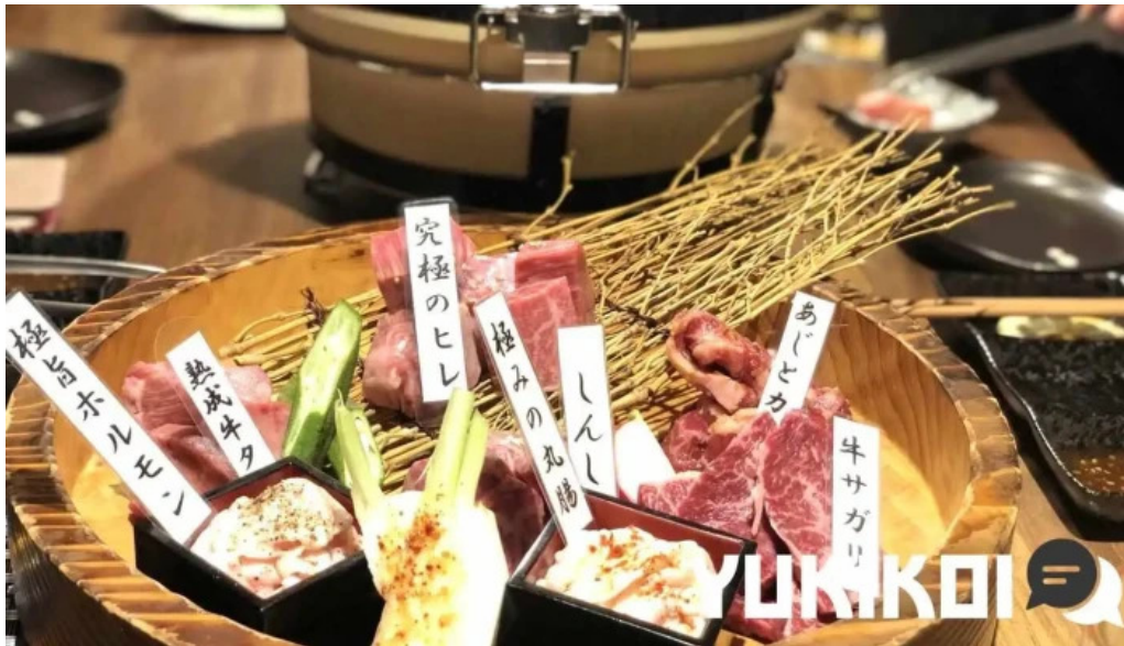
焼肉 あじと 料理飲み物