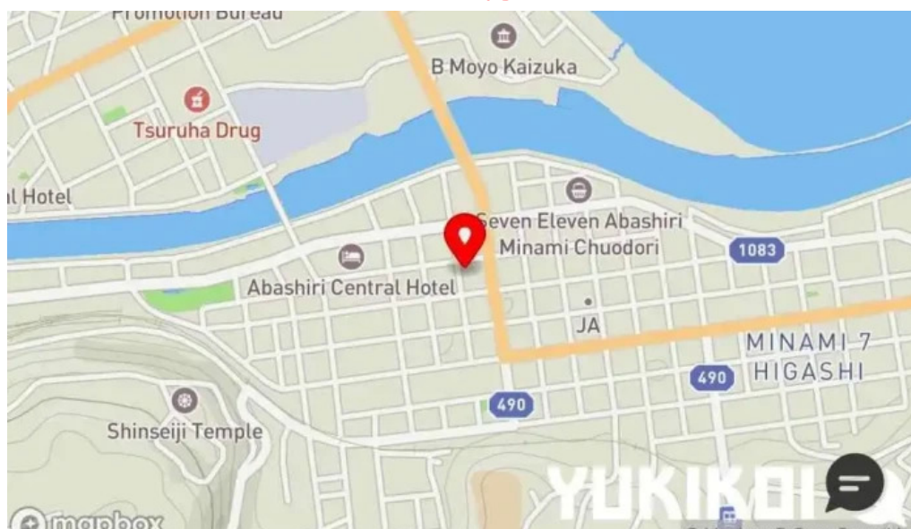
炭火ダイニング 輪地図