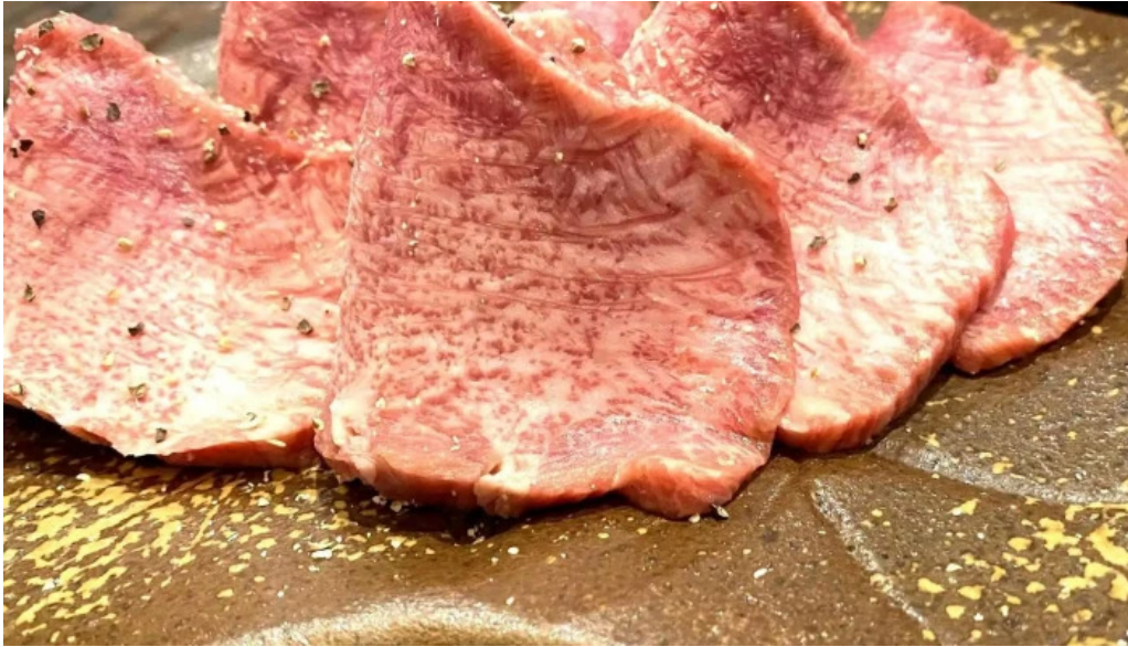
炭火ダイニング 輪 comentario 8