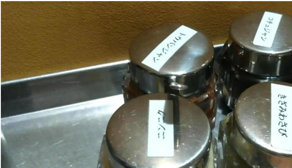
炭火ダイニング 輪 comentario 4