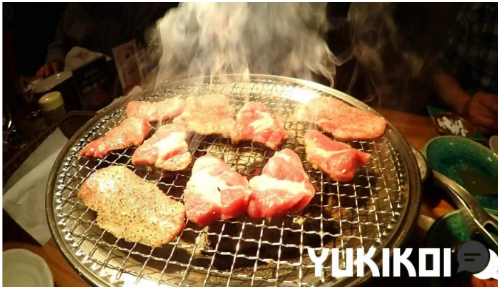
炭火ダイニング 輪 バーベキュー