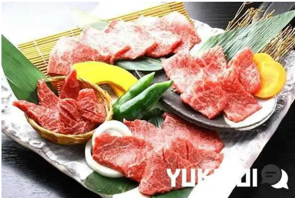
炭火ダイニング 輪 料理飲み物