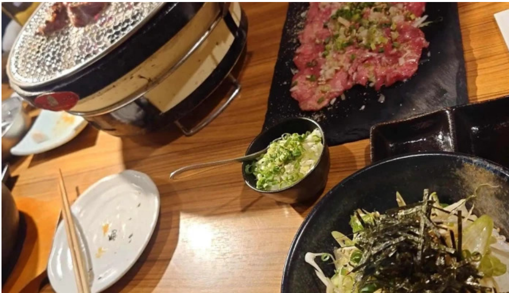
炭火ダイニング 輪 comentario 5