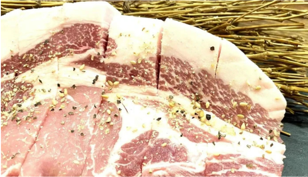
炭火ダイニング 輪 comentario 6