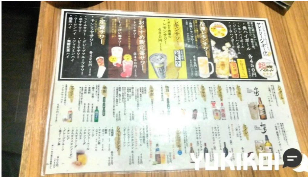
炭火ダイニング 輪 メニュー