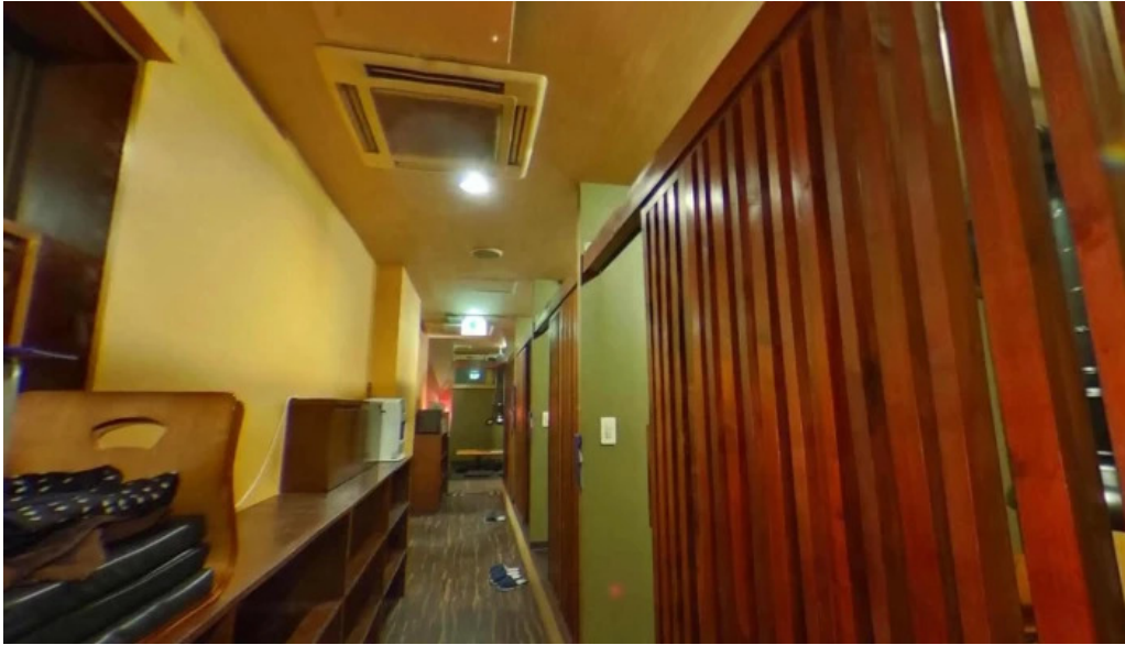
炭火ダイニング 輪 ストリートビューと 360 ビュー