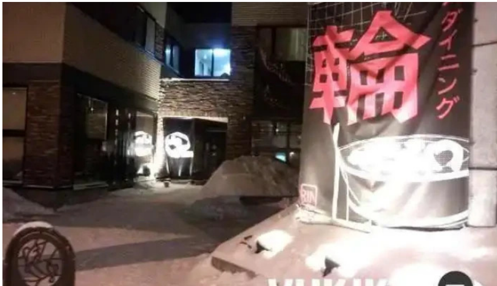
炭火ダイニング 輪 網走市