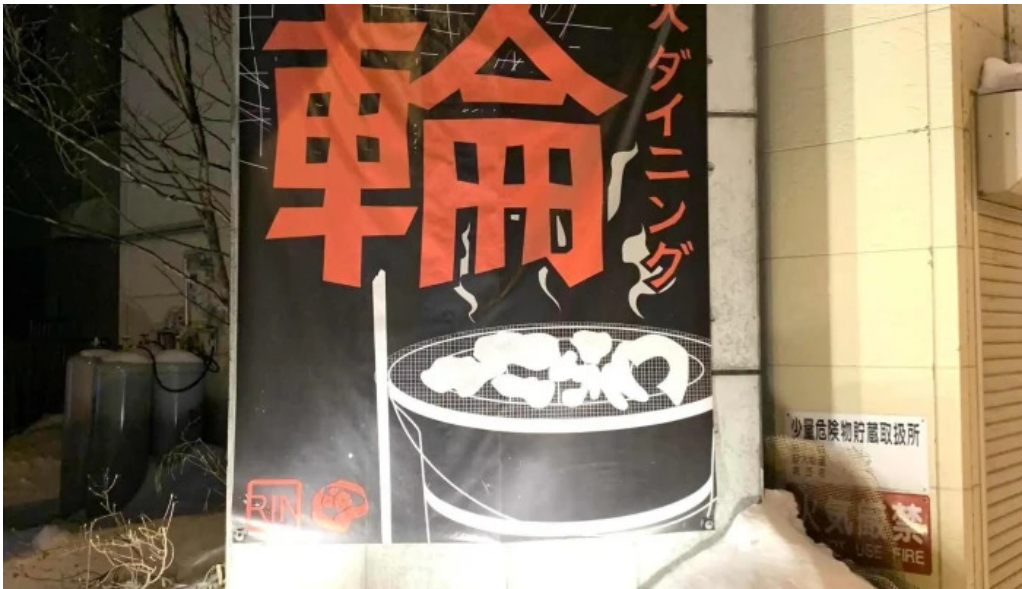
炭火ダイニング 輪 comentario 9