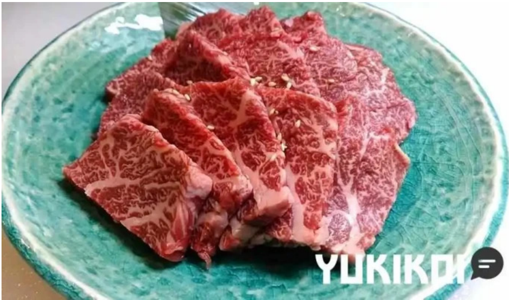
炭火ダイニング 輪 オーナー提供