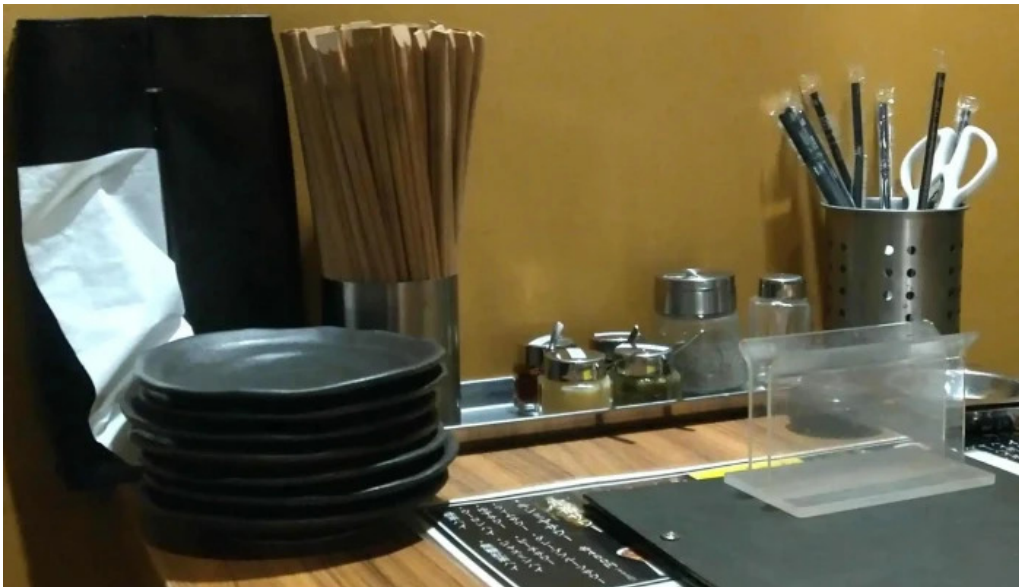
炭火ダイニング 輪 comentario 3