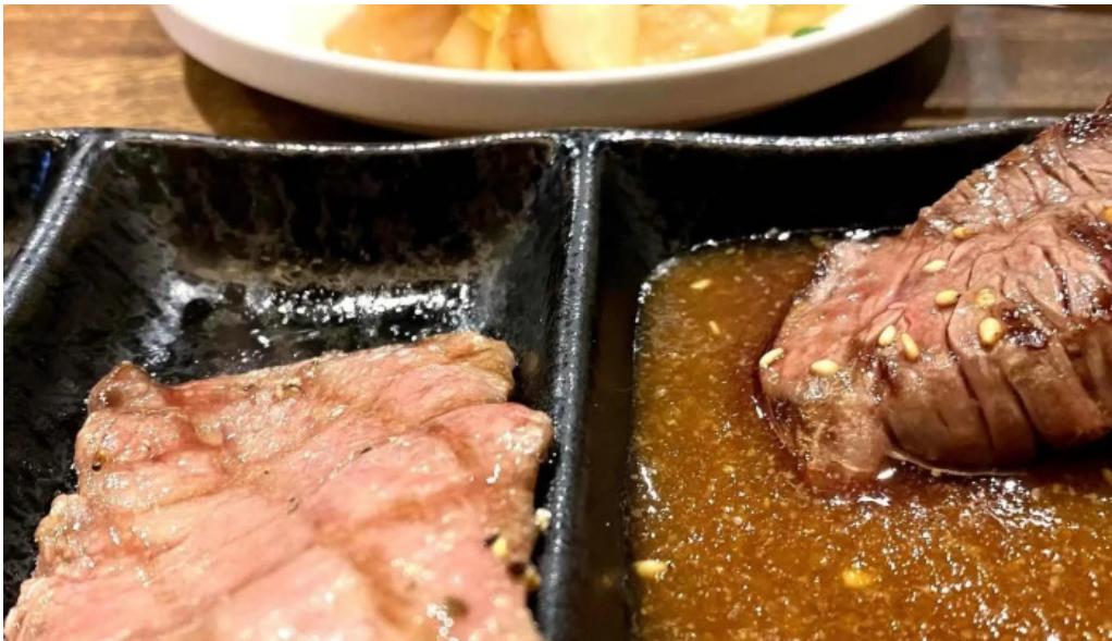
炭火ダイニング 輪 comentario 7