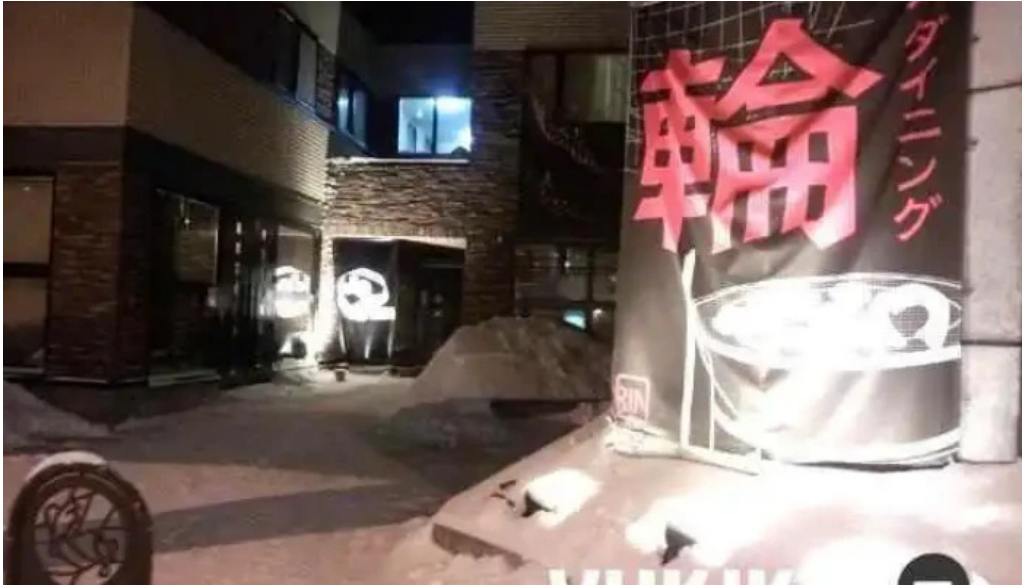
炭火ダイニング 輪 すべて