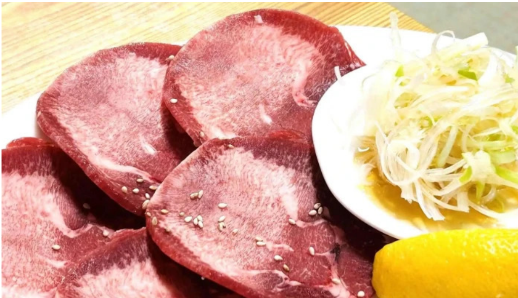
大昌園 comentario 6