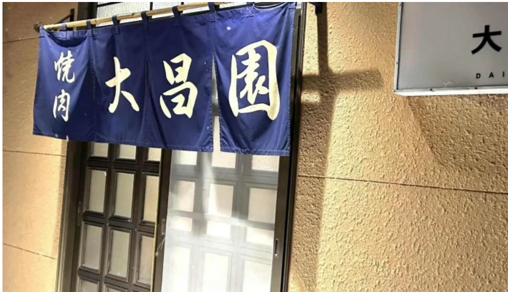
大昌園 comentario 8