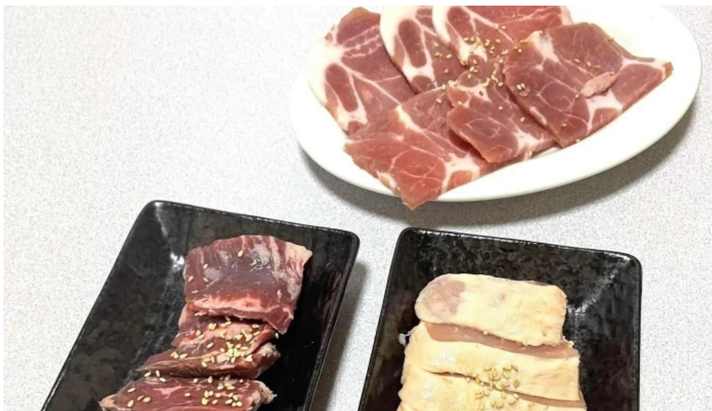
大昌園 comentario 1