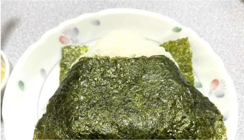
大昌園 comentario 3