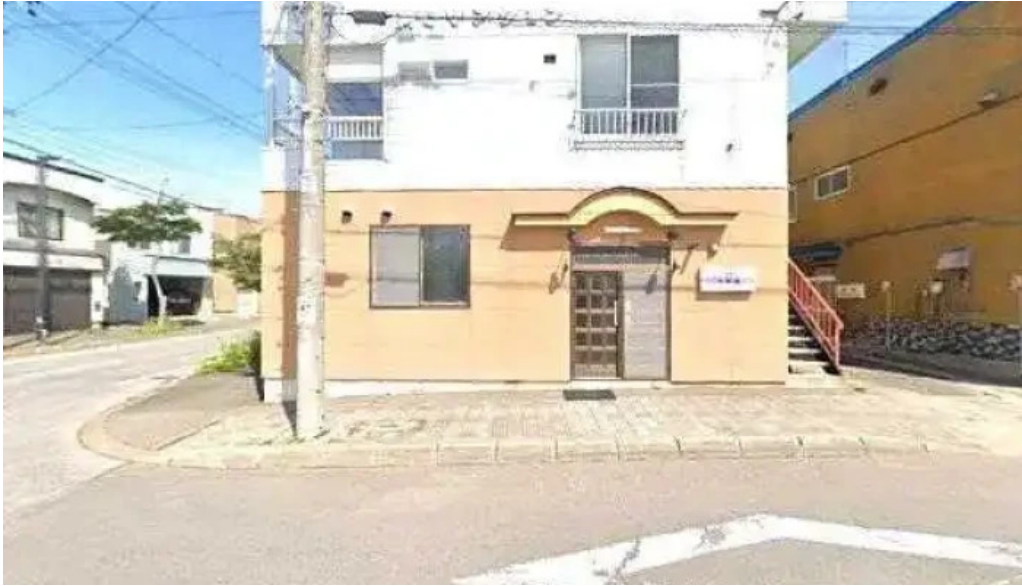
大昌園 ストリートビューと 360 ビュー