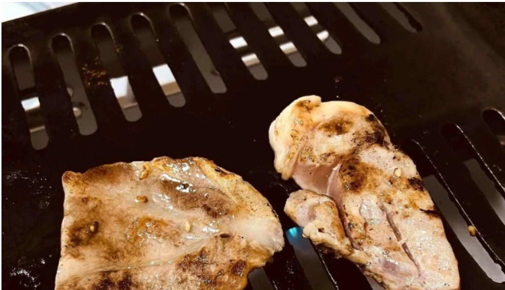
大昌園 comentario 4