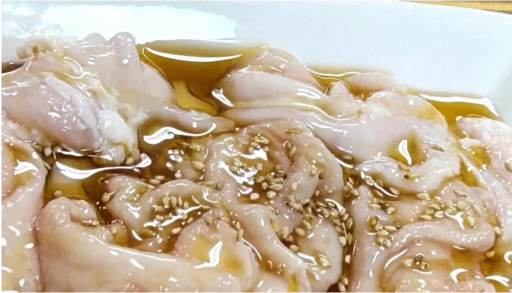
大昌園 comentario 7