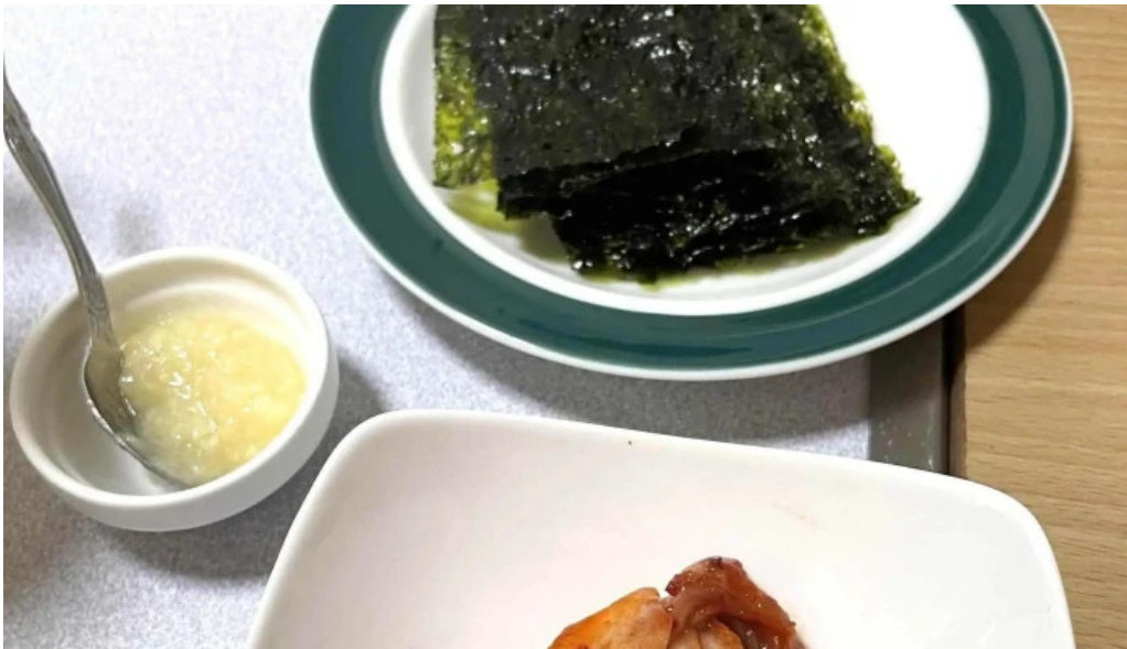
大昌園 comentario 2