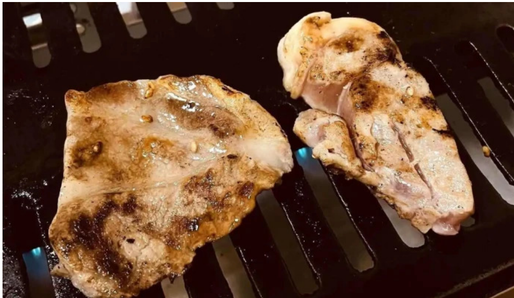
大昌園 バーベキュー