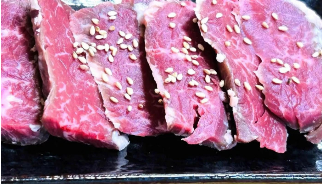
大昌園 comentario 5